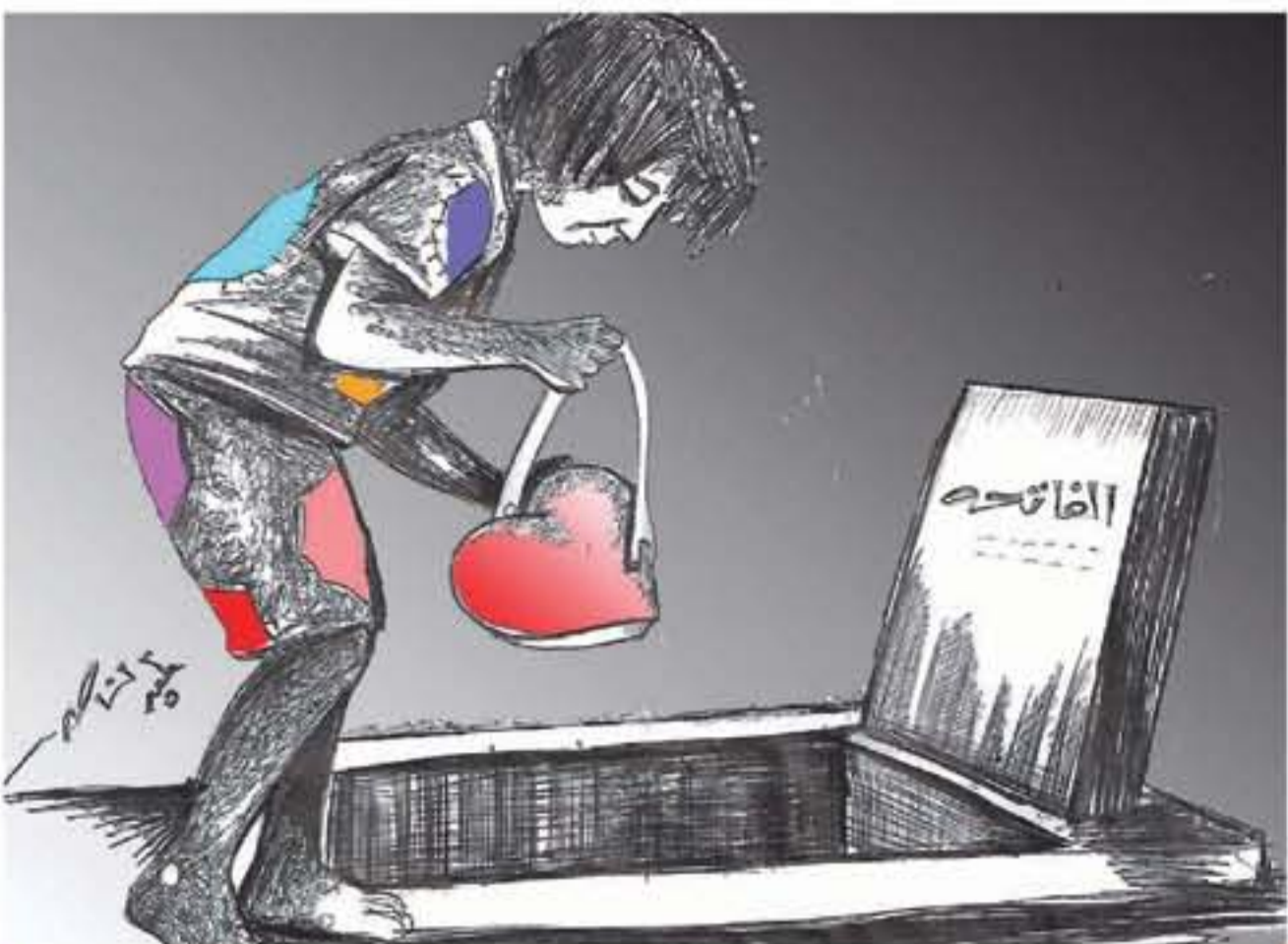
على عمر التطوير السورى هو اميرالبي