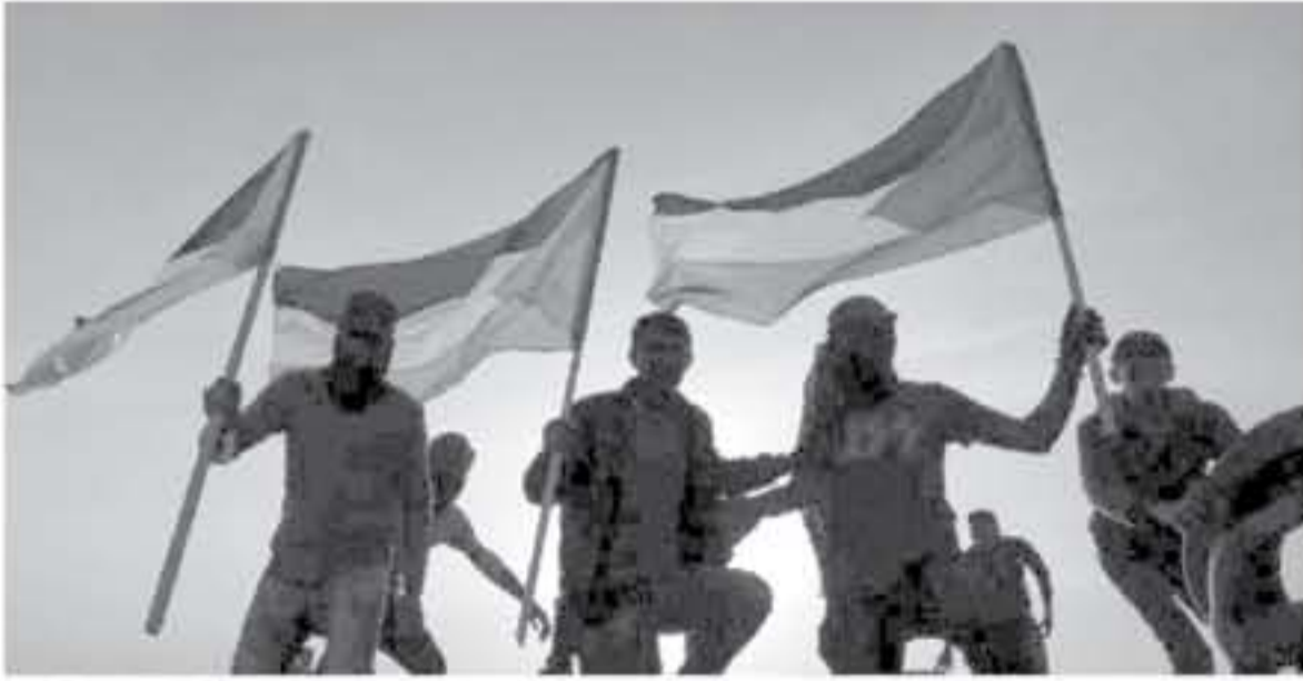
رفع العلم الفلسطيني