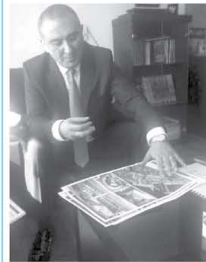
العقبه - الأنباط - خليل الفريايه