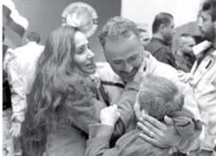
صورة وزعتها وكالة الأنباء السورية الرسمية 'سانا' في التاسع من نيسان/أبريل لتفاءل عائلة بعد الإفراج عن أفرادها كانوا محتجزين لدى جيش الإسلام في دوما

على وجهها، ثم قبل عينها ورأسها، وقال لفرانس برس 'لا أصعب حتى اللحظة التي أرى أختي حملت كثيراً بهذه اللحظة، والان تحقق الحلم، ووجدتني على قدميها ثانية أم'