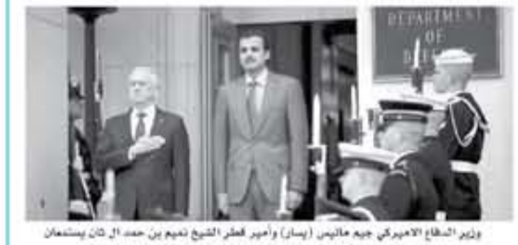
وزير الدفاع الأمريكي جيم ماتيس (يسار) وأمبر طغرال الشيخ مدير من عهد إيلداز بيشينان في التيد، الوزير الوطني الأمريكي في البنتاغون في واشنطن في ٩ نيسان/أبريل ٢٠١٨