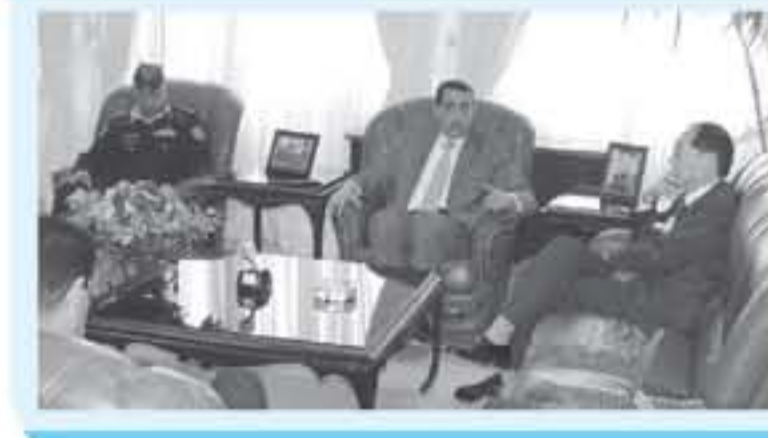
الاجتماع بين المسؤولين في الوزارة والقطاع الخاص...