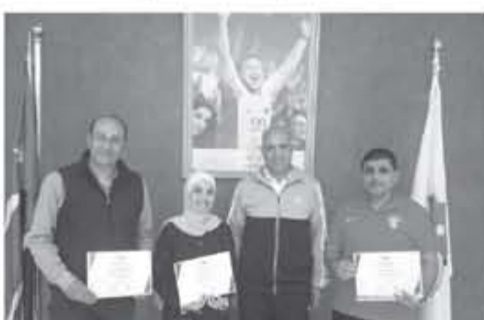
موقعه الخاص للمسؤول عنها. كما اوضح ماؤس بأنها تمثل الاتحاد الرئيسي لتمثيل...