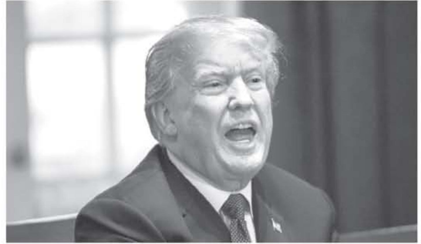
الوزير الأميركي جون كيري يتحدث للصحفيين في واشنطن، 11 تموز/أيار 2013.

شهد فرانسيس كيري وزير الخارجية الأميركي في واشنطن، الثلاثاء، استتفاً دولياً واسعاً، بعد أن كشف عن قيام سوريا بحملة كيميائية في حلب، مما أثار غضباً دولياً واسعاً. وقال كيري: "لقد شاهدنا دليلاً قاطعاً على قيام سوريا بحملة كيميائية في حلب، مما أثار غضباً دولياً واسعاً".