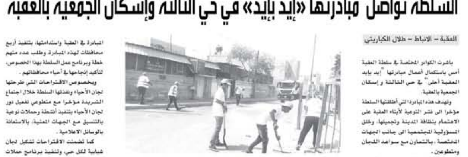
العقبة - الإنباط - ظلال الكباريتي

بشرت القوارب المختصة في سلطة العقبة أسس باستكمال أعمال مبادرتها «إيد بايد» الجمعية «أيد» في حي الثالثة وإسكان الجمعية بالعقبة... (The rest of the article text follows.)