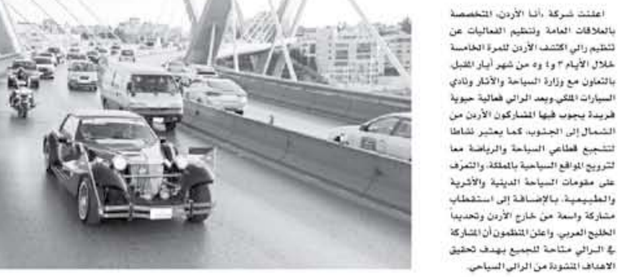
عمان - الأنباط