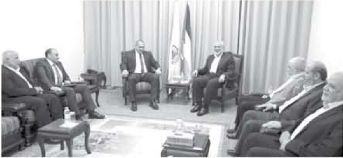
هيئة الوفد المصري جراه الحصار الإسرائيلي المستمر منذ نحو 11 عامًا، إضافة إلى استمرار العدوان التي يفرضها حياض من قراية العام عليه

الوفد الذي وقعت عليه حركة حماس وفتح في القاهرة، وكان مصغر مسؤولين في حماس قال قبل أيام إن "الصاحبة لم تعد قادرة" ولا يمكن الاستمرار فيها "وق الطرفية التي يبردها الرئيس محمود عباس والتي قلقتها بإفهامه". وقال مصدر مطلع وكالة "سفا" إن الاجتماع استمر على مدار خمس ساعات ويحتد عدة قضايا مهمة.