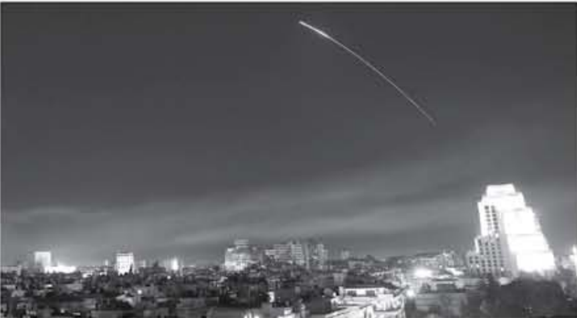
الضربات السورية لتصدي للصواريخ الأمريكية