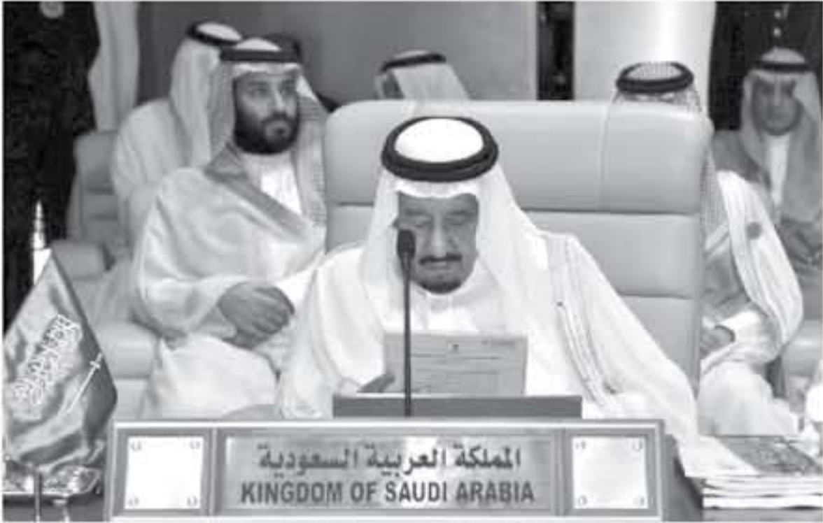
المعلق السعودي الملك سلمان بن عبد العزيز لدى افتتاح القمة العربية في الظهران بشرق السعودية في ٢٩ نيسان/أبريل ٢٠١٨.

والدولة العربية ولا سيما في مواجهة إيران، وعرضها الأفريقي المشترك، والمتعلق لا تقبلان علاقات دبلوماسية. - استعادة زمام الموقف في سوريا - لم يتطرق الملك سلمان في كلمته إلى النزاع السوري، بعد يومين من الضربات العربية على سوريا التي جرت على هجوم كيميائي مفرط ضحك متلفظه في مدينة دوما وتسبق قبل أسبوعين بمقتل أكثر من أربعين شخصاً وفق مسؤولين أسياس.