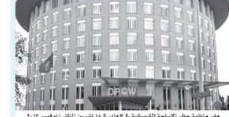
مقر منظمة حظر الأسلحة الكيميائية في لاهاي في ١٥ تشرين الثاني/نوفمبر ٢٠١٣.

تبدأ بعثة منظمة حظر الأسلحة الكيميائية عملها في مدينة دوما لتتحقق في تقارير عن هجوم كيميائي متفرص ألهمت دمشق بتخليده، وشدت دول عربية على الخرد عوائل ضحايا غير مسبوقة ضد أهداف عسكرية لتتطرق قرب العاصمة وبسط سوريا. وبعد ساعات من عدوان الولايات المتحدة وفرنسا وبريطانيا عبرت ثلاث مواقع يشتبه أنها مرتبطة ببرنامح السلاح الكيميائي السوري، نفذت الدول الثلاث بتسرع قرار مجلس الأمن بتدشين إنشاء آلية تحقيق جديدة حول الانتهاكات الكيميائية.