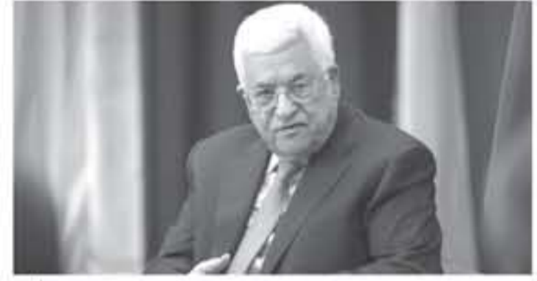
الواحد والملاخ الشرعي الواحد. وأضاف «ذلك هذا هو موقف إمامنا

كما اعتمدت أي إنهاء الاحتلال الذي بدأ عام ١٩٧٧ وإقامة دولة فلسطينية عاصمتها القدس، لتتمثل جنباً إلى جنب مع إسرائيل.