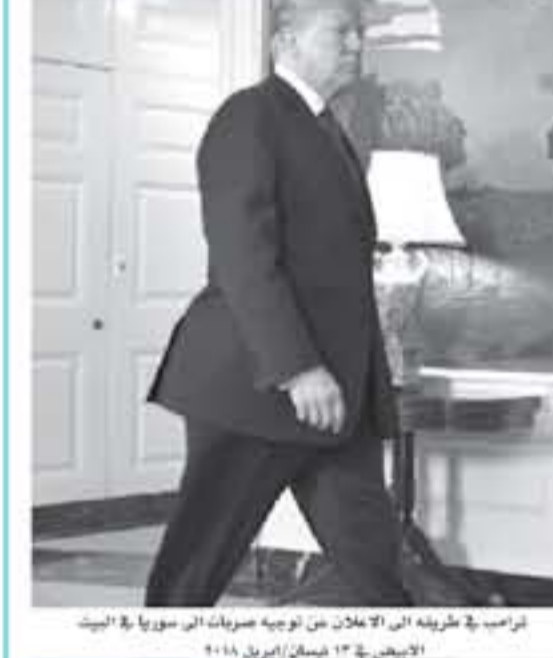
تراهب في طريقه إلى البرلمان من أوجبة ضربات سوريا في البيت الأبيض في ١٣ نيسان/أبريل ٢٠١٨.

تابع الرئيس الأميركي دونالد ترامب أمس الأحد عن استخدام عبارة «المهمة أنجزت» عقب الضربة التي نفذتها بلاده وفرنسا وبريطانيا على سوريا بعد الهجوم الكيميائي المزعوم على الغوطة الشرقية.