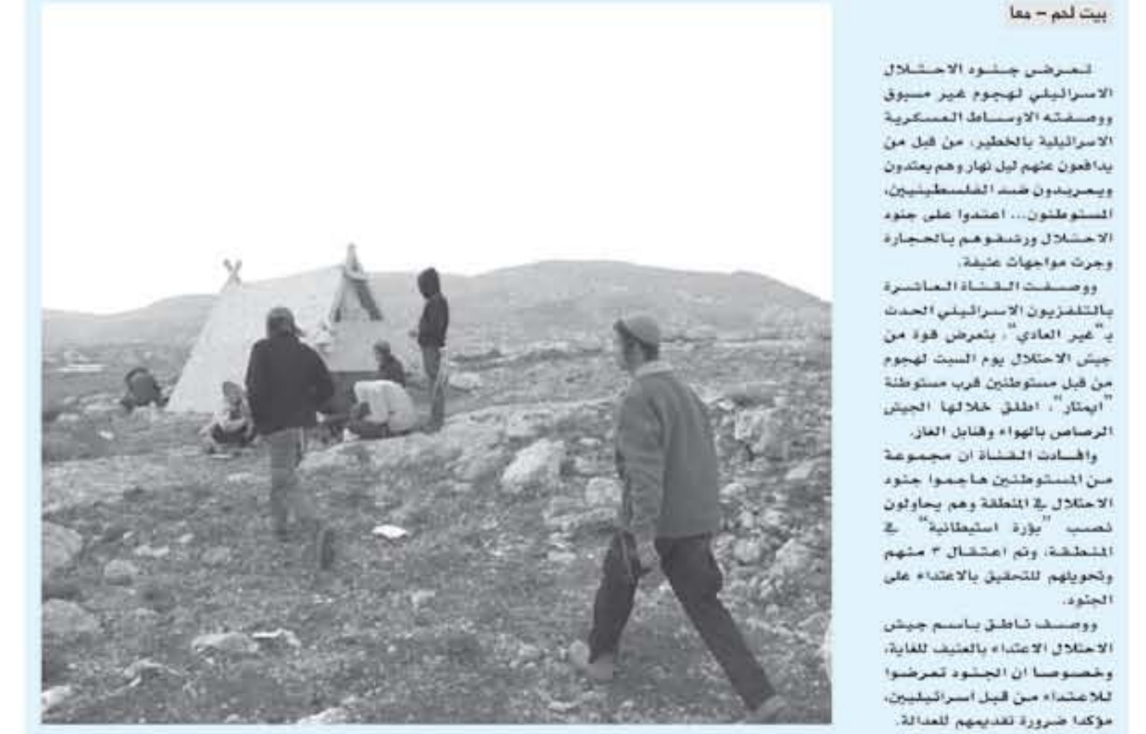
العنف ضد جنود الاحتلال من قبل المستوطنين، إضافة إلى إمكانية توسيع وضع مجموعات معينة من المستوطنين المتطرفين على الأراضي.