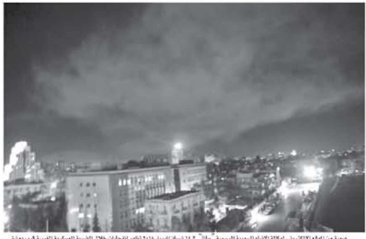
صورة من الموقع الإلكتروني لوكالة الأنباء السورية الرسمية "سانا" ١١ نيسان/أبريل ٢٠١٨ تظهر انفجارات خلال الضربة العسكرية الغربية قرب دمشق.

أكدت أن قواتها لا تقوم بأي عمليات عسكرية في المنطقة. وكانت دمشق ألهمت إسرائيل في التاسع من نيسان/أبريل بشن غارة صاروخية استهدفت مطار الشعيرات العسكري في محافظة حمص.