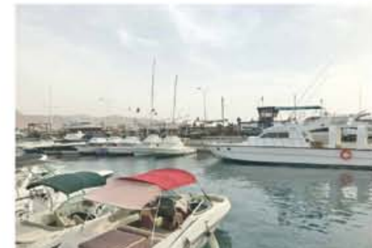
العقبة - الأناضول - خليل الخرابية

وأضاف ماضي ان السلطة وبالتنسيق مع الجهات المعنية قامت بتوفير كافة الاجراءات التي من شأنها تسهيل دخول اليخايرة وخروجها من وإلى المملكة واستضافة ركابها وتوفير كافة التغطيات الأساسية للسائح في مدينة العقبة، مؤكداً ان وصول الاف السياح عن طريق اليواخر منذ بداية العام عمل على تحريك الواقع الاقتصادي في العقبة، واسهم بشكل كبير في الترويج والتعريف بالمنتج السياحي الأردني الفريد من نوعه في المنطقة. وبين ان السلطة تحطمت لإنشاء مرافق السفن السياحية عبر تجهيز البنية التحتية في ميناء العقبة لاستقبال أكبر عدد من اليواخر، التي لوحظ مؤخرًا ازدياد أعدادها بشكل كبير.