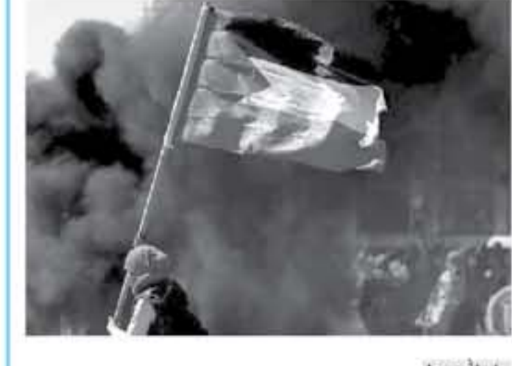
رام الله - صفا

وتتطرق إلى التصريحات على الأرجح على تشوير حماية فورية لتقديم أمنها محاولة لتطويق الأجزاء قبل قمة تراهب، الرابطة مع كيم والتي أعلن الرئيس الأميركي أنها ستجري "خلال الأسابيع الثلاثة أو الأربعة المقبلة"، وتمهد تراهب بتقديم "خدمة كبيرة لتعام" بأسرع غير أرباق اتفاق فوجي مع النظام الكوري الشمالي خلال تجمع في ولاية ميشيغان جرى وسط هتافات "أوبلا، أوبلا، أوبلا".