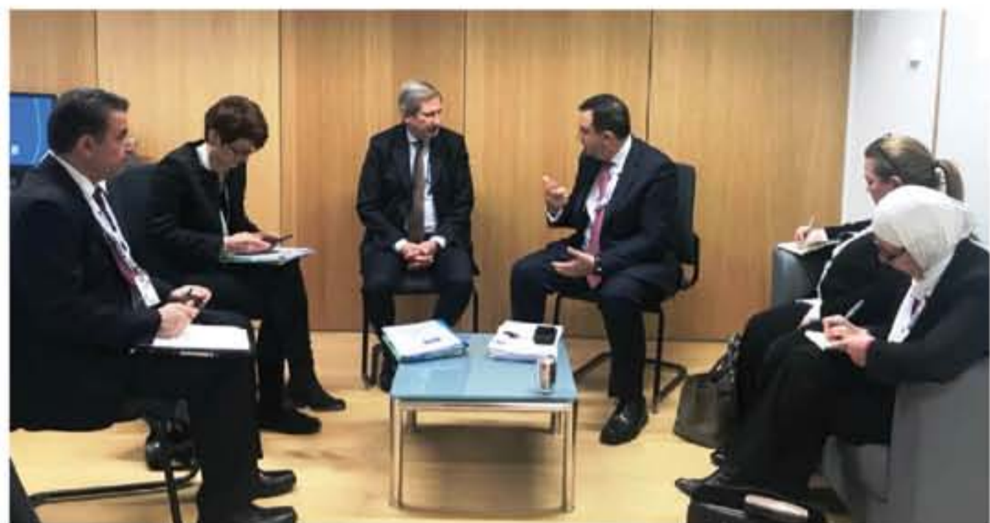
عنان - بتر