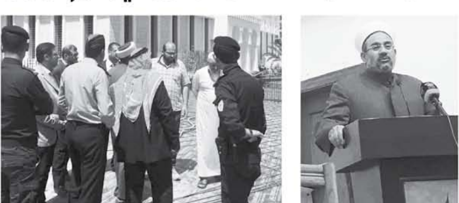
العقبة - الإنباط - خليل الفزاية

افتتح وزير الأوقاف والشؤون والمؤسسات الإسلامية الدكتور عبد الناصر أبو البصل أمس الأول في العقبة معسكرات الأئمة والمؤذنين في إقليم الجنوب وبمشاركة 16 إماماً ومؤذناً من مختلف مديريات الأوقاف في محافظت جنوب المملكة.