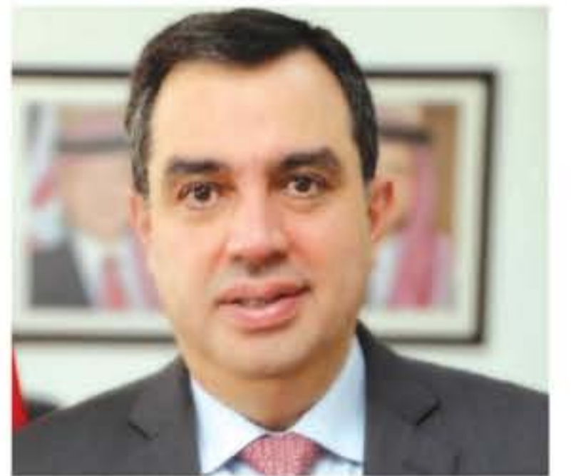
عمان - الأناضول - قصي آدم

استعانة عنق الزجاجة إلى خمس سنوات قادمة، وللطرفة فإن الوزيرين قالوا ذلك في محفلين مختلفين الأول محلي، حيث بشر نائب رئيس الوزراء للشؤون الاقتصادية جعفر حسان الشعب الأردني على الشاشنة الرسمية بسلووت نظرية الخروج من عنق الزجاجة في العام 2019، فيما