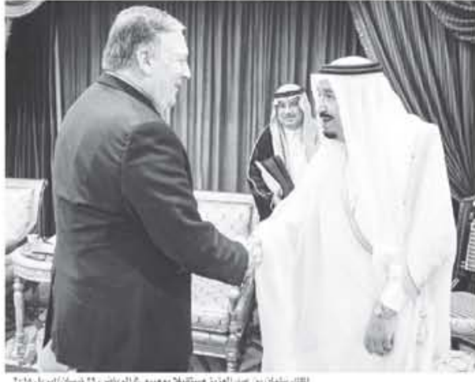
بيبي اغا مع الرئيس سلاطين

بوتون لشكة فوكس نيوز امس الأحد ان تراهب لم يخلد فرارا بعد ما اذا كان سيسحب من الاتفاق النووي الإيراني ام لا، واقتصر مهمة بومبيو الذي باشر العمل فور اداء اليمين الثلاثة كوزير للخارجية، بمهمة ثانية ذات طابع شخصي، إذ يعتزم ان يبتد لتفاوض الأجنبة اسرائيل، بهدف حشد عضوا وإطلاق حلفاء واشتغل على موقف الرئيس الأميركي إزاء الاتفاق النووي الإيراني.