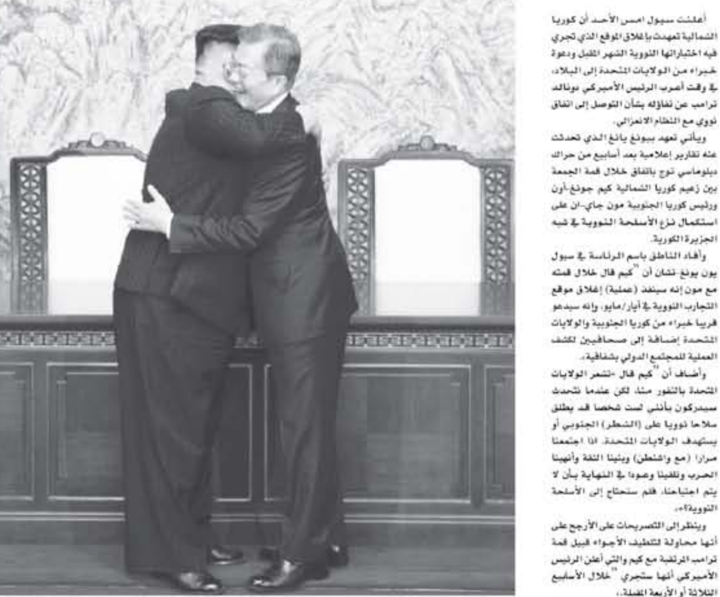
الرئيس الكوري الجنوبي مون جاي ان (يمين) والرئيس الكوري الشمالي كيم جونج اون في ختام قمة تاريخية في بانغجو، الجمعة ٢٩ نيسان/أبريل ٢٠١٨

أعلنت سيول امس الأحد أن كوريا الشمالية تهدت بإغلاق الموقع الذي تجري فيه اختباراتها النووية الشهر المقبل وعودة خبراء من الولايات المتحدة إلى البلاد، في وقت أصعب للرئيس الأميركي دونالد تراهب من لقاءه بشأن التوصل إلى اتفاق نووي مع النظام الكوري الشمالي، ويأتي تعهد بونغ يانغ الذي تحدثت عنه تقارير إعلامية بعد أسابيع من حراك بومبيو لتوج بالاتفاق خلال قمة الجمعة بين زعيم كوريا الشمالية كيم جونج أون ورئيس كوريا الجنوبية مون جاي ان على استعمال ذراع الأسلحة النووية في شبه الجزيرة الكورية.