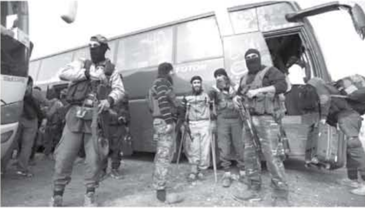
وعائلاتهم لدى وصولهم منطقة العيس بريف حلب بعد إجلائهم من مخيم اليرموك بجنوب دمشق في الأول من أيار/مايو ٢٠١٨