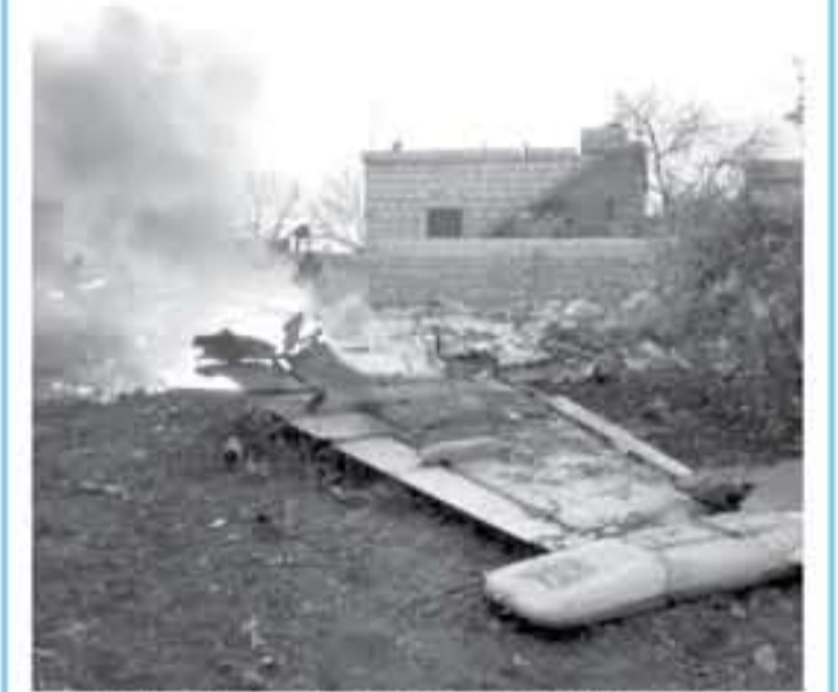
صورة من الأرشيف لواقع تحطم طائرة سوخوي-٢٥ في شمال غرب سوريا في ٢ شباط/فبراير.

وقالت السورازدة ان الطيارة لم تستعمل فيها التيران مضيفة انه "بحسب المعلومات الأولية فان سبب التحطم قد يكون دخول طائر إلى المحرك.. وبهذا الحادث ترقع خسائر الجيش الروسي الرسمية منذ بدء دخله في سوريا إلى ٨٦ قتيلاً. وكانت آخر خسائر الجيش حصلت حين تحطمت طائرة نقل على عيباتها في قاعدة حميميم في آذار/مارس ما أدى إلى مقتل كل ركابها الـ ٣٦. ويتواجد حوالي ثلاثة آلاف جندي روس في سوريا غالبيتهم في قاعدة حميميم في شمال غرب البلاد.