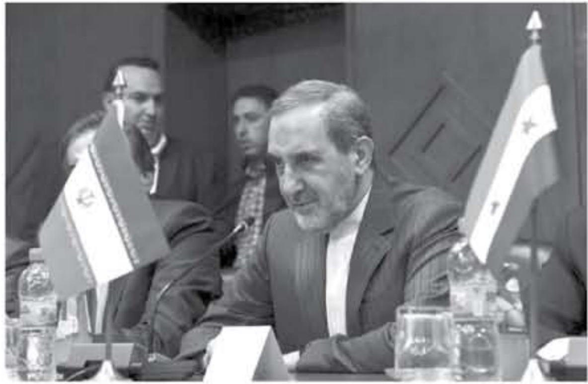
الكبرى (الولايات المتحدة وروسيا وبريطانيا وفرنسا والصين والمانيا) ناعيا إلى الخذلان لتدابير جديدة بحق طهران.

أعلن مستشار الرئيس الأعلى للجمهورية الإسلامية الإيرانية آية الله علي خامنئي للشؤون الخارجية أمس الخميس أن طهران "لن تبقى" في الاتفاق النووي في حال انسحبت الولايات المتحدة من الاتفاق. واتصفت منة، وهو ما يهدد الرئيس الأميركي دونالد ترامب بإعلانه في ١٢ أيار/مايو. وقال علي أكسير ولايتي في تصريحات نشرتها على موقع التلفزيون الرسمي الإيراني "في حال انسحبت الولايات المتحدة من الاتفاق النووي، فلن تبقى فيه نحن كذلك.. وأميل ترامب الأوروبيين حتى ١٢ أيار/مايو للتوصل إلى اتفاق جديد يصوب "الثغرات الرهيبة" الواردة في الاتفاق الموقع عام ٢٠١٥، بحسب قوله مهدداً بالانسحاب منه. وأكد الرئيس الفرنسي إيمانويل ماكرون الأربعاء من استراتيجيا التزام باريس بالاتفاق الذي يرفض قيودا على برنامج طهران النووي مقابل تخفيف العقوبات عليها. وصرح ماكرون "أريد أن أقول إنه مهما كان الشرار، علينا التحضير