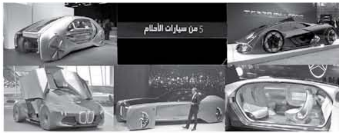
5 من سيارات الأعلام

سيارات الأعلام بالفضل. هذا الاسم الذي تستلمه هذه السيارات الاختبارية التي ستقدمها لك اليوم عزيزي القارئ فقبل بضعة عقود من الزمن كانت السيارات التجريبية أو ما يعرف بها (كوتسيبت) كانت عبارة عن تصاميم تخيلية يقدم من خلالها مصنع السيارات رؤيتهم للمستقبل ويستعرضون أحدث التقنيات المتطورة التي توصلت إليها مراكز البحث العلمي لديهم، إلا أن السيارات التجريبية اليوم أصبحت عملية أكثر، وأصبحت تصنع لقاية مختلفة حيث تقدم شركات السيارات هذه التصاميم التجريبية كنسخ تمهيدية قبل إطلاق السيارة الحقيقية في الأسواق، وتستفيد منها كمنهج أولية لتجربة الشركة لتصميمها وتقييم مدى قبول السيارة لدى القراء والجمهور، وغالباً ما تأتي السيارات الإنتاجية شبيهة إلى حد كبير بالتصاميم الاختبارية في نهاية المطاف.