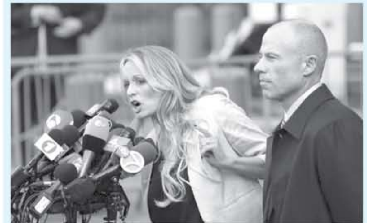
المثلة الاباحية ستيفاني كليفور المعروفة باسم ستورمي دانيالز تحدث امام محكمة فدراية في مانهاتن السفلى في نيويورك وجانيها محاميه مايل كوهين في ١٦ نيسان/أبريل ٢٠١٨

أعلن رئيس بلدية نيويورك السابق رودي جولياني الذي انضم حديثاً إلى الفريق القانوني لدونالد ترامب ان الرئيس الأميركي سدّد لهاميه الشخصي مايل كوهين، على دفعات، مبلغ ١٣٠ ألف دولار الذي دفعه كوهين للممثلة الاباحية ستورمي دانيالز مقابل التزامها الصمت بشأن علاقة جنسية تزعم حصولها بينها وبين المتبارير. ويمنح تصريح جولياني هنا نقاشاً مع ما رأب ترامب على قوله بشأن هذه القضية. فالرئيس الذي يقف القائمة اي علاقة بالمثلية واسمها الحقيقي ستيفاني كليفور، أنكر في البداية أي علم له بالاموال التي دفعها كوهين لها. ثم عاد وأكد الاسبوع الماضي ان محاميه ابرم صفقة معها بالنيابة عنه. وقال جولياني لشبكة فوكس نيوز "لقد دعوا انا من خلال شركة محاماة وسددها الرئيس.. واضاف "كانت لذلك مبالغ دفعها محاميه كما كنت سأفعل، من أموال شركته للمحاماة أو أية أموال اخرى لا بهم. وسدّد الرئيس ذلك المبلغ على مدى شهر عدة.. واضاف ان المبلغ لم يشكل انتهاكاً لتوانين تمويل الحملة الانتخابية لأنه "لم يكن من أموال الحملة.. وتم دفع المبلغ إلى دانيالز قبل أيام من الانتخابات الرئاسية التي فاز بها ترامب في تشرين الثاني/نوفمبر ٢٠١٦، وسرت والشاع بان كوهين ربما انتهك قانون تمويل الحملة الانتخابية لأن ذلك مثل مساهمة تهدف إلى منح الصحافة السلبية قبل الانتخابات. وفي حديث إلى مجلة نيويورك تايمز بعد قليل من ظهوره التلفزيوني، قال جولياني انه تحدث مع ترامب قبل وبعد الحديث مع فوكس نيوز، وأن الرئيس ومحاميه الآخرين يعلمون ما سيصرح به جولياني. وقال جولياني للصحيفة ان لديه