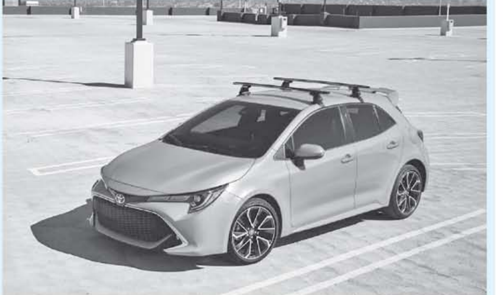
طوكيو - وكالات

تويوتا كورولا ٢٠١٩ الجديدة من تويوتا مائة TNGA الجديدة من تويوتا مائة كالمستخدم في كلا من شبكاتها تويوتا كامري و تويوتا C-HR و تويوتا بريوس. ميكانيكياً يرجح أن تعتمد كورولا ٢٠٢٠ القادمة على محرك ٤ سلتير سعة ١.٨ لتر، ولكن التفاصيل غامضة، وهناك معلومات غير رسمية تشير إلى أن كورولا القادمة قد تستفيد من الشراكة التي تجمع بين الصانع الياباني من ناحية والشركة اليابانية تويوتا من ناحية المحركات المستخدمة، وتلتمس أن يكون هذا صيحاً لأن ذلك سيساهم في نقل طراز تويوتا كورولا إلى مراحل أعلى. أما نسخة الهاتشباك من كورولا لتوفر خيار وحيد من محركات البنزين محرك ٤ سلتير سعة لترين، بدلاً من المحرك السابق ٤ سلتير سعة ١.٨ لتر، يتصل المحرك الجديد بصندوق تروس (جير) عادي من ٦ سرعات أو جير CVT، وحتى هذه اللحظة لا توجد معلومات عن الأرقام الصادرة عن هذا المحرك. حالاً يتوفر معلومات رسمية عن كورولا القادمة، ستزودكم بالتحصيل على الفور إن شاء الله.