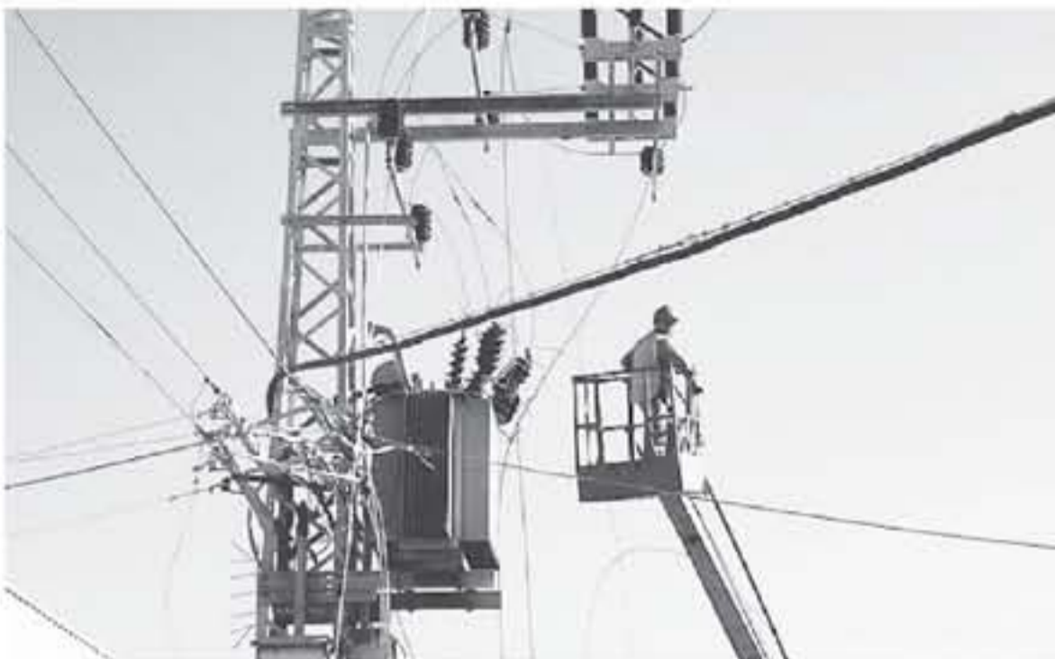
عمان - بتر

حيث حقق ما مقداره ٢٣ مليون دينار ونسبة ٧١,٩ بالمئة من حجم التداول الإجمالي وجاء في المرتبة الثانية قطاع الخدمات بحجم مقداره ١٧٨ مليون دينار ونسبة ١٧,٨ بالمئة، وأخيراً قطاع الصناعة بحجم مقداره ٢,٣ مليون دينار ونسبة ١,٣ بالمئة. أما عن مستويات الأسعار، فقد انخفض الرقم القياسي العام لأسعار الأسهم لإصلاص هذا الأسبوع إلى ١١٦٧ نقطة مقارنة مع ١١٦٥ نقطة للأسبوع السابق بانخفاض نسبته ١,٢٦ بالمئة. وعلى الصعيد القطاعي فقد انخفض الرقم القياسي للقطاع المالي بنسبة ١,٢٦ بالمئة، كما انخفض الرقم القياسي للقطاع الخدمات بنسبة ١,٣٢ بالمئة، في حين ارتفع الرقم القياسي للقطاع الصناعة بنسبة ١,٨١ بالمئة.