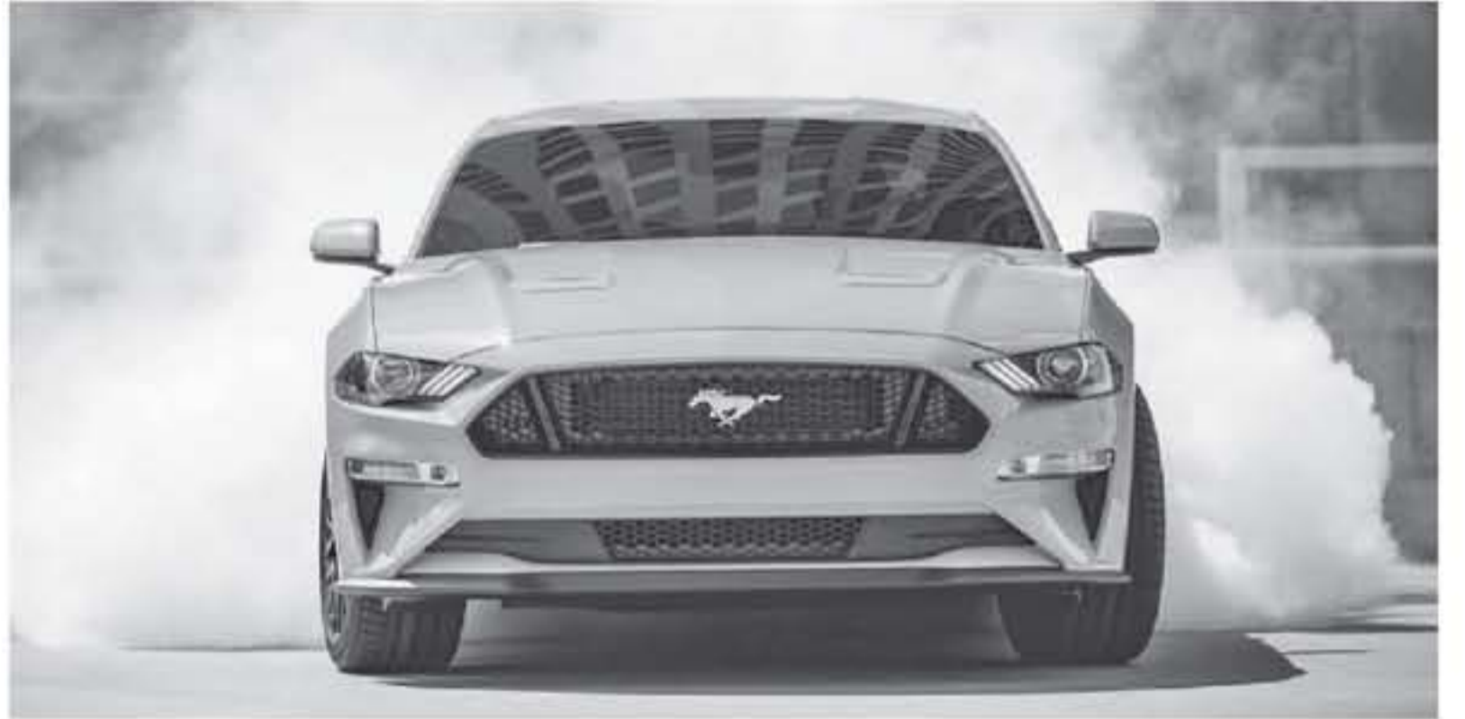
ميشيفان - وكالات

من سيارة فورد موستنج الهجينة. تفيد هذه المعلومات أن النسخة الهجينة من سيارة العضلات الأمريكية فورد موستنج ستعتمد على محركين ١ محرك إيكوبوست ٤ سلتير سعة ٢.٣ لتر يعمل على البنزين، يعمل إلى جانبه محرك كهربائي، ليولد المحركان معاً قوة تصل إلى ٤٠٠ حصان (٤٠٥ حصان أوروبي (PS) و ٥٤١ حصان فورد موستنج الهجينة القادمة. فبعد أن أكد الصانع الأمريكي فورد موستنج الهجينة، وأعلن أنها ستتملك قوة قريبة من قوة نسخها المزودة بمحرك V٨ سعة ٥ لتر، نشر موقع Motor Trend مؤخراً معلومات غير رسمية جديدة تتعلق بالأرقام الصادرة