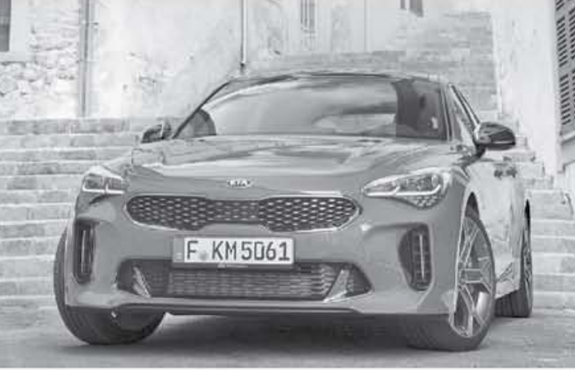
ميلان - وكالات

ولكن وللأسف لم تشكل هذه السيارة النجاح المتوقع. وأضاف: سجل إطلاق طراز ليفانتي فشلًا حائلًا لنا وهو ما انعكس على مبيعاتها في وقتنا الراهن. وفقاً لمصادرنا تمكن الصانع الإيطالي حتى الآن من بيع ٥.١٨٥ نسخة فقط في العالم، مما أجبر مازيراتي لتخفيض إنتاج أول سيارة SUV لديها بنسبة ٢٥٪ في عام ٢٠١٧. وقدعدت الشركة مؤخراً نسخة مازيراتي ليفانتي لروفيو المزودة بمحرك V٨ سعة ٣.٨ لتر مع شاحن توربيني مزود من فيراري يولد قوة ٥٨١ حصان (٥٩٠ حصان أوروبي (PS) و ٧٣٠ نيوتن متر من عزم الدوران لتتكون أقوى سيارة إنتاجية من مازيراتي، وتتسارع نسخة تروفيو من ٠ إلى ١٠٠ كم/س في ٣.٩ ثانية، وستحاول هذه السيارة التي سيتم بيعها قريباً في الأسواق إنقاذ وضع مبيعات هذا الطراز. يجدر الإشارة إلى أن طراز ليفانتي