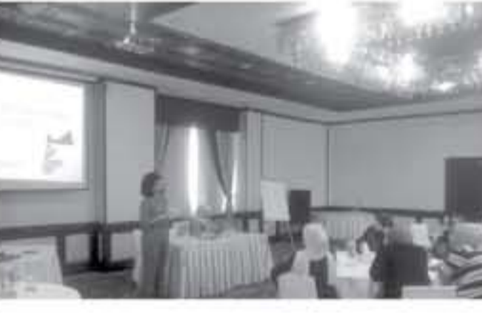
عمان - الأناط

أما هدف الورشة بحسب ما ذكرته التشنيفات فهو تطوير معارف موظفي الوزارات المختصة بالجمعيات وتنمية مهاراتهم وتعديل اتجاهاتهم، علاوة على تنفيذ خطة سجل الجمعيات في مجال سياسات وقاية الجمعيات وحمايتها من غسل الأموال وتهويل الإرهاب، وأضافت التشنيفات بأن هذه الورشة سيعقبها ورش أخرى لرؤساء وأعضاء الجمعيات والموظفين المعنيين بالاطراف على الجمعيات في مختلف محافظات المملكة.