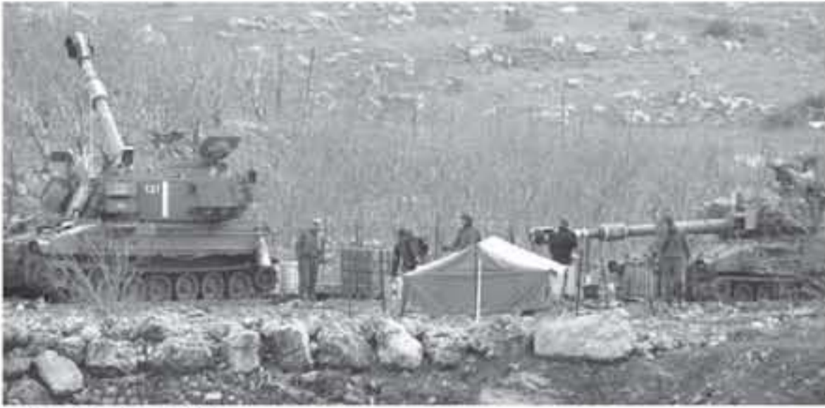
قوات العدو شمال فلسطين المحتلة

وقالت ان قوات الاحتلال تقوم بسلسلة من العمليات الجوية والتربة ضد احتمال أن يكون الرد الإسرائيلي مصحوبا بمحاولة التسلل إلى إسرائيل سواء على الأرض أو في الجو. وتوعدت ان قيادة الجبهة الداخلية في إسرائيل أمرت المدنيين بمواصلة الحفاظ على روتينهم اليومي، حيث من المتوقع أن تستهدف محاولات التسلل قواعد ومنتجآت عسكرية. وكان رئيس أركان الجيش الإسرائيلي، محمد باقر، قد حذر من أن إيران سترد في الوقت المناسب على الاعتداءات التي وصفها "بالخطيئة". وتفقد لوجيات الجيش الإسرائيلي في مدينة زقرون بمحافظة خوزستان جنوب