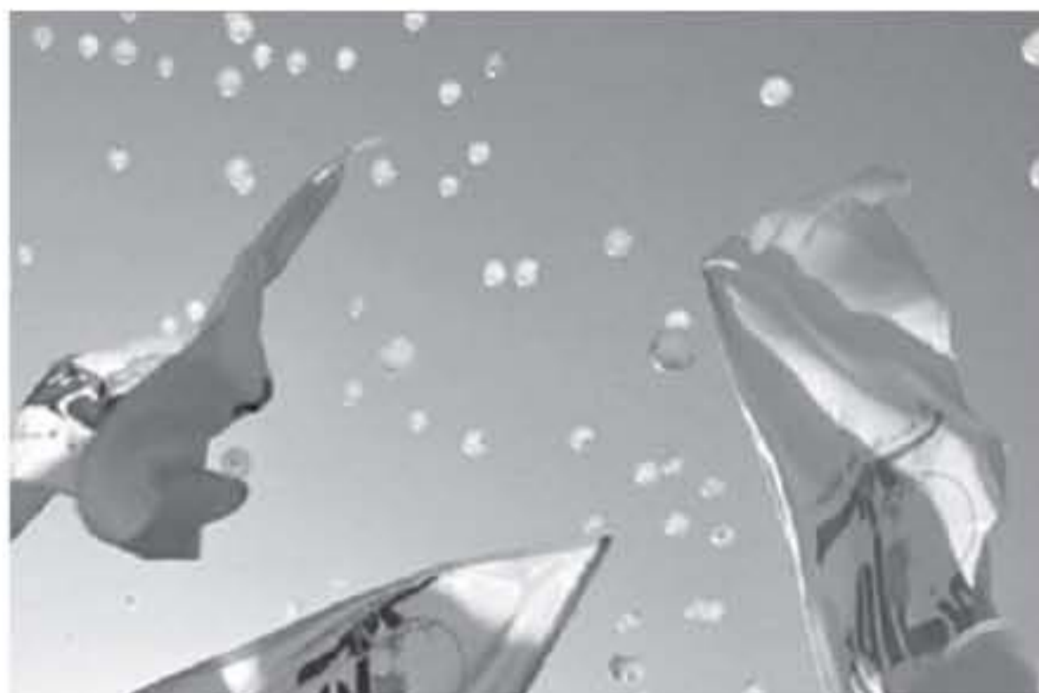
اعلام حزب الله ترهرف في سماء بيروت

الملا، بحسب وزارة الداخلية اللبنانية، وبعد الانتخابات البرلمانية هي الأولى التي تجري في لبنان منذ 9 سنوات.