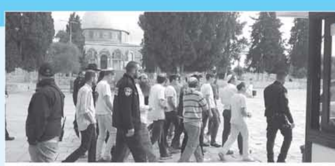
المستوطنون يدسون الاقصى

رأى الكاتيب الإسرائيلي لسمي بارزيب، إن حزب الله يجب أن يكون سعيدا بنتائج الانتخابات التبريرية، ويجب أن تكون إسرائيل أيضا سعيدة بذلك. وأضاف في مقال نشرته صحيفة "هارتس" الإسرائيلية، ان استقرار لبنان يصب في مصلحة إسرائيل. رغم فوز حزب الله الذي خاض في السابق، حروبيا ضد إسرائيل، مشيرا إلى أن وجود حزب الله ساعد على تحقيق "توازن الردع" بين إسرائيل ولبنان في الماضي، وهذا التوازن منع تجدد الحرب بين لبنان وإسرائيل. ورأى الكاتيب الإسرائيلي أن حزب الله لا يهاجم إسرائيل لأنه يخشى من استهداف البنية التحتية المدنية في لبنان من قبل إسرائيل، مضيفا، "لذلك فإن مريدا من الزههار إلى لبنان يعني مزيدا من الردع الإسرائيلي وحزب الله الذي سيكون أكثر خشية من استهداف إسرائيل للبنية التحتية في لبنان". على حد تعبيره. واعتبر لسمي بارزيب أن نتائج الانتخابات هي بداية للمشاركة