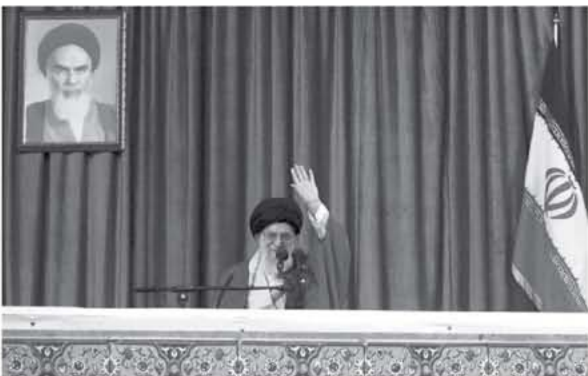
آية الله علي خامنئي متحدثاً الى الحشود.

المتشدة "ترامب مرق الاتفاق النووي وأن الأوان لتقوم بحرقه" مستعيدة ما أعلنه المرشد الاعلى للجمهورية الاسلامية آية الله علي خامنئي قبل بضعة أشهر. اما السرد مقابل رفع حصة من العقوبات الدولية المفروضة عليها. وصعدت واشنطن الى الخيار الاكثر تشدداً عبر إعادة فرض كل العقوبات التي كانت رفعت بموجب الاتفاق لكن ايضاً عبر الاعلان عن عقوبات اقسى وارغام الشركات الاجنبية على الاختيار سريعاً بين مواصلة أعمالها في ايران او في الولايات المتحدة. وقال روحاني "علينا ان نتنظر لنرى ما الذي ستفعله الدول الخمس الكبرى. لقد اصدرت تعليماتي الى وزارة الخارجية لاجراء مفاوضات خلال الاسبوع المقبلة مع الدول الأوروبية والدولتين العظيمتين الآخرين اي الصين وروسيا. واضاف "انا وجدنا في نهاية هذه الحلقة القصيرة انه عبر التعاون مع هذه الدول الخمس يمكن ضمان مصالح الشعب الإيراني على الرغم من الولايات المتحدة والتزام الصهيوني (...). عندها سيقبى الاتفاق النووي سارياً وسيكون مقدورنا العمل في سبيل السلام والامن في المنطقة والعالم. وعصمت الصحافية الإيرانية امس الاربعاء اراء المتقدمة بين الاصلاحيين واليساريين المتشددين من جهة، والمتشددون من جهة اخرى المعارضين منذ البداية لهداه النووي. وكثبت صحيفة "كهان" المحافظة