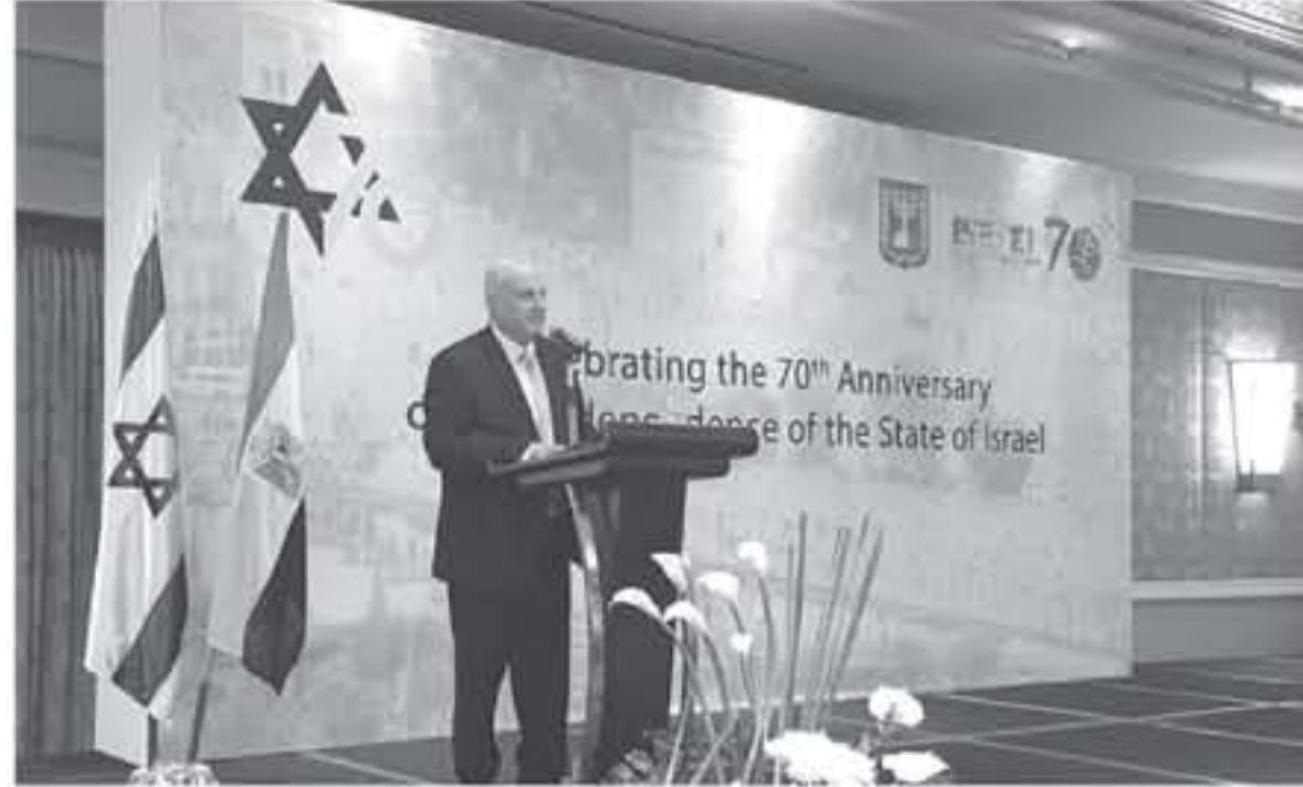
جانب من الحفل

خاسرة، مذكرا بالثاقية الغاز التي تم التوقيع عليها مؤخراً بين القاهرة وتل أبيب.