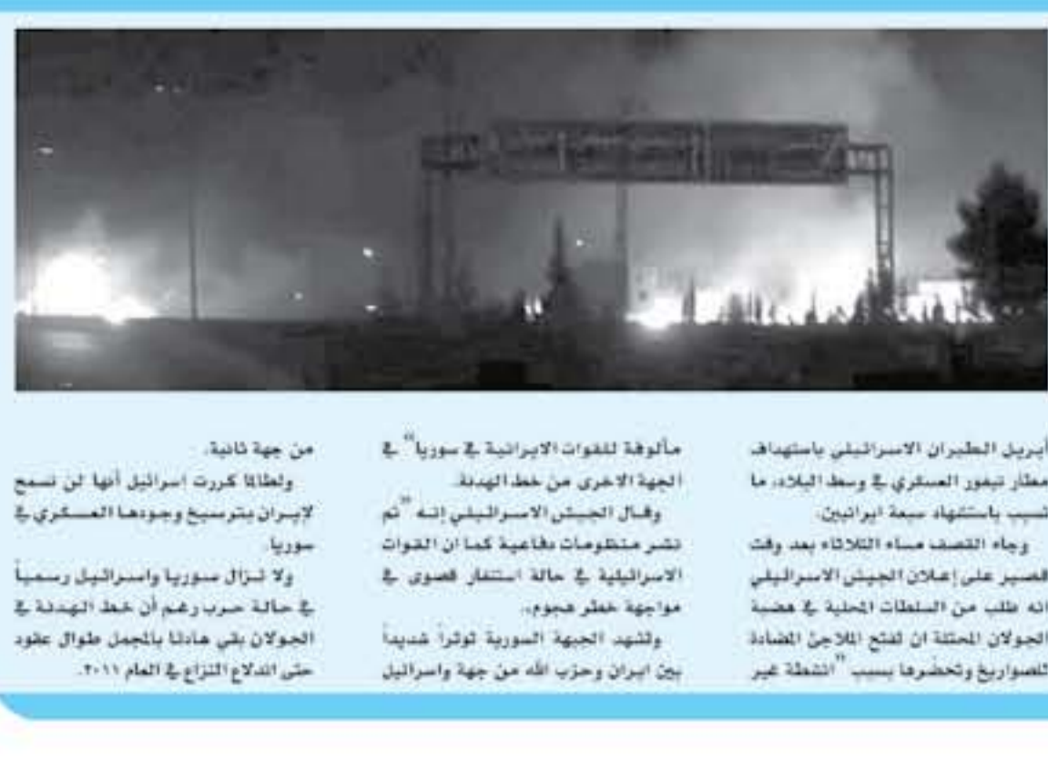
من جهة ثانية، ولعلنا كررت اسرائيل أنها لن تسمح لإيران بتوسيع وجودها العسكري في سوريا.

شهدت كابول امس الاربعاء هجمات عدة استهدفت مراكز للشرطة، وهي منسقة على ما يبدو، بعد اسبوع على اعتداء التحازي مزروح اوقع 25 قتيلاً في العاصمة الافغاندة. وقال مراسل فرانس برس انهم سمعوا دوي انفجارات عدة في وسط العاصمة. وهذا ما أكدته على الفور من دون مزيد من الايضاحات مسؤولون أمنيون وشهود. وخلال هجوم اول، عمد التحازي التي تتبرير نفسه امام مركز للشرطة قرب المدينة، قبل تبادل نيران لاطلاق النار بين مهاجمين آخرين وعناصر من الشرطة، كما قال لوكالة فرانس برس المتحدث باسم وزارة الداخلية تجيب ديش.