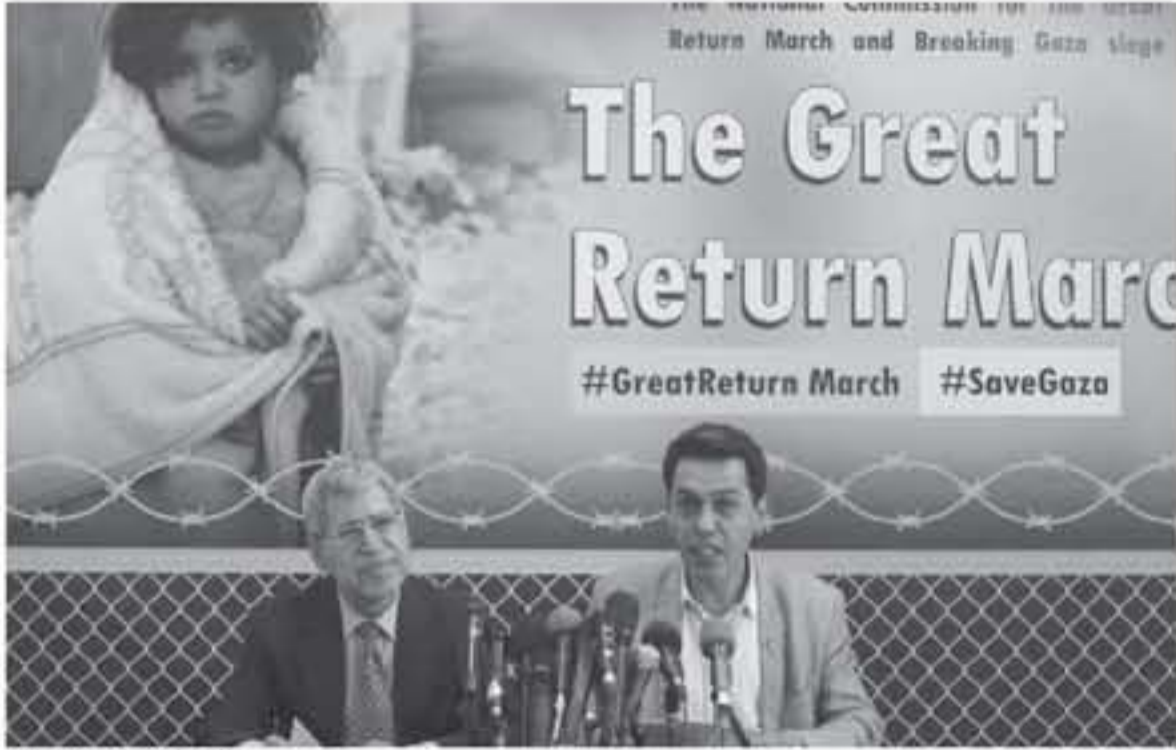
جانب من الإحتراع الصحافي

استشهد 14 مواطناً وأصيب أكثر من ستة آلاف خلال قمع قوات الاحتلال مسيرة العودة في المناطق الشرقية للقطاع منذ 30 مارس الماضي.