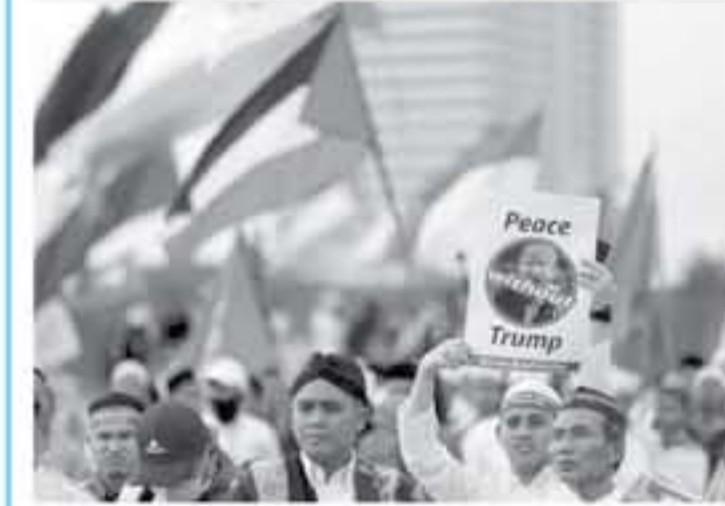
من الانشطة الاندونيسية لنصرة فلسطين