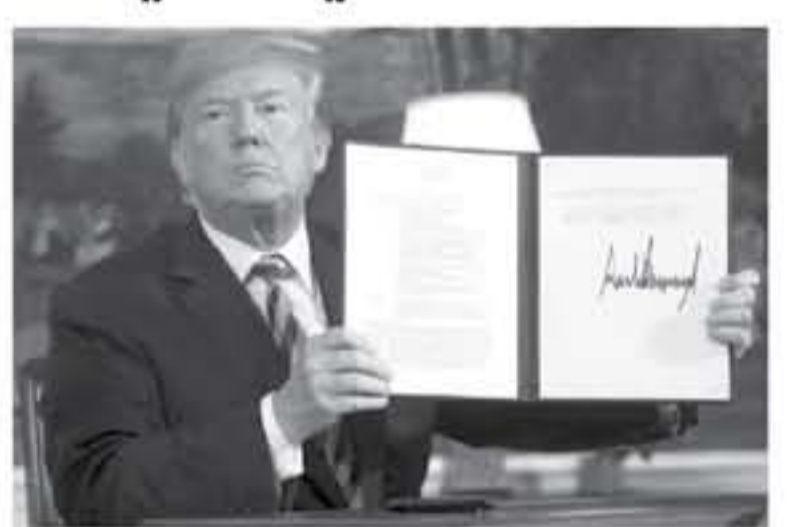
الرئيس الأميركي دونالد ترامب يوقع وثيقة انسحابه عن الاتفاق النووي الإيراني في واشنطن.

سارعت القوى الأوروبية امس الاربعاء لانتقاد الاتفاق النووي الذي يقيد برنامج ايران النووي بعدما أعلن الرئيس الأميركي دونالد ترامب انسحاب واشنطن منه وإعادة فرض العقوبات على طهران. من جهته، طلب المرشد الأعلى للجمهورية الاسلامية آية الله علي خامنئي امس الأربعاء من الأوروبيين تقديم "ضمانات عملية" لإيران لكي تواصل التزامها بالاتفاق النووي الموقع في 2015 بعد انسحاب واشنطن منه. وأشار ترامب غضبياً واسعاً لا سيما في القارة الأوروبية بقراره التخلي عن الاتفاق رغم ترحيب بعض الأطراف بالخطوة التي تجعل خطر تفويض الجهود الدبلوماسية حول عدة ملفات على المساحة الدولية وإضافة عامل جديد لعدم الاستقرار في الشرق الأوسط. واستمرا بالاتفاق الذي وصفه في خطاب أمام الأمة ألقاه في البيت الأبيض الثلاثاء بـ"الكارثي" و"المخجل" يحق للولايات المتحدة وقال انه لا يقيد طموحات طهران النووية. وأعلن وزير الخارجية الفرنسي جان إيف لودريان امس الاربعاء عبر اذاعة "إر تي ال" أنه سيلتقي الاثنين المقبل إلى جانب نظيره البريطاني والألماني ممثلين عن ايران "لمناقشة ودعمها مجموعات مسلحة في الشرق الأوسط. وقال "لا يمكننا منع قنبلة نووية إيرانية في ظل الية التكلفة والعمدة التي أبرم على أساسها الاتفاق الحالي. وأضاف "ان نسمح بالتهديد بتدمير المدن الأميركية ولن نسمح لشركاءنا بالنوت لاميركا. بالوصول إلى أكثر الأسلحة فتكا على الأرض. وأعرب روحاني الذي يقود التفاوض على الاتفاق مؤقته داخلها عن غضبه منهما لترامب بشأن "حرب نفسية. وحذر من أن طهران قد تستأنف تخصيب اليورانيوم "اللا محدود" كره على قرار ترامب. لكنه أكد أن بلاده ستناقش سبل الرد مع الأطراف الأخرى الموقعة على