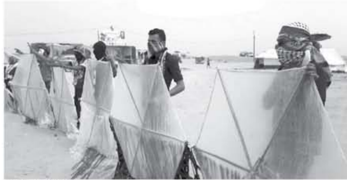
مطلق الطائرات الورقية

المسلمين في مخيمات ومسيرات العودة التي أطلقت منذ 30 من مارس الماضي.