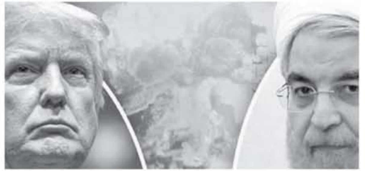
عواصم ووكالات - الأنباط - بايون المغربي

في بلده وقد يخسر هذه المكاسب إذا أدخل لبنان في حضم مواجهة عسكرية بالنيابة عن إيران.