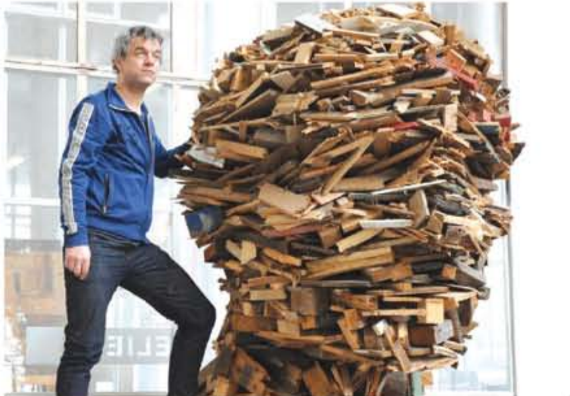
بيت هابن إيلك

قُدّرت دراسة اقتصادية صادرة عن جامعة الدول العربية في القاهرة، حجم خسائر الدول العربية الناجمة عن تجاهلها إعادة تدوير المخلفات، بنحو 5 مليارات دولار سنوياً، موضحة أن كمية المخلفات في الوطن العربي تبلغ نحو 89.6 مليون طن سنوياً، وتكفي لاستخراج نحو 14.3 مليون طن ورق، قيمتها ملياران و145 مليون دولار، وإنتاج 1.8 مليون طن حميد خردة بقيمة 125 مليون دولار، بالإضافة لنحو 75 ألف طن بلاستيك قيمتها 1.1 مليار دولار، فضلاً عن 2.7 مليون طن قماش بقيمة 110 ملايين دولار، وكذا إنتاج كميات ضخمة من الأسمدة العضوية والمنتجات الأخرى بقيمة تتجاوز ملياراً و225 مليون دولار.