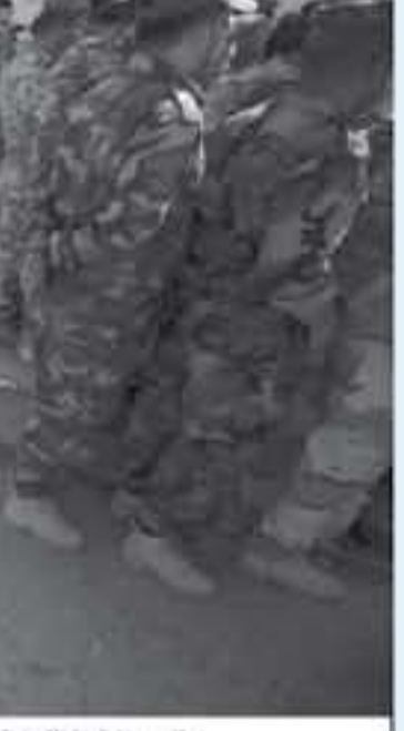
عناصر من قوات الامن العراقية يتشرون للاداء بوقوفهم في العاصمة بغداد في ١٠ ايار/مايو قبل انطلاق الانتخابات في ١٢ ايار/مايو.

تأتي الانتخابات التشريعية العراقية غدا السبت، الأولى منذ إعلان دحر تنظيم الدولة الإسلامية من البلاد، في وضع دقيق يشهد انقساماً شاماً وتهميشاً شديداً إلى جانب فقدان الأكراد لدورهم المحوري. تجري الانتخابات الثالثة منذ سقوط نظام صدام حسين العام ٢٠٠٣، للمرة الأولى من دون تهديد الجهاديين الذي ضعف كثيراً، ولكن، يسود مناخ التوتر بين فئتين مركزيتين في البلاد، إيران والولايات المتحدة، بعد إعلان الرئيس الأميركي دونالد ترامب انسحابه من الاتفاق النووي الإيراني. وتتنافس خمس نواحي شعبية على الأقل، بينهم تلك التي يتزعمها رئيس الوزراء الحالي حيدر العبادي، وسلفه نوري المالكي الذي تم تبديل فكرة إزاحته في العام ٢٠١١، إلى جانب هادي العامري أحد أبرز قادة فصائل الحشد الشعبي التي لعبت دوراً حاسماً في دعم القوات الأمنية خلال معاركها ضد تنظيم الدولة الإسلامية. ويميز أيضاً لاجتراء رجبى الدين الشيعيين، عمار الحكيم الذي يتزعم لائحة نيابة "الحكمة"، ومقتدى الصدر الذي أبرم تحالفاً غير مسبوق مع الحزب الشيوعي العراقي في ائتلاف "سائرون"، وعلنانة كان التسمية الغالبية في البلاد، متحدثين في الانتخابات لضمان سلطتهم ولكن في إطار نظام سياسي وضع بحيث لا يتمكن أي تشكيل سياسي من أن يكون في موقع الهيمنة، يجب ألا يؤدي انقسام الشيعة إلى تغيير موازين القوى بين الفواعل وفق ما يتبخر خبراء. ويبدأ امس الخميس نحو مليون عسكري في جميع أنحاء العراق عملية التصويت الخاصة بالقوات الأمنية. - لقدر الشيعة في إدارة العراق- يقول المحلل السياسي الأردني عادل محمود، بوكالة فرانس برس إن هناك "صراعاً بين النواحي الشيعية، للوصول إلى سدة رئاسة الوزراء (...) لكن ذلك لن يؤثر على صيغة لفرع الشيعة في إدارة