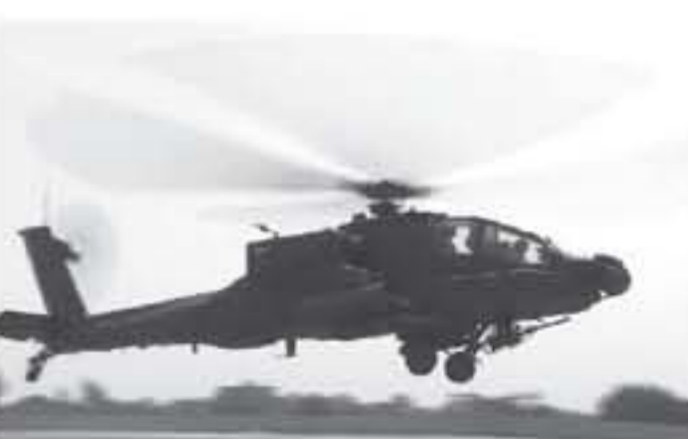
مروحية تابعة للجيش المصري من طراز "أباتشي"

فبراير الماضي أسفرت حتى الآن عن مقتل أكثر من مئة من الجهاديين ونحو ٣٠ جندياً، بحسب إحصاءات الجيش. وعلى صعيد احتجاجات الاهالي في سيناء في ظل الحملة العسكرية قال الجيش في بيان الخميس إنه يواصل "طرح وتوزيع كميات من السلع والمواد الغذائية بشكل يومي لضمان امداد المواطنين من اهالي شمال ووسط سيناء بكافة الاحتياجات المعيشية". وعند أطاح الجيش بالترليس الإسلامي محمد مرسى في ٢٠١٣ بعد احتجاجات شعبية ضد، تحوض قوات الامن المصرية وخصوصاً في شمال ووسط سيناء مواجهات عنيفة ضد مجموعات جهادية متطرفة، بينها الفرع المصري لتنظيم الدولة الإسلامية (ولاية سيناء) المسؤول عن شن عدد كبير من الاعتداءات الدامية في البلاد. وتعهد الرئيس المصري عبد الفتاح السيسي نهاية الشهر الماضي بأن يتم اهاء العملية العسكرية التي يقوم بها الجيش بالتعاون مع الشرطة في سيناء "في اسرع وقت ممكن".