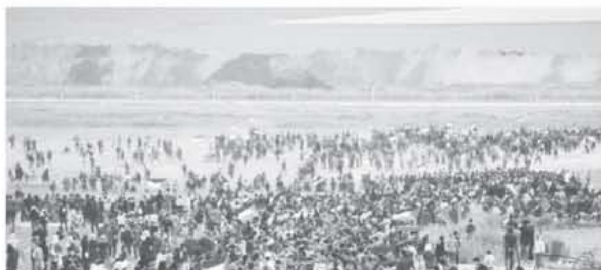
تلاوة مسيرة العودة

دعت الجبهة الشعبية لتحرير فلسطين أمس الأحد جماهير الشعب الفلسطيني والأمة العربية إلى أوسع مشاركة في مسيرة العودة الكبرى، بحيث يتحول هذا اليوم ليوم غضب شعبي فلسطيني وعربي. وقال بيان للجبهة أمس إن تحقيق الوحدة الوطنية التعددية، واستمرار المقاومة بكافة أشكالها وبوسائلها، هي الرد الاستراتيجي على الاحتلال وعدوانه، مما يتطلب إنهاء وإلغاء كل القابض التوسعية الموهمة معه، عربياً وفلسطينياً، والقطع مع كل الأوصاف التي ترتبت عليها، وبما يؤسس لمرحلة جديدة من إدارة الصراع مع الاحتلال. كما طالبت البيان بالحفاظ على قومية الصراع مع الاحتلال، من خلال تعزيز العلاقة مع القوى والأحزاب الشعبية العربية بالأساس، انطلاقاً من أن مسؤولية مواجهة العدو الصهيوني وأهدافه، وتحقيق أهداف شعبنا مسؤولية عربية، ويعد الشعب الفلسطيني رأس حربة فيها. ودعت الجبهة إلى تعزيز البعد الأممي والعلاقات مع القوى والشعوب والتجمعات التي تناهض الإمبريالية العالمية، ولتؤيد تضام شعبنا، وبما يعزز الحركة الشعبية لمقاطعة الاحتلال الصهيوني على طريق نزع الشرعية عن كيانه العنصري البغيض.