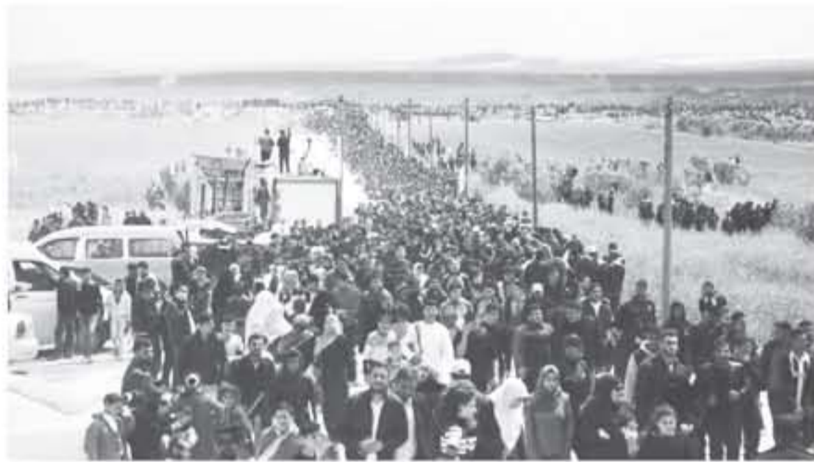
من مسيرات العودة

يستعد الفلسطينيون في أماكن تواجدهم كافة اليوم الاثنين للمشاركة في "ملبونية العودة وكسر الحصار"، بالتزامن مع تكثيف السبعين وقرار الإدارة الأمريكية نقل سفارة بلادها للقدس المحتلة فيما يُسمى بذكرى قيام الكيان الإسرائيلي. وقالت المسيرة وفق التنظيم - لتأكيد على حق عودة اللاجئين إلى ديارهم التي هجروا منها عام ١٩٤٨، ورفض المخططات الرامية لتصفية قضيتهم، وللضغط باتجاه الحصار الإسرائيلي المستمر منذ ١٢ عامًا. ومتوقع أن يشهد اليومان المقبلان (١٤ و١٥ مايو) تظاهرات واحتجاجات شعبية واسعة في الضفة الغربية والقدس المحتلة، والأراضي المحتلة عام ١٩٤٨ والشنات، بالإضافة إلى مسيرات داعمة ومساندة في معظم العواصم العربية والإسلامية والغربية. وعند انطلاق مسيرات العودة الكبرى في ٣٠ مارس الماضي، والفلسطينيون يواصلون الاحتجاج على طول السياج الفاصل مع الأراضي المحتلة شرقي قطاع غزة. رغم قمع قوات الاحتلال لتلك المسيرات السلمية، واستخدامها "القوة المفرطة والمهينة" والأسلحة المحرمة دوليًا، ما أدى لاستشهاد ٤٨ مواطنًا