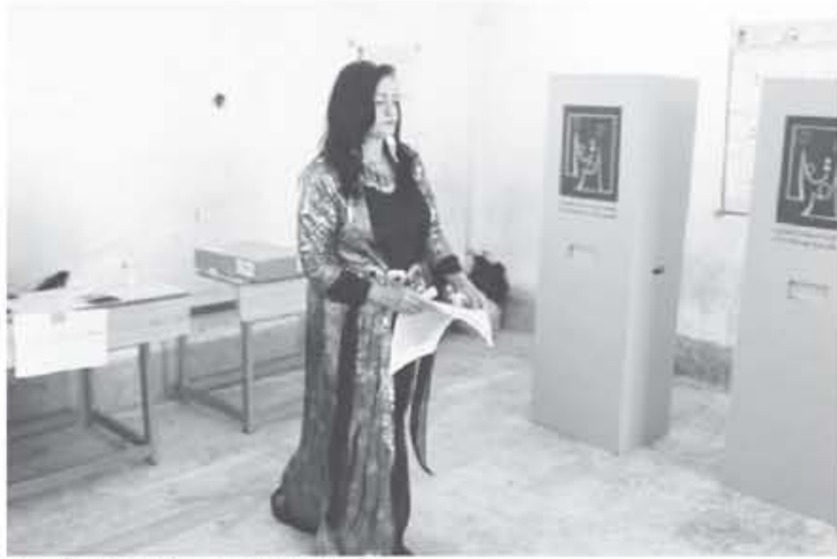
امرأة كويتية تصوت في لجنة انتخابية في كركوك يوم 12 مايو 2018.

قال مصدر في المفوضية العليا المستقلة للانتخابات في العراق ومسؤول أممي لرويترز يوم أمس الأحد إن قائمة رئيس الوزراء حيدر العبادي متقدمة على ما يبدو في الانتخابات البرلمانية تلتها قائمة رجل الدين الشعبي البارز مقتدى الصدر. واستند المصدران إلى نتائج أولية غير رسمية. وصوت العراقيون السبت في أول انتخابات منذ هزيمة تنظيم الدولة الإسلامية في البلاد. ومن المتوقع إعلان النتائج الرسمية النهائية اليوم الاثنين. وذكرت المفوضية أن نسبة الإقبال على التصويت بلغت 42.11 في المئة مع فرز 92 في المئة من الأصوات أي أنها أقل بكثير مما كانت عليه في الانتخابات السابقة. وكان العبادي، وهو حليف لكل من الولايات المتحدة وإيران، منتقلا بالأساس بهزيمة جماعات سياسية شيعية قوية منتعش في حالة فوزها لجعل العراق أكثر قربا من إيران وليس من بينها تحالف الصدر. وتنافس العبادي مع سلفه نوري المالكي وهادي العامري قائد الفصيل الشعبي المسلح الرئيسي وهما أحرز إيران منه. وتشير نتائج أولية غير رسمية جمعها مراسلو رويترز في المحافظات الجنوبية كذلك إلى أن الصدر، الذي قاد مواجهات عنيفة ضد القوات الأمريكية في الفترة من 2003 إلى 2011، يحقق أداء قويا على ما يبدو. وإذا جاءت قائمة الصدر في المركز الثاني فإن هذه النتيجة ستكون عودة مفاجئة له. ويحظى الصدر بشعبية كبيرة بين الشبان والقضاء والمدمرين لكن شخصيات شيعية مؤثرة أخرى تدعمها إيران مثل العامري هملت على تهميشه. وشكل الصدر تحالفا غير معتاد مع عرويين ومستقلين يتناسرون المعادية والضموا لاحتجاجات نظمتها في عام 2011 لكشفهم على