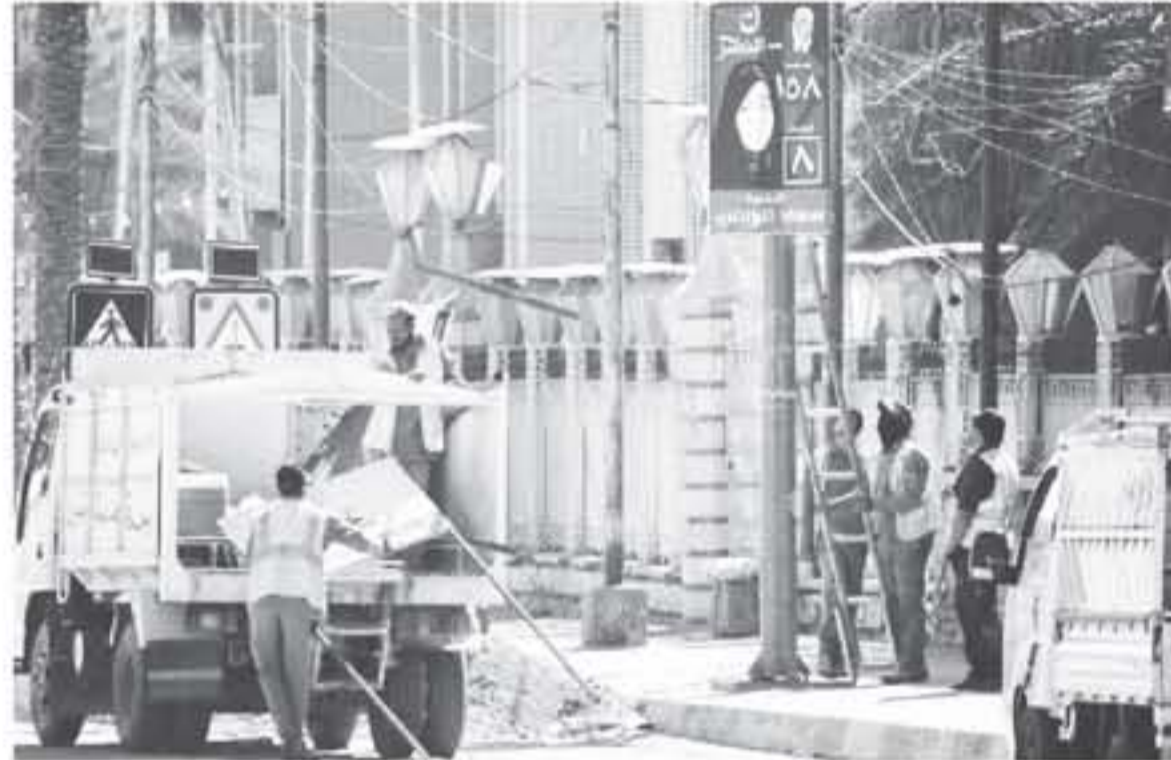
عمال البلدية يزيلون لوحات دعاة المرشحين في مدينة النجف بعد الانتخابات، الأحد، 12 ايار 2018.