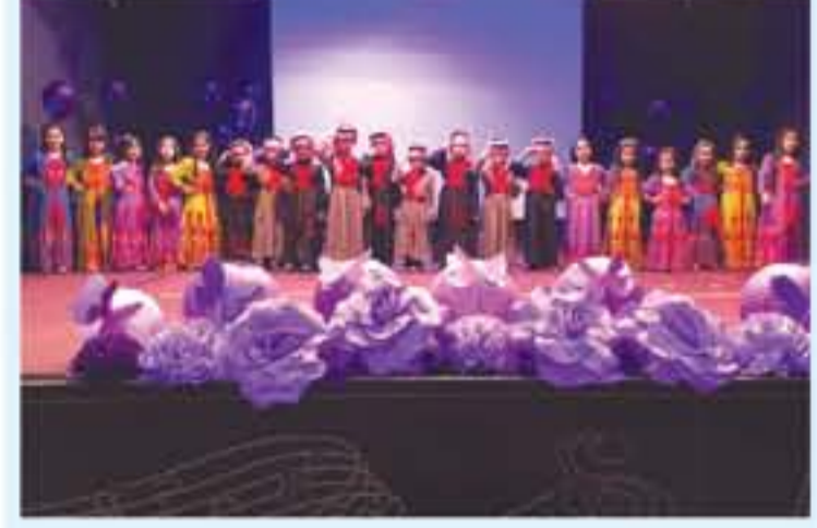
عمان - الأنباط: احتفلت مدارس العروبة بالعاصمة عمان بتخريج الفوج الـ 22 من طلبة، وقدم الطلاب والطالبات مجموعة من الفقرات المنوعة التي نالت استحسان الحضور وأولياء الأمور.