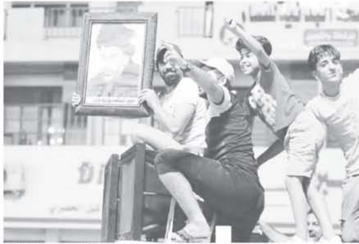
عراقي يحتفل بنتيجة الانتخابات التشريعية حاملاً صورة الزعيم الشيعي مقتدى الصدر في بغداد في ١٤ أيار/مايو.

شكل العراقيون مفاجأة سياسية بإيصال قائمتين مناهضتين للتركيب السياسية الحالية لتتقدم الانتخابات التشريعية بحسب ما انتشرت نتائج جزئية، ببارق كبير عن رئيس الوزراء حيدر العبادي الذي يحظى بدعم بوني كبير ويحسد له "النصر" على الجهاديين. وهذه النتائج الجزئية الرسمية التي ظهرت ليل الأحد الاثنين لا تشمل تصويت القوات الأمنية والمختبرين والناظرين، الذين يمكنهم تغيير المعطيات بعد فرز أصواتهم. هاتان القائمتان، الأولى بقيادة الزعيم الشيعي مقتدى الصدر والشيوعيين والثانية التي تضم فصائل الحشد الشعبي المؤيد من إيران، تبتنا في الماضي خطايا معاديا لواشنطن، رغم فتائلهما إلى جانب القوات الأميركية ضد تنظيم الدولة الإسلامية، تأتي تلك المفاجأة في وقت تصاعد فيه التوتر بين واشنطن وطهران بعد انسحاب الولايات المتحدة من الاتفاق النووي الإيراني. وفي العام ٢٠١٤، كانت الدولتان متفقتان ضمنياً على العبادي رئيساً للحكومة بعد إطاحة زعيمه في حزب الدعوة نوري المالكي، الذي يأمل بالعودة إلى السلطة.