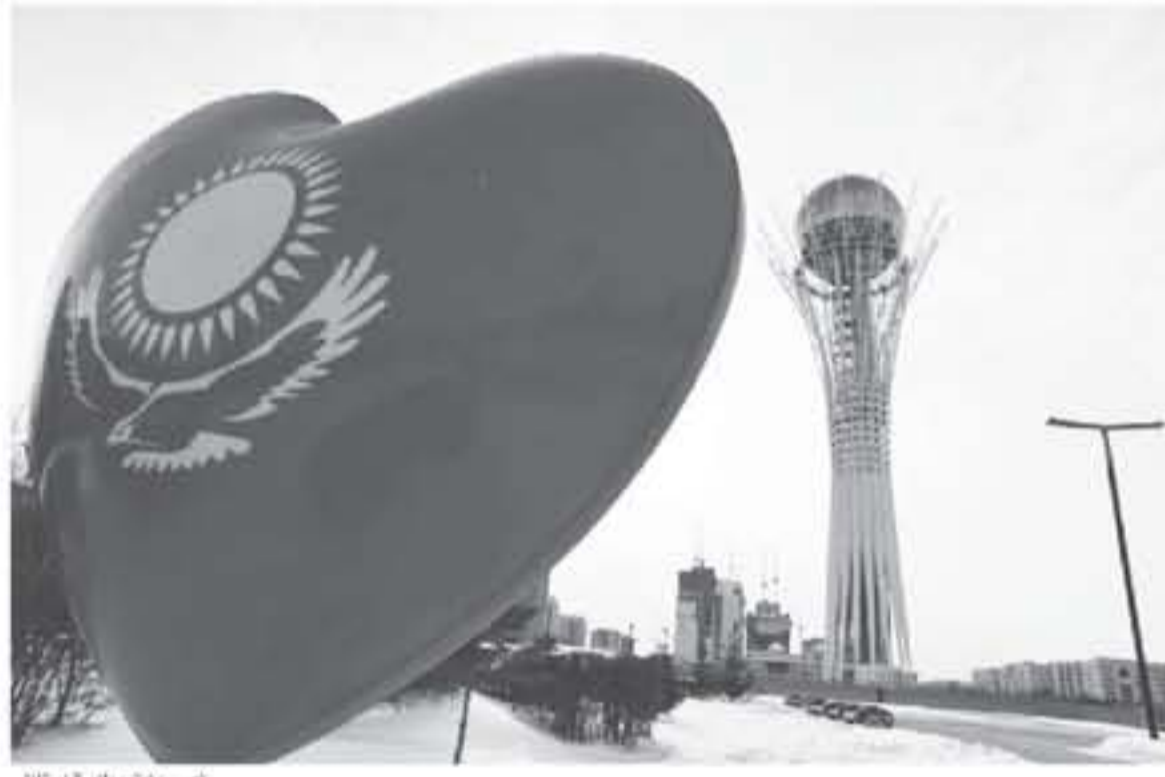
نصب سياتيريك، في استانا

الذي السحبت والشلطن منه مطلع الشهر الجاري، في خطوة استهدفت لتهدئة دولياً وأثارت الخاوف من الدراج نزاعات جديدة في المنطقة. ويعا مطار حولته المكوكية الساعية لانجاز الاتفاقي، زار طريف بكين ويتوقع أن يتوجه إلى بروكسل بعد موسكو. ومنذ بدأت المفاوضات بشأن سوريا في استانا مطلع العام الماضي، تركزت في معظمتها على محاولات تخفيف حدة المعارك بين قوات النظام السوري المدعومة من روسيا وإيران وفصائل المعارضة. لكن الهجوم الدمر الذي شنته قوات النظام في شباط/فبراير على القوطة الشرفية قرب دمشق التي كانت معقلاً