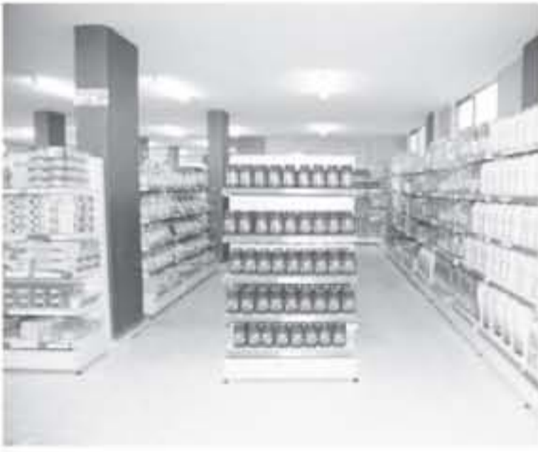
عمان - بئرا

إن الشراكة والمصادقة شعار المؤسسة التي لتعمل بالكامل قيمة العروض والخصومات على السلع كافة فأهدأنا ليست رخيصة. وأشار الى دعم حكومي منتظر للمؤسسة قيمته ٥ ملايين دينار، مشيراً إلى ان ذلك سيعكس إيجاباً على السلع الغذائية المصنعة محلياً وما فيها الألبان والألبان. وقبما يتعلق بإيقاف بعض السلع عن إيفاق البيع يأتي في إطار تعديل سعر السلع بعد ملاحظة المؤسسة لتاجر أخرى تباعها بسعر أقل. وقال "نحن نحاول الوصول إلى تقاضيات مع الشركات لتوردة للحصول على سعر أقل ١٠ بالمئة من باقي التاجر الخاصة" مشيراً إلى أنه في حال اعتدال الشركات الموردة عن توفير السلع الموقفة عن البيع بسعر أقل فأنا نجبرها على سحب السلع موضع الخلاف حتى توفيرها بسعر أقل عن باقي التاجر الخاصة. وكتف العميد العمري عن نتائج دراسة أجرتها شركة مستقلة لفيد بعض نتائجها بأن "سلة التسوق الغذائية في المؤسسة العسكرية أقل بنحو ٦ ملايين من أسواق القطاع العام والخاص.