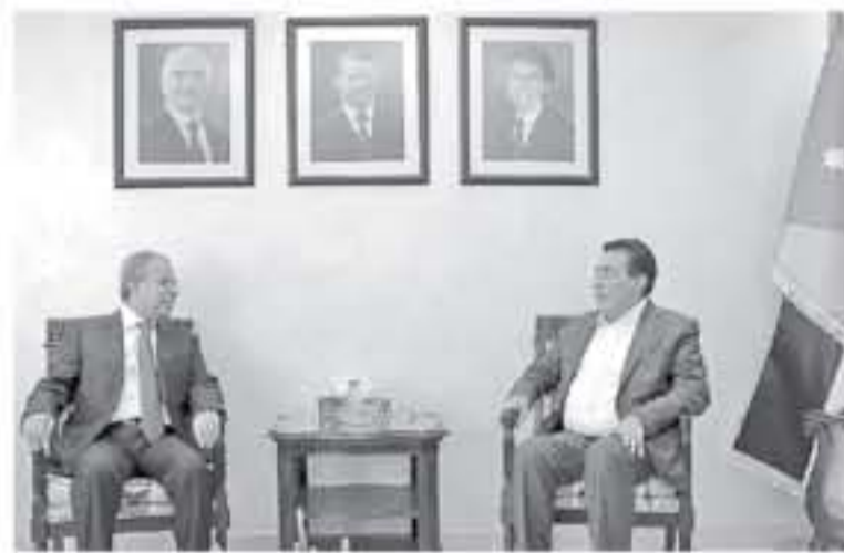
من جهته أكد البرغثي لتقدير بلاده للدعم الكبير الذي يوليه جلالة الملك عبد الله الثاني.

وتناول اللواء ملف الديون المترتبة على الجانب الليبي لصالح المستشفيات الأردنية، حيث أكد الطراونة أن الأردن ما زال يتطلع إلى حل هذا الملف العالق، نظراً لأن التأخير في تسديد الديون تسبب في تأثر قطاعات