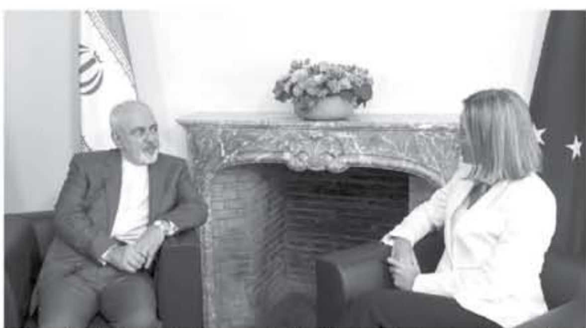
وزيرة خارجية الاتحاد الأوروبي فيديريكا موغيريني ووزير الخارجية الإيراني محمد جواد ظريف في بروكسل الثلاثاء 15 ايار/مايو 2018

بدأ وزير الخارجية الإيراني محمد جواد ظريف أمس الثلاثاء محادثات في بروكسل، المحطة الأخيرة من جولة تحشد التأييد الدبلوماسي للاتفاق النووي لبلاده بعد انسحاب الرئيس الأميركي دونالد ترامب منه. والتي ظريف وزير خارجية الاتحاد الأوروبي فيديريكا موغيريني قبل محادثات مع نظرائه من بريطانيا وفرنسا وألمانيا، الدول الأوروبية الثلاث الموقعة على الاتفاق النووي التاريخي والذي تبذل تلك الدول جهوداً حثيثة لانقاده. وكانت إيران قد أعلنت أنها مستعدة لاستئناف تخصيب اليورانيوم على المستوى الصناعي من دون أي قيود إلا إذا قدمت القوى الأوروبية ضمانات ملموسة لاستمرار العلاقات التجارية وزعم إعادة العقوبات الأوروبية. ويصر الاتحاد الأوروبي على أن الاتفاق يعمل ويشير إلى عمليات تفشيش دولية مستمرة لتتحقق من التزام الجمهورية الإسلامية بجانيتها من الاتفاق، وقالت مايا كوسيانيتش المتحدثة باسم موغيريني لوكالة فرانس برس قبيل وصول ظريف "علينا بذل أقصى جهودنا للحفاظ عليه.."