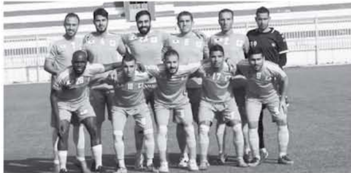
الدرجة الأولى، وسيشارك الموسم المقبل كل من السرحان ومعمان بعدما تأهلا من دوري الدرجة الثانية.