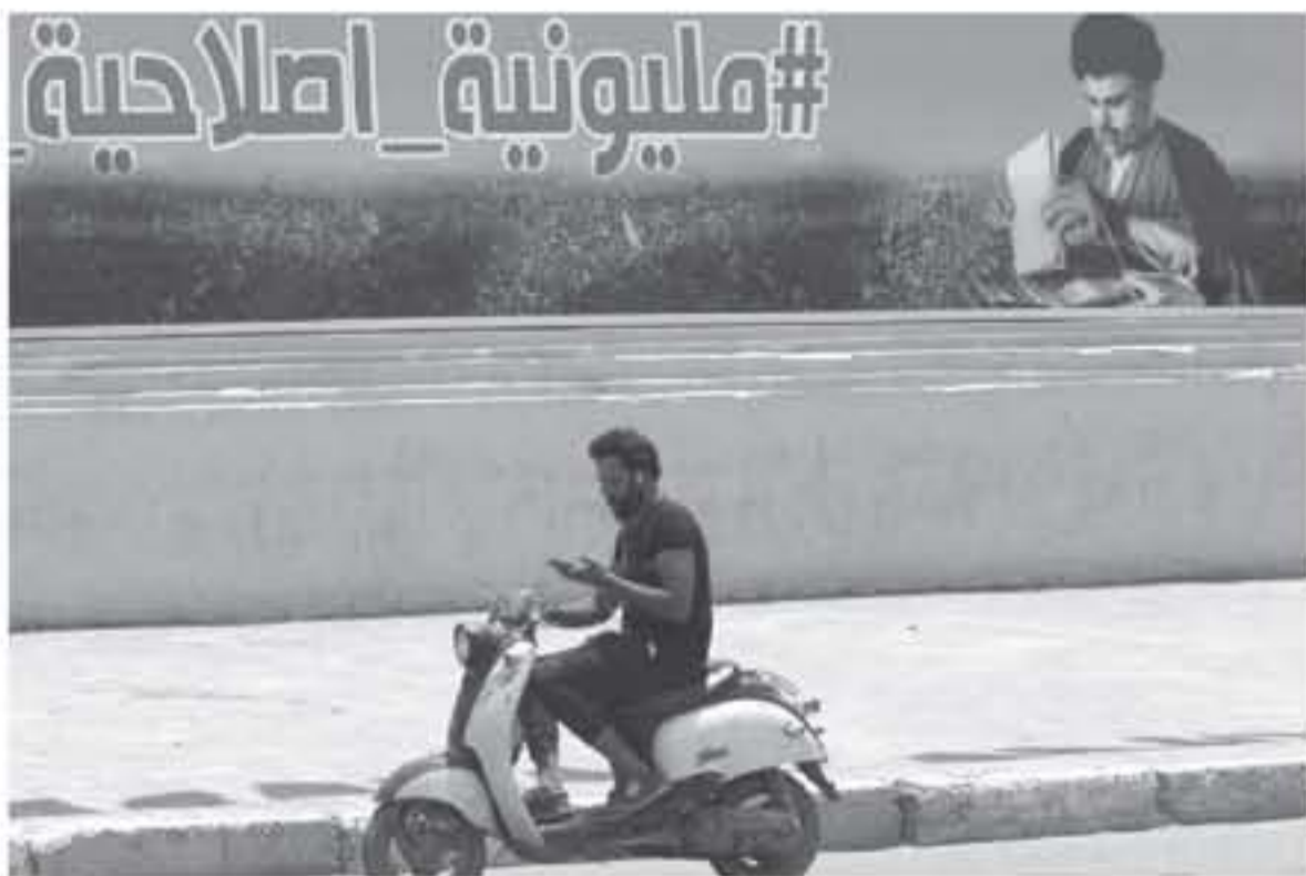
عراقي على دراجته النارية يعبر امام مصلح كبير للزعيم الشيعي مقتدى الصدر في مدينة الصدر في 14 ايار/مايو 2018