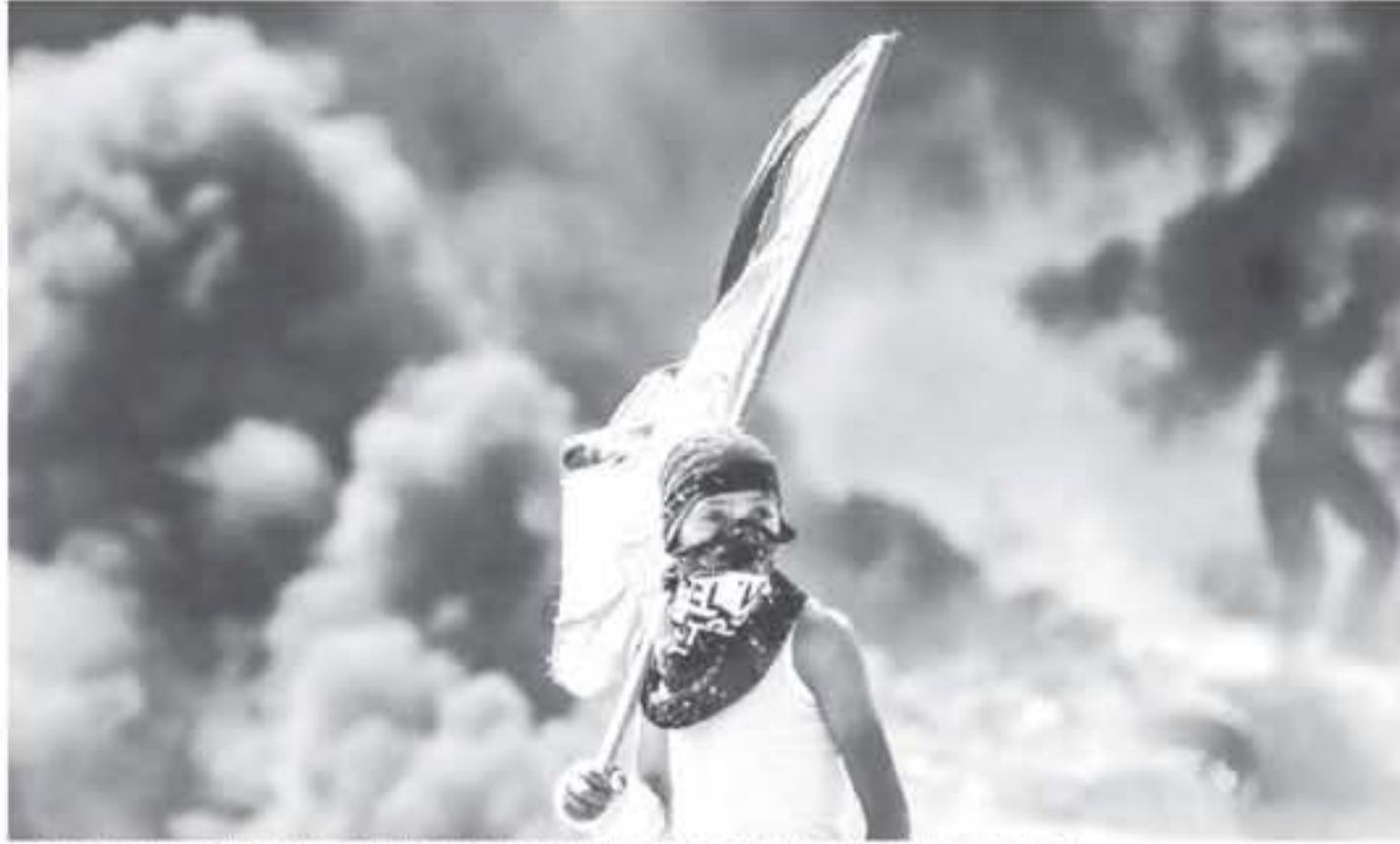
فتى فلسطيني يحمل العلم الوطني خلال اشتباكات مع القوات الإسرائيلية شرق مدينة غزة عند الحدود مع إسرائيل الاثنين 14 أيار/مايو 2018