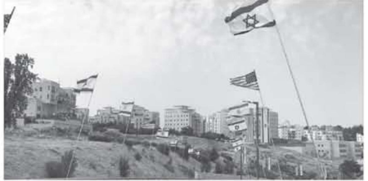
غواصم ووكالات - الأناضول - ماون العمري