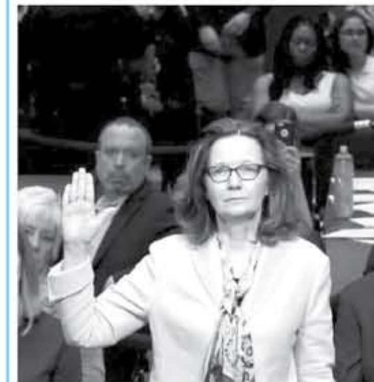
هاسيل خلال استجوابها من قبل لجنة الاستخبارات في مجلس الشيوخ الاميركي