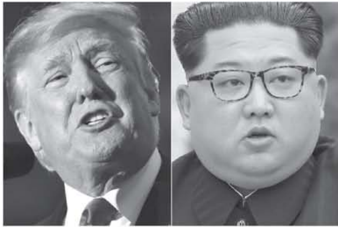
الرئيس الاميركي دونالد ترامب وزعيم كوريا الشمالية كيم جونغ أون

أكد البيت الابيض امس الاربعاء ان واشنطن لا تزال "تأمل" بانعقاد القمة بين الرئيس الاميركي دونالد ترامب والزعيم الكوري الشمالي كيم جونغ أون، رغم تهديدات بيونغ يانغ بالعنف. وفي عذوة مفاجئة الى خطابها التهديدي بعد شهر من تقارب بيونغ يانغ مع كوريا الشمالية، عددت بيونغ يانغ امس الاربعاء بالغاء القمة المرتقبة إذا ضغطت واشنطن عليها من أجل التخلي عن ترسانتها النووية في شكل أحادي. وقال نائب وزير الخارجية كيم كي سوان، في بيان نقلته وكالة الأنباء الرسمية الكورية الشمالية، "إذا ما حاولت الولايات المتحدة التصديق علينا وإرغامنا على التخلي عن السلاح النووي من جانب واحد، فلن نبقي مهتمين بحوار من هذا النوع". كما ألغت كوريا الشمالية لقاء رفيع المستوى مع كوريا الجنوبية احتجاجاً على المناورات العسكرية السنوية التي تجريها سيول وواشنطن، معتبرة أنها "استفزاز". وكانت التحذيرة باسم البيت الابيض سارة ساندرز ان واشنطن لا تزال تأمل بانعقاد القمة، وقالت شبكة فوكس نيوز، "لا يزال لدينا أمل بان اللقاء سيعقد ونواصل التمسك في هذا الاتجاه، لكن في الوقت نفسه نحن مدركون ان المفاوضات