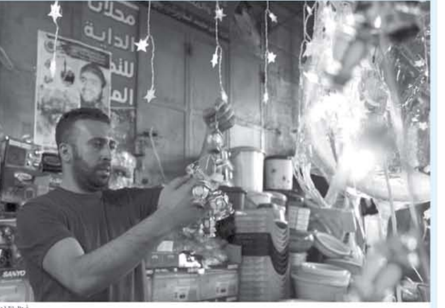
أسواق خالصة من الزبائن

غزة في أبريل 2017، وقال إنها ردا على تشكيل حركة "حماس" اللجنة الإدارية في غزة واشترط حل اللجنة لرفع العقوبات. وتضمنت العقوبات خفض التحويلات المالية إلى قطاع غزة، وتقليص رواتب موظفي السلطة في القطاع، والتوقف عن دفع ثمن الكهرباء التي يسود بها التسيب الإسرائيلي للقطاع. ورغم إعلان حماس في سبتمبر الماضي حل اللجنة الإدارية ودعوة حكومة الوفاق لتسلم مهامها ومن ثم تسليها للوزارات والمبار في قطاع غزة إلا أنه لم يتم التراجع عن الإجراءات العالمة حتى الآن، وأعلن عن فرض إجراءات جديدة الشهر الماضي. ولغرض سلطات الاحتلال حصارا مستندا برضا وبحرا على قطاع غزة عقب فوز حركة المقاومة الإسلامية (حماس) بالانتخابات التشريعية عام 2006، ولتضع دخول مئات أصناف البضائع، وتحد من حرية الحركة وتدفق الأموال. وتعمقت الأزمة جراء فرض