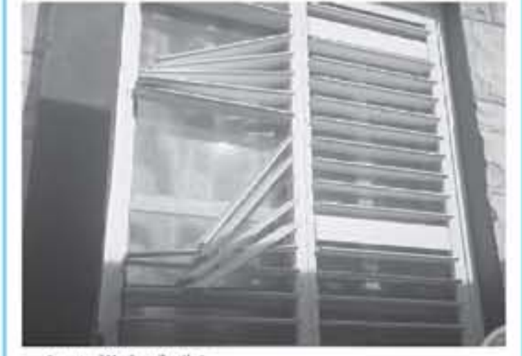
شباك في مستوطنة سديروت

غزة، دون أن تقع إصابات، وعلى إثر ذلك ردت المدفعية الإسرائيلية بقصف موقع للمخامة. وفي وقت لاحق، قالت إسرائيل، إن عبارات نارية من رشاشات ثقيلة أصابت أربعة منازل في سديروت دون أن يتسبب ذلك بوفوع إصابات في صفوف المستوطنين، إلا أنه أحق خسائر مادية بالمتنكات. وأضافت أن أحد المنازل التي أصيبت بالرصاص يعود لرئيس المجلس الإقليمي السابق إيال مويال. وكان شباب أصيب برصاص الاحتلال شرق مخيم العودة شرق البرج وسط قطاع غزة.