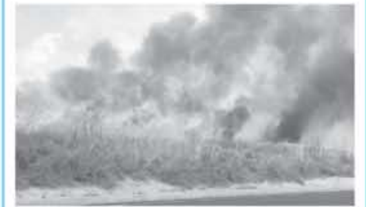
حرق زرع المستوطنين

غزة دون التصاح الأسباب، ويقوم تبيان فلسطينيون بشكل شبه يومي منذ انطلاق فعاليات مسيرة العودة الكبرى بإطلاق طائرات ورقية منبت فيها عبوات حارقة، باتجاه أراضيها المحتلة شرقي القطاع، وكبدت تلك الطائرات التي يتم صنعها بأدوات بسيطة الاحتلال خسائر باهظة، وينتشر الاحتلال بخمطورة لتكرار هذه الحالات، ويخشى من استمرار إطلاقها، كما يعكس ذلك تصريحات مسؤولين لديه. وتعتبر الطائرات الورقية الحارقة إحدى أساليب التسيب في القطاع لتشتويش على فئاسة الاحتلال الذين يطمعون المشاركين السلميين في مخيمات ومسيرات العودة التي انطلقت منذ 30-1 من مارس الماضي.