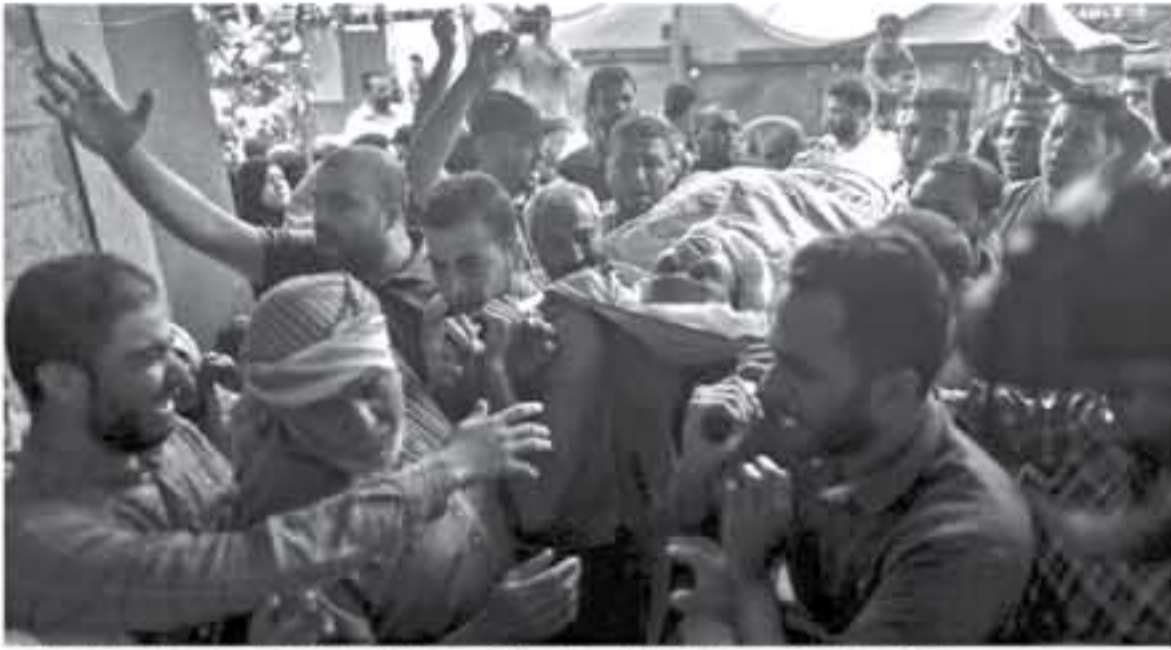
جنازة فلسطيني استشهد برصاص إسرائيلي في مخيم التصيرات في قطاع غزة في السادس عشر من أيار/مايو 2018

ويقول محللون أن حماس لا تبحث عن حرب جديدة مع إسرائيل، لأنها تعرف أن تأثيرها سيكون مدمرا على الفلسطينيين الذين يعانون أصلا الكثير من الحصار الخانق المفروض عليهم، ويتابع هيلر "حماس لن ترفع العلم الأبيض ولا يد من توقيع مواجهات جديدة عاجلا أم آجلا".