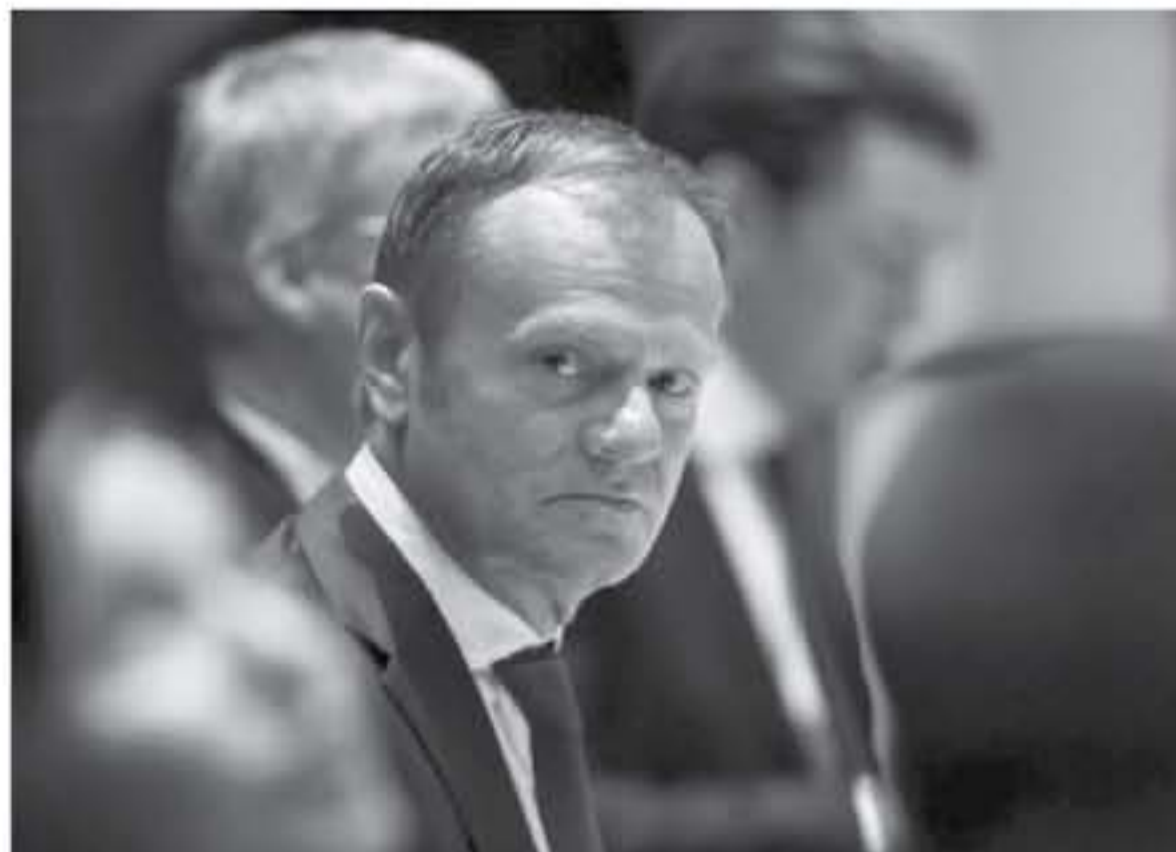
رئيس المجلس الأوروبي دونالد توسك في اليوم الثاني من قمة الاتحاد الأوروبي في بروكسل في 23 آذار/مارس 2018