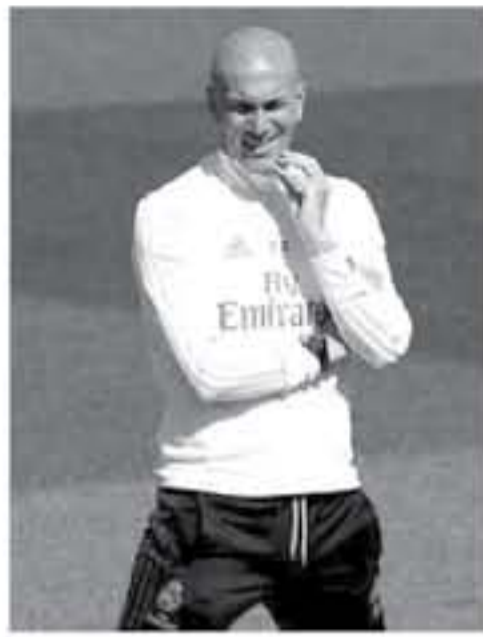
رابطة التتويج الإنجليزي مع ليفربول عام 2011، ولكنه خسر أمام مانشستر سيتي بركلات الترحيج.

زيدان المرئجي لتحتفي دوري أبطال أوروبا في التتاليين، على حساب أنتيغو مدريد (بركلات الترحيج) وبنفنتوس (1-1). ويأمل تكرار الأمر نفسه أمام ليفربول هذا العام. ويخالف دوري أبطال أوروبا، نجح زيدان أيضا في التتويج بالوسوبر الأوربي لعامين متتاليين أمام بيفيليا (2-2)، ومانشستر يونايتد (1-1) على الترتيب. وفي كأس العالم للأندية، استطاع زيدو قيادة الفريق الكتي لتحصن الكلب لعامين متتاليين أيضا. بعد الفوز في التتالي على حساب كاشيفا أتلورز الياباني (2-1)، وجرهيو البرازيلي (2-1) أيضا تمكن المدرب الفرنسي من حصد لقب الوسوبر الإسباني، على حساب فريقه التتويج برشلونه، في بداية الموسم الحالي. بعد التتويج (2-0) في مجموع مبارياتي النعب والياب، نجح كلوب على الجانب الآخر خاض المدرب الألماني 6 مباريات هاليفة في بطولات مختلفة، ولكنه لم ينجح إلا في التتويج بلفب وحيد، كان مع بوروسيا دورتموند في بطولة السابيل، عندما حصد كأس ألمانيا عام 2012، على حساب بايرن ميونخ، والعب كلوب مع دورتموند هاليف دوري أبطال أوروبا، عام 2012، لكنه خسر أمام الفريق الهاليفي بنتيجة (1-2). ووصل المدرب الألماني إلى هاليف الدوري الأوربي عام 2011، ولكن مع ليفربول، وخسر بنتيجة (1-3) أمام الشيبانية. وفي التتويات الحليفة خاض كلوب هاليف كأس ألمانيا مرتين (بمخلاف بطولة 2-1)، ولكنه خسر في المواجهتين عامي 2011 أمام بايرن ميونخ (1-2)، و2012 أمام فوفسبورج (1-3). كما خاض المدرب، الألماني هاليف كأس