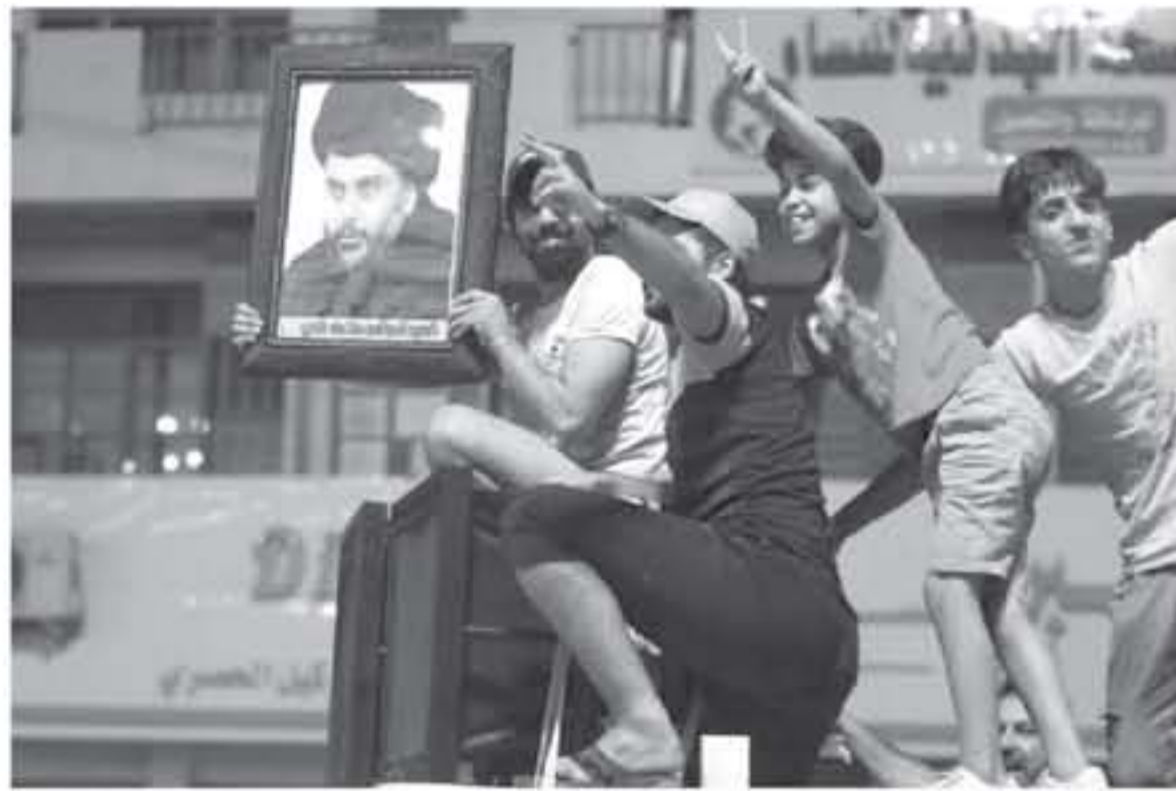
عراقيون يحتفلون بنتيجة الانتخابات التشريعية وقد رفع احداهم صورة الزعيم الشعبي مقتدى الصدر في بغداد في 12 ايار/مايو.

تصدر التحالف المدعوم من رجل الدين الشعبي الشيعي مقتدى الصدر، الذي اشتهر بفنائه لقوات الاميركية في العراق، نتائج الانتخابات التشريعية التي أعلنت قبل الجمعة السبت، لكنه مازال مرشحاً على التحالف مع كتلة اخرى لحكم بلد يتخرب الفساد. وبعد انتظار استمر اسبوعاً كاملاً، اظهرت النتائج الرسمية النهائية للانتخابات التشريعية التي أعلنتها المفوضية العليا المستقلة فوز تحالف "سائرون" المدعوم من الصدر بالعدد الاكبر من المقاعد الشيعية، في عملية التصويت التي جرت في 12 ايار/مايو وشهدت أدنى نسبة إقبال منذ أول اقتراع متعدد الأحزاب في العام 2005 بعد عامين من سقوط نظام صدام حسين. وحل تحالف "سائرون" الذي يجمع الصدر والحزب الشيعي وبعض أحزاب الكتفوقراط على أساس مكافحة الفساد، في المرتبة الأولى برء مقعداً. وعلى الصدر عبر حسابه على تويتر على النتائج بالقول إن "الإصلاح يتصدر والفساد يتحسر". أما تحالف "الفتح" الذي يتزعمه هادي العامري ويضم فصائل الحشد الشعبي التي اضطلعت بدور حاسم في دعم القوات الأمنية لدرج تنظيم الدولة الإسلامية فحل ثانياً على مستوى العراق 17 مقعداً.