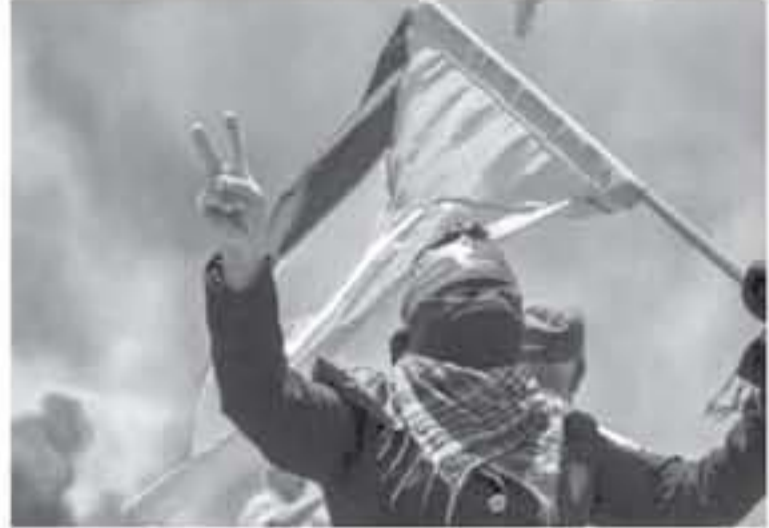
الغاز المسيلة للدموع

وارتكب الجيش الإسرائيلي، يومي الاثنين والثلاثاء الماضيين، مجزرة بحق المتظاهرين السلميين على حدود قطاع غزة وقتل فيها 16 فلسطينياً وجرح 318 آخرين، بالرصاص الحي والمطاطي وقنابل