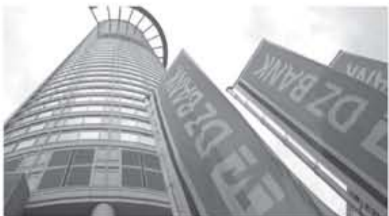
مئذنة بنك DZ (إيران). وكنت توتال الفرنسية الأسبوع الماضي أنها ستنتهي أعمالها في إيران بعد فرض العقوبات الأميركية.

الثوري مع طهران. وكانت أي بي سي موتر-ميرسك، أكبر شركة شحن الحاويات في العالم، قد قالت الخميس إنها ستعلق نشاطها في إيران امتثالاً للعقوبات التي أصدرت الولايات المتحدة فرضها على إيران بعد انسحابها من الاتفاق النووي المبرم مع طهران.