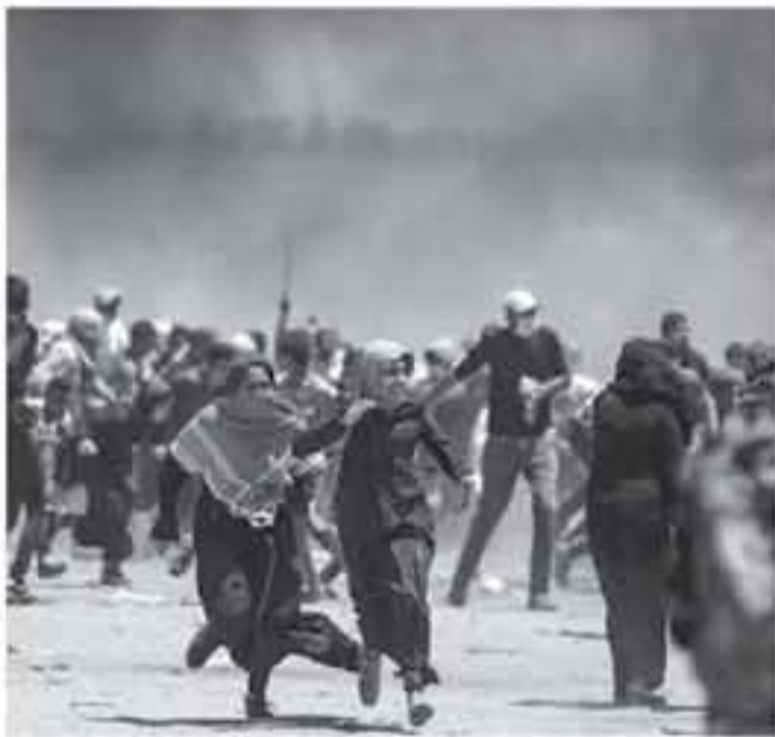
رام الله - معا

ضد الظلم والمظالم". مشددة على أن مثل هذا القرار يرسل رسالة واضحة وقوية لإسرائيل بأن هناك ممنا تدفعه مقابل ممارساتها الأحادية، وانتهاكاتها لحر الفانونية والأخلاقية. واستهجت عشراوي موقف الدول التي صوتت ضد هذا القرار وعلى وجه الخصوص الولايات المتحدة الأمريكية وأستراليا وقالت: "إن التصويت ضد هذه القرار لصالح إسرائيل على حساب حقوق وحياة الشعب الفلسطيني، والضرب بعرض الحائط بجميع قرارات الشرعية الدولية والقانون الدولي والديمقراطية وحقوق الإنسان، يؤكد على تواطؤ هذه الدول مع الاحتلال ومساهمتها في خلق حالة من عدم الاستقرار في المنطقة وخارجها..