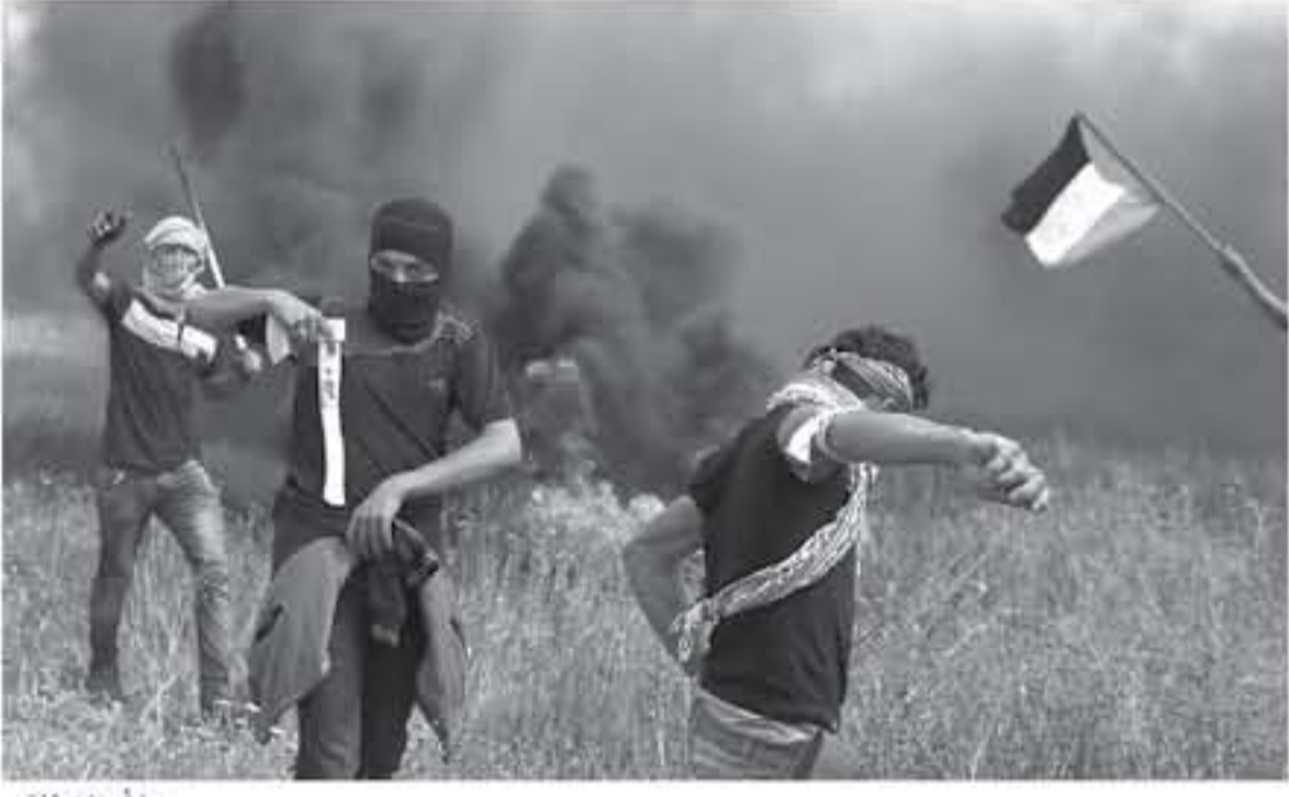
من أحداث غزة

دعا ائتلاف الأحزاب القومية واليسارية في الاجتماع الدوري أمس السبت الأحزاب والقوى والمؤسسات العربية التي لتعمل دورها بدعم نضال وصمود الشعب العربي الفلسطيني. وقال الائتلاف في بيان ان الشعب العربي الفلسطيني يواجه مرحلة من أخطر المراحل التي يمر بها النضال الوطني التحرري، والتمثلة بنقل السفارة الأمريكية من القدس المحتلة، وتصفية الحقوق الوطنية الثابتة للشعب العربي الفلسطيني عبر البحث عن بدائل وسيناريوهات تكريس الاحتلال الإسرائيلي للأرض العربية. وأكد البيان الحقوق الوطنية الثابتة للشعب الفلسطيني، وفي مقدمتها حق العودة الذي كان العنوان الرئيس في مسيرة العودة بالذكرى السبعين للنكبة، مستكرا في الوقت نفسه إنجازات الحركة بحق أبناء الشعب العربي الفلسطيني المشاركين في مسيرة العودة.