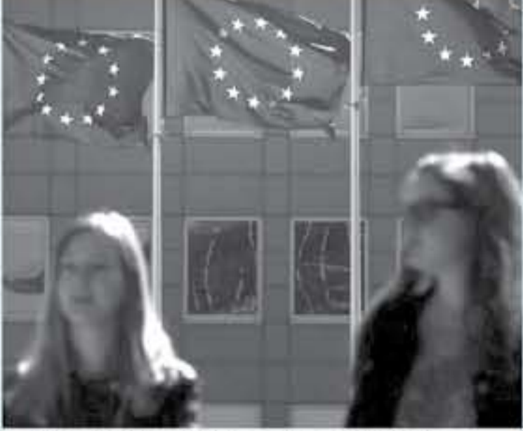
مقر الاتحاد الاوروبي في بروكسل في 10 ايار/مايو 2018. عسكرية اسرائيلية

ويغترض ان يلتقي كاتيتي ايضا وزير البيئة غيمس كلانثري ووزير النفط بيجان نمدان زنتف. وسيجري المفاوض الاوروبي الاحد محادثات مع وزير الخارجية الإيراني محمد جواد ظريف. ويستور المفاوض الاوروبي ايران ليعرض الاجراءات التي قفزها الاتحاد بما يتفق مواصلة المبادلات التجارية مع طهران. وهو يأمل في التخلي في الحصول على تأكيد لثغرة القادة الإيرانيين في عدم الانسحاب من الاتفاق النووي. وتبلغ قيمة المبادلات التجارية بين ايران والاتحاد الاوروبي 20 مليار يورو. واشترت ايران في 2017 سلعا بقيمة عشرة مليارات يورو من الاتحاد الذي بلغت قيمة وارداته عشرة مليارات يورو بينها تسعة مليارات من النفط. والدول المستوردة الست الرئيسية من ايران في الاتحاد هي اسبانيا وفرنسا واطاليا واليونان وهولندا والمانيا. وتنتج ايران 38 ملايين برميل من النفط يوميا. وتنتشر الصين سيمين بالغة من انتاجها واوربا عشرين بالمئة. كما تلحق ايران ثاني أكبر احتياطي من الغاز في العالم، لكن الجزء الأكبر من انتاجها مخصص للاستهلاك المحلي. أما الصادرات فهي ضئيلة في غياب البنى التحتية اللازمة.