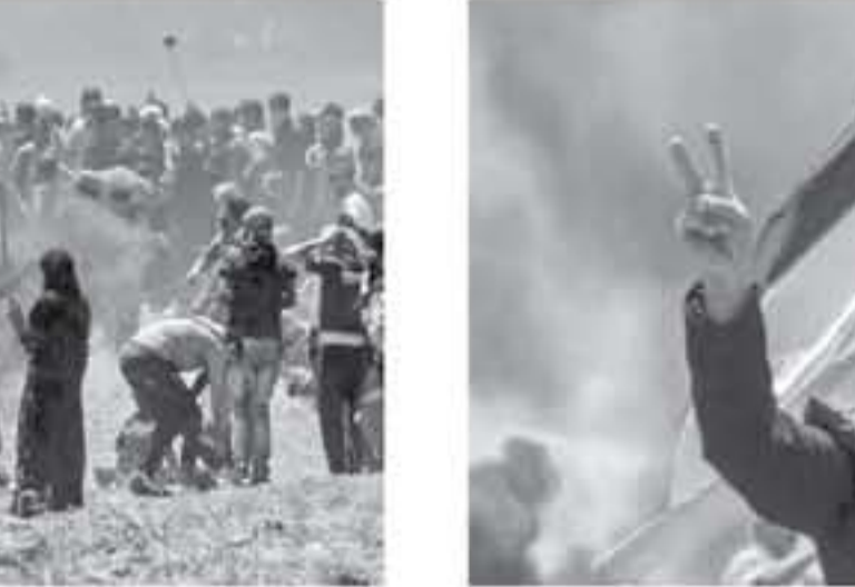
فتح معبر كرم شالوم، رغم الأضرار