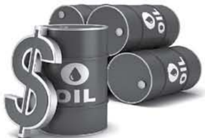
وقال وزير الخزانة الأمريكي ستيف منوتشين الأحد إن أكبر اقتصادين في العالم انغفا على التخلي عن التهديد برفض رسوم فيما يعكسان على التوصل

زادت أسعار النفط أمس الاثنين في الوقت الذي تتعاقب فيه الأسواق مع آباء لتهدد بنشادي الصين والولايات المتحدة حربا تجارية كانت فلوخ في الأفق بين أكبر اقتصادين في العالم. ويحول الساعة ١٤:٥٠ بتوقيت جرينتش ارتفعت العقود الآجلة لخام القياس العالمي مزيج برنت إلى ٧٧.٠١ دولار للبرميل بزيادة ٥٥ سنتا أو ما يعادل ٠.٧ بالمئة بالمقارنة مع سعر إغلاق السابق، وتجاوز برنت ٨٠ دولارا للبرميل لأول مرة منذ نوفمبر تشرين الأول ٢٠١٤ الأسبوع الماضي. ويقتع العقود الآجلة لخام عرب تكساس الوسيط الأمريكي ٧٦.٧١ دولار للبرميل مرتفعة ١٣ سنتا أو ما يعادل ٠.٦ بالمئة من سعر آخر نسوية.