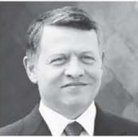
عمان - بترأ

حضر الملك عبدالله الثاني، القائد الأعلى للقوات المسلحة، برفاقه سمو الأمير الحسين بن عبدالله الثاني ولي العهد، أمس مأدبة الإفطار التي أقامتها القيادة العامة للقوات المسلحة الأردنية.