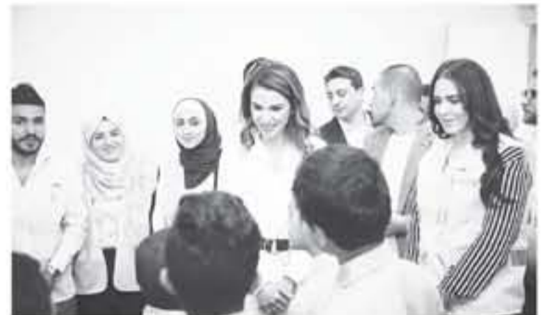
عمان - الأنباط

زارت الملكة رانيا العبدالله أمس، جمعية دار الأيتام الأردنية في ماركا وتجوّلت في مرافقها، والتقت مع عدد من متطوعي مؤسسة نشمي للعمل الشبابي والتي تلقت مبادرة في الجمعية.