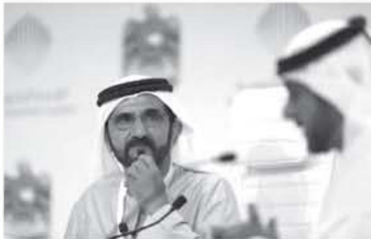
لدى ٥ سنوات، وإقامة لمدة ١٠ أعوام للطلاب كما تتضمن لوجيات مجلس الوزراء مراجعة نظام الإقامة لتمديد مهل الإقامة أصحاب التوق الاستثنائي.

ذكرت وكالة أنباء الإمارات (وام) أن مجلس الوزراء وافق على خطوات تسمح بتملك المستثمرين الأجانب شركات مضرها في الإمارات بنسبة ١٠٪ بحلول نهاية العام. وقالت الوكالة إن هذا القرار جزء من تقرير أوسع للنظام يتضمن منح تأشيرات إقامة تصل لـ ١٠ أعوام للمستثمرين، لهم وجميع أفراد أسرهم. بالإضافة فتح تأشيرات إقامة تصل لعشرة أعوام للكفاءات المتخصصة في المجالات العلمية والعلمية والبحثية والتقنية وكافة العلماء والمبدعين والمهنيين. كما تتضمن الأنظمة الجديدة أيضا منح تأشيرات للطلاب الممارسين في الإمارات