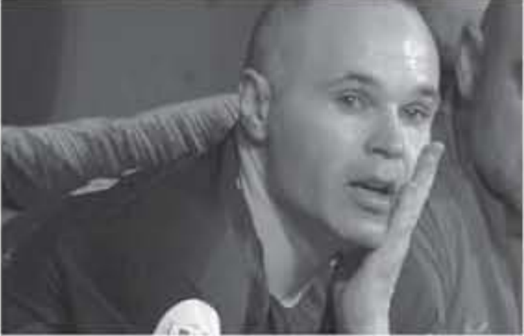
مدرية - وكالات