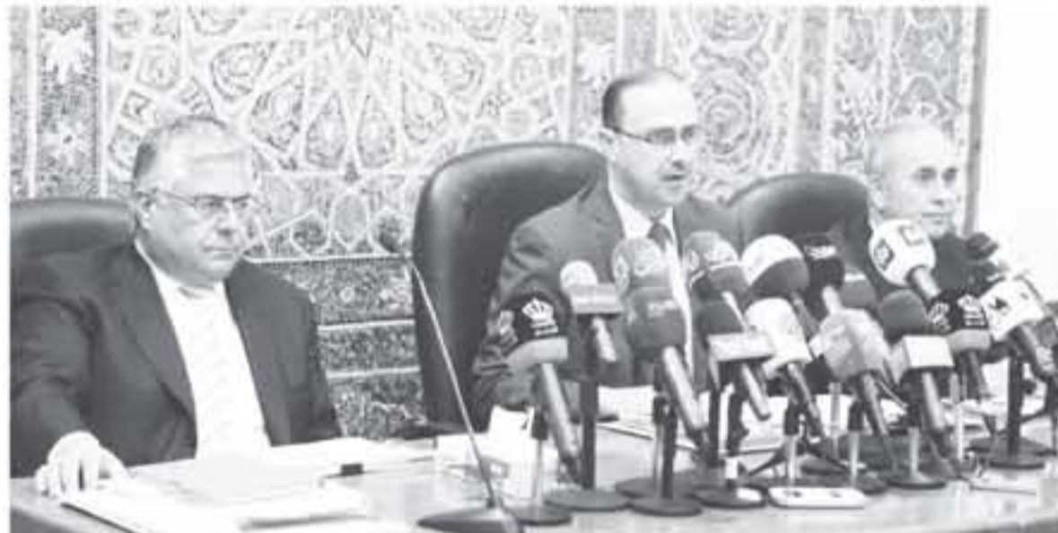
عمان - الأنباط - علاء علقان

أكد رئيس الوزراء هاني الملقى على انتهاء النقاش الحكومي حول مشروع قانون ضريبة الدخل أمس الاثنين وقرب الانتقال لمرحلة الحوار مع مجلس النواب حول القانون.