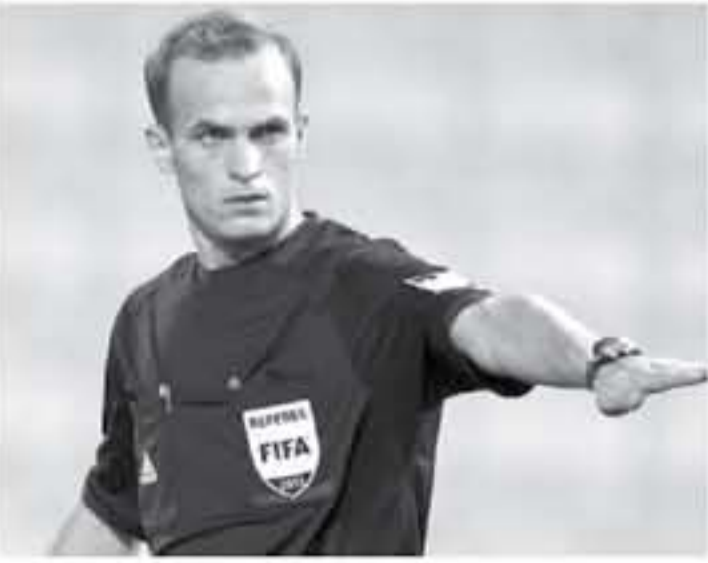
عمان - الأنباط