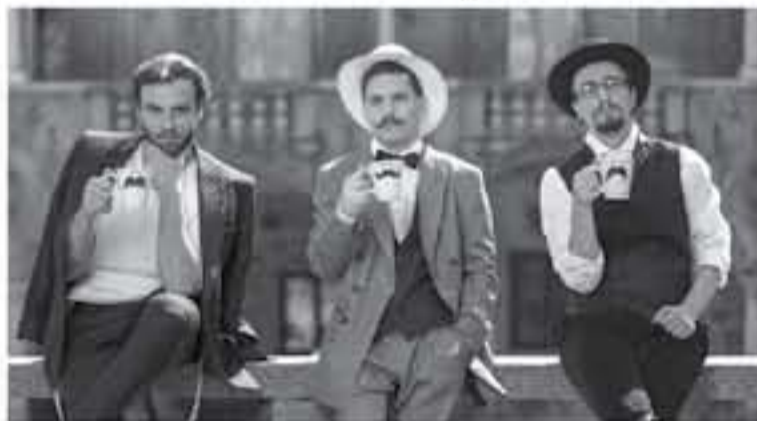
اليومية للعمالقة الثقافي الثلاثي وهم المهندس المعماري جويس بيليك، والشاعر والكاتب إيفان كانكار والرسم واهارد جاكوبيتش. حيث كانوا يعنون بشاربيهم بشكل ملتصق مع تميزهم بالتمسك بالبدعي الشجاعة في طرح الأفكار الجديدة بما جعلهم يتكروا

تنظم ليوبليانا للسياحة صعداً من الجولات الثقافية، والتي تمكن السياح القادمين من دول الخليج والشرق الأوسط من الحصول على تجربة أصلية للتعرف على التاريخ الغني وتقاليد العاصمة السلوفينية الخضراء ليوبليانا. حيث أطلق متفاني الرحلات في المدينة أحدث الجولات السياحية الفريدة تحت عنوان "موستاش تور" المصممة لعرض تجارب حياة ثلاثة من الفنانين المعالفة: يوهان ليمبو، مور ريسبي في التاريخ السلوفيني إلى جانب أنهم كان لديهم قصص مشتركة في الجانب الفني. وفقاً للتقاليد الاجتماعية فإن جولات "موستاش تور" هي ذات شهرة واسعة في سلوفينيا وبالأخص في شهر مايو، وتنتد حتى أواخر أكتوبر من كل عام. وتكشف مسارات هذه الرحلات الداخلية في