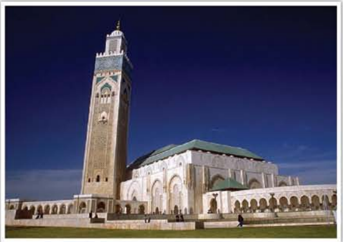
رصد جنانة خنفر

صدى ترتيل الأبيات مع صوت ارتطام الأسواج على الصخر تملو بك في جو روحاني يجعلك تدبر في مكوناته وخلقه. شخصية ما يسفر في المشرق بـ "السحرائي" لا تزال حاضرة عند المغاربة الذين يسمونه بـ "الفلان" نسبة كبرى، يضرب ليستنفر الناس للاستيقاظ لثوبه السحور، وغالباً ما يتواجد في الأحياء والأزقة العتيقة، ويؤبى عنه في اندك الكبري صوت طغفان المدفع لحظة مغيب الشمس معلناً عن وقت الإفطار، وطلقة قبيل الفجر إيداناً بوقت الإسعاد عن الطعام.