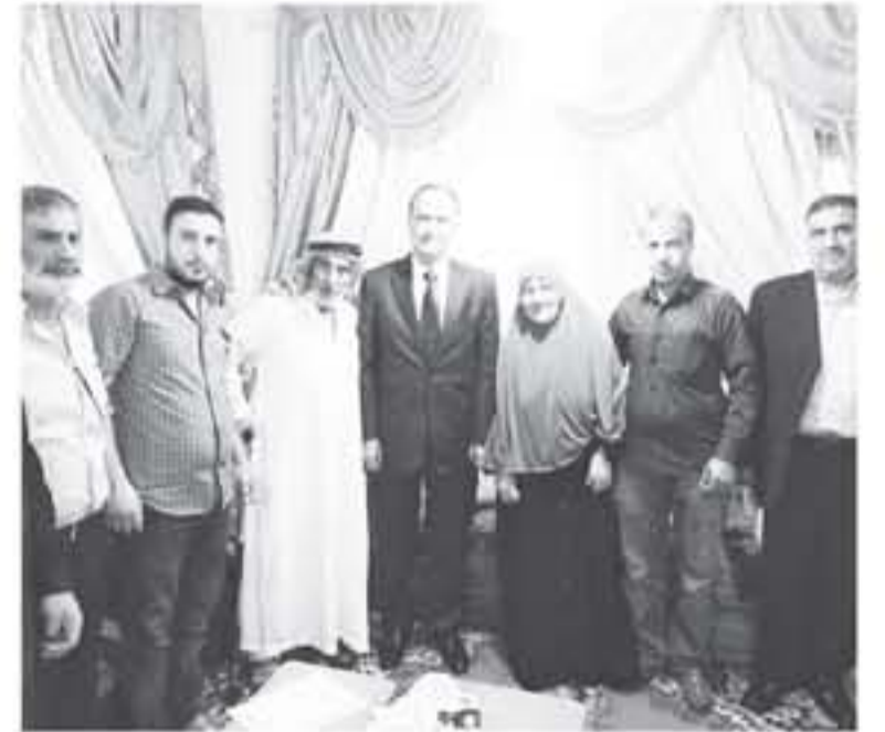
الكرك - بترا

مندوب عن رئيس الوزراء الدكتور هاني الملقى، قدم نائب رئيس الوزراء وزير المولة لشؤون رئاسة الوزراء جمال الصرايرة واجب العزاء لتذوي شهداء صوامع العقبة الذين قضوا نتيجة إضرع انفجار في تلك الصوامع وأكد الصرايرة خلال اللقاء الذي جمعه بتذوي أربعة متوفين من أبناء الاغوار الجنوبية في نادي غور الصلابة أن الحكومة ستلتزم جميع الإجراءات التي من شأنها التعامل ومتابعة حقوق العمال قانونيا وقضائيا عقب التأكد وجمع المعلومات للوصول الى الحقيقة ومعرفة التسبب ولقدت إلى أن الألسان الأردني هو الثروة الحقيقية للوطن ولتصدر الاساسي لتحقيق التنمية الشاملة ودفع عجلة الاقتصاد الوطني وتجاوز التحديات التي يواجهها الوطن مبينا أن الحكومة ستسعى جاهدا للوقوف على مجريات التحقيق ومتابعة تداعيات هذه القضية التي أودت بحياة ستة من أبناء الوطن، إضافة إلى إصابة عدد آخر وتعمل وفق الأطر القانونية لتكثيف أهل العمال اتقوفين من ثيل حقوقهم من خلال القنوات القضائية. وشدد على أن الأردنيين متساوون في