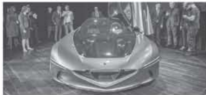
باريس - وكالات

ما أصبح يوفره معطم صانعي السيارات في طرازاتهم الاختيارية شهيداً لإزالة المرايا الجانبية من السيارات الإنتاجية واستبدالها بكاميرات جانبية في المستقبل القريب إن شاء الله. وتسيّرت هذه السيارة الكورية بحصولها على شهادة أمامية بحفظ لوهلة تعتقد أنها سيارة كورفيت ZR١ التي سبق جريبها زميلنا صوب شعشاعة، ولكنه يتميز بكونه زجاجي شفاف يظهر ما يوجد أسفله، وحصلت السيارة من الجوانب على إطارات لتليق بكونها سيارة اختبارية تحيط بها عجلات رياضية، وحصلت على أبواب يتم فتحها للأعلى بالاعتماد على بصمة اليد فلا يوجد لها مقابض، ويتم إغلاق الأبواب التي تتفتح للأعلى بشكل أوتوماتيكي. داخلية هذه السيارة الاختيارية من جينيسيس حصلت على كسوة جلدية فاخرة وزخارف من الكاربون فايبر بالإضافة إلى لمسات من الألومنيوم، وزودت بشاشة عدادات رقمية قياس ٨ إنش وشاشة ضخمة معتمدة لنظام الترفيه والمعلومات، ومفود يليق بسيارة غير مخصصة للإنتاج التجاري.