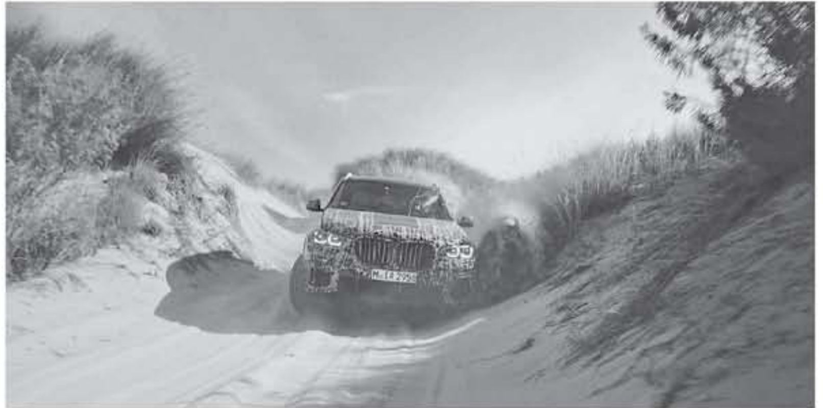
ميونخ - وكالات

تستعد شركة بي ام دبليو الباطارية لتقديم الجيل الرابع من سيارات ال SAV - Sport Activity Vehicle - بي ام دبليو اكس ٢٠١٩ ٥ الجديدة كلياً. وتشوقنا نشرت فيديو جديد على اليوتيوب يظهر جزء من الاختبارات التي قامت بها هذه السيارة القادمة. الفيديو يوضح قيام نسخ تجريبية من طراز بي ام دبليو اكس ٥ - BMW X٥ مع ٢٠١٩ القادمة باختبارات في تضاريس مختلفة تضمنت الرمال