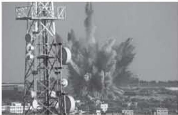
غزة - رويترز

وقتل القوات الإسرائيلية بالرصاص 115 فلسطينياً على الأقل وأصابت الآلاف خلال الاحتجاجات وهو ما لا يحسب استنكاراً من دول عديدة. ولم يصعب أي إسرائيلي على الحدود مع قطاع غزة لكن إسرائيل قالت إن أراضي زراعية على الجانب الإسرائيلي من الحدود تعرضت لأضرار بالغة بفعل إطلاق طائرات ورقية محملة بصواريخ حارقة من القطاع وتقطع غزة لسيطرة حركة المقاومة الإسلامية (حماس) لكن حركة الجهاد الإسلامي تشد بصوتها مستقلة نوعاً ما عن حماس. وأعلن الجيش الإسرائيلي مقتل جندي يوم السبت متأثراً بإصابته أثناء مناهضة في الضفة الغربية المحتلة يوم الخميس حين ألقى فلسطينيون لوجاً حجرياً على رأسه من أحد المباني، وحضر مئات جنازة الجندي في القدس يوم أمس الأحد.