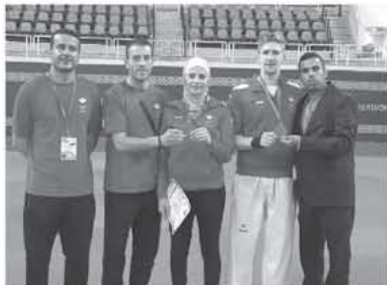
الرجال والسيدات لكل من زيد مصطفي والذاتي الحميدي بفارق في العمر يصل الى ١٠ سنوات وقدم الصراف شكر الطاقم الإداري والتدريسي واللاعبين على الثقة الكبيرة التي قدمتها لهم أسرة الاتحاد الأردني برئاسة سمو الأمير راشد بن