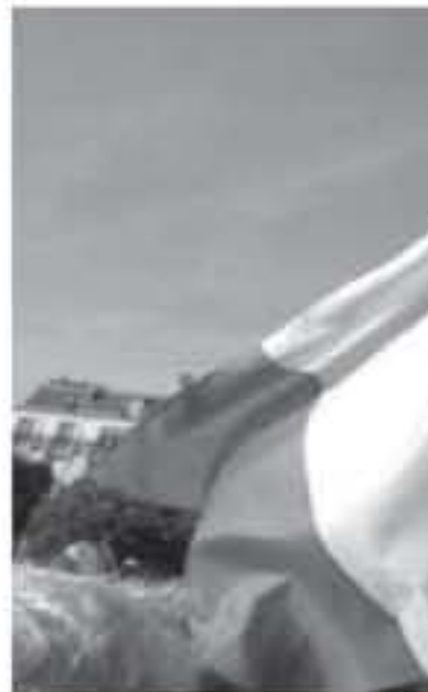
بيرون الحركة الصهيونية حركة لتحرير الشعب اليهودي.

حقيقياً في منطقة الشرق الأوسط، والكثيرون لا يرون دولة ديمقراطية أو دولة علمانية، في وقت أكد أكثر من 59% ممن أجري عليهم الاستطلاع بأنهم