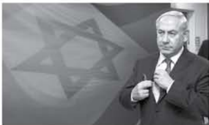
بيت لحم - معا

حول تعاملات له مع أكبر شركة للاتصالات في واحدة من بين ثلاث قضايا فساد تخيم على مستقبله السياسي. ويشتهر بأن نتياهو قد منح امتيازات لشركة "بيوتك" للاتصالات مقابل لخطبة إعلامية إيجابية له في موقع إخباري يملكه صاحب الشركة، فيما نفى نتياهو ارتكابه أي مخالفة قائلاً إنه "ضحية للاضطهاد". وفي التحقيق الأول الذي يعرف باسم القضية 1000، يشتهر بأن نتياهو تلقى رشى في شكل هدايا من رجال أعمال أصدقاء، وقالت الشرطة إن الهدايا قيمتها حوالي 300 ألف دولار.