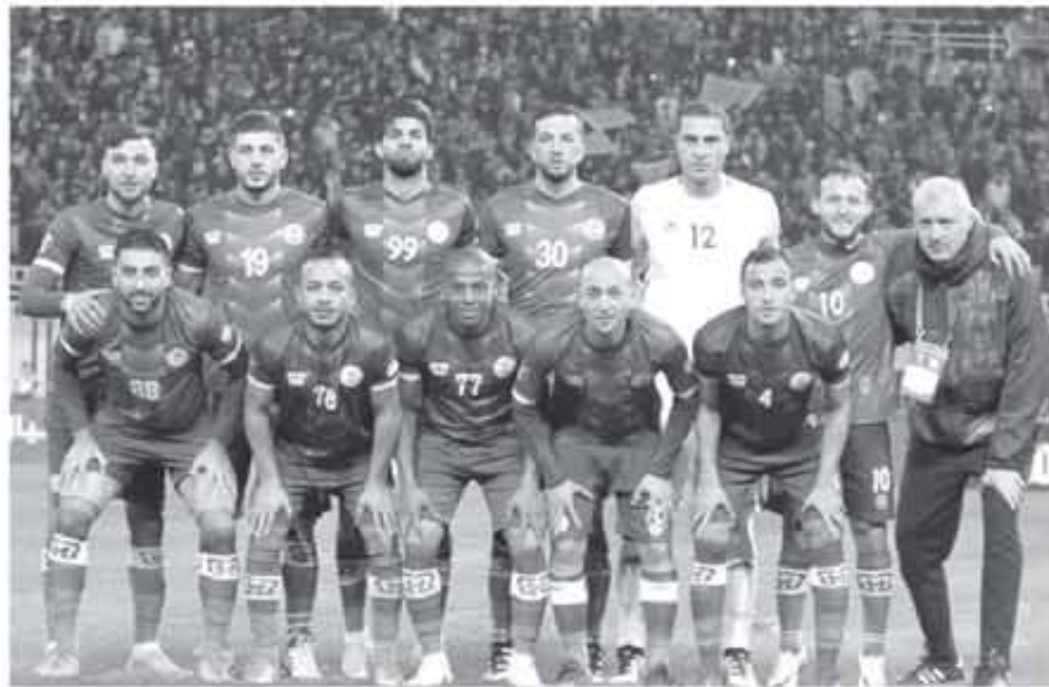
يسشارك بها النادي معنلا لكرة القدم الاردنية.