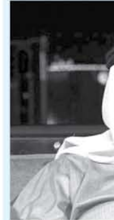
وزير خارجية البحرين

وتابع آل خليفة، "لنكن واضحين، القدس الشرقية عاصمة فلسطين كانت هناك أحياء بسيطة في الجهة الغربية التي احتلت في 1948، لكن قلب التنازع الذي حدث الآن، فإن مطالب العرب في