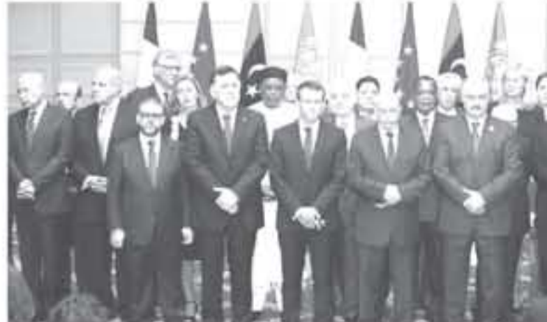
وزير الشؤون الخارجية والتعاون الدولي المغربي ناصر بوريطة. خلال مشاركته في اجتماع باريس

الصراعات بين الأشقاء الليبيين، مؤكداً على التزام المغرب بإيجاد حل سياسي لوطني دائم يسمح لليبيا باستعادة استقرارها. في إطار وحملتها غير القابلة للتجزئة، وساهماتها غير القابلة للتلف وسلامتها الإقليمية الكاملة. وتوجه الوزير بوريطة أن المغرب كان وسيظل إلى جانب ليبيا وشعبها، كما أن المملكة ليست لديها أية أجندة خفية، ولا مصالح غير مصالح ليبيا نفسها، وهي العودة إلى طريق السلام والاستقرار والتنمية. مشيراً إلى أن المغرب الكبير في حاجة إلى ليبيا مستقر، وأوروبا في حاجة إلى مغرب كبير مستقر.