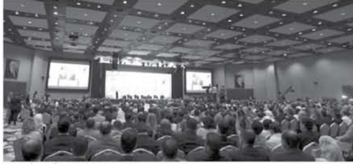
من مؤتمرا المغترين الأردنيين (أرشيفية)

لم يلعب المغتراب الأردني أي شيء على أرض الواقع منذ انعقاد المؤتمر المخصص للمغترين الأردنيين في الخارج في العام ٢٠١٥، بالرغم من التوهيات التي خرج بها المشاركون في هذا والذي حمل شعار "الأردن يجمعنا".