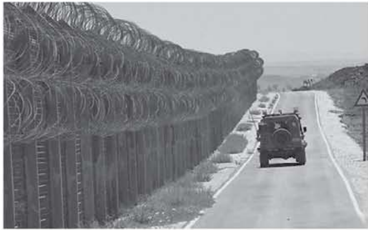
دمشق - في المقابل، بيّنت الصحيفة أنه ليس من الواضح ما إذا كان هذا التطور يمثل جزءاً

من خطوات أوسع نطاقاً لفرضي إلى سحب القوات الموالية لإيران من جنوب سوريا أو تدبيراً مؤقتاً لتجنب استعادة الجيش السوري السيطرة على درعا.