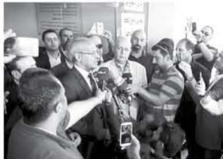
حاملنا وانه شكل استنزافا للشعب، وانه تم تدارك الخطأ الذي وقعت به الحكومة وشهد على حق المواطنين بالتعبير بقرار ملكي.

بالطرق السلمية والحضارية، وقال رئيس مجلس النقباء ان مجلس النقباء قرر الاستجابة لدعوة رئيس مجلس النواب م.عاطف الطراونة لعقد اجتماع في المجلس بحضور رئيس الوزراء ه.عاني اللقي السيد.