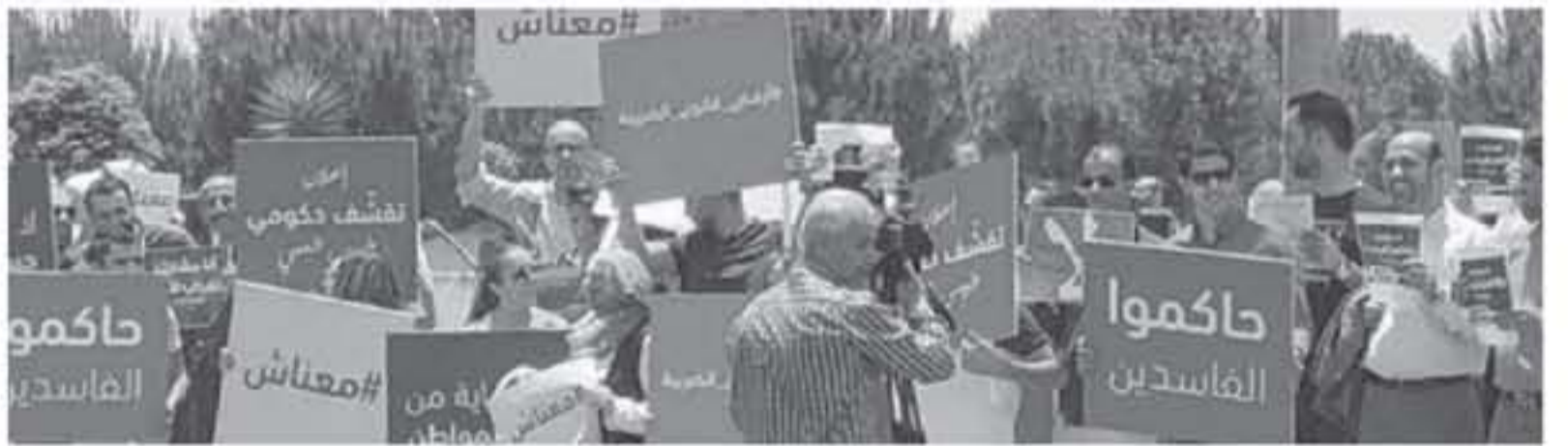
عمان - الأنايط

شهدت عدة من محافظات المملكة بعد صلاة العشاء أمس الأول، ولفات احتجاجية ضد مشروع قانون ضريبة الدخل. وطالب المحتجون بالحوار للوصول إلى توافق حول مشروع القانون والتخلي عن سياسة رفع الأسعار وتحصيل المواطنين اعباء اضافية لا يستلزم احتمالها ويجاد بدائل ترفع الخزينة دون التأثير على مستوى معيشة المواطنين. كما طالب المحتجون بإجراء تصحيح اقتصادي بعيدا عن الإجراءات الضريبية وبما يوفر الحياة الكريمة للمواطنين، والتنازل عن سياسة تخفيضية للاقتصاد بدلا من سياسة رفع الأسعار. وقالوا ان مشروع القانون يؤدي الى اضعاف القدرة الشرائية للمواطن وزيادة اعبائه المالية والعيشية. وبع السباق وجه وزير المالية سبيل مبيضين العاملين بالأجهزة الأمنية للاستمرار في التحلي بأقصى درجات ضبط النفس واحترام المواطن واحترام حقوقه.