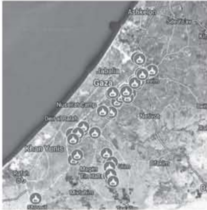
حقول المستوطنات التي طالتها نيران غزة

فعايات مسيرة العودة وكسر الحصار التي انطلقت في 30 مارس الماضي بإطلاق مئات الطائرات والبالونات الحارقة تجاه المستوطنات والواقع العسكرية الإسرائيلية. وأدت هذه الحرائق لحسائر كبيرة في محاصيل وممتلكات المستوطنين الذين ضجوا من فشل الاحتلال في التصدي تهمة الظاهرة السلمية. وصباح أمس اندلع حريق في حقول منطقة "كيبوفيم" شرق بلدة الفرارة جنوب قطاع غزة بفعل طائرة وردية حارقة، فيما اندلعت الشيران أمس الجمعة في نحو 11 نقطة بمستوطنات غلاف قطاع غزة بسبب هذه الطائرات والبالونات.