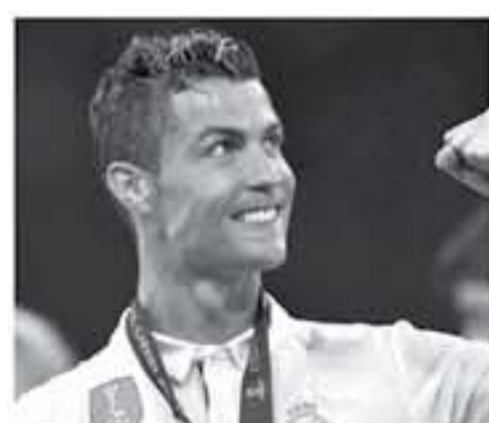
عن كريستيانو رونالدو، وأنه يعتمد على قيمة الشرف الجزائي في عقده والتقدمه بامبار بورو، تقع من الرحيل، وعدم الاستجابة

لرغبة في تسعين عقدا، وختمت الصحيفة بأن ريال مدريد لا يريد تحسين عقد رونالدو، وهو في عمر 33 عاما، بالرغم من مستواه الرابع في التاسم الأخير المشترك كريستيانو رونالدو، أن يكون اللاعب الأعلى أجرا في العالم، للبقاء في صفوف الملكي، وأكدت صحيفة "موندو ديبورتيفو" أن رونالدو طالب أن يكون راتبه السنوي 80 مليون يورو في الموسم الواحد، وأشارت إلى أن عقد رونالدو، كديه 3 مواسم في عقده مع الريال، لكنه لن يستمر في العاصفة الإسبانية إلا إلى وقت، الإفادة على طيبه، بالتحصول على 210 مليون يورو خلال تلك الفترة.