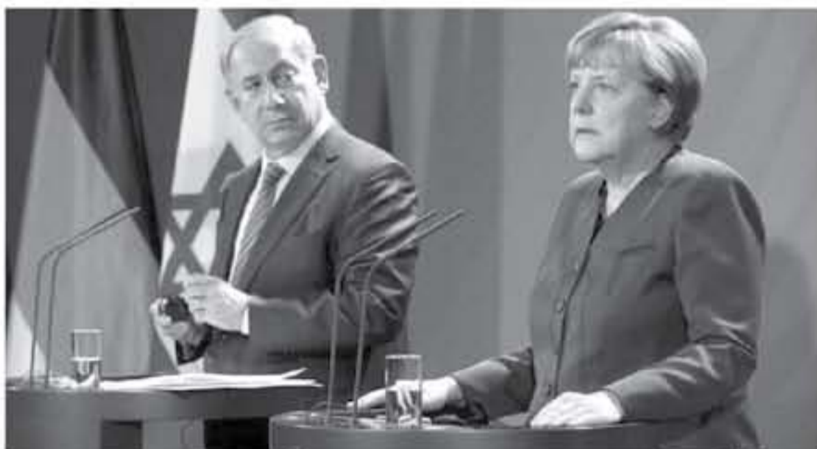
ليتل، بنيامين نتانياهو زور ألمانيا في وقت مشغول سياسيا. والشرق الأوسط بتغير بصفة إزماتيكية. والشرق الأوسط بتغير بصفة إزماتيكية. والشرق الأوسط بتغير بصفة إزماتيكية.

المحافظة يمتدأ عليه بآن واحد معاداة سامية تبقى متأصلة لدى كثير من الحكومات اليمينية في أوروبا الشرقية. وبصفة ناقضية يمتزج على هذا النحو موقف مؤيد للصهيونية بدوافع معادية للسامية. بنيامين نتانياهو سياسي متبر للجدل متقدده وتهموه بأنه يبرز بقوة التهديد من الخارج ليقاوم أخليا. كيف تتطرون إلى هذا الاتهام؟ من ناحية يكون هذا الاتهام في محلها. وبالجملة أنه هو "سيد الأمن" في إسرائيل يمكن لنتانياهو فعلا إقناع ناخبين. وهذا ما رأيناها بوضوح في الحملة الانتخابية الأخيرة. فعندما كان يوشك على خسران الحملة الانتخابية، استخدم ورقة الأمن وهذه الورقة تتضمن أن هناك حاجة إلى عدم تشل جزئيا في الفلسطينيين الإسرائيليون ثم أيضا إيران. فنتانياهو يتحرق إلى لعب هذه الورقة. من ناحية أخرى لنتانياهو منتزج بوجهة نظره فانتقاده للاتفاقية النووية مع إيران يتم عن الشاعرة الحقلية من أن الاتفاقية سببها إسرائيل. حتى ولو أن الأوروبيين ينظرون باختلاف لهذه المسألة زميل إسرائيلي يميز بدقة عن التقييم المتباين للإسرائيليين والأوروبيين بشأن المخاطر المحتملة بإسرائيل عندما يقول ليس لأننا منقسمو الشخصية، هذا لا يعني بأنه لا يتم مطاردتنا. وبالتالي فإن لنتانياهو يكسب بانتقاله اللغوي أصوات ناخبين. ومن ناحية أخرى فالفضيحة جد هامة بالنسبة إليه.