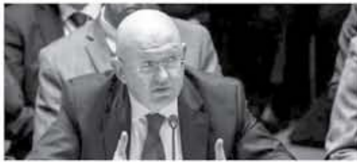
موسكو - صفا

ودكر مندوب الروسي بأن أمريكا التي عدت مرارا الدول الأعضاء في مجلس الأمن إلى تبني مواقف متوازنة إزاء أزمة الشرق الأوسط، هي نفسها التي انتهكت هذا التوازن بشروطه الفرضية. وأعرب عن قلق موسكو إزاء رفض الجانب الأمريكي إدخال فترات إلى مشروعها لتدعو إلى تهينة الظروف لاستئناف المفاوضات الإسرائيلية الفلسطينية، "مهدياً لتحقيق تسوية دائمة على أساس حل الدولتين، إسرائيل والفلسطين، المتعاضدين امتنحين وفي حدود معترف بها دولياً، وفق تعبيره. وأشار إلى أن التسوية الأمريكية خلا حتى من ذكر المبادرة العربية وريادة الوسطاء الدوليين التي ترقى أية وساطة هويدية ومصدق عليها من قبل مجلس الأمن، داعياً المجتمع الدولي إلى القيام بـ"خطوات عملية على إطلاق مفاوضات فلسطينية إسرائيلية مباشرة.