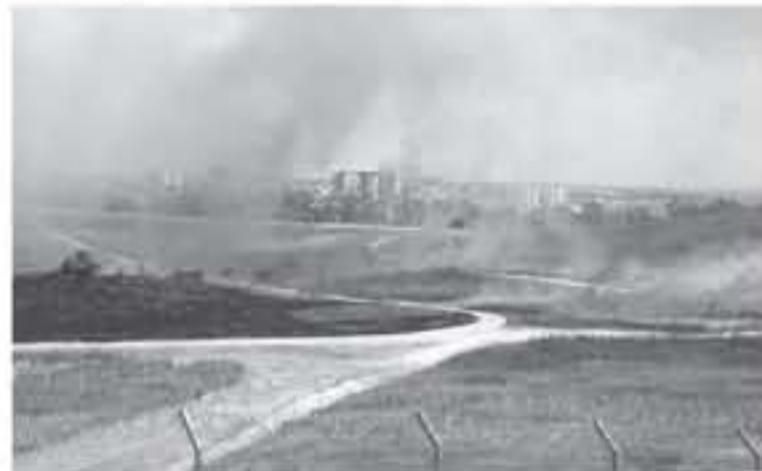
حرق المستوطنات الغربية بأن الطائرات الوردية والبالونات المتشعلة التي أطلقها مواطنون فلسطينيون من قطاع غزة تسببت بعدة أضرار، أو المظاهرات التي تنظمها فوق الأرض بالقرب من السياح الحدودي في غضون ذلك أحداث وسائل الإعلام

من الحرائق على طول المنطقة الحدودية مع القطاع. وأضافت أن أربع طائرات إطفاء و14 طاهم إطفاء تتشارك بإخماد حريق كبير شبه في المحمية الطبيعية "كروية" بسبب الطائرات الوردية المتشعلة، كذلك تدخل سلاح الجو الإسرائيلي لمنع وصول الشيران إلى المدينة الزراعية في مستوطنة "تليف عسرا" بالقرب الغربي.