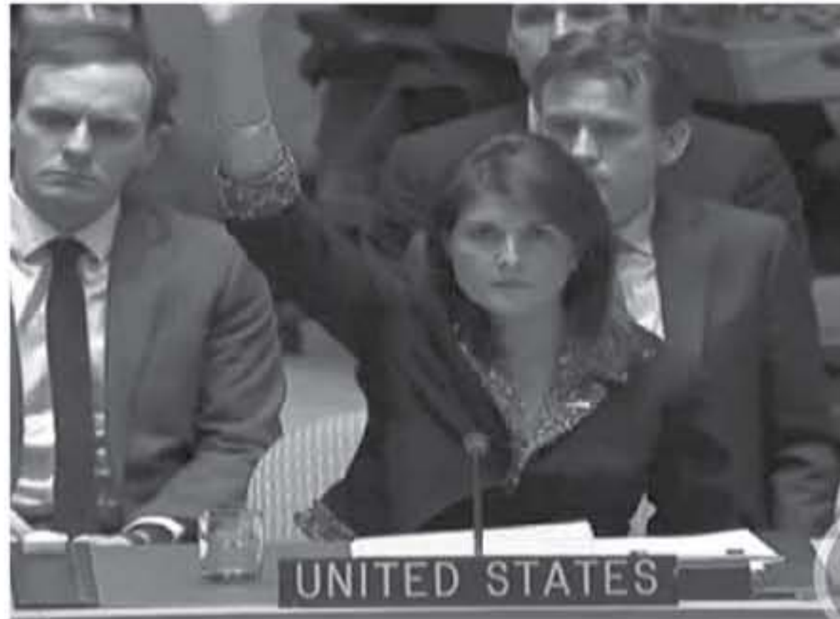
الوطنية والقسم العربية، الذي سيؤدي إلى تحقيق الأمن والاستقرار، وإقامة الدولة الفلسطينية المستقلة وعاصمتها القدس الشرقية بمؤسساتها وتاريخها وثراثها. السلام، الطريق الوحيد لتحقيق السلام العادل والدائم يتم فقط من خلال الالتزام بقرارات الشرعية العربية والدولية، المتصلة بقرارات القيادة الفلسطينية، والقرارات المجلس