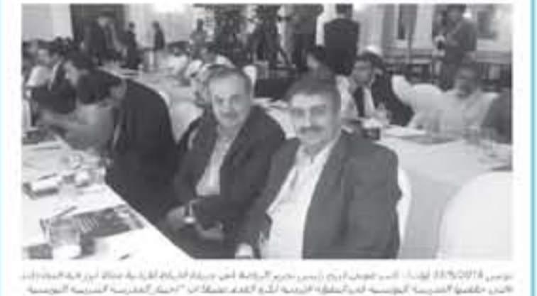
تونس 2018 14 22 19:02:01 الوزير التونسي السيد وزير التربية في زيارة لقيادة لجمعية شباب اربد الرياضية

اختيار المدرسة التدريبية التونسية من قبل انديتنا يؤشر في الاتجاه الصحيح (جريدة الانباط الاردنية)