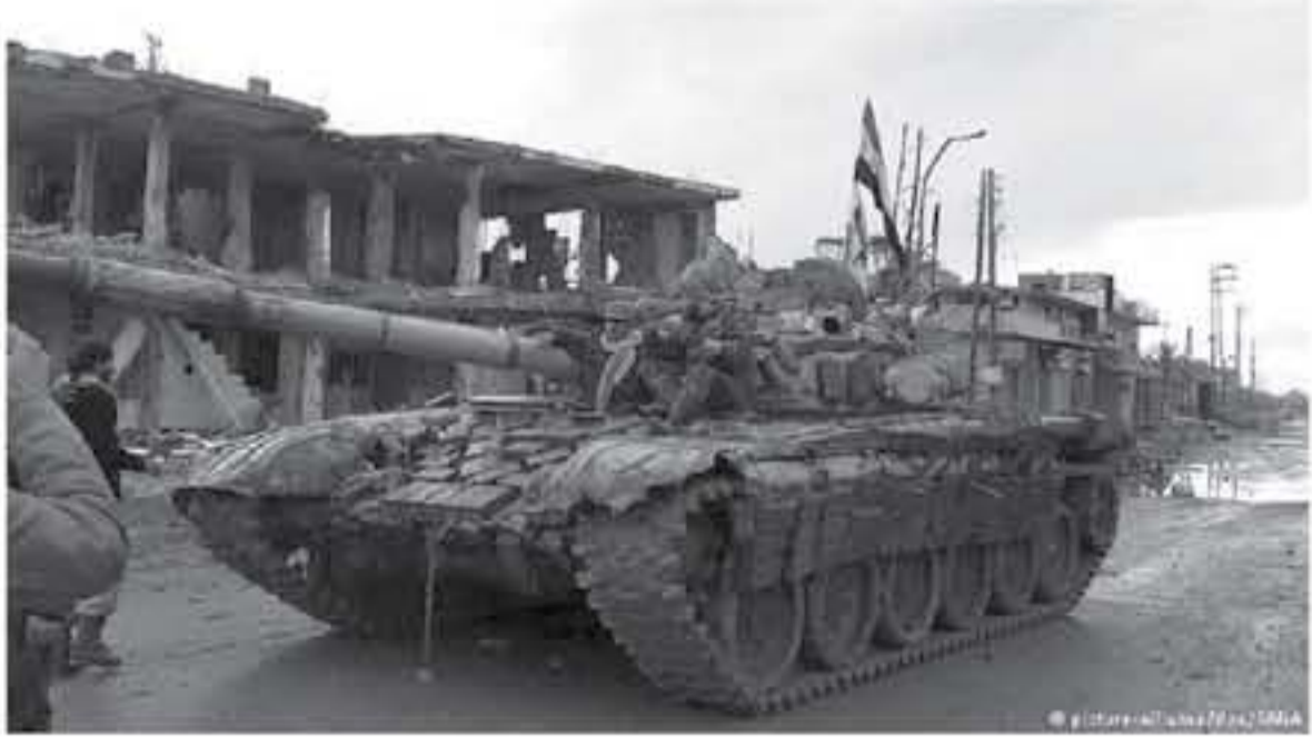
بقيادة وزير الدفاع الروسي سيرغي شويغوف مع نظيره الإسرائيلي أفيمور

سابق أن إيرانيين يعملون في المنطقة قرب حدودها، ودعت موسكو إلى إبقاء القوات الإيرانية وحلفائها بعيدا عن الحدود. وقالت روسيا الأسبوع الماضي إن قوات الجيش السوري فقط هي التي يجب أن تكون موجودة على الحدود الجنوبية للبلاد مع الأردن وإسرائيل. وتفيد تقارير منذ أسابيع بأن هدف النظام السوري التقيل سيكون منطقتي الجنوب وهي إحدى منطقتين كبيرتين متباعدتين تحت سيطرة المقاتلين الذين يسعون للإطاحة بالرئيس بشار الأسد. وتقول واشنطن إن أي هجوم في المنطقة سينتهي وفقا لإطلاق النار في هذا الجزء من سوريا لوسط فيه مع موسكو وحذرت من أنها ستتحرك "إجراءات صارمة" لتهدد وسيظهر مقاتلو المعارضة على مساحات في جنوب غرب سوريا بمحاولة مرتعرات الحدود التي تحتلها إسرائيل، فيما تسير قوات الجيش السوري وميليشيات مسلحة مؤيدة لها ومدعومة من إيران على مناطق بالقرب منها.