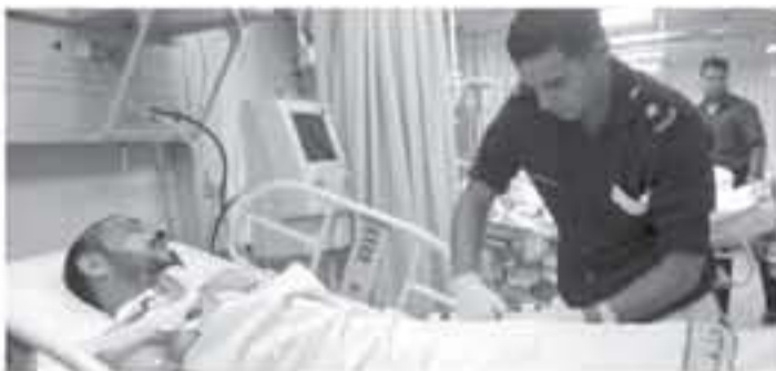
أحد جرحى غزة يتلقى العلاج في الأردن