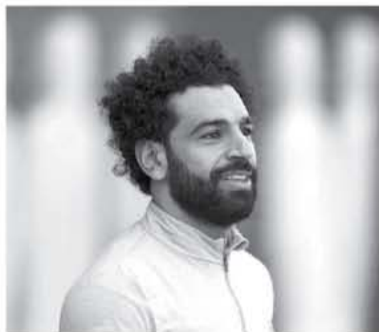
عواصم - وكالات

يعتبر المصري محمد صلاح، من الأسماء التي سوف تال اهتمام المزعج المشاهير في مونديوال روسيا بفضل انطلاقه في 11 من الشهر الجاري بفضل المستوى الرائع لجم ليفرول في الموسم المنصرم الذي توج به بجائزتي هداف البريميرليج وأفضل لاعب، وبعد محمد صلاح حجر الأساس في تشكيلة المدرب الأرجنتيني هيركتور كوبر الذي ينتظر بفارغ الصبر لعاق نجم ليفرول بمباراة الافتتاح للتراعة ضد أروجواي يوم 15 من الشهر الجاري والتعاقد من الإصابة بخلع في الكتف التي تعرض لها ضد ريال مدريد في 11 من الشهر الماضي في نهائي الشامبيونليج الذي خسره فريقه 2-1، "موسم" اللقب الذي تمكن جماهير ليفرول أن تنادي صلاح به في الموسم المنصرم، ارتفعت قيمة التسويقية بصورة خيالية بعد المستوى الرائع الذي حققه مطلوب في ريال مدريد وبرشلونة وباريس