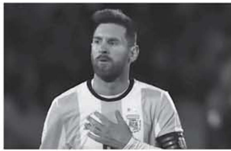
بيونس آيرس - وكالات

يُعد ريكاردو خوليو بيا، أحد عناصر منتخب الأرجنتين مثل العالم في عام 1978، والذي نُقِبَ بـ"السيخ"، قبل أعوام من ذلك التاريخ، عندما انتقل للعب بين صفوف نادي أتليكو توكومان الأرجنتيني، وبفضل تألقه في مركز لاعب الوسط، ضمنه مدرب المنتخب الأرجنتيني آنذاك، سوزال لويس مونتو، إلى الفريق بجانب لاعبين آخرين من أندية الدوري المحلي في الأرجنتين. وبعد أن حصد لقب المونديوال، انتقل ريكاردو بيا مع مواطنته أوسفالدو اريباليس، إلى نادي توتنهام الإنجليزي، حيث تألقا وقادا هذا الفريق للتتويج بكأس إنجلترا في موسمين متتاليين (1981/1982 و 1982/1983). وفي عام 2008، تم وضع صورة اللاعبين في قاعة المشاهير الخاصة بالنادي اللندني، وكشف ريكاردو بيا، عن حطوطه للتحدي الأرجنتيني بقيادة نجمه ليونيل ميسي. في مونديوال روسيا 2018، وقال "أشعر