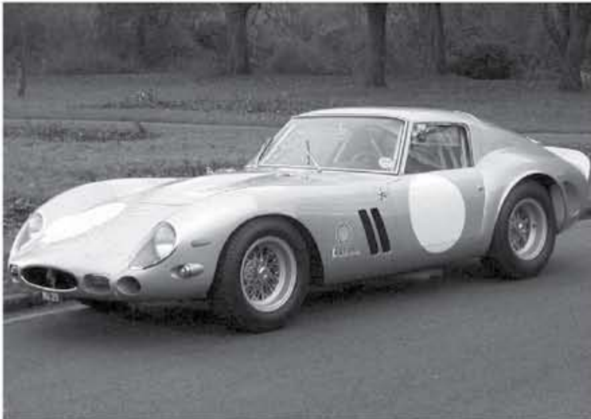
نيويورك - وكالات

التي أسسها انزو فيراري أنتجت 3٩ نسخة في العالم من طراز فيراري 250 GTO خلال الفترة من عام 1٩٦٢ حتى عام ١٩٦٤، وصنعت هذه السيارة النادرة في وقتها ليتم استخدامها في السباقات الرسمية ولتتم قيادتها أيضاً على الطرق العامة، والصداقة هنا أن سعر هذه السيارة عندما كانت جديدة في الستينيات كان يبلغ تقريباً ١٨ ألف دولار أمريكي.