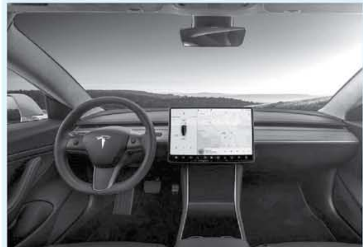
كاليفورنيا - وكالات

عملية الإنتاج رغم حجوزات التسراة الضخمة لها. حالة تتوفر معلومات رسمية عن سيارة Tesla Model Y ستزودكم بها على الفور إن شاء الله.