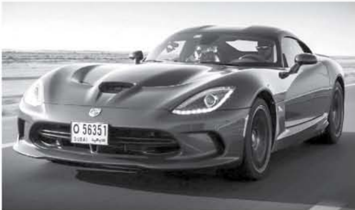
نيويورك - وكالات

الرأس التي هي بالأصل صغيرة، وهذا يعني أن فايبر لا تشي مثلثات القرار FMVSS الخاص بأنظمة السلامة الذي صدر في عام 2٠١١. تتلمس في المستقبل أن لنشر خيراً نعلن من خلال عودة دودج فايبر بجبل سادس لتعود هذه السيارة الأمريكية الرياضية ذات الأداء العالي من جديد.