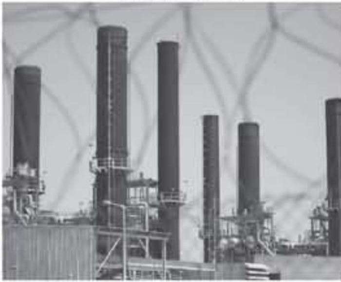
محطة كهرباء غزة