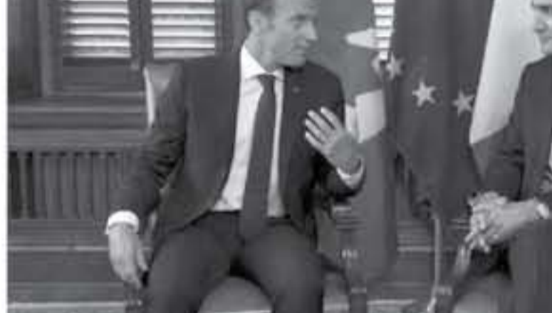
أوتواوا - أ ف ب

يصل قادة الدول السبع الأغنى في العالم اعتباراً من أمس الخميس إلى كندا لعقد قمة سنوية لشهد بصوره استثنائية هذه السنة لورا شيددا على خلفية الرسوم الجمركية المشددة التي فرضها الرئيس الأميركي دونالد ترامب مؤخرًا على حلفائه متبراً احتجاجات شديدة. وبعد أشهر من اللقاعات الثنائية غير الجدية، يقابل ترامب الجمعة والسبت وجهاً لوجه في مالايف بيكوك هاد كندا وفرنسا وألمانيا وبريطانيا واليابان، وهي دول حليفة لخمس من العاظمات سيامة "أميركا أولاً" على النمو العالمي.