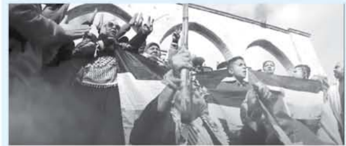
من مسيرات العودة

دعت حركة حماس في الضفة الغربية المحتلة إلى الرحف الهادر نحو القدس في الجمعة الأخيرة من شهر رمضان. وأكدت الحركة في بيان أمس الخميس، ضرورة جعل صلاة الجمعة في المسجد الأقصى تجميلاً "عقدياً" مليوثة القدس. وأعلنت الهيئة الوطنية العليا لمسيرات العودة وكسر الحصار، انطلاقاً ففانيات جمعة "مليوثة القدس"، والتي من المقرر فيها مشاركة جماهيرية واسعة في مسيرات العودة الخمس بقطاع غزة، اليوم الجمعة. وأضافت "تيمم المحتل الغاصب أن ذكرى النكسة ال18ه من يوم تجديد البيعة لعمامة مدينة القدس. وتابعت حماس في بيانها، "لأنها القدس التي لوبت لها الأرواح، ولأنها العاصمة الفلسطينية الأزلية، تدعو حركة حماس