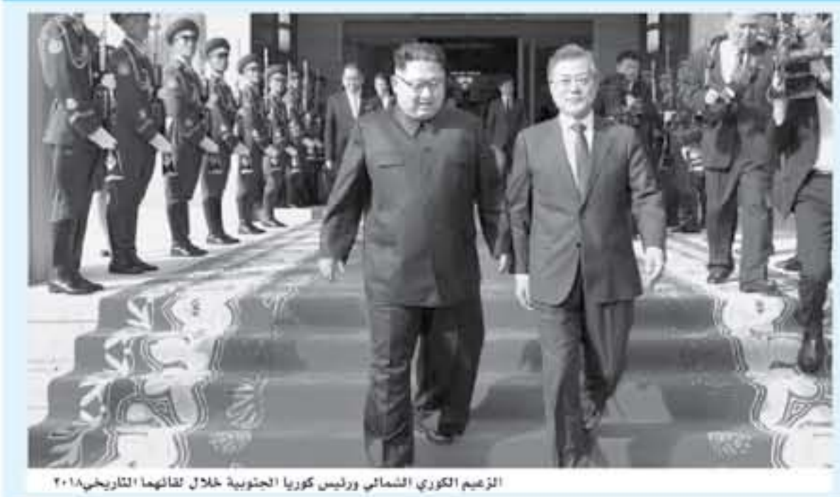
الزعيم الكوري الشمالي ورئيس كوريا الجنوبية خلال لقاءهما التاريخي ٢٠١٨

وهو على فتاعة بأن الولايات المتحدة تحتل موقعا مهيمنًا في اختيار القوة القائم حاليا بصفتها القوة الاقتصادية الأولى في العالم. وهو على ثقة بأنه سيتمكن من إرقام شركائه على الرضوخ لمطالبه وزيادة صلاحيته من المنتجات الأميركية، ولو أن كندا والانداه الأوروبي يقاومان حتى الآن ورنما على التدابير الجمركية الأميركية يعرض رسوم مضادة.