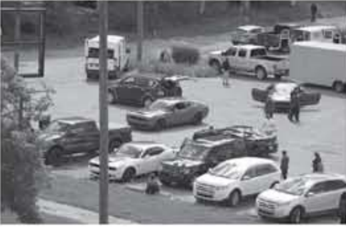
ديترويت - وكالات

فوج لتالنجر اس آر تي ديمون Dodge Challenger SRT Demon، أقوى نسخة إنتاجية من سيارة العضلات لتالنجر وتبلغ قوتها 810 حصان، ويقودها أثناء تصوير هذه الحلقة ريتشارد هاموند. شيفرونيه كامارو هينيسي Chevrolet Camaro Hennessey عبارة عن سيارة كامارو ZL1 عدلتها شركة هينيسي الأمريكية وتبلغ قوتها ألف حصان، يقودها أثناء تصوير الحلقة جيمس ماي. يجدر الإشارة إلى أن برنامج ذا جران تور - The Grand Tour أطلق بعد مغادرة كلا من: جيرمي كلاركسون وريتشارد هاموند، وجيمس ماي فريق عمل برنامج توب جير - Top Gear. برنامج The Grand Tour موسمين حتى الآن عبر خدمة أمازون برايم. لا تتوفر حتى الآن معلومات رسمية عن موعد عرض الموسم الثالث من برنامج The Grand Tour.