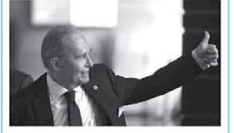
واشنطن - أ ف ب

واشنطن قبل يومين من انطلاق أعمال قمة مجموعة السبع في كيبك بوعي الجمعة والسبت أن "المنظمات الدولية المتعددة الأطراف لن تحل السياسة الأميركية، اعتقد أن الرئيس كان شديد الوضوح في هذه المسألة، ولكن كودلو أكد حرص الولايات المتحدة على منظمة التجارة العالمية وورها. وقال "نحن ما زلنا نعتين بمنظمة التجارة العالمية، لقد وقع مندوب الولايات المتحدة لتشؤون التجارة) وروبرت لانتزير شكايي عدة أمام منظمة التجارة العالمية (للاحتجاج على المعايير الصينية وممارسات دول أخرى... وأدت تصريحات استشاري اقتصادي لقيبت الأيديش قبل يومين من التمام مجموعة الدول الصناعية السبع الكبرى في قمة لتسنيها كيبك بوعي الجمعة والتسميت وتلقت بطلائع عليها الحرب التجارية التي أطلتها ترامب بقراره فرض رسوم جمركية على واردات الولايات المتحدة من الألومنيوم وال فولاد.