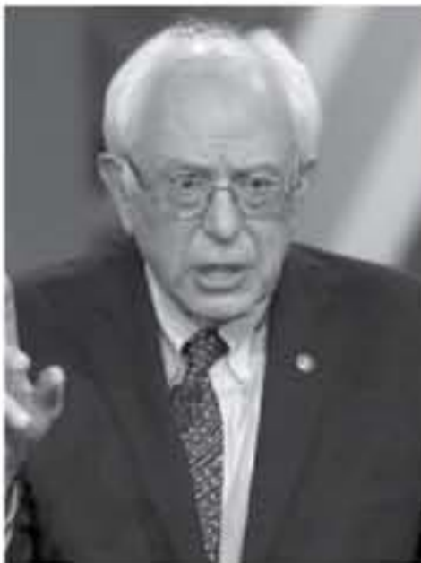
السيناتور بيرني ساندرز

وشد على أن "على الولايات المتحدة أن تنزل للقطاع، وتقول إن للفلسطينيين الحق في التمتع بحقوق الإنسان الأساسية، وإسرائيل الحق بالوجود في استقلال وحرية. وأضاف "هنا ما يجب أن نصل إليه، وأعتقد أنه يتطلب سياسة غير متحيزة في الشرق الأوسط ونحن لا نلوم به الآن. وبيرني ساندرز يهودي، وقد رشح نفسه لانتخابات الرئاسة الأمريكية لعام 2016. وفي سياق آخر، اتهم ساندرز الرئيس الأمريكي دونالد ترامب بالكذب على شعبه، وقال "ترمب يكذب في جميع الأوقات على الشعب الأمريكي، وبعد بالانسحاب من أفغانستان ولم يفعل، وكان يتفقد الحرب في العراق ولكن بعد ذلك جلب جون بوتنوك، أحد أبرز مهندسي الحرب على العراق. ودعا إلى ضرورة تفضيل ميزانية الدفاع الأمريكية، وقال إنه صوت ضد زيادة هذه الميزانية في الكونغرس. واقترح بيرني ساندرز تخصيص 700 مليون دولار من ميزانية وزارة الدفاع لتمويل برامج التبادل الثقافي عبر العالم.