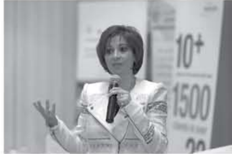
وزير الاتصالات وتكنولوجيا المعلومات وزير القطاع العام مجد شويكة

تعتكف وزارة الاتصالات وتكنولوجيا المعلومات الشهر الحالي على اتمتة خدمات جديدة بحسب اجندة عمل خطة تطوير النمو الاقتصادي الأردني، حيث سيجري اتمتة ٤ خدمات في وزارة الداخلية واعادة هندسة الاجراءات ٨٨ خدمة في التأمين الصحي وادارة مراقبة الشركات. وبحسب ما رصدته الانباط فانه يتوجب على الوزارة الانتهاء من اعمال البنية التحتية لمشروع ربط شبكة الاليف الضوئية - القسم الجنوب- حيث يهدف برنامج شبكة الاليف الضوئية الوطني إلى ربط حوالي ١٠٠٠ موقع حكومي في جميع أنحاء المملكة (جهات تعليمية وحكومية وصحية) بشبكة ألياف ضوئية عالية السرعة لتطوير وتحديث القطاع العام، حيث تساهم الشبكة في تطوير نظام التعليم وتطوير النظام الاجتماعي وتطوير النظام الصحي وتحسين الخدمات الحكومية. كما يتوجب الانتهاء من إعادة هندسة الإجراءات لـ ٤٤ خدمة في دائرة مراقبة الشركات والإنهاء من إعادة هندسة