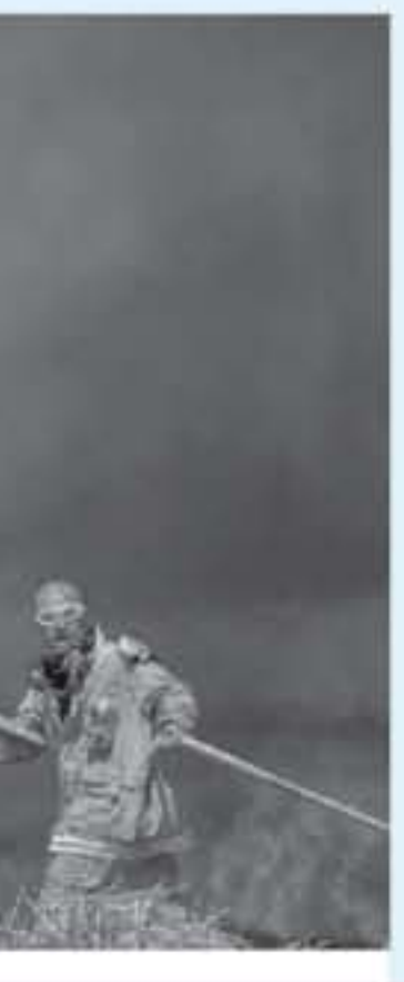
حرائق في زرع الاستيطان

اندلعت خمسة حرائق بغلاف غزة أمس السبت وذلك نتيجة طائرات أو بالونات حارقة يتم إطلاقها من غزة. وذكّرت صحيفة "يديעות أحرونوت" أن فرق الإطفاء تعاملت مع 5 حرائق بالغلاف من بينها حرائق قرب كيبوتسات "كيسوفيم وبثيري"، وأنها تمكنت في النهاية من إخمادها. وحول الشبان الطائرات الورقية إلى أداة مقاومة لتشتت الاحتلال بعد رنين عملية معدنية داخلها قطعة فماش مغممة بالسولار في ذيل الطائرات، ثم إشعالها بالنار وتوجيهها بالخيوط إلى أراضي زراعية قريبة من مواقع عسكرية إسرائيلية، وتبع الشبان مؤخراً بإحراق آلاف المونومات المزروعة للمستوطنين في مستوطنات "غلاف غزة" بواسطة تلك الطائرات ردًا على "مجازر" قوات الاحتلال بحق متظاهري مسيرة العودة السلميين