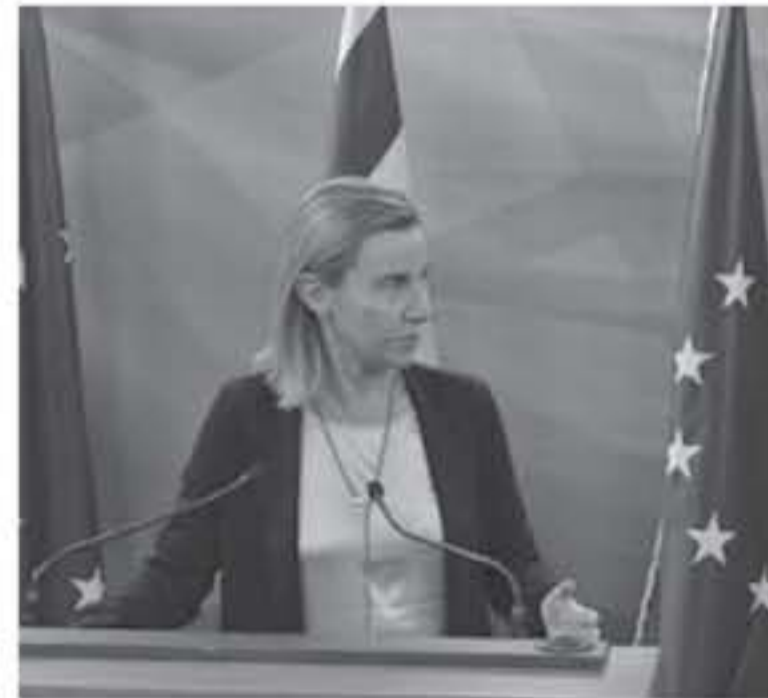
إذاعة لمارسات إسرائيل في الأراضي الفلسطينية في أكثر من مناسبة، وكذلك فإن وسائل الإعلام الإسرائيلية تساءلت إن كان إلغاء نتانياهو لثقائه معها، يتدرج

إلى إسرائيل، وقالت صحيفة "معاريف" في موقعها الإلكتروني على الانترنت، إن إسرائيل باقت تتجه سياسة جديدة في السنوات الأخيرة، وخصوصاً منذ تسلّم دونالد ترامب رئاسة الولايات المتحدة. ويأتي هذا التطور بين إسرائيل والاتحاد الأوروبي، بعد أيام قليلة من جولة أوروبية أجراها نتانياهو في الدول العظمى الأوروبية، ألمانيا وفرنسا وبريطانيا، والتقى مع زعمائها. وتقوم إسرائيل بالتمييز بين الاتحاد الأوروبي وأوروبا على ما يبدو، إذ أن إلغاء اللقاء يدل على أن نتانياهو بات يؤمن بأن بلاده قادرة على السماح لنفسها بالتنازل والتفاوض، عن مندوبي دول وهيئات "غير مهمة" بالنسبة لها. وسبق لنتانياهو أن رفض لقاء زعيمار غابرييل وزير خارجية ألمانيا الأسبق، حينما زار إسرائيل في إبريل - نيسان من العام الماضي احتجاجاً على لقاء رئيس الدبلوماسية الألمانية منظمات إسرائيلية يسارية.