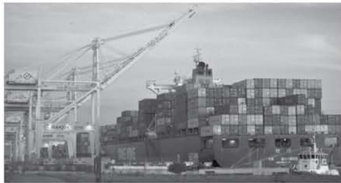
يحدد رسوماً جمركية قدرها ٢٥ بالمئة على صادرات أميركية بقيمة ٢.٨ مليار يورو (٣.٣ مليار دولار). فقال إن الإجراءات تم وضع بعد في شكلها النهائي وما زالت قيد الإعداد.

حذرت وزيرة الوزراء البريطانية تيريزا ماي كلاً من الولايات المتحدة والاتحاد الأوروبي من مخاطر الدخول في حرب تجارية شارية بشأن الرسوم الجمركية وحذرت الجانبين كليهما على التركيز على خفض طاقة إنتاج الصلب في الصين. وقال مسؤول بريطاني بارز، طلب عدم نشر اسمه، إن ماي تستخدم مناقشات مجموعة السبع حول الاقتصاد العالمي لتشرح حيلتها. وأضاف قائلا "هي وعدت من الزعماء الآخرين بمتكفون أن فراق الولايات المتحدة فرض رسوم جمركية على واردات الصلب والألومنيوم من بعض أقوى حلفائها يمتد على باع الأسفل.