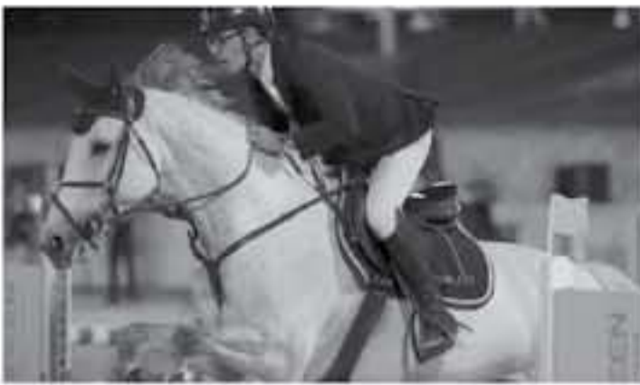
عمان - الانباط