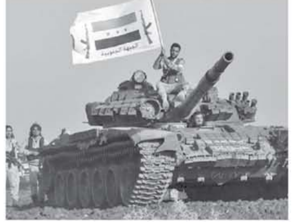
بين البلدين ليس وليد هذه التحفة، لكن يمكن القول إن الملف الكردي هو الملف الرئيسي الأكثر إشكالية والأكثر إثارة للخلاف بين الجانبين. بدأ الشك التركي في التواهي الأمريكية بإنشاء كردستان العراق المستقلة في أوائل التسعينيات، وقد تكثفت الشكوك مع حرب العراق في عام 2003، وما تبعها من إنشاء كيان شبه مستقل، ما شكل حديفة خلفية لحزب العمال الكردي العامل في تركيا، وقد وصلت إلى نقطة الغليان مع الصراع في سوريا. في جميع الحالات الثلاث، كانت تركيا قد استوعبت فكرة الشراكة مع أمريكا، ولكن في الوقت نفسه ترى أن أمريكا تقوم بخطوات تقوض مصالح تركيا وأمنها.

ما رأوا أنها لا تزال تحافظ على القيمة الاستراتيجية الهائلة التي يفتقرها الكثيرون، ينبغي أن يركزوا على ضمان ألا يجد الأتراك العاديون سبباً للتسويق مع نظريات المؤامرات التي يبردها بعض فئاتهم، وبدلاً من ذلك النظر لأمريكا بشكل إيجابي وبنّاء. سيتطلب ذلك إدخال تعديلات على سياسات الإدارة الأمريكية في سوريا، وفي الوقت نفسه، يمكن معالجة حكومة أردوغان بطريقة تعالدية - كقوة مزججة تحتاج إلى إدارة بطريقة أو بأخرى مع وضع الهدف الأوسع - سابق الذكر - في الاعتبار. إصرار الطرف التركي على العمل المشترك في سوريا، من خلال تقديم المشاريع والمبادرات وخطط الحركة، قول من الجانب الأمريكي بالشوق والوعود الكلامية والتكوير المتكرر عن تلك الوعود، ما دفع الطرف التركي إلى طرق الباب الروسي، بعد أن وصل الثورين القذافي وموسكو إلى شطوط الحرب على خلفية إسقاط الطائرة الروسية. وبعد الاستشارة التركية نحو موسكو، دخلت أنقرة في مسار أسنانا كدولة ضامنة للطرف المعارض، وهو دخول أعطى أسنانا وسمازها زخماً كبيراً، رغم غموض واشنطن، وحذر الأمم المتحدة وتردد مبعوث أمينها العام للشؤون السورية ستيفان ديستورا. التسليم التركي الروسي للشظايا الذي قطع أنطاكية كبيرة على الأرض السورية، شجع بوتين على الذهاب لجهة عقد مؤتمر سوتشي للشؤون السورية السورية كخطوة متقدمة، رغم القاطعة الأمريكية لهذا المؤتمر.