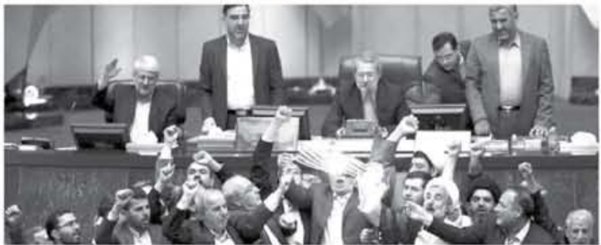
نواب إيرانيون يحرقون علما أميركيًا من ورق في 9 أيار/مايو 2018