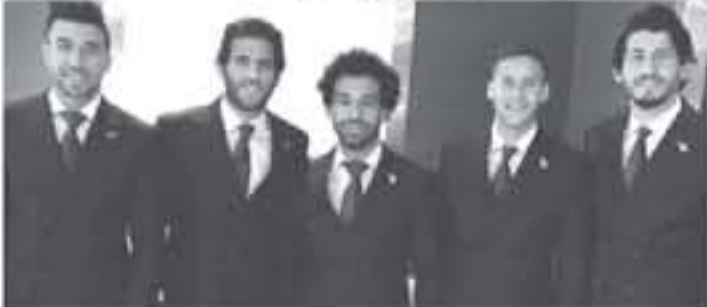
الكافرة - وكالات

تستغرق ست ساعات، وأعلن الأرجنتيني هكتور كوبر المدير الفني للمنتخب رفضه منح اللاعبين راحة سلبية بعد الوصول لجرزوني، وقرأن أن يؤدي الفريق تدريباته مباشرة بمجرد الوصول، الحفاظ على اللياقة البدنية للاعبين والتجهيز لمواجهة أوروبا، ويستهل المنتخب النمسي الشهرة السبت، في حضور الجماهير، بمعلق إستاد القاهرة، ونهانت البعثة على متن طائرتها الخاصة - حيث توجه مباشرة إلى مدينة جروزي في رحلة