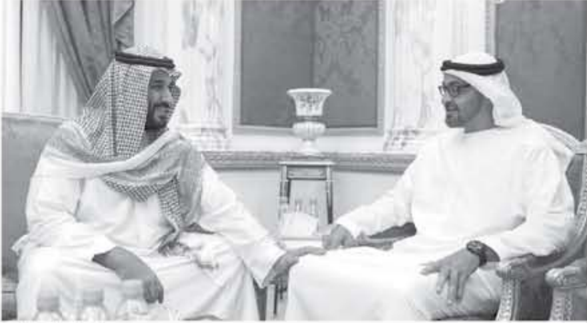
ابن زايد وابن سلمان

لشكورت فإن له أهدافاً أكبر من قضية قطر، ويوضح سمير تقي أكثر بالحديث عن أن المجلس يهدف عموماً إلى استعادة دور الخليج والعرب في المنطقة، من خلال إعادة مساهمة الخليج في الاقتصاد العالمي، خاصة في مرحلة ما بعد النفط، وذلك لأجل مواجهة عدد تحديات، منها التشريعية الصينية التي تريد التوسع في المنطقة هناك كذلك أهداف عسكرية حسب قول الخبير، منها أن دول الخليج لم تصل إلى مستوى عالمي من التنسيق في المراقبة والتسلح، مما كان عائقاً أمام القيام بعمليات مشتركة كبرى أو الدفاع المشترك، وهناك كذلك أهداف سياسية بعيداً عن قطر، منها التصدي للمحاولات التركية والتروسية بالتدخل في المنطقة، يضيف سمير تقي.