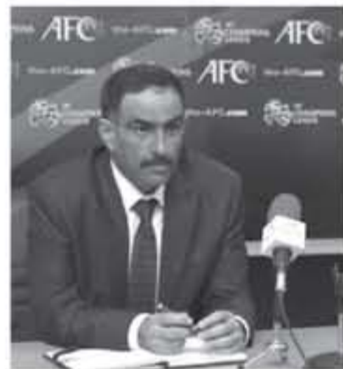
أفضل. حيث سيهد شياخ المقبل انطلاق بطولة كأس الاردن يطلها الجديدة التي سيشارك بها أندية الدرجة الأولى والثانية والمحترفين وتنتهي مطلع آب من العام

المقبل. وتابع: "سيشهد الموسم المقبل بطولة مستحددة من مرحلة واحدة تبدأ في آب وتنتهي في ٢٥ تشرين الأول لآندية المحترفين، حيث يسعى الاتحاد لابقاء الأندية في أجواء المنافسة بما يخدم مشاركتها الخارجية من جهة ويعزز مسيرة المنتخبات الوطنية من جهة أخرى، علماً بأن جميع المواسم الأربع المقبلة ستنتهي في شهر تشرين الأول". واختتم شعبيات، "عند النظر للأجندة التي تم طرحها وعرضها على الأندية نجد أنها قد اهتمت بكافة الأنشطة الخارجية أيضاً إن كان بالمشاركات الآسيوية أو البطولة العربية".