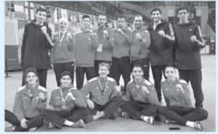
عمان - الانباط