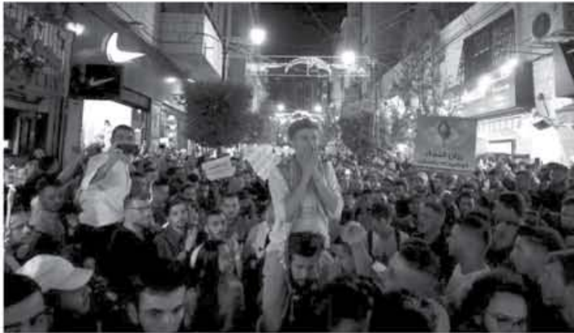
محتجون فلسطينيون في مسيرة برام الله يوم الأحد

خرج مئات الفلسطينيين مساء الأحد في مسيرة دعا إليها نشطاء على مواقع التواصل الاجتماعي لاعتصام على الساحة الفلسطينية بدفع رواتب موظفي قطاع غزة.