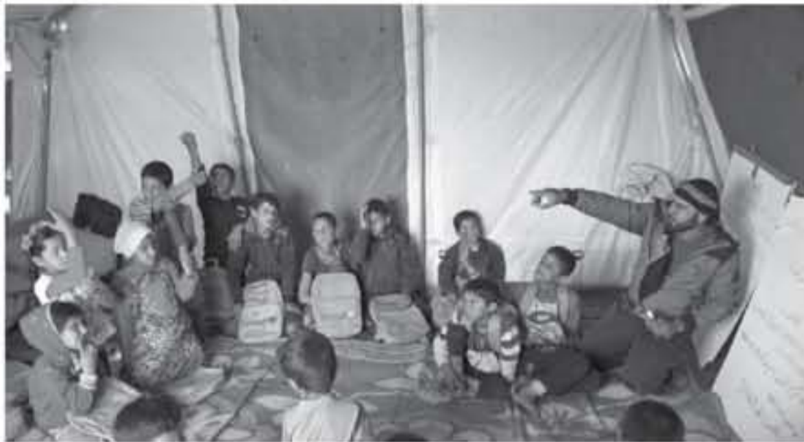
مخيم للاجئين السوريين في محافظة ادلب في شمال غرب سوريا.

أعلنت الأمم المتحدة أمس الاثنين أن أكثر من 920 ألف شخص نزحوا في سوريا في الأشهر الأربعة الأولى من العام 2018، في ما يشكل رقما قياسيا منذ بدء النزاع قبل سبع سنوات.