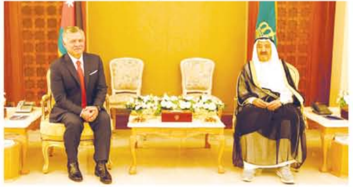
الكويت - بترأ سمو الشيخ صباح الأحمد الجابر الصباح أمير دولة الكويت، مباحثات في العاصمة الكويتية، أمس الثلاثاء، ركزت على