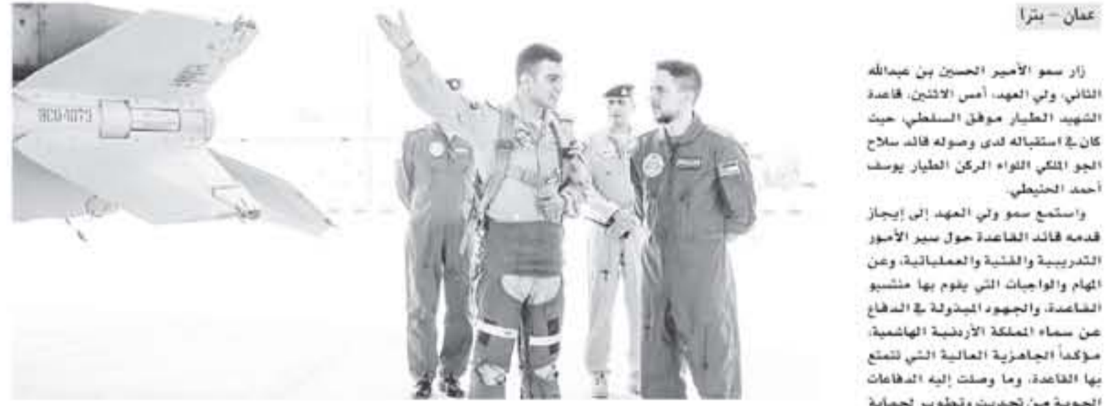
العالية التي يتمتع بها منتسبو القاعدة والجاهزية العالية والقدرة الفائقة على تنفيذ المهام الموكفة بهم.

التحديث والتعديل التي تجري على طائرات (F16)، كما شاهد إقلاع عدد من طائرات سلاح الجو الملكي من نوع