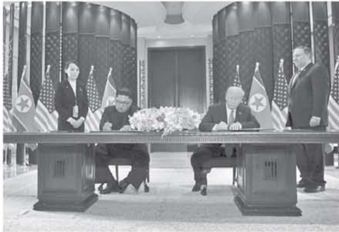
الرئيس الأميركي دونالد ترامب ومولقة وثيقة مشتركة مع الزعيم الكوري الشمالي كيم جونج أون في سنغافورة في ١٢ حزيران/يونيو ٢٠١٨

اشاد الرئيس الأميركي دونالد ترامب والزعيم الكوري الشمالي كيم جونج أون بقمتهما التاريخية التي عقدت أمس الثلاثاء في سنغافورة باعتبارها اختراقا في العلاقات بين البلدين لكن الاتفاق الذي توصلوا إليه لم يعط الكثير من التفاصيل حول المسألة الأساسية المتعلقة بتسليحة بيونغ يانغ النووية. واتاحت هذه القمة الاستثنائية مصالحة تاريخية بين رئيس أقوى ديموقراطية في العالم ووريث سلالة نظام ديكتاتوري وقفا جنيا إلى جنب أمام العالم بديهما.