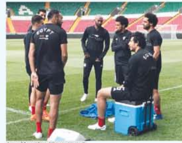
لاعب منتخب مصر خلال حصة تدريبية في روسيا

الأنباط - عمان - محمد الجنادوي تطلق غدا الخميس منافسات كأس العالم ٢٠١٨ في روسيا ، حيث يخوض الجند الضيف المباراة الافتتاحية مع منتخب السعودية بشام السادسة مساء بتوقيت عمان ، وتترقب الجماهير الأردنية أداء ممتع من المنتخبين العربية الأربعة المشاركة بالبطولة وهي مصر السعودية تونس المغرب. وجاءت مواقع المنتخبين العربية بالمجموعات كالتالي : مصر والسعودية بالمجموعة الأولى رفقة روسيا والإراغواي ، ووقع المنتخب المغربي في المجموعة الثانية والتي سميت بالموت حيث يتواجد بها اسبانيا والبرتلغال الخلاصيل من ٤٠