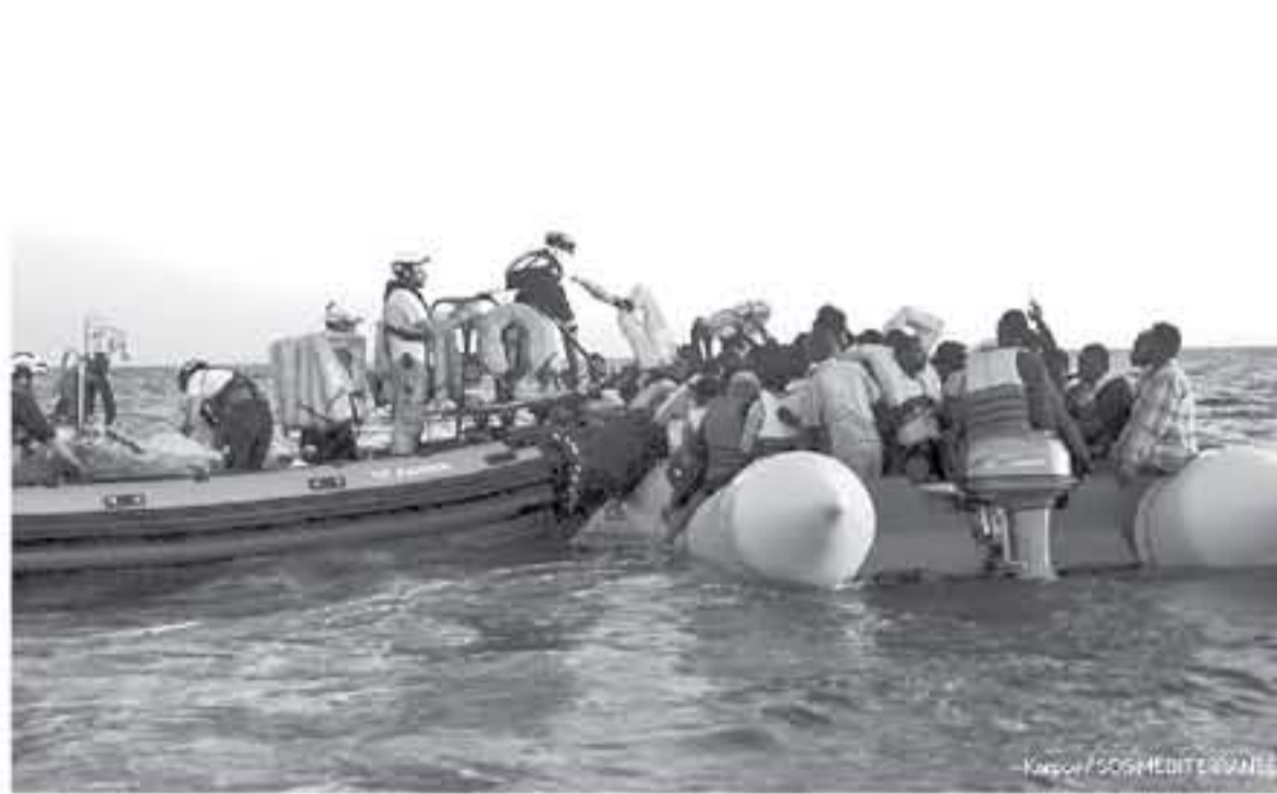
عملية إنقاذ مهاجرين قبل نقلهم إلى سفينة "أكوربوس" التابعة للمنظمة غير الحكومية الفرنسية

البيمني المتطرف أكد من جانبه مساء الاثنين ان الكوربوس ستطلق "في أقرب وقت"، وكان سالفيني قام بحملة قبل الانتخابات التشريعية حول موضوع افضال الحدود امام المهاجرين، متعهدا القيام بكل ما في وسعه في حال انتخابه مع هذه العمليات، خصوصا عندما تقوم بها منظمات غير حكومية لتتبع قبالة سواحل ليبيا.