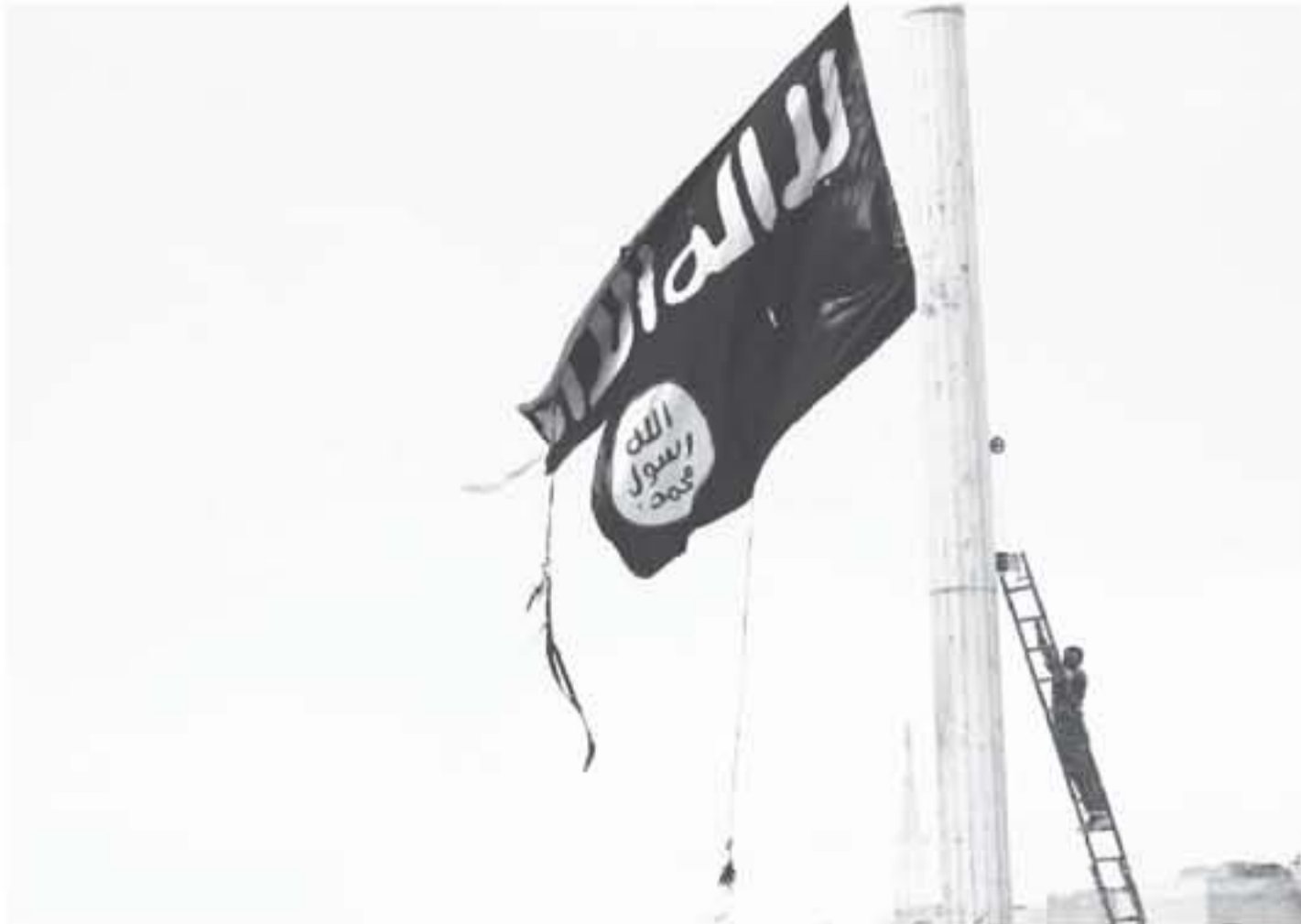
تمس من قوات سوريا الديمقراطية ينزل علم تنظيم الدولة الإسلامية في بلدة ليلية في ٢٠ نيسان/أبريل

ويتبع تنظيم الدولة الإسلامية بشكل أساسي تكتيك التسلل ضد مواقع قوات النظام وحلفائها، قبل أن يشن عمليات انتحارية إن كان عبر العريات المتخفية أو "الانفجاسيين" وأحياناً كثيرة، يشن هجمات متوازية على أكثر