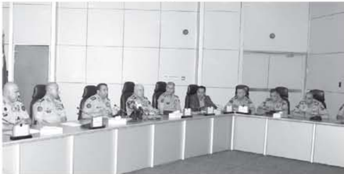
عمان - بترا

أكد المدير العام لقوات الدرك اللواء الركن حسين محمد الحواتمة أن قوات الدرك، وبفضل دعم ورعاية جلالة القائد الأعلى الملك عبدالله الثاني، حققت قفزات نوعية وصلت بها إلى مراتب التميز المحلي والدولي.