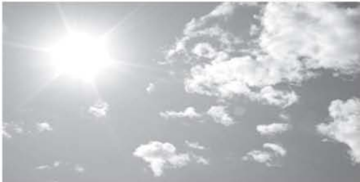
عمان - الأنباط وبترا

قال مدير عام دائرة الارصاد الجوية المهندس حسين المومني ان الامطار التي هطلت خلال ٢٨ ساعة الماضية، لا تعتبر استثنائية من حيث الحدوث في مثل هذا الوقت من السنة .