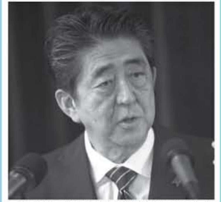
رئيس الوزراء الياباني شينزو أبي خلال مشاركته في قمة مجموعة السبع في كندا في 9 حزيران يونيو 2018

اليابانية يعتزمون إجراء محادثات مع مسؤولين من الشمال خلال الأسبوع في مونغوليا. وكثفت صحيفة "يوميوري شيمبون" أنه "إذا تبين أن القيام بزيارة أبي بيونغ يانغ خلال أب/ أغسطس صعب، فيمكن أن يجري أبي محادثات مع كيم على هامش المنتدى الاقتصادي الشرقي المقرر في فلاديفوستوك (روسيا) بين 11 و13 أبول/سبتمبر المقبل. ورفض المتحدث باسم الحكومة يوشيهيدي سوغا تأكيد المعلومات وقال في لقائه المعتاد مع الصحفيين، "لم نتأكد شيء في الوقت الحاضر". وأضاف "إذا عقدت قمة يابانية كورية شمالية فمن المهم جدا أن تؤدي إلى حل قضايا البرنامج النووي والصواريخ وقبل كل شيء عمليات الحلفاء.