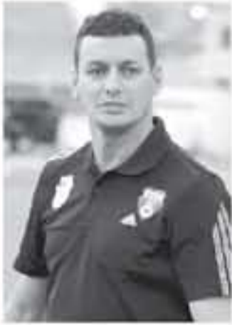
عمان - الألباط

طلب المدرب الجزائري لخرموني من نادي الرمثا لكرة القدم مساعدًا لرحموني الاستعانة بمدرب أردني من مدينة الرمثا لمساعدته في قيادة الفريق خلال المرحلة المقبلة. وأبلغ رحموني إدارة الرمثا برغبته بتعيين شخص رياضي من مدينة الرمثا، لمساعدته في التعرف على اللاعبين وطرفهم وأحوالهم. بحثا عن بناء فريق قوي قادر على المنافسة في البطولات المحلية وبطولة الأندية العربية التي يشارك فيها الرمثا كمثل لكرة الأردنية. رحموني الذي وقع عقدا في الأيام الماضية مع فريق الرمثا، عاد إلى بلاده في اجازة قصيرة لقضاء عطلة العيد، قبل العودة إلى الأردن يوم الثلاثاء المقبل، ليمارس عمله مديرا فنيا لفريق الرمثا. وبدأت إدارة الرمثا بالبحث عن مدرب محلي قادر على