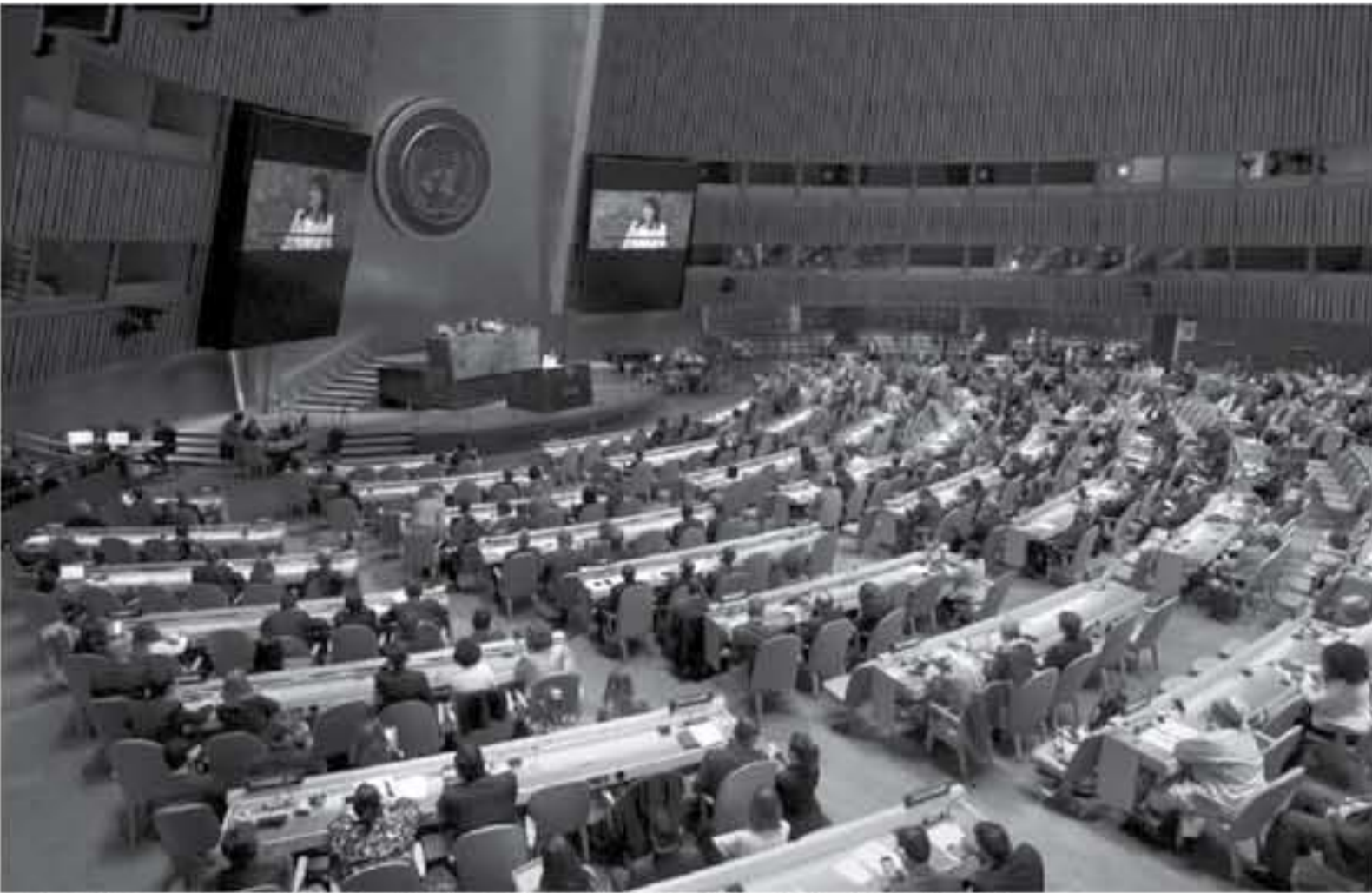
السيطرة الأميركية لدى الأمم المتحدة نيكي هايلي للقي كلمة من على منبر المنظمة الدولية قبل تصويت على مشروع قرار يدين إسرائيل

تسجل أسماء الدول التي دعمت قرار... بلوغ عدد الأصوات المرافضة للقرار الأميركي يومها ١٢٨ مقابل ٩ أصوات مؤيدة وامتناع ٣٥ عن التصويت. وخاضت إسرائيل وحمامس ثلاثة حروب في غزة، وحذرت الأمم المتحدة من أن أعمال العنف الأخيرة تشكل اندازا لتجميع باندا على حافة حرب كل يوم.