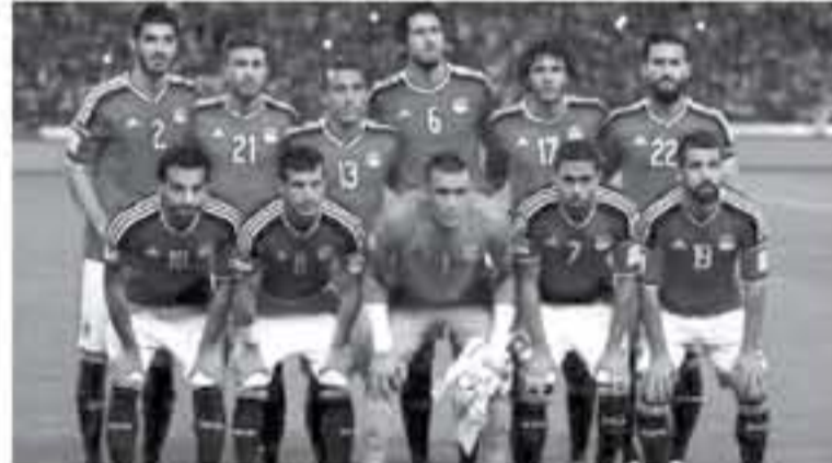
موسكو - وكالات

مشينة لن تشر على اللاعب ولكن من المتوقع أن لا يبدأ به المدرب سيداً المدرب هيكتر كوبر بكل قوة الضاربة حيث تعدّ المباراة الافتتاحية له هي أهم المباريات الثلاث للمنتخب، خاصة أن المواجهة مع أقوى فرق المجموعة ومن المتوقع أن يبدأ بلاعبه خط الوسط الذين يُجيدون الشق الدفاعي على حساب الشق الهجومي مع وجود بعض اللاعبين أصحاب السرعة الذين يستغلون شكل خطورة في التمرينات الشكيلي | ١-٢-٢-٢ رمضان صبيحي لاعب المنتخب المصري عصام الحضري محمد عبد