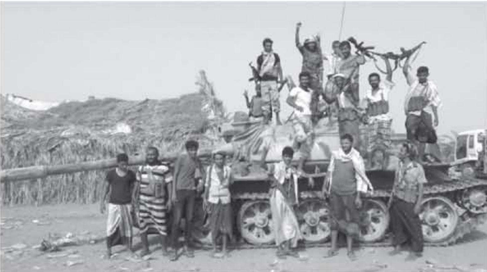
مقاتلون حقائب موالون للحكومة اليمنية يقفون حول دبابة في الأول من يونيو حزيران 2018 بالقرب من الجديدة

التشؤون الإنسانية في اليمن إن بالرغم من القتال "نحن هناك ونسلم مساعدات، إن غادر الجديدة".