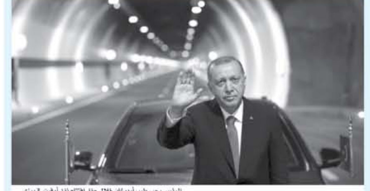
الرئيس رجب طيب اردوغان خلال حفل افتتاح لفق أوبت في ريزي

أكد الرئيس التركي رجب طيب اردوغان ان حالة الطوارئ المفروضة منذ الانقلاب الفاضل في تموز/يوليو 2016، سترفع على الفور إذا ما أعيد انتخابه في 24 حزيران/يونيو.