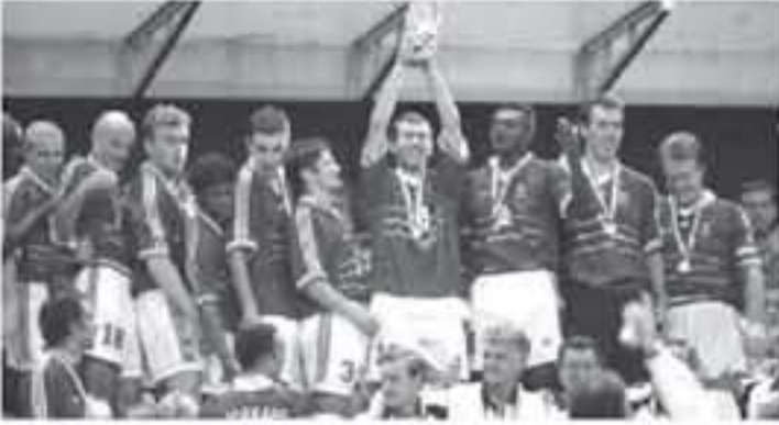
عواصم - وكالات

البرازيل باللقب 5 مرات، لكنّها لم تسقط قط على أرضها في مناسبتين عامي 1950 و2014. خيبة أفريقية، منتخب جنوب أفريقيا هو الأول والوحيد من بين المنتخبات المنضوية، الذي يودّع البطولة من الدور الأول، وذلك في مونديال 2010. الاستضافة المشتركة، استضافت اليابان وكوريا الجنوبية مونديال 2002، الأولى وصلت إلى سن النهائي، والثانية حثّت في المركز الرابع. إنجاز أول منتخب أوروبي هو أول فريق مستضيف نال اللقب، وحدث ذلك في المونديال الأول العام 1930، إنجاز الأخير، المنتخب الفرنسي هو آخر فريق مستضيف بحرز اللقب وحدث ذلك في مونديال 1998.