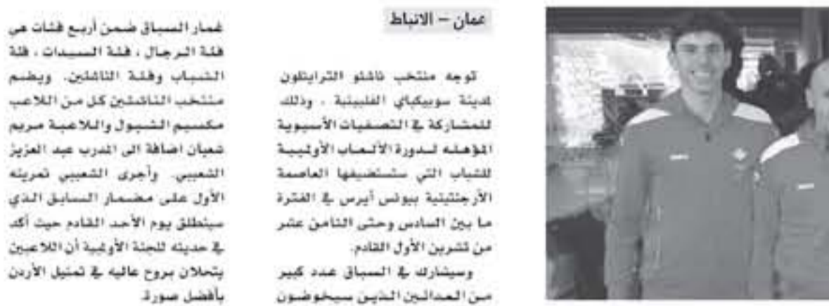
عمان - الألباط

توجه منتخب ناشئو الترايثلون لاجتماع سويكاي الفلبينية . وذلك للمشاركة في التصفيات الآسيوية المؤهلة لدورة الألعاب الأولمبية للشباب التي ستعقد في العاصمة الأرجنتينية بيونس آيرس في الفترة ما بين السادس وحتى الثامن عشر من تشرين الأول القادم. وسيشارك في المسابق عدد كبير من اللاعبين الذين سيحوضون