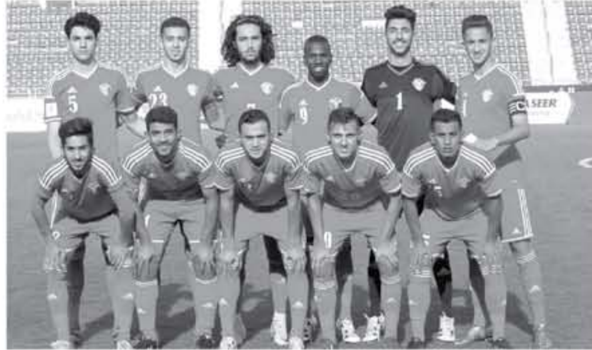
عمان - الألباط