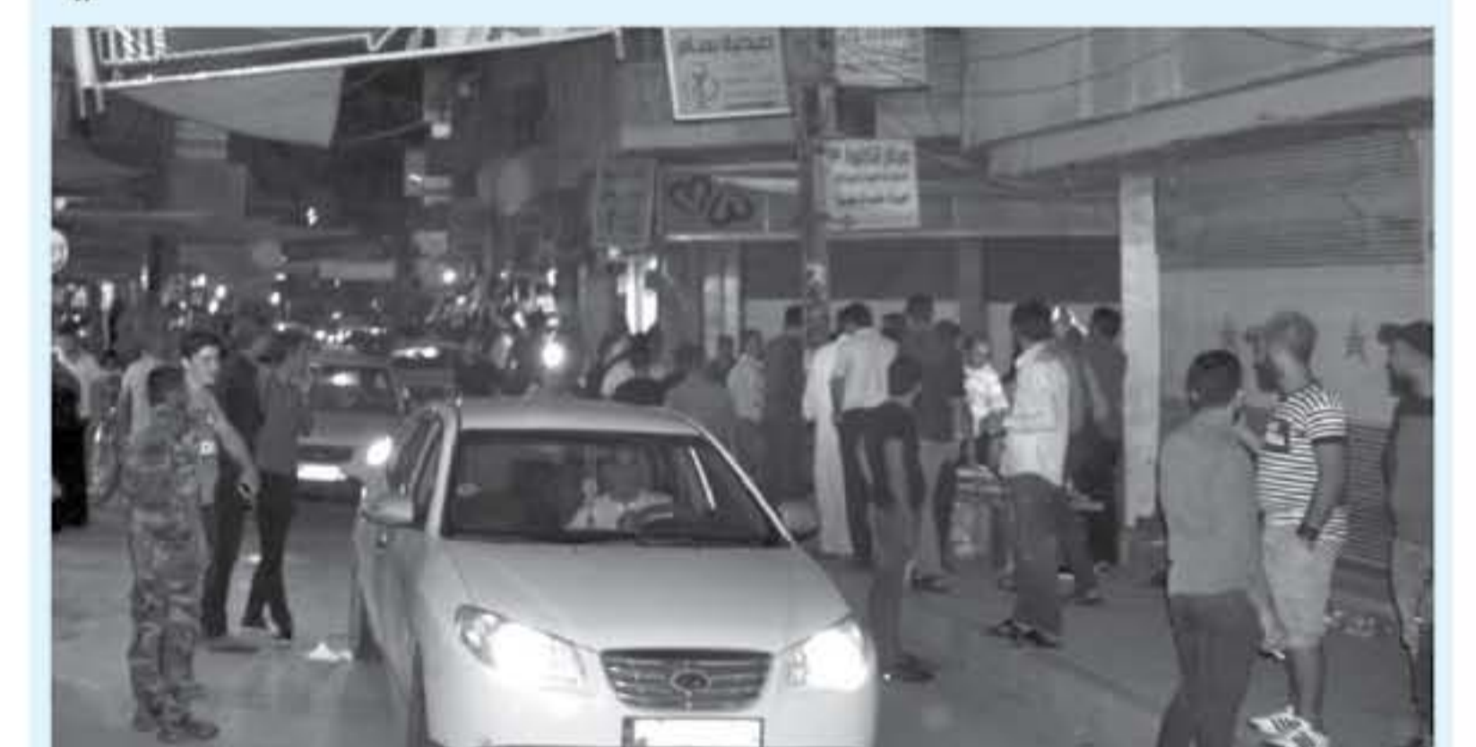
أحد أسواق الحسكة في شمال شرق سوريا في ١١ حزيران/يونيو.