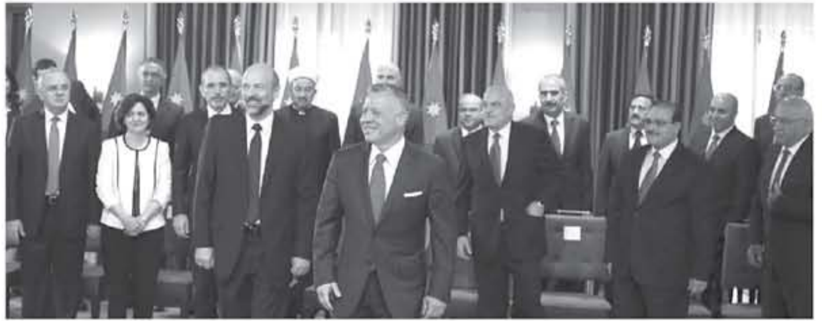
عمان - بتر

صدرت الإرادة الملكية السامية، أمس، بالموافقة على تشكيل الحكومة الجديدة، برئاسة الدكتور عمر الرزاز. وهدم على نص الإرادة الملكية السامية، "نحن عبدالله الثاني ابن الحسين، ملك المملكة الأردنية الهاشمية، بناء على استقالة دولة الدكتور هاني النقي، وبعد الاطلاع على المادة (٢٥) من الدستور، نأمر بما هو آت، يعين دولة الدكتور عمر الرزاز رئيساً للوزراء ووزيراً للدفاع. وبناء على لتسيب الرئيس المشار إليه: