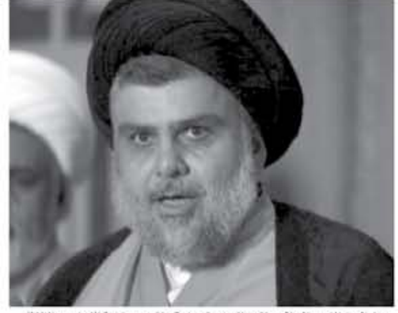
رجل الدين الشيعي العراقي مقتدى الصدر يتحدث في مؤتمر صحفي في النجف يوم الثلاثاء

له مشيرا إلى أنه يحظى بشعبية طافية في بعض الدوائر. والعامري مقرب من الميجر جنرال قاسم سليماني قائد فيلق القدس المسؤول عن العمليات الخارجية بالحرس الثوري الإيراني والذي يتمتع بشهوة كبير في العراق. وقال دبلوماسي غربي ثان في بغداد إن سليماني كان في العراق هذا الأسبوع وان المرجح أن يكون قد نصح العامري بالتحالف مع الصدر الذي اجتمع مع السفير الإيراني في الأونة الأخيرة. وقال الدبلوماسي إن الإيرانيين رأوا أنه لا مناص من التفاوض مع الصدر، وأنه أرتك بدوره أن عليه العمل مع العامري لتأمين فوز.