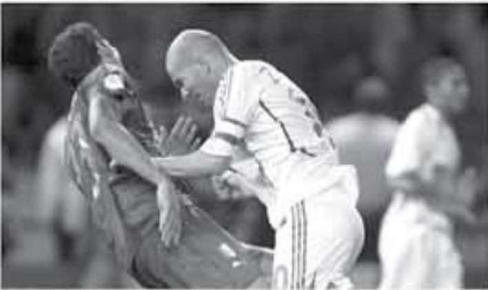
عواصم - وكالات

الثاني بعد إفلاهما من برائن مجموعة الموت شاركين خلفهما متشجحين من العيار الثقيل. إيطاليا وإنجلترا. وأسية زيدان في صدر ماتيراتزي، وكان ذلك خلال نهائي مونديال ألمانيا 2014. في المباراة الأخيرة بالسيرة الرافعة للاعب الفرنسي زين الدين زيدان والتي شهدت تسجيله لهدف وضع به بلاده في المقدمة على حساب إيطاليا، قبل أن يتعادل ماتيراتزي برأسية لمنتخب "الأزوري". فبعد أن احتدم الحدل بينهما في أحد الشواقف وتبادلوا بعض الكلمات خلال الوقت الإضافي، قام زيدان بضرب ماتيراتزي بالرأس في صدره ليحصل على البطاقة الحمراء ويغادر ملعب البرازيل عام 2014، التي شهدت عبور أوروغواي بصحة كوستاريكا إلى الدور