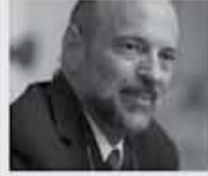
الدكتور عمر الرزاز

وبما على تفاصيل ما جاء في مشور الرزاز وواقعته عن ما تضمنه بعض أعضاء فريقه من تهم خلال الأيام الماضية، أعلن رئيس الوزراء الدكتور عمر الرزاز عن أنه بعدد الحجاز حزمة إجراءات قبل نهاية الأسبوع الحالي. وعن أدوات محددة