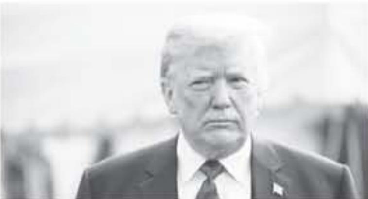
الرئيس الأميركي دونالد ترامب يخطب في مؤتمر صحفي في واشنطن في 1 حزيران/يونيو 2018

دخل الرئيس الأميركي دونالد ترامب أمس الاثنين على خط الأزمة السياسية الدائرة في ألمانيا حول ملف الهجرة معتبرا أن الألمان "يتلقون" ضد المستشارة أنغيلا ميركل بسبب هذه المسألة.