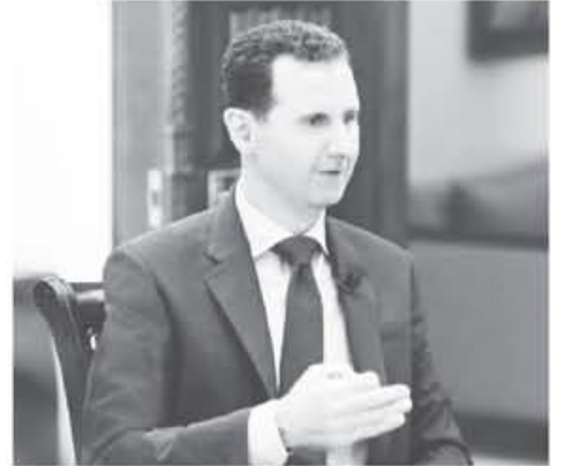
الرئيس السوري بشار الأسد يلمن بقتل طفلين في بلدة ريف إدلب، في وقت سابق من الشهر الجاري

قالت وسائل إعلام سورية رسمية يوم امس الاثنين إن طائرات تابعة للتحالف بقيادة الولايات المتحدة قصفت أهدافا عسكرية في شرق سوريا معادية للجيش الأمريكي نفس مسؤوليته عن القصف. ونقلت وسائل الإعلام عن مصدر عسكري قوله إن الهجوم وقع في بلدة الهري جنوب شرقي البوكمال. ولم ترد بعد تفاصيل عن الخسائر البشرية. وقال قيادي في التحالف العسكري الذي يدعم الرئيس بشار الأسد لرويترز إن طائرات مسيرة مجهولة يربح أنها أمريكية قصفت نقاط للفصائل العرقية بين البوكمال والشفب بالإضافة لواقع عسكرية سورية. وأضاف القيادي، وهو غير سوري واشترط عدم الكشف عن هويته، أن