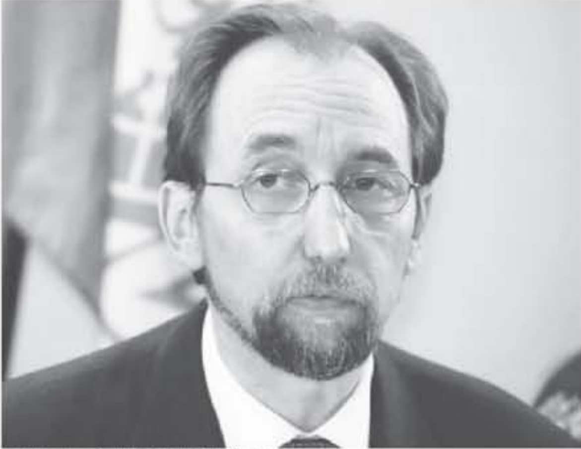
عربي الأمير زيد بن عبد الحسين