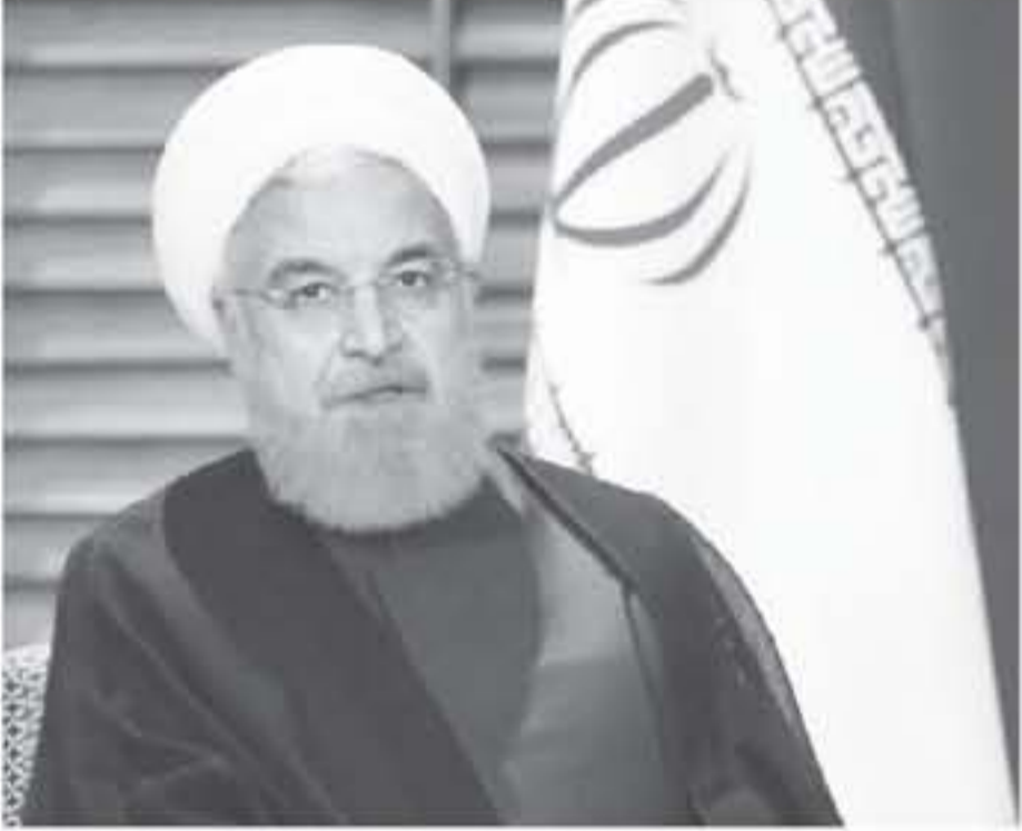
الرئيس الإيراني حسن روحاني في الصين يوم التاسع من يوليو حزيران 2018

سيروحون روحاني في زيارته التي ستشتمل لتوقيع عدد الاتفاقات الثقافية والاقتصادية وسياسية.