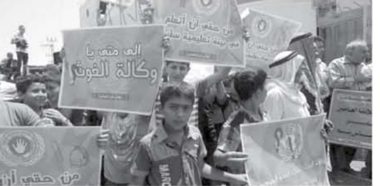
وفيات احتجاجية ضد تقليص الانروا

اعتبرت الجبهة الشعبية لتحرير فلسطين مخرجات اجتماع اللجنة الاستشارية لوكالة غوث وتشغيل اللاجئين الفلسطينيين (أونروا) والتي تتضمن وقف برنامج الطوارئ لتبرير وتبرير لسياسات الولايات المتحدة المهادنة للاحتياجات على الحقوق الإنسانية والوطنية للاجئين الفلسطينيين عبر تهربها من التزاماتها المالية التي كتلت عليها صراحة قرارات الأمم المتحدة.. وقالت الجبهة في بيان وصل وكالة "صفا" أمس الأربعاء إن الحديث المتكرر عن الأزمة المالية لوكالة الغوث يأتي ضمن خطوات وأجندات مهيبة البيئة السياسية والاجتماعية لتهمير