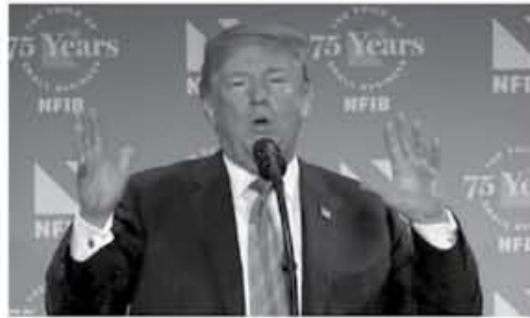
بيكين - رويترز

قالت صحيفة صينية رسمية أمس الأربعاء إن إدارة الرئيس الأمريكي دونالد ترامب «تنتهي الدماء» عندما يتعلق الأمر بتطبيق سياساتها التجارية ضد الصين ولها نريد «قطع شريان حياة» الاقتصاد الصيني. كان الرئيس الأمريكي دونالد ترامب هدو يوم الاثنين يقترح رسوم جمركية بنسبة عشرة بالمئة على واردات صينية قيمتها 200 مليار دولار إذا ردت بكين على رسوم سابقة فرضتها الولايات المتحدة على واردات صينية بقيمة 50 مليار دولار بهدف الضغط على بكين لتوقف سرقة حقوق الملكية الفكرية الأمريكية. ولمهدت بكين بالرد وانتهت الولايات المتحدة بممارسة الضغط الشديد