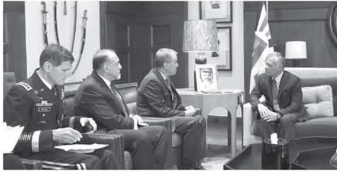
منطقة الشرق الأوسط، والمساعي الرامية إلى إيجاد حلول سياسية لها، وتعيد الأمن والاستقرار لشعوبها، وحضر اللقاء رئيس هيئة الأركان المشتركة ومستشار جلالة الملك، مدير مكتب جلالة الملك.

استقبل جلالة الملك عبد الله الثاني في قصر الحسينية، أمس الأربعاء، وكيل وزارة الدفاع الأمريكية للشؤون السياسية جون رويد، وقائد القيادة المركزية الأمريكية الفريق أول جوزيف فونتين والوفد المرافق، في اجتماع جرى خلاله استعراض العلاقات الاستراتيجية الاستراتيجية بين الأردن والولايات المتحدة، والتطورات في المنطقة.