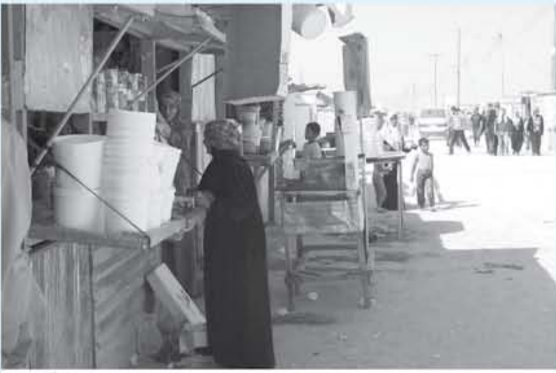
مخيم الزعترى للاجئين السوريين (أرضيحية)

دعا المكتب الإقليمي لمنظمة الصحة العالمية لشرق المتوسط إلى تجديد الدعم من أجل حماية اللاجئين والشازحين والحفاظ على رفاههم، وضمان حصولهم على الحصول على الخدمات الصحية بكفاءة، بدءاً بتحصين الوصول إلى الرعاية الصحية، وحفظ المياه والإصحاح الآمن، والسكن والتغذية، وانتهاء بتوفير المساعدات الإنسانية والوقائية من الأمراض.