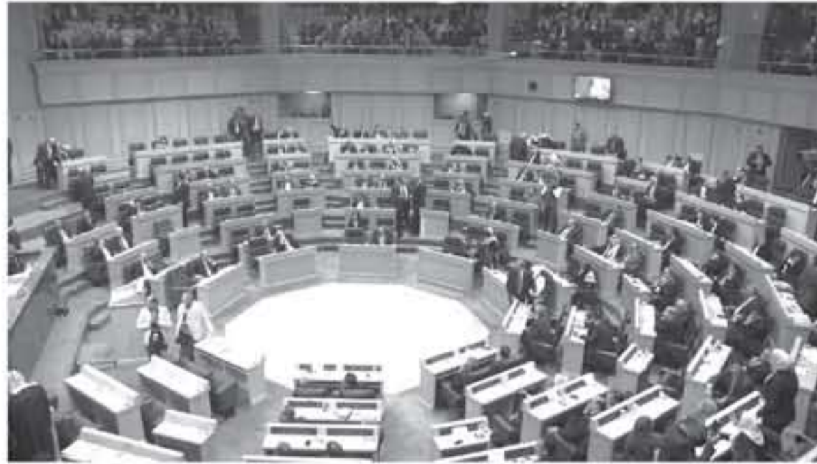
عمان - الأنباط

أحالت الحكومة مشروع القانون المعدل لقانون الجرائم الإلكترونية لسنة ٢٠١٨، والأسباب الموجبة له إلى مجلس النواب بتاريخ ٢٠١٨/٥/٢٨، بحسب المحادثات الرسمية الصادرة عن رئاسة الوزراء. وتؤكد المحادثات أن مشروع القانون أُنشئ في جمعية مجلس النواب الذي يستطيع التعامل معه وفق الصلاحيات الدستورية.