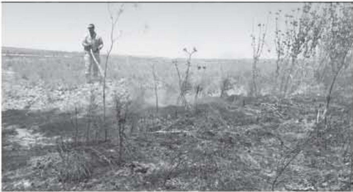
حرق احرار المستوطنات