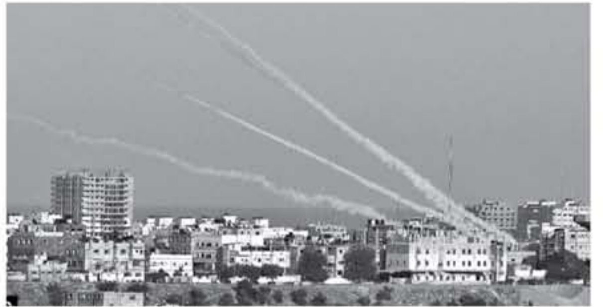
صواريخ المقاومة ترد على العدوان الاسرائيلي

ونقلت عنه قوله إن "حماس مخبطة إذا ما اعتقدت بأنها ستتردد بالدخول لمواجهة عسكرية جديدة، وأن هناك تمسك في الرد وأنه أخذ باستخدام هرم الرد عن الأسفل للأعلى، وأنه مستعد للدخول لمواجهة محدودة لأيام أو مواجهة شاملة.. ولفتت إلى أن "خلاصة الموضوع تشير إلى أن الجيش لن يسمح لحماس بمواصلة محاولاتها بخلق قواعد لعبة جديدة.. كما زعم الجيش أن "الحركة تلقت منذ ٣٠ مارس الماضي ضربات قوية وجوهرية وأنه حال لم تكن بذلك فهناك سلطة خطوط القادمة من بينها الاشتيالات لإرسال الرسالة بشكل أفضل لتجانب الأخر". على حد تعبيره.