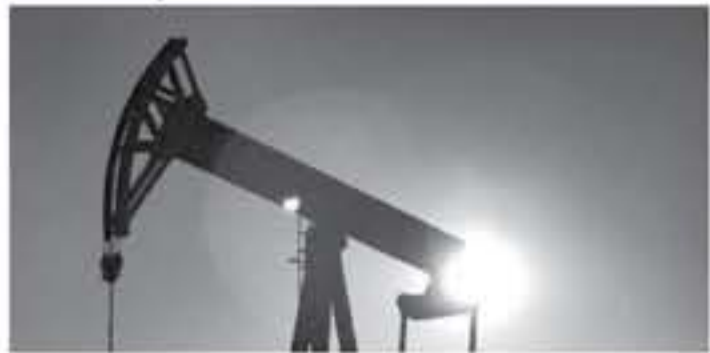
أوبتي - سكاى نيوز

لحام القياس العاشر مزيج يرتت 22 سنتا أو 0.3 بالمئة إلى 78.20 دولار للبرميل في الساعة 00:08 بتوقيت غرينتش عن آخر إغلاق. وصعدت كذلك العقود الآجلة لخام غرب تكساس الوسيط الأميركي 27 سنتا أو 0.1 بالمئة لتسجل 76.73 دولار للبرميل. ولمضي اجتماع لاوبك وحلفائها الجمعة في فيينا يظل على الأسواق. ومن المتوقع أن يتخذوا قرارا خلال الاجتماعات بشأن ما إذا كانوا سيزيدون الإنتاج العالمي والتي هي مدى ستكون الزيادة