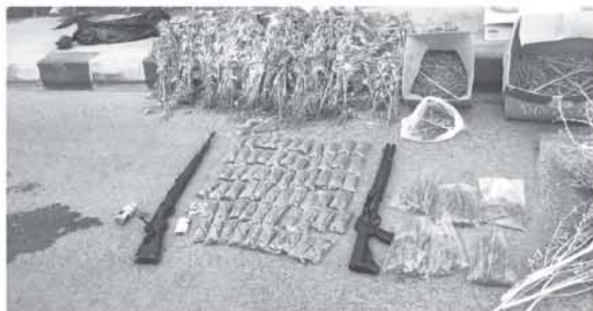
ضبط مادة حشيش مخدر في إحدى الشقق