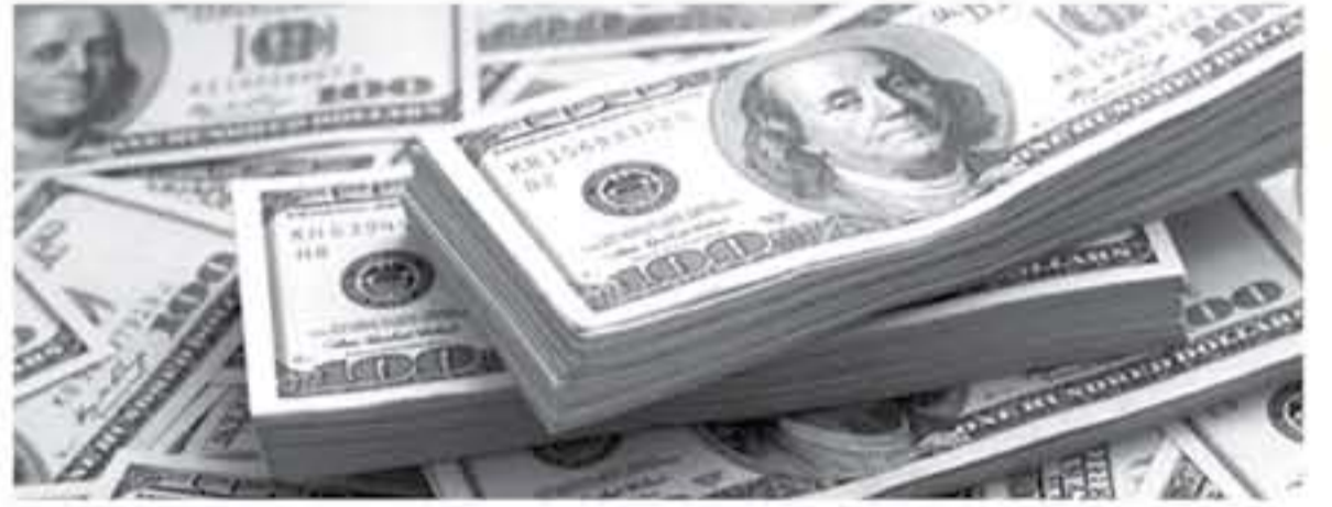
واشنطن - بتر

سجل الحساب الجاري الأميركي عجزا بلغ 124 مليار دولار خلال الربع الأول من العام الحالي. وجاءت نسبة العجز أقل من التوقعات التي أشارت إلى عجز بمقدار 129 مليار دولار. وسجل الربع الأخير من العام الماضي عجزا بمقدار 116 مليار دولار بعد التعديل من عجز بمقدار 128 مليار دولار.