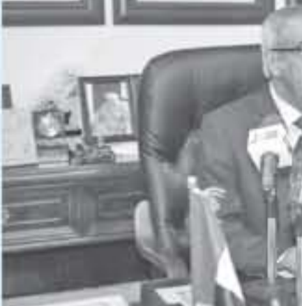
التمكين سلامة قوافل المساعدات وهناك خطط لمساعدة 2٥ الف من النازحين.

وإذ ان هناك ثلاث اولويات تعمل عليها قوات التحالف