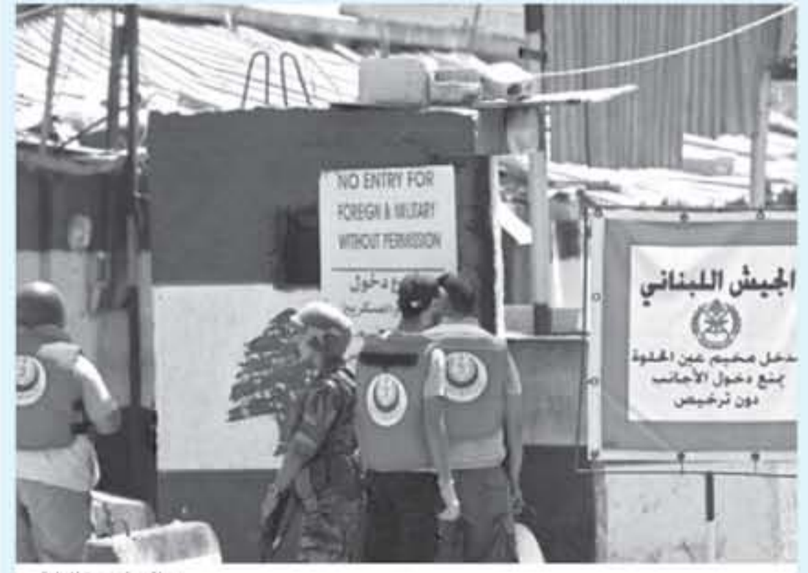
مدخل مخيم عين الحلوة

الحلوة ووضع البوابات الالكترونية حولته وتأثيرها على المخيم وسكانه. ووعد بري حينها بمتابعة موضوع المخيم والكيوآبات وبمحنه مع جهات الاختصاص.