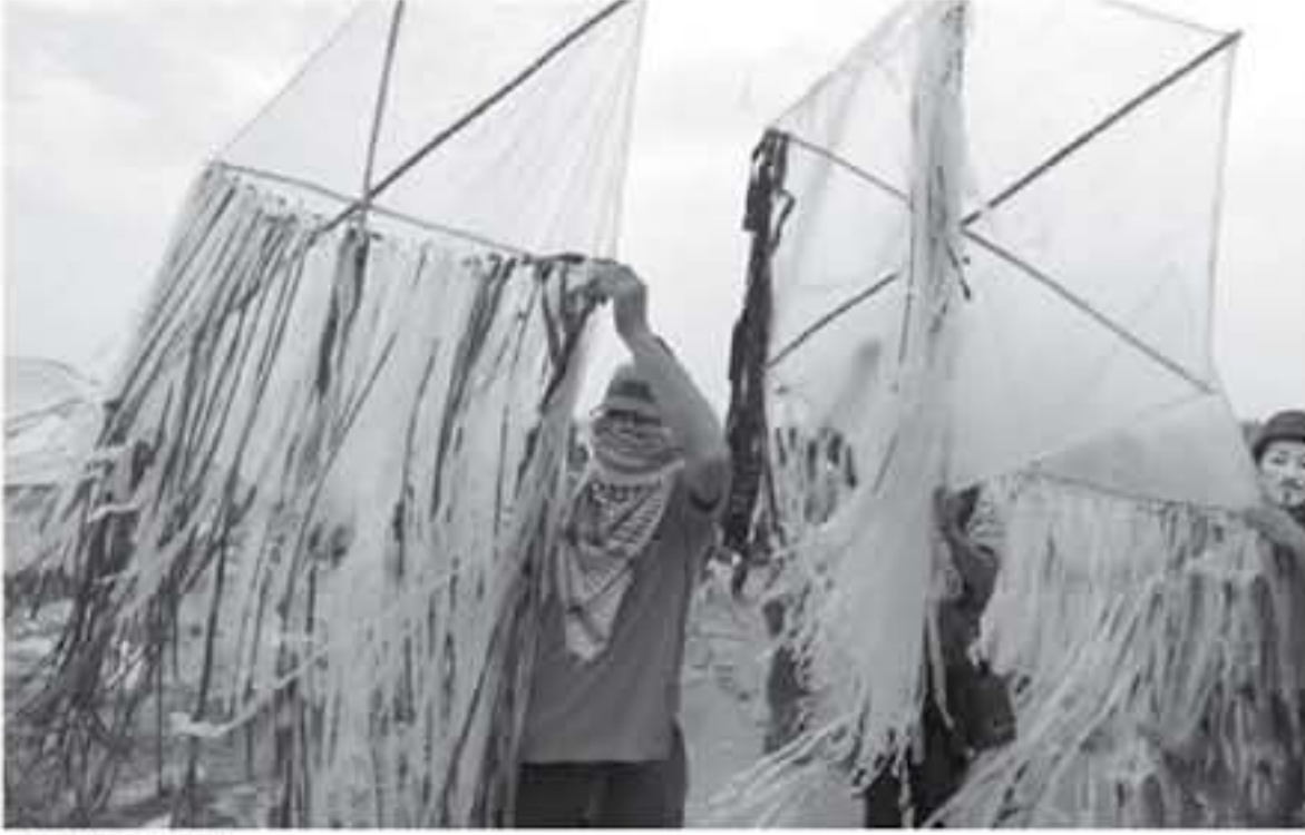
سلاح المقاومة الجديد

يسمرون تدريباً وفق الاقتراحات المقدمة من الأمم المتحدة لكن العائق يتمثل في جانبين: الأول أن رام الله لا تزال ترفض أي تسهيلات لغزة وتصر فيها طريقاً لإنشاء دولة فيها، والثاني أن إسرائيل لم تتخذ - على رغم الاجتماعات الوزارية الأخيرة في تل أبيب - قراراً واضحاً في شأن غزة، وذلك في ظل معارضة مشتملة بوزير الأمن أفينغور ليرسمان، الذي يرفض إجراء أي تحقيقات من دون مقابل.