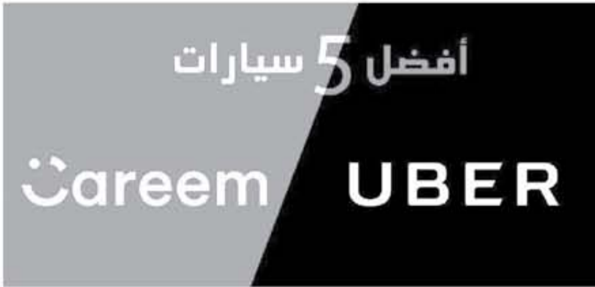
دبي - وكالات

التسجيل في كريم واوبر بدأ يشهد إقبالاً واسعاً، حيث بدأت تظهر هذه التطبيقات كبديل حقيقي عن المواصلات التقليدية، وبما انقالب فإن العاملين مع هذه التطبيقات يجدون فيها طريقة سهلة وأمنة لتعقيق دخل إضافي في وقت فراغهم.