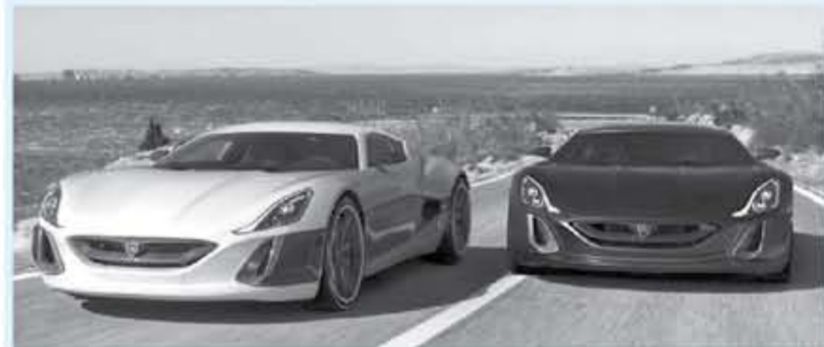
ميونخ - وكالات

اشتهرت شركة ريماك - Rimac الكرواتية المتخصصة بصناعة السيارات الكهربائية بشكل عالمي، بعد أن تعرض ريتشارد هاموند - Richard Hammond، السطح الشهير الذي قدم خلال سنوات طويلة حلقات برنامج لوب غير برفعة جيري كلاكسون قبل أن ينتقل معه لتقديم برنامج ٥ جران تور برفعة زعيمهم الثالث، جيمس ماي، في شهر يونيو الماضي لحادث عرلف جدا على متن أحد أحدث السيارات السريعة ريماك كونستيت ون - Rimac Concept One.