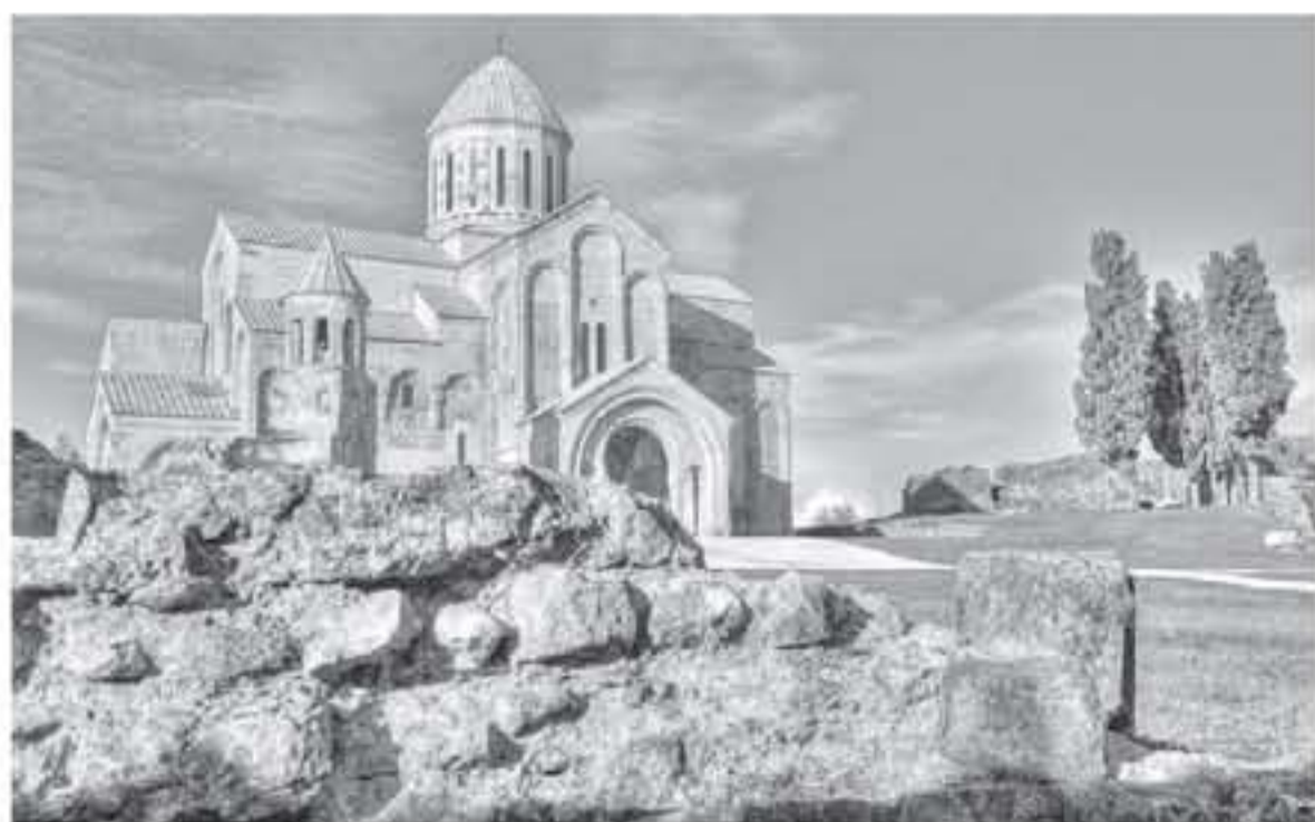
رصد جملة خنفر

الحالية إلى القرن الحادي عشر ، لكن السجلات التاريخية تشير إلى أن الكنيسة بنيت في هذه البقعة منذ القرن الثامن. الحدود مارتيفيلي يعتبر الحدود مارتيفيلي من أجمل الأماكن التي يمكنك زيارتها بالقرب من كوتايسي. حيث يتنوع المشهد الطبيعية الخلابة وفرص الترفيه المتنوعة. حيث يمكنك عند الزيارة الاستمتاع برحلات القوارب عبر المياه الهائلة والمناظر الساحرة التي ستزيد من روعة الرحلة. فضلاً عن ذلك وعلى مقربة من الإخوة ستتمتع برحلة عبر التلفريك للوصول إلى دير مارتيفيلي الذي يقع في موقع مذهل في أحضان الطبيعة مع إطلالة مميزة على المدينة ومشاهدها الجميلة.