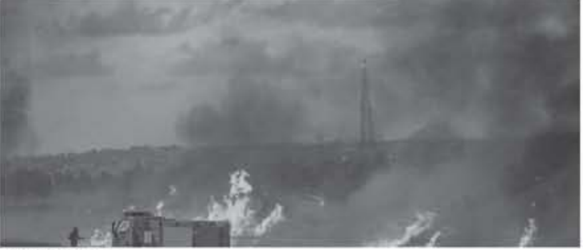
حرائق الطائرات الورقية

على مسجات حساسة شكلته من اكتشاف الطائرات الورقية البعيدة في السماء، ويعدّها يطلق الجنود عبارات ذميمة باتجاه الهدف لإسقاطه. ويبلغ ثمن كل تسكوب من هذا النوع 1٠ آلاف شيل (الدولار = ٣.٧٧ شيل)، بينما يبلغ ثمن كل رصاصة لتطلق ١,٩٠ شيل فقط. وقال جيش الاحتلال إنه جرب هذه الطريقة الأسبوع الماضي على حدود القطاع، زاعماً أنها "أثبتت نجاحها". جرى إسقاط الكثير من الطائرات والبالونات بالرصاص..