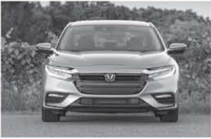
توكيو - وكالات

المرفق صورته ضمن هذا الخبر ظهر نسخة الإنتاج التجاري في شهر يناير بداية العام الجاري ضمن فعاليات معرض ديترويت للسيارات، لتصبح هذه السيارة اليابانية سيارة سيدان حديثة على عكس الجيلين السابقين لها اللذان كانا ضمن فئة سيارات الهجين.