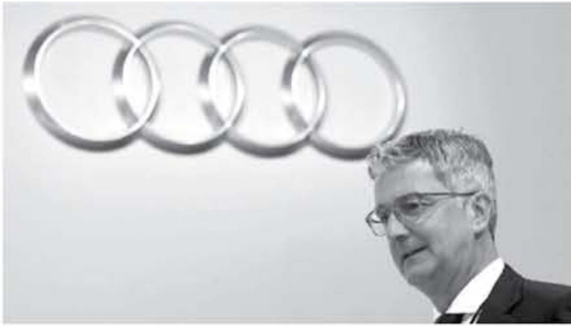
برلين - BBC

قامت السلطات الألمانية باعتقال السيد روبرت ستادلر المدير التنفيذي لشركة اودي، على خلفية التلاعب التي تتعلق بفضيحة التلاعب في الانبعاثات شاز ثاني أكسيد الكربون الصادر من محركات الديزل المستخدمة في سيارات اودي الإنتاجية. وأكد المتحدث رسمي باسم مجموعة فولكس فاغن الألمانية المانكة لعلامة اودي اعتقال ستادلر، كما صرحت النيابة العامة في ميونخ إنها اتخذت هذا الإجراء على خلفية الاشتباه في سعي ستادلر إلى إخفاء أدلة.