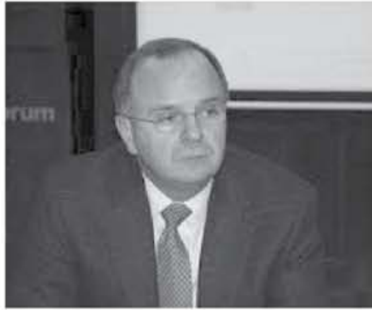
الحالي بتوفير ١٠ آلاف فرصة عمل بالدوحة لاردنيين ، وضع استثمارات في داخل المملكة او خارجها . وكانت دولة قطر تعهدت في حزيران