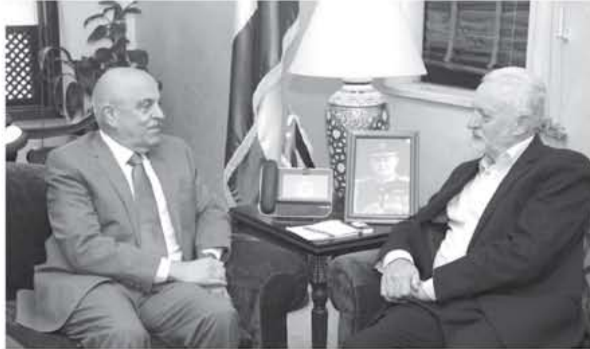
عمان - بترا

كوربين: من حق الشعب الفلسطيني العيش بسلام على أرضه