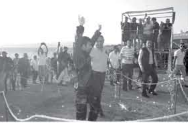
العقبة