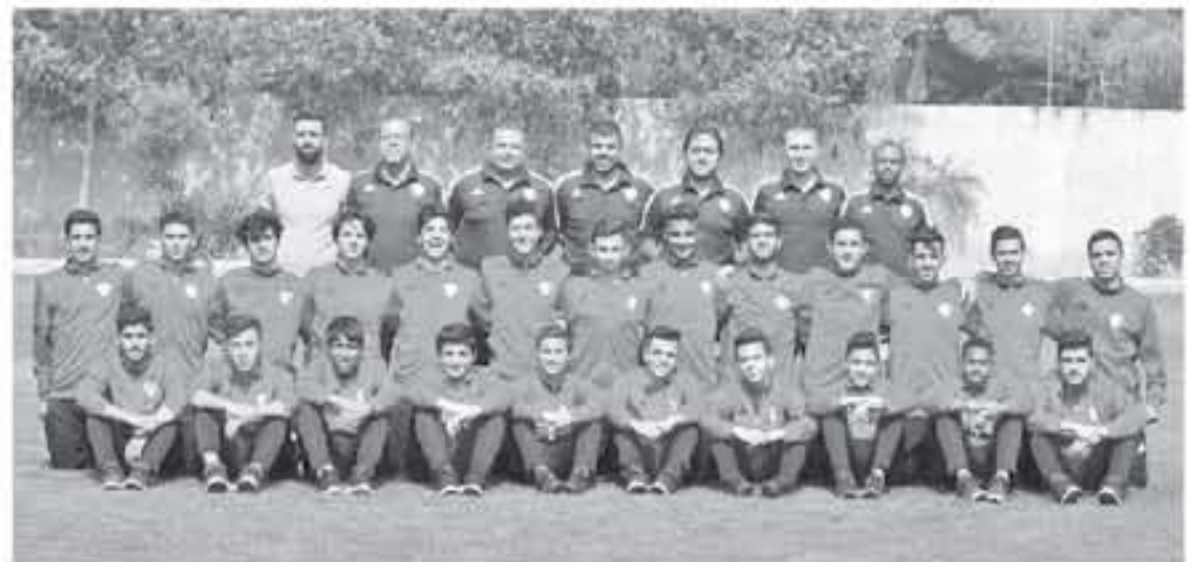
عمان - الانباط يعد منتخب الناشئين ب 16 لكرة القدم في معسكر داخلي غد يمتد حتى السبت 30 الحالي، تأهبا للاغارة المنتخب الإيراني وديا في عمان، استعدادا للمنهائيات الآسيوية التي تقام في ماليزيا ايلول