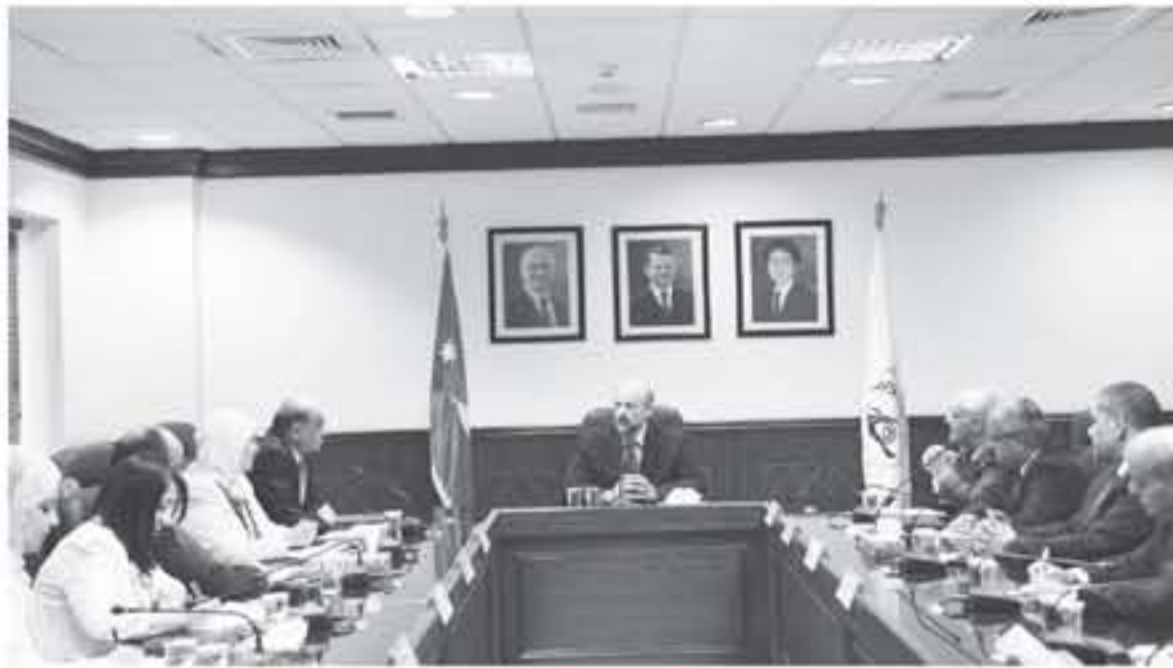
عمان - بترا

خلال زيارته الى هيئة النزاهة ومكافحة الفساد