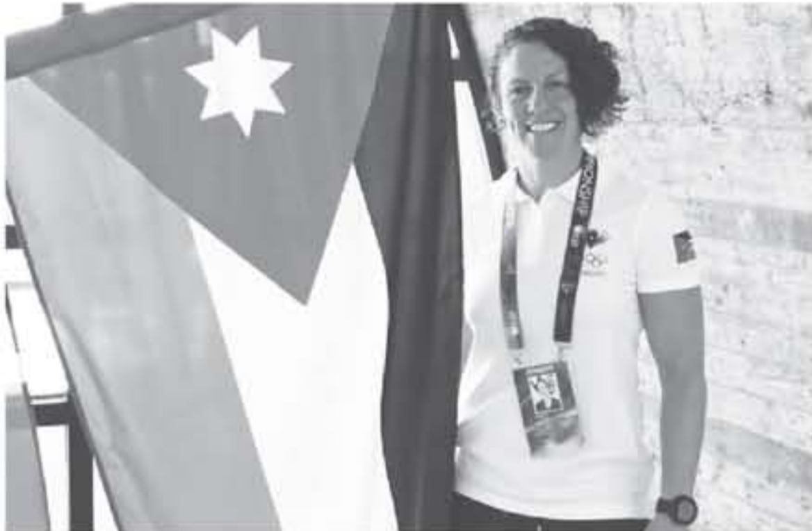
عمان - الأنابط

هل يعقل ان تسجل منتخبنا الاربعة الخروجات الاولى من البطولة... ومن اول مباراتين لخوضها ودون ان تحطف ولو لحظة واحدة من اصل ٢١ نقطة متاحة.. هل وصلنا لتلك الدرجة من الضعف لكي ينال البعض منها خمسة اهداف وكأنها لم تر الاعداد او ممارس الكرة من قبل.. ورغم ان كرة القدم في الدول العربية الافريقية الثلاثة متقدمة وقريبة من المستويات الأوروبية.. التي جانب الاهتمام غير المسوق والامكانيات المتاحة امام المنتخب السعودي... ورغم ذلك لا زلنا والقش مثلنا من لا نشترقان !! مانا ينقص الكرة العربية حتى نراهن على تقويها وابداعها... وكيف يمكن لها ان تغار المنتخبات العربية والخبير... وثبات لا تستثمر تفوق نجوم الكرة العرب في ملاعب أوروبا لكي يكون منتخبنا حضورها القوي في البطولات الكبرى.. هي اسئلة عديدة طرحها عشاق الكرة العربية لا تملك معها اجابات واضحة لا سيما وان الادارة الرياضية العربية لم تسهل للاحتراة التي تؤهلها لقيادة العمل الرياضي نحو النجاح.. ولأجل هذا سوف يستمر مسلسل السقوط لا محالة..!!/