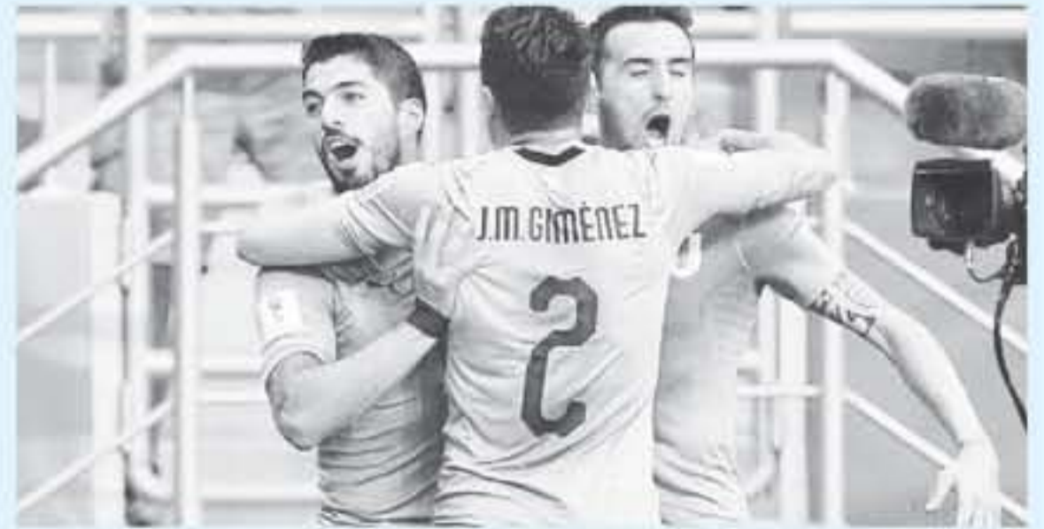
موسكو - وكالات

السعودية ضمن الجولة الثالثة من المجموعة الأولى. انتهت مباراة منتخب الطرانة ضمن الجولة الثالثة بهزيمة قاسية أحبطت كل آمال زملاء صلاح للعقد إلى الدور الثاني. بعدما هزموا بثلاثة أهداف مقابل هدف وحيد عن طريق ركلة جزاء سددها نجم ليفربول وهداف الدوري الإنجليزي محمد صلاح. ليظل المنتخب المصري دون نقاط بعد أن هُزم في الجولة الأولى أيضاً من منتخب الأوروغواي بهدف دون رد.