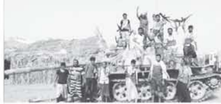
مقاتلون قبليون يقاتلون الحكومة اليمنية بالقرب من المدينة يوم 1 يونيو حزيران 2018