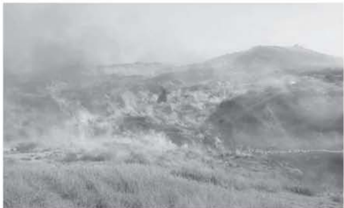
حريق في غلاف غزة

اندلع ٢٠ حريقاً أمس الأحد في مستوطنات إسرائيلية بغلاف قطاع غزة بفعل طائرات ورفية وبالونات حارقة، وأهأه مراسلاً بالاندلاع حريق يعتبر الأول من نوعه في مستوينة "دوروث" على بعد عدة كيلو مسترات شرق مستوينة "سيديروت" بفعل بالون حارق أطلق من شمال القطاع. وأشار إلى اندلاع حريق في مستوينة "بيتكوت" التي تبعد عن قطاع غزة أكثر من ١٧ كيلومترا بفعل بالون حارق. وقال إن حريقاً اندلع في أحراش غاية "شوكاه" شرق مستوينة "بيري" شرق المحافظة الوسطى بفعل بالون حارق أطلق من قطاع غزة. فيما اندلع حريق آخر قرب مستوينة "بير عام"، وحريق آخر في مستوينة "بيري" شرق مخيم البريج وسط قطاع غزة بفعل بالونات حارقة. واندعت بعد ظهر اليوم ٣ حرائق في حقل الاحتلال شرق المحافظة الوسطى بفعل بالونات حارقة أطلقت من غزة. واندلع حريق في مستوينة "حوليت" جنوب منطقة صوفا بفعل بالون حارق أطلق من قطاع غزة، وحريق جديد في مستوينة "تيريم" بفعل بالون حارق أطلق من غزة. وقالت القناة ٧ العبرية إن عواقم الإطفاة لتعامل حائلاً مع ٥ حرائق جديدة في مختلف غزة "شاحل عوز" وزيكيم ومغلاسيم وكفار غزة وبيري" والتي اندلعت بفعل بالونات حارقة أطلقت من غزة. ولفت مراسلنا إلى اندلاع حريق