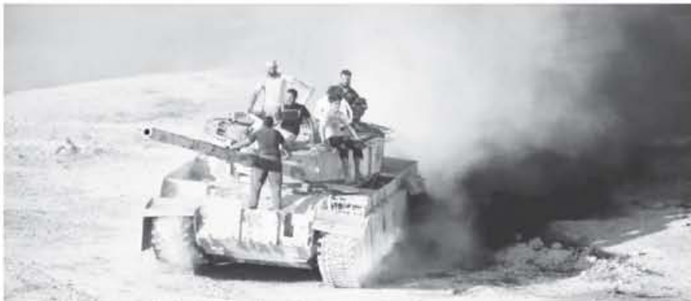
مسجون على متن دبابة في درعا في جنوب سوريا في الثالث والعشرين من حزيران/يونيو 2018

اليوم السادس على التوالي، تستهدف الطائرات الحربية محافظة درعا في جنوب سوريا، وذلك في إطار الهجوم العسكري المستمر لقوات الجيش العربي السوري في منطقة تحيط بأهمية استراتيجية. وتشهد محافظة درعا منذ يوم الثلاثاء تصعيده عسكرياً تمثل بتكثيف قوات النظامية قصفها لتريف الشرقي لهذه المحافظة حيث حققت تقدماً ما يُقدر بعملية عسكرية وشيكة في منطقة تسيطر على أجزاء واسعة منها فصائل مسلحة يعمل معتمداً تحت مظلة الثورة الأميري الأرنؤي.