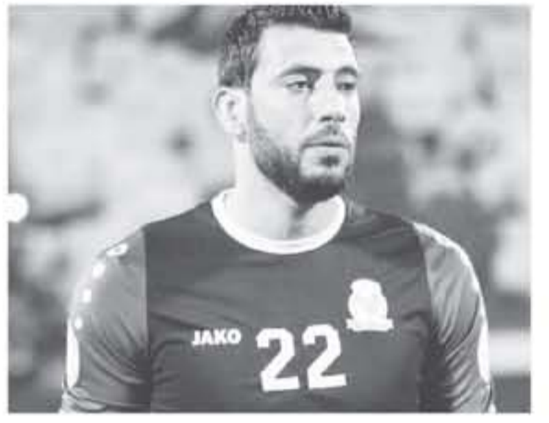
عمان - الأنابط

ويتنظر النادي وصول المدرب التونسي نبيل الكوكي اليوم ، تسهيلا لمباشرة التدريبات غدا وفق الاتفاق المبرم بين الطرفين .