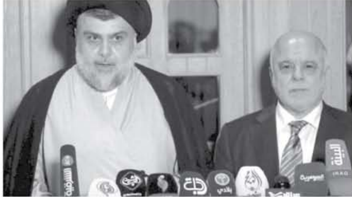
وكالات - عواصم - الأنباط - ما بين العنري

أعلن رئيس الوزراء العراقي زعيم "التحالف النصر" حيدر العبادي وزعيم التيار الصدري مقتدى الصدر، السبت، تحالفهما لتشكيل الكتلة الأكبر داخل البرلمان ومن المرجح أن يرفع هذا التحالف من أسهم العبادي في الحصول على ولاية ثانية كرئيس للوزراء، وأوضح الصدر خلال مؤتمر صحفي مشترك مع العبادي بمدينة النجف، تشكيل "تحالف عابر للطائفية" من خلال الاتفاق على برنامج جديد مع قائمة الصدر، يتناول أهم ما سيتم العمل عليه في الحكومة المقبلة.