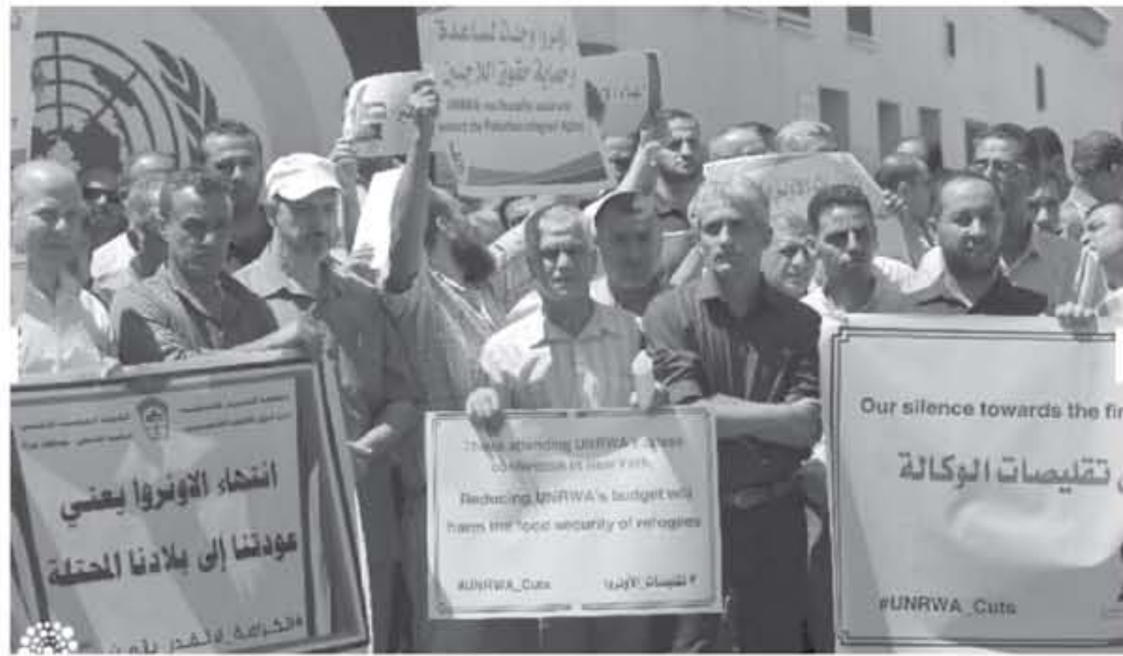
وقف احتجاجية في غزة

لا يذكر أمام إرادة هذه الدول التي ساندت الأونروا خلال سبعة عقود مضت. ولتجهد الأناضار إلى مؤتمرات المانحين المتعددة في مبنى الأمم المتحدة بنيويورك، إذ إن المؤتمر مخصص للردول المانحة لـ "الأونروا" لتجمع مبالغ مالية قيمتها 200 مليون دولار. وأعلن المفوض العام للأونروا بيير كريستوبل في مؤتمر سابق له مطلع عام 2018 عن قيمة العجز الثاني للأونروا والبالغ 116 مليون دولار، إثر عدم التزام الولايات المتحدة الأمريكية بحصتها السنوية نتيجة موقفها السياسي تجاه القضية الفلسطينية وقضية اللاجئين. ويبين المسائل أن سد 206 مليون دولار لأمن واستقرار وسلامة حياة 5 ملايين لاجئ فلسطيني في غزة والضفة وبنان وسوريا والأردن هو زهيد ورخيص أمام ما يتفقد العالم من مبالغ طائلة من أجل الحرب وعدم الاستقرار. وأضاف "على الرغم مما تواجهه الوكالة من أزمة مالية غير مسبوق، وحتى لو لم يتم سداد كل أو جزء من العجز الثاني فهذا لا يعني انتهاء عمل الأونروا، فالتدي يمتدك صلاحية إنهاء أو بقاء وكالة الغوث هي الجمعية العامة للأمم المتحدة.