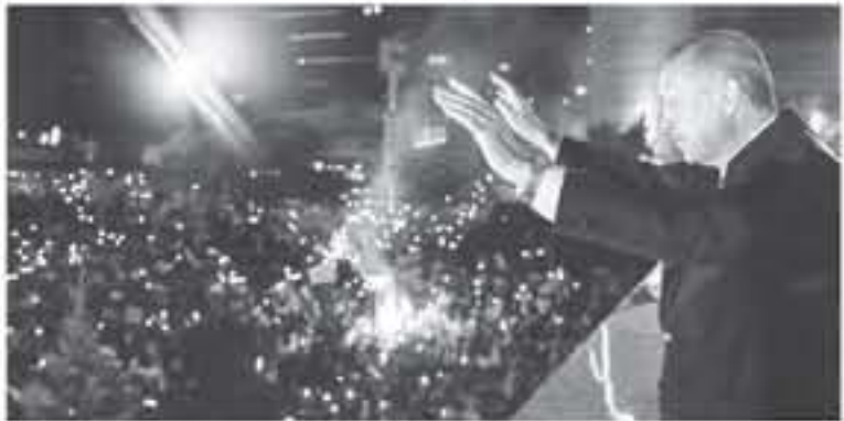
الرئيس رجب طيب إردوغان يعلن أسأله من شرفة مقر حزب العدالة والتنمية الحاكم في أنقرة في ٢٤ حزيران/يونيو