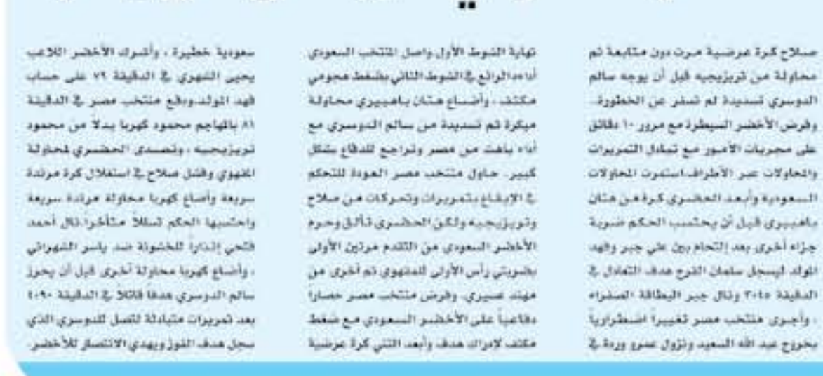
موسكو - وكالات

حصد المنتخب السعودي فوزاً في الوقت الثاني على حساب شقيقه المصري بنتيجة 1-2 لتقدم منتخب مصر بهدف محمد صلاح في الدقيقة 29 والتعادل المنتخب السعودي بهدف من صدارة جزاء في الدقيقة 45:45 قبل نهاية النوبة الأولى من طريق سلمان الفرح، وأهدر الأخضر ضربة جزاء من فهد الفول، تصدى لها الحارس من صناد الحصري قبل أن يحوز سالم الحصري هدف الفوز في الدقيقة 50:45. بدأت المباراة بمحاولة سعودية عن طريق نسوية لعين الفولوي، وأرسل