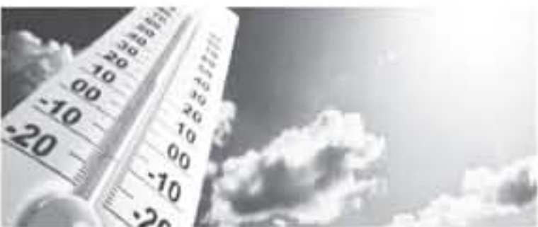
عمان - الانباط

بحوالي (٤-٥) درجات مئوية، والأجواء تكون حارة بوجه عام في اغلب مناطق المملكة، وحارة جداً في الأضواء والبحر الميت والعقبة، والرياح شمالية غربية معتدلة السرعة، وتتراوح درجات الحرارة العظمى والصغرى في عمان اليوم، ما بين ٢٢- ٢٠ درجة مئوية والمناطق الشمالية ٢٢ - ٢١ والمناطق الجنوبية ٢١ - ١٩ فيما تصل العظمى في مدينة العقبة إلى ٤٠ والصغرى ٢٩ درجة مئوية.