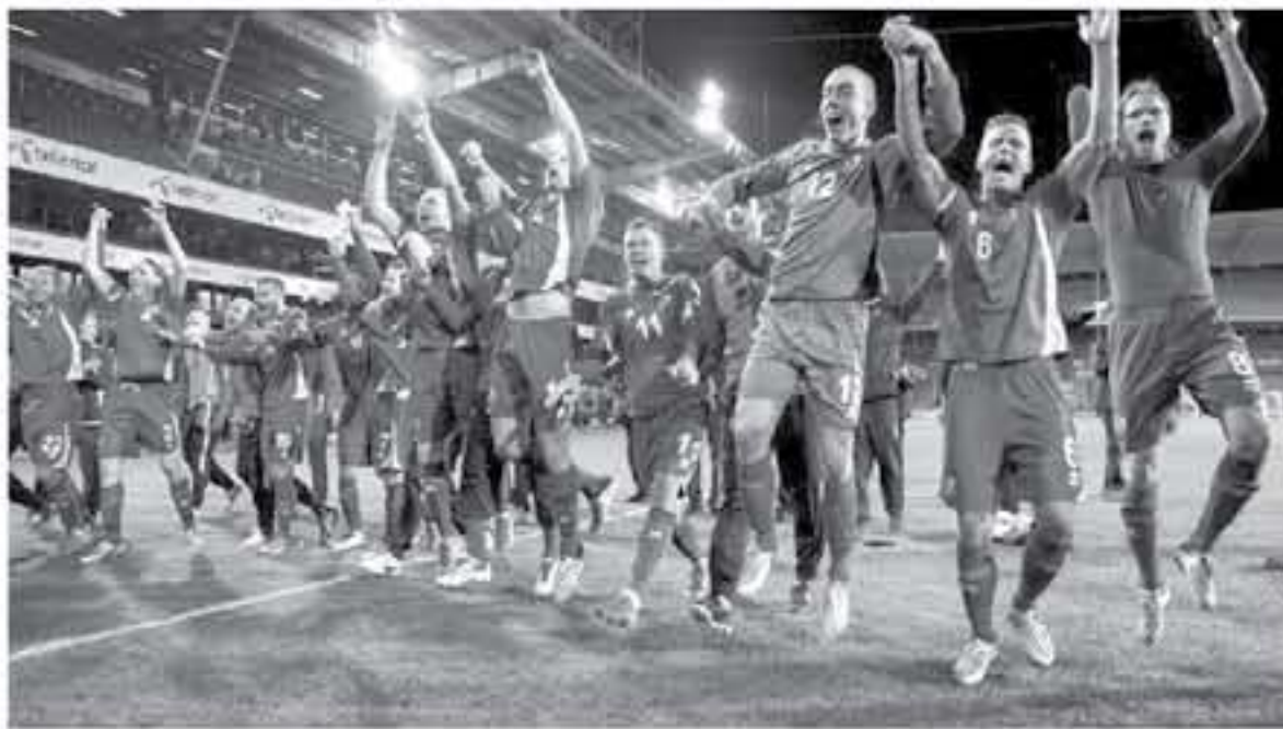
موسكو - وكالات

يجم على الأرجنتين هزيمة نيجيريا، لتتحقق على آمالها في التأهل لدور الـ 16 في كأس العالم لكرة القدم. وحلم القائد ليونيل ميسي في الفوز بأول ألقابه على صعيد البطولة. وعادت نيجيريا لأجواء البطولة بعد تسييرات خطيبة عقب الخسارة 2-0 في المباراة الأولى أمام كرواتيا لتنتصر بالنتيجة ذاتها على أيسلندا ولن تخشى منافستها الشهيرة، حيث سبق وأن التقت الفريقان 6 مرات في 6 بطولات لكأس العالم وقال الألماني جيرنوت رور، مدرب نيجيريا الذي تفوق فريقه على الأرجنتين 4-2 ودياً في تشرين الثاني الماضي في غياب ميسي، نتق في قدرتها على الفوز. استعدنا فكتنا في أنفسنا، واستعد رور المهاجم أوديون إيجالو وأليكس أيوبي عقب الخسارة أمام كرواتيا، ومن المرجح أن يدفع بأحمد موسى وكليشي إيهينانشو أمام بطل العالم مرتين، وسيضمن فوز نيجيريا على الأرجنتين، الذي ظهر بشكل متواضع في أول مبارياتهم رغم وجود العديد من الأسماء اللاعبة بين صفوفها، فأهلهما الدور الستة عشر. وربما يكون التعادل كافياً أيضاً لو نجحت أيسلندا في التغلب على كرواتيا التي ضمنت بالفعل التأهل حسب هازق الأهماء، وبالتالي للأرجنتين ولعماميرها الغيرة، التي قطعت مسافات طويلة عبر العالم بالفئص الأزرق والأبيض الخاص