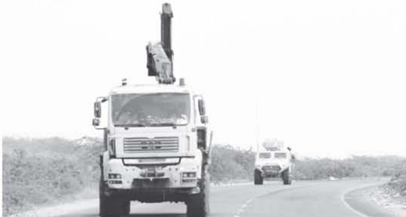
أيتان تابعتان للقوات الموالية للحكومة اليمنية على طريق قرب مطار المدينة في ٢١ حزيران/يونيو

وقال ان "على ايران وكذلك حزب الله اللبناني التوقف عن ارسال الخبراء العسكريين" الى اليمن.