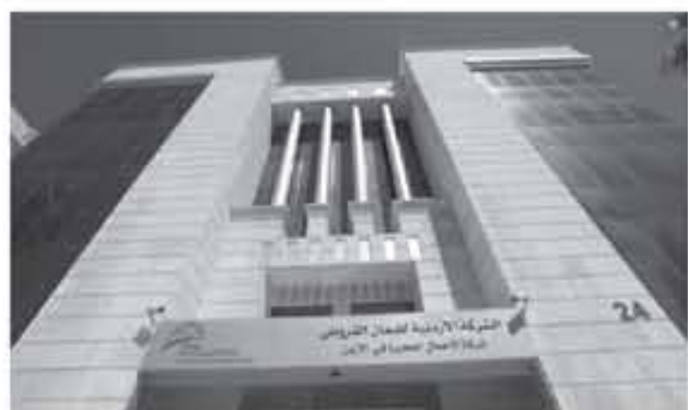
التمويل العمول بها يشار الى أن البرنامج لتدبره الشركة الاردنية لضمان القروض التي يغطي

مخصصات اضافية للبرنامج مكنت الشركة من رفع سقف الضمان ضمن البرنامج من 100 الف دينار الى 250 الف دينار. وكان البنك المركزي يبادر بالتعاون مع البنوك العاملة في المملكة بإنشاء صندوق ضمان المشاريع الناشئة الخاص بالبنوك التجارية وصندوق كفالة تمويل المشاريع الناشئة بالتعاون مع البنوك الاسلامية في نهاية عام 2016 ويبدئ العمل بالبرنامج فعلياً مطلع العام الماضي. وجاءت خطوة البنك المركزي بتوفير مبلغ 50 مليون دينار اضافية للبرنامج ضمن توصيات مجلس السياسات الاقتصادية بغل لتنامي الطلب على هذا النوع من التمويل والحاجة لرفع سقف