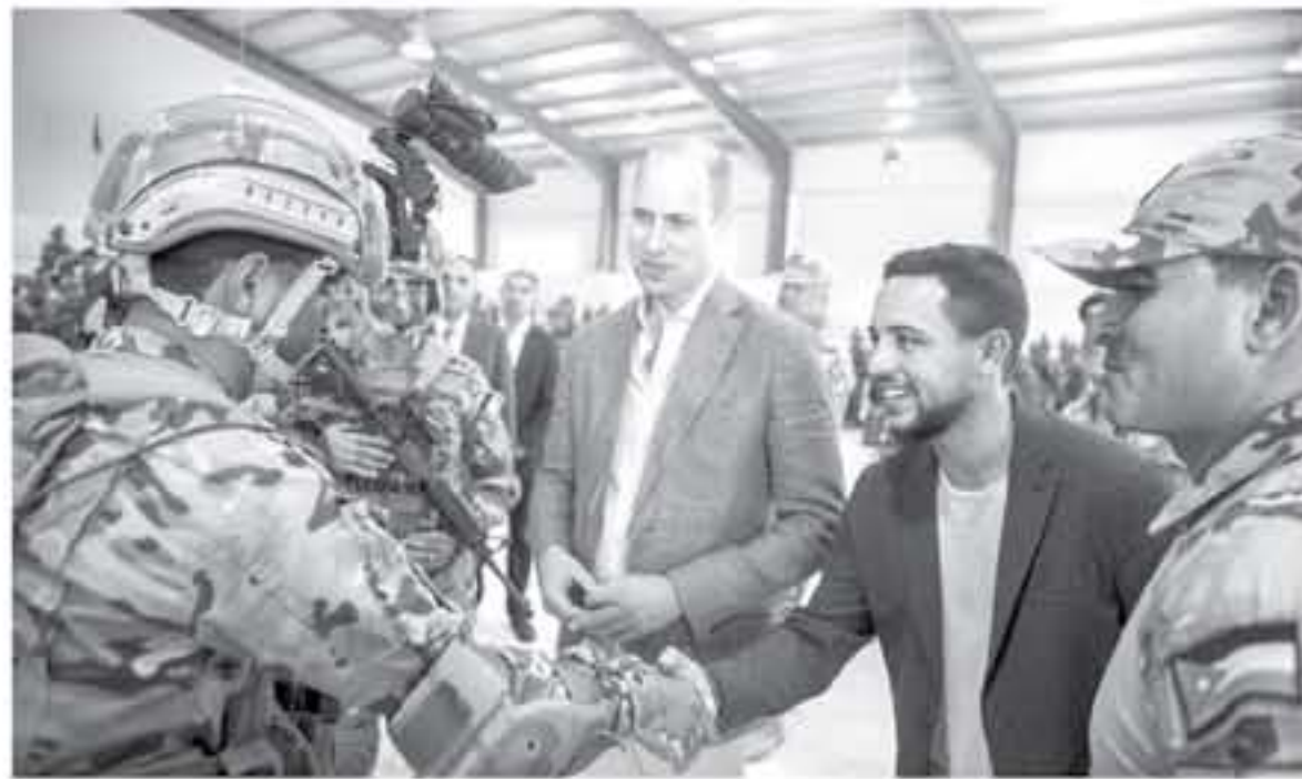
إلى أعلى مستوى من الكفاءة التدريبية والقتالية. وفي نهاية الزيارة، أبدى الأمير الحسين إعجاباً وارتياحاً للمستوى المتميز الذي وصلت إليه الكتيبة والمعدات التي يتبع بها منتسبوها.

زار نائب الملك سمو الأمير الحسين بن عبدالله الثاني وولي العهد، يرافقه سمو الأمير ويليام دوق كامبريدج، أمس، كتيبة رد الفعل السريع / ٨١، إحدى كتائب لواء رد الفعل السريع بموقعها الجديد في المنطقة العسكرية الشمالية. وكان في استقبالهما، لدى وصولهما إلى موقع الكتيبة، قائد لواء رد الفعل السريع العميد الركن زيد العضيلة. واستعرض نائب جلالة مجموعة رد فعل سريع مع إبنائهما القياس ويكامل تجهيزاتها العسكرية، حيث توفر أحدث الأسلحة والمعدات التي دخلت القوات المسلحة الأردنية - الجيش العربي، حديثاً.