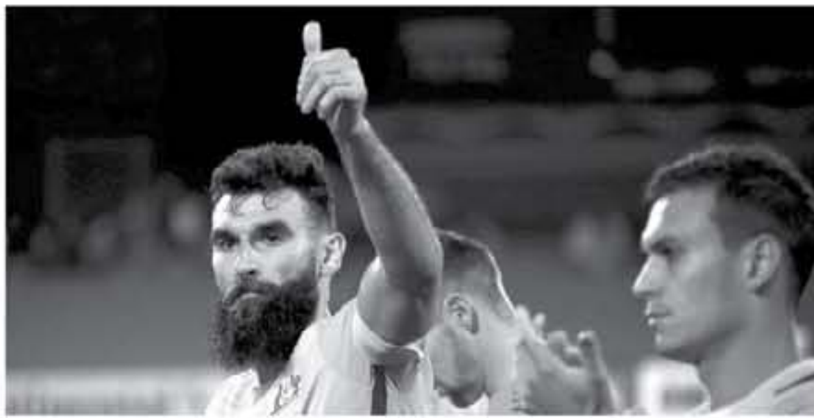
موسكو - وكالات

يفتح ملعب لوجنيكي بالعاصمة الروسية أبوية لاستضافة مباراة منتخب فرنسا ضد نظيره منتخب الدنمارك ضمن مباريات الجولة الثالثة والأخيرة للمجموعة الثالثة بكأس العالم روسيا 2018، والتي تضم أيضاً كلا من منتخب بيرو ومنتخب أستراليا. استطاع الديوك أن يتصدروا في الجولة الثانية على منتخب بيرو بهدف دون رد ليضيف إلى رصيد ثلاث نقاط تضمن لأهله إلى الدور الثاني. بعدما كان قد انتصر على منتخب أستراليا بهدفين مقابل هدف. ليتصدر منتخب فرنسا المجموعة الثالثة برصيد 6 نقاط. يحل منتخب الدنمارك في الوصافة برصيد 4 نقاط، فيد انتصار الدنمياك في الجولة الأولى بهدف دون رد. فرط في الانتصار ليعدو ببطقة واحدة من تعادل إيجابي مع المنتخب الأسترالي في الجولة الثانية. التقي منتخب فرنسا بمنتخب الدنمارك مرتين في كأس العالم، كلاهما في الجولة الثالثة من دور المجموعات، انتصر الديوك في واحدة بنتيجة (2-1) في مونديال 1998.