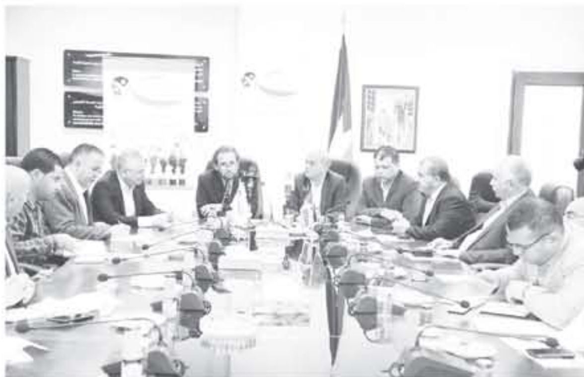
عمان - بتر

بين المنسق الحكومي لحقوق الانسان نائب سمو الامير مرشد بن رعد رئيس مجلس امضاء المجلس الاعلى لحقوق الاشخاص ذوي الاعاقة باسل الطراونة، ان الاردن قطع خطوات نوعية ورائدة في مجال حماية وتعزيز حقوق الاشخاص ذوي الاعاقة المدنية والمسياسية على المستوى التشريعي والمؤسسي. وأكد في تصريح صحافي أمس على هامش اللقاء مع عدد من معلمي وسائل إعلامية متعددة ان قانون الاشخاص ذوي الاعاقة رقم ٢٠ لعام ٢٠١٧، جاء متسجماً مع أعلى المعايير الدولية لحماية وتعزيز حقوق الإنسان سواء في الناحية حقوق الاشخاص ذوي الاعاقة وسائر اتفاقيات حقوق الانسان الأساسية وكذلك العهدين الدوليين لحقوق المدنية والسياسية والحقوق الاقتصادية والثقافية والاجتماعية.