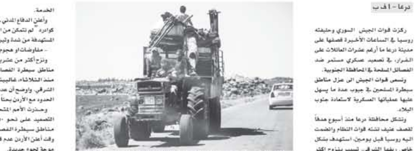
قافلة سورية تكرب عن القصف في محافظة درعا جنوب سوريا في ٢١ حزيران/يونيو ٢٠١٨

الخدمة. وأعلن الدفاع المدني في محافظة درعا أن كوارثه "لم تتمكن من الوصول الى المناطق المستهدفة من شدة وتيرة القصف".