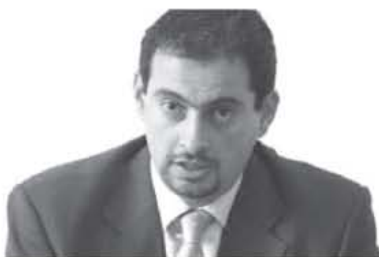
قبل الحكومة الألمانية وطلب دعم الحكومة الألمانية لفتح الأربن تعديل قرار تبسيط قواعد التفتش أمام الصادرات الأردنية إلى السوق الأوروبية.

تحقيق قدر أكبر من التبسيط الإضافي لقواعد التفتش المذكورة خاصة فيما يتعلق بمدة تطبيق القرار وألية احتساب شرط العمالة السورية، الأمر الذي يساهم في تعزيز القدرة التنافسية للمنتجات الأردنية إلى السوق الأوروبي. من جانب آخر التفتش، طارق الحموري مع دأوتريش نوسيبوم وزير الدولة لشؤون التجارة الخارجية الألماني بتاريخ 2018/6/21 وذلك على هامش الزيارة الرسمية للمستشارة الألمانية أنجيلا ميركل إلى المملكة. حيث تم استعراض أليات تعزيز وتنمية المبادلات التجارية بين البلدين سيما وأن ألمانيا تعد الشريك التجاري الأول للمملكة من دول القارة الأوروبية، إلى جانب أليات تعظيم الاستفادة من برامج الدعم الفني والمالي المقدمة من