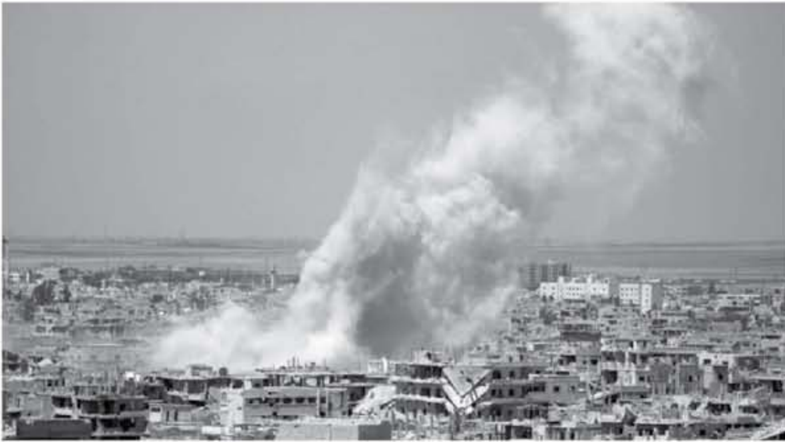
الدخان يتصاعد من مناطق خاضعة لسيطرة المعارضة في درعا اثر غارة جوية شنتها قوات النظام السوري في ٢٥ حزيران/يونيو.