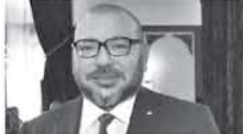
الجهود الدولية المهادنة لتخليق أجواء ملائمة لاستئناف مفاوضات السلام، قصد إيجاد تسوية عادلة وشاملة للصراع الفلسطيني الإسرائيلي.

تحلف كثيرا عن سابقاتها، لأنها تعقد في سياق مستجدات خطيرة تمثل في قرار الولايات المتحدة الأمريكية الاعتراف بالقدس عاصمة لإسرائيل. ونقل سفارتها إليها، وإقدامها على افتتاح هذه السفارة بشكل رسمي بتاريخ 14 مايو 2018. وهي الخطوة التي اعتبرها العرب في حينها مرفوضة وتعارض مع القانون الدولي، ومع قرارات مجلس الأمن الدولي ذات الصلة. كما جدد الملك محمد السادس التأكيد بصفته رئيساً للجنة القدس، إلى استئناف الإعلان عن هذا القرار بنوعيه ورسائله إلى كل من الرئيس الأمريكي، دونالد ترامب، والأمين العام للأمم المتحدة، أنطونيو غوتيريس، جرى فيها الإشارة إلى أن أي مساس بالوضع القانوني والسياسي والتاريخي للقدس ستكون له تداعيات خطيرة على السلام في المنطقة، ويوض