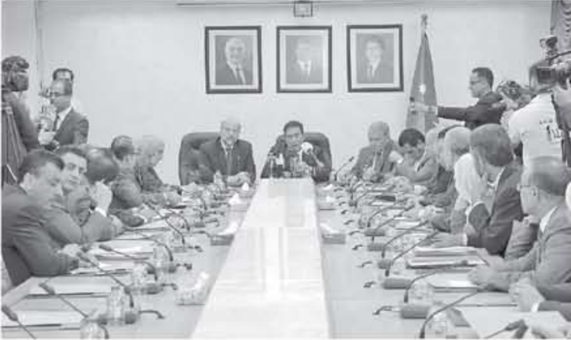
عمان - بتر