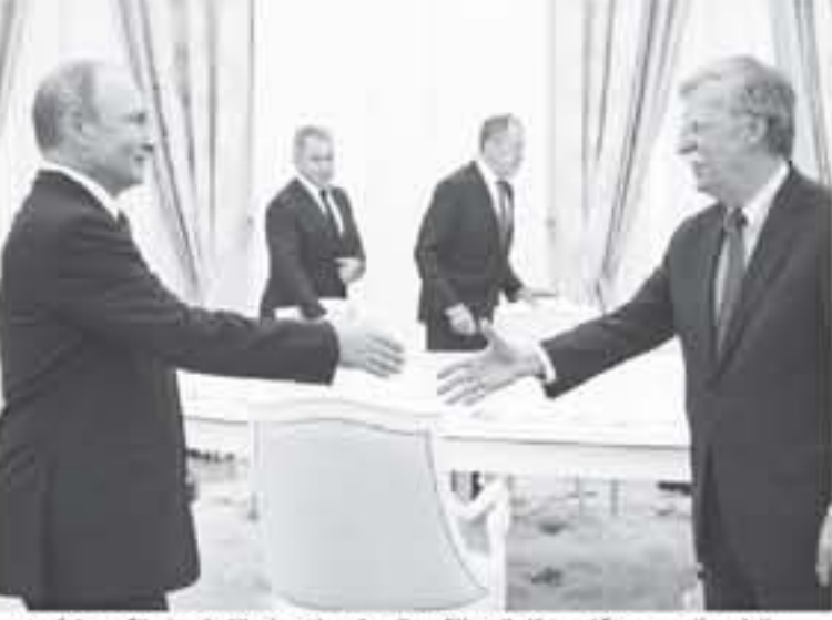
الرئيس الروسي مستشار الأمن القومي الأميركي بولتون في تشرين الثاني/يونيو

وتوقع محللون الا لتناول القمة بين بوتين وترامب حين تعقد، مسائل جوهرية. ويرى مراقبون انه من غير المرجح ان يقدم بوتين اي تنازلات كبيرة في الازمة الأوكرانية او غيرها من القضايا الحساسة. ما لا يمنع الكثير من الحوافز لوضع لراعاة عولائها على موسكو.