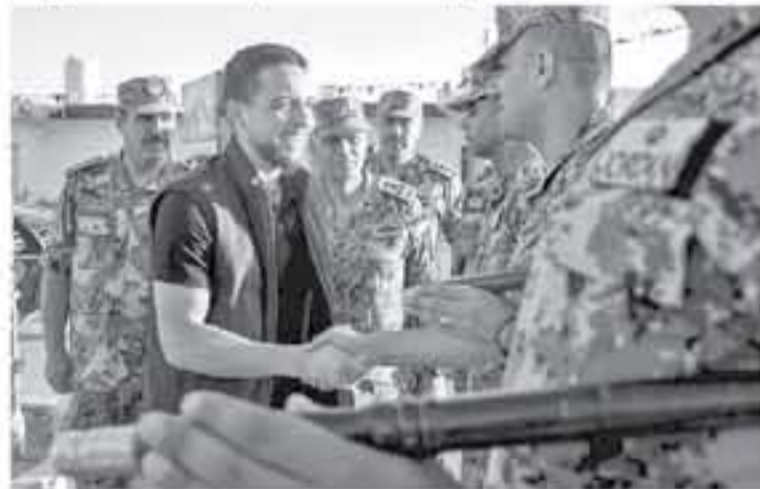
بن عبدالله الثاني الألية الملكية (أم الجيش). وألقى قائد المنطقة العسكرية الوسطى كلمة قال فيها إننا "نسئلكم يا سيدي

ولدى وصول سموه مواقع الاحتفال، كان في استقباله رئيس هيئة الأركان المشتركة بالإنابة اللواء الركن الطيار يوسف الحنيطي، وقائد المنطقة العسكرية الوسطى العميد الركن عبدان أحمد الرفاد، وقائد كتيبة الأمير الحسين