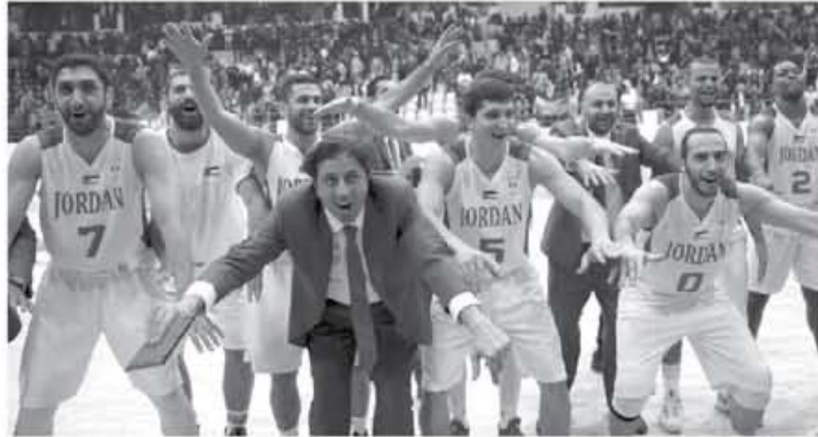
هذا الدور أمام المنتخب الهندي في الأول من الشهر المقبل في صالة الأمير حمزة بمدينة الحسين للشباب