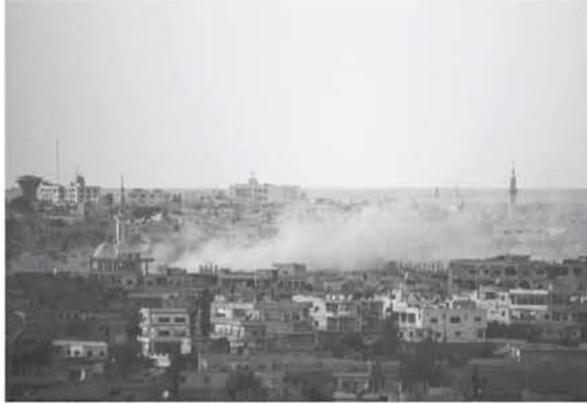
دخان يتصاعد فوق مدينة درعا في جنوب سوريا بعد غارات لقوات النظام السوري في 21 حزيران/يونيو 2018