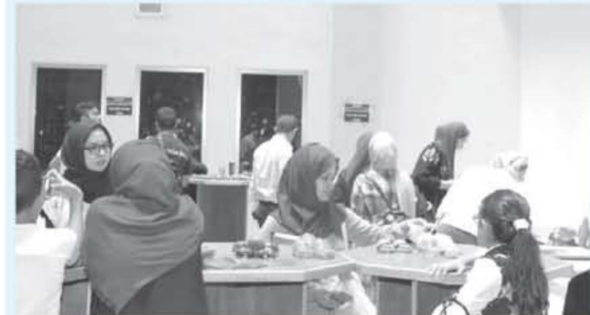
مشاركات في الندوة

على مشاريع ناجحة لعدد من ربات البيوت أسهمت في تحسين أوضاعهن الاقتصادية. يذكر أن مبادرة "حق" هي مبادرة أطلقها سمو الأمير الحسين بن عبد الله الثاني، ولي العهد، بهدف تنمية مهارات الفرد والجماعة للوصول إلى أعلى مستويات الاحترافية في التعاون والعمل المشترك، بهدف إلى خلق علاقة فاعلة بين الشباب قائمة على الاحترام والانضباط والحيطة.