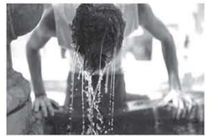
طفل يقتل بالآه تبريد نفسه من شدة الحرارة (أرشيفية)

أشرت على المملكة يوم أمس كتلة هوائية حارة أدت إلى ارتفاع على درجات الحرارة لتسجل أعلى من معدلاتها الإعتيادية مثل هذا الوقت من السنة بحوالي (4-5) درجات مئوية، وسادت أجواء حارة بوجه عام في مختلف المناطق، ورياح شمالية غربية معتدلة السرعة. وبحسب تقرير دائرة الارصاد الجوية تتخف درجات الحرارة قليلاً اليوم، وتكون الأجواء حارة نسبياً في المرتفعات الجبلية والسهول، وحارة في البادية والأغوار والعلبية، والرياح