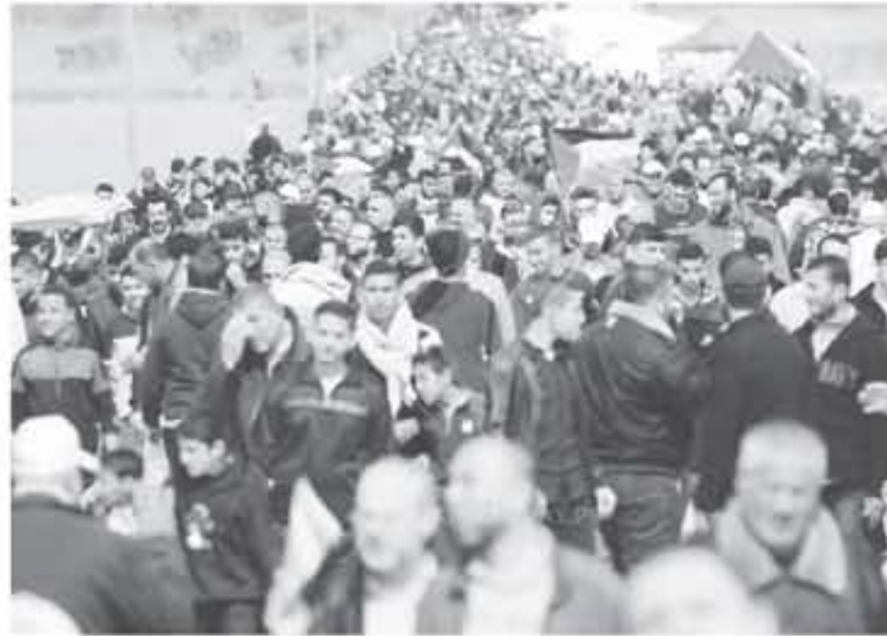
غزة - وكالات

عشر للتظاهرات السلمية، اسم "من غزة إلى الضفة ووحدة دم ومصير مشترك"، لتأكيد على وحدة الشعب في كافة أماكن تواجد، ووحدة الدم والمصير المشترك، في مواجهة المؤامرات التصفوية للضفة الفلسطينية. وأكدت الهيئة، خلال مؤتمر صحفي سابق، على أن "سلمية مسيرة العودة