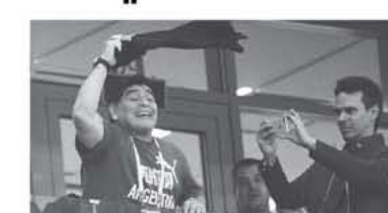
عواصم - وكالات

الأحيان مع فرص المنتخب الأرجنتيني وأهدافه مما يمنح دفعة معنوية عامة لكل عناصر التلغو. في المقابل، يعتبر شك آخر أن تواجد نجم نابولي الإسباني السابق في المدرجات يسلط ضغوطاً إضافية على كتيبة "البيسيليستي" التي تعاني