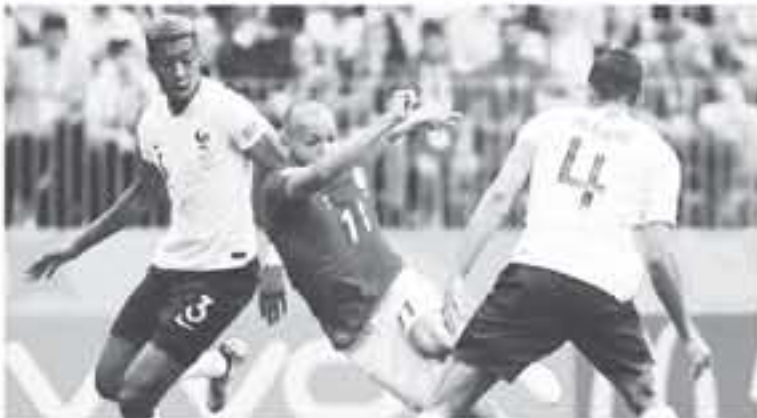
عواصم - وكالات

بطاقات صفراء لتعوق ما حصل عليه المنتخب الياباني في مباريات هذه المجموعة، والذي سؤا له عن عدم بل المنتخب الياباني أي جهد في نهاية مباراة أمام بولندا والتي خسرها 1-0، وذلك بعدما علم بتأخر السجل أمام كولومبيا، نود سميت "الاحترام واللعب النظيف جزء من اللعبة". ومن الانتقادات التي أشيرت بشأن المباراة بين المنتخبين الفرنسي والدنماركي، وتكررت بشأن مباراة اليابان مع بولندا بسبب اللعب السليبي، بعد الاعتصام لتأهل من خلال نتيجة معينة، قال سميت إنها "حالات متزعزعة". أكد سميت أن الاستنادات كانت معقدة بسبب حضور بلغ 98 بائنة، خلال 18 مباراة أقيمت في دور المجموعات، وأن إجمالي عدد الحضور الجماهيري خلال هذه المباريات بلغ نحو 2.2 مليون مشجع، وأن عدد الاحتفالات التي تم تنظيمها في المناسبات المتفرقة في المدن الـ 11 المضيفة للبطولة، شهدت زيارة نحو 6 ملايين متشجع حتى الآن، وأشار إلى أن 13 مليون متشجع على تواصل مع البطولة من خلال التطبيقات وأن وسائل التواصل الاجتماعي للبطولة شهدت متابعة من 120 مليون مشجع.