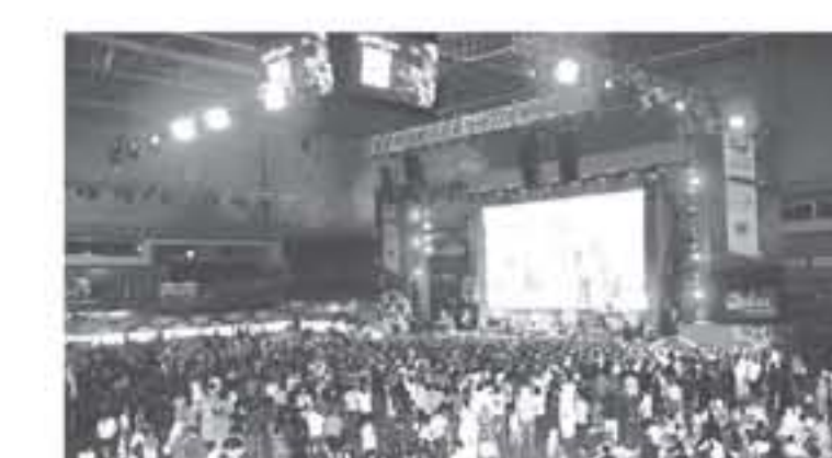
الدوحة - الانباط - خاص

بلجيكا في الصالة الرئيسية، وفي الثانية بنما وتونس في الصالة الثانية. ورغم الحضور الكبير من الجمهور الذي حضر المباريات والحفل الغنائي فإن التنظيم كان جيداً، ولذلك فقد استمتع كل الحضور بما تم تقديمه في كرة القدم، وفي الغناء، وخرج الجميع وهم راوضون تمام الرضا عن هذه الليلة، والتي ستعقبها ليال جميلة أخرى، فصالة علي بن حمد العليبة ستقبل مستقبل عشاق المونديال في كل المباريات المقبلة، حتى الختام يوم 15 يوليو المقبل، بالإضافة إلى الفعاليات اليومية