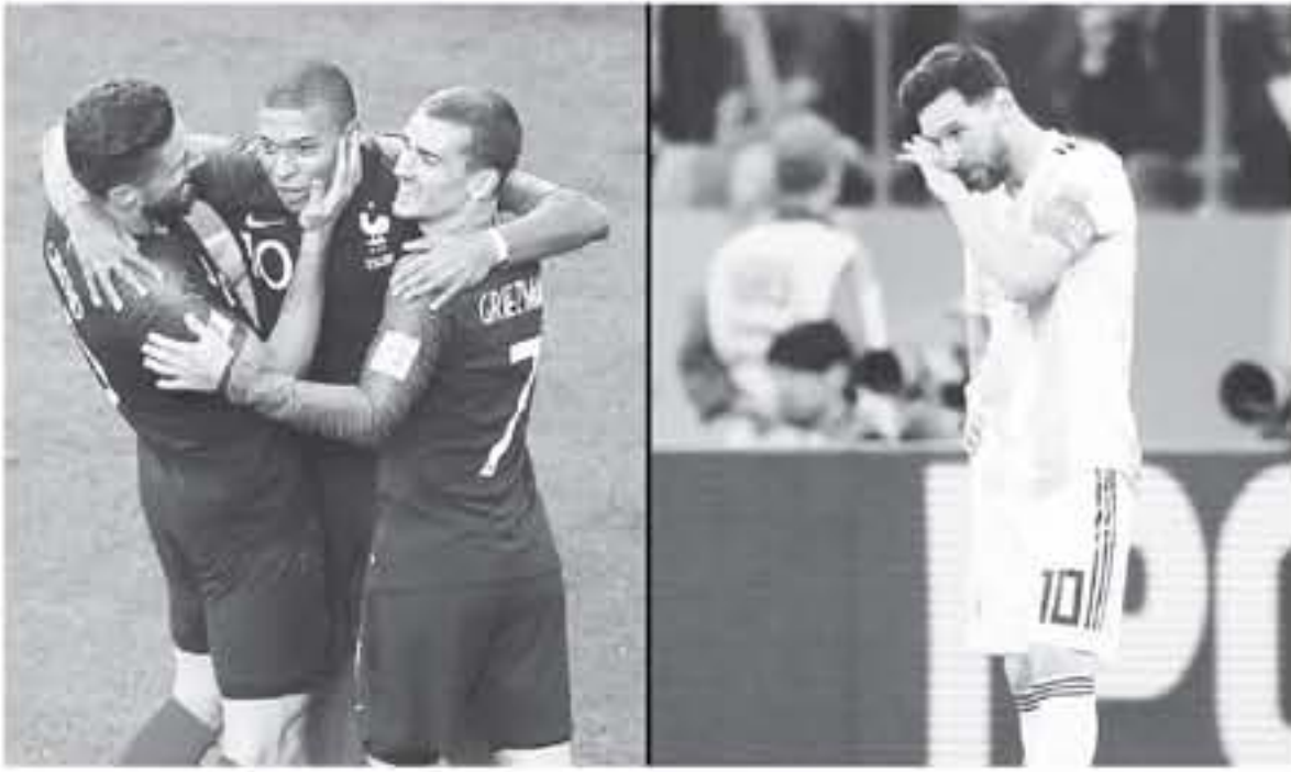
عواصم - وكالات

يشكل جيد عندما تبدأ منافسات الأوان الإقصائية اليوم. وقال "مقولة جديدة كليا تبدأ الآن مع الخروج المباشر. حصلنا على ما كنا نريد وللآن نواجه التحدي. لكننا جاهزون ونهدف إلى الوصول للدور المقبل بعدة طرق. ميسي الغالز بجائزة الكرة الذهبية لأفضل لاعب في العالم خمس مرات أكد أهميته بالتمسك بالأرجنتين عندما افتتح التسجيل أمام نيجيريا. لكن الهدف ليس الأ جزءاً من تعويض اهدار أيقونة برشلونة الأسباني، ركلة جزاء أمام إسبانيا، ما أضعف آمال منتخب الأرجنتين من مباراة الافتتاحية. هالاند ميسي شامته ولم يمرر له زملاؤه الكثير من الكرات أمام كرواتيا، قبل أن يأتي الفرح عبر الفوز على نيجيريا في المباراة الثالثة أمام ناظرى الأسطورة الأرجنتينية دييغو فورلان الذي قاد بلاده في المباراة الثالثة من بطولة كأس العالم بعد أول عام 1978، خلف مارادونا أضواء المباراة الثالثة طريفة احتفاله بالهدفين والوعكة الصحية التي تعرض لها. خضع مارادونا لفحص طبي وأكد أنه بخير. إلا أن ميسي ولاعبين منتخب يخشون أيضاً لفحص من نوع آخر، بهدف إثبات قدرتهم على تقديم الأداء المتق على أرض الملعب، لاسيما بعد التقارير العديدة حول شرخ بيبهم وبين المدرب خورخي سامباولي.