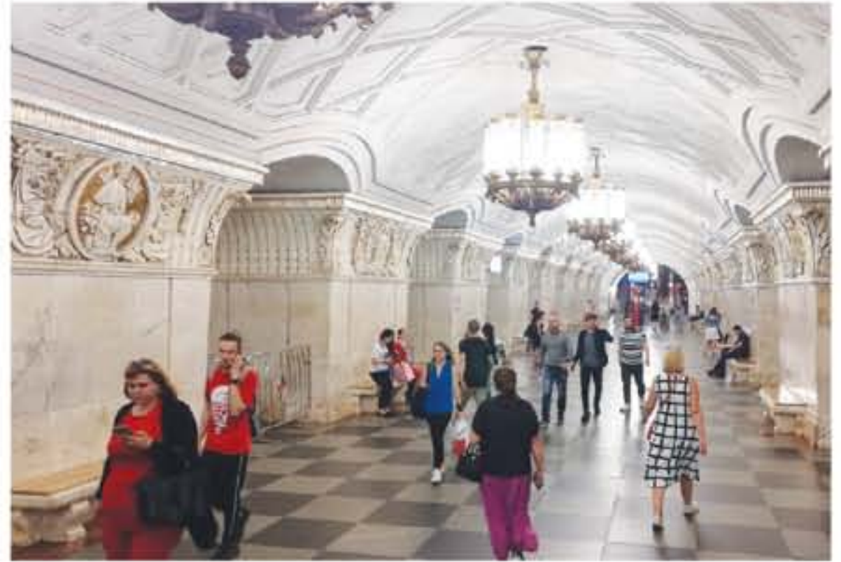
الأنباط - سان بطرسبورغ

ويعمل المترو منذ الساعة السادسة صباحاً وحتى منتصف الليل، وكل محطة تحوي خزانة تساعد المسافرين في تحديد وجهته التي يتسدها ويصل المعدل الزمني لتتابع المتروحات في مترو المدينة إلى ثلاث دقائق فقط، ما يجعله وسيلة المواصلات ليس فقط الأرخص وإنما الأسرع على الإطلاق.