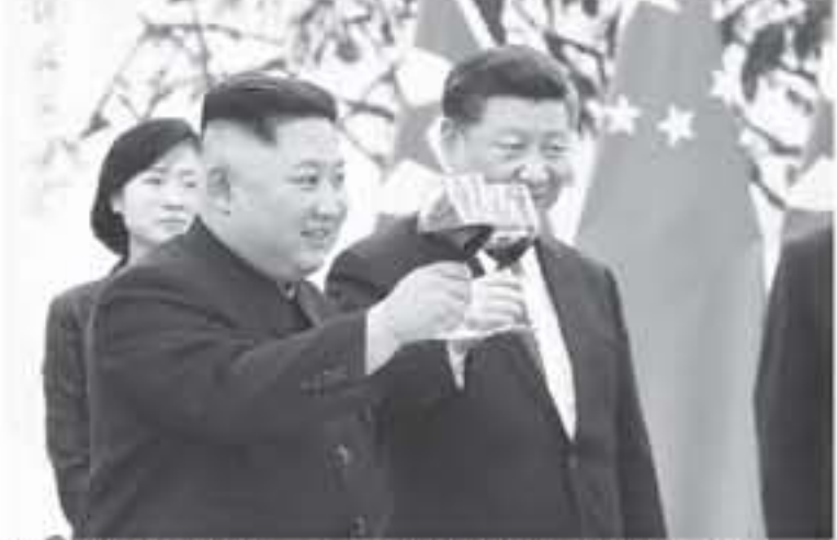
الزعيم الكوري الشمالي (يسار) والرئيس الصيني (يمين) في بكين، (أرشيفية)

لكن بيونغ يانغ تحشى من أن تتلارب واشنطن وبيونغ يانغ على حسابها، وهو احتمال ترى فيه تهديدا لاقتصادها ومصالحها الأمنية في المنطقة.