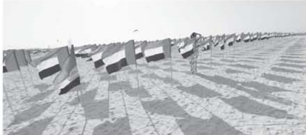
اعلام الامارات العربية المتحدة في دبي في ٢ تشرين الثاني/نوفمبر 2017

السبت في بيان نشرته وكالة سبأ الرسمية لتلافي ان "الانسحاب الكامل وغير الشرط" للحوثيين في الحديدة هو الأساس للبدء في العملية السياسية التي تلوهها الامم المتحدة. وتم يعلن مكتب غريفيث عن مبادرته القليلة. وكان مصدر مقرب من الحكومة اليمنية برئاسة هادي أعلن ان اليمعون الاممي سيتوجه مرة أخرى قريبا إلى عدن، الامر الذي نفته الحكومة اليمنية. وقال عبد الله العليسي، مدير مكتب هادي لوكالة فرانس برس "غريفيث لن يأتي إلى عدن" الاثنين.