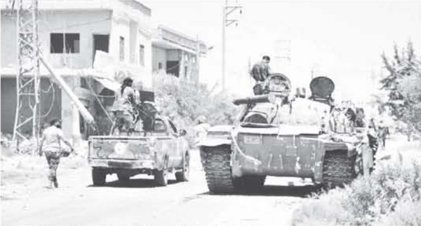
أليات عسكرية سورية تتمركز في بلدة الغابرية الغربية على مسافة حوالي 10 كلم شرق درعا بجنوب البلاد

عناصر من الشرطة العسكرية الروسية والامن الداخلي السوري في البلدات التي لا تزال تحت سيطرة الفصائل المقاتلة. وتمكنت القوات الحكومية من تقييد مساحة المناطق التي تسيطر عليها الفصائل المقاتلة في محافظة درعا الحدودية مع الاردن وهضبة الجولان التي تحتلها اسرائيل، منذ التصعيد الذي بدأ قبل نحو اسبوعين ورائت تسيطر على أكثر من نصفها بعد عدة "مصاصات" وتفتيد عمليات قصف دامية. وأكد مراسل وكالة فرانس برس موجود على تخوم محافظة درعا ان الهدوء يلحم الاحد بعد سماع دوي قصف خلال الليل. وأشار الى ان "التناسخات من هذا الهدوء" مضيقا "المعنى يقول انه هدوء ما قبل العاصفة". ويات النظام السوري يسيطر على نحو 65 بالمئة من محافظة درعا بعد ان سيطر السبت على ثماني بلدات في المحافظة بموجب مفاوضات توتلتها روسيا، بحسب المرصد. وأشارت وكالة الانباء الرسمية (سانا) الاحد الى "رفع العلم الوطني في ساحة داخل" بريف درعا، فيما بث التلفزيون السوري صور لسكان البلدة وهم يحتفلون "دعما للجيش".