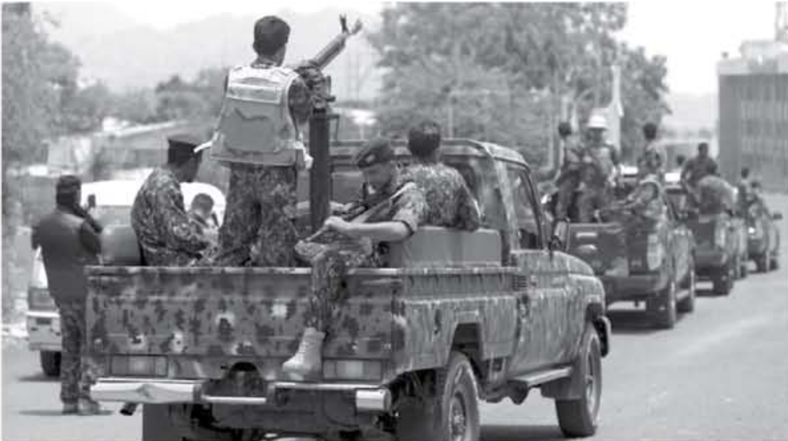
دورية للشرطة اليمنية في شوارع مدينة تعز بجنوب اليمن في 2 تموز/يوليو 2018