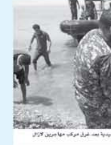
مناصر من الامم ليس يحمون منا رضيع في بلدة الحديدة بعد غرق مركب مهاجرين لازل مئة منهم مفقودون، في 26 حزيران/يونيو 2018

لكنه يبقى غامضا ولا يتضمن ما يكفي من التبعات الفعلية للتوصل الى حل لهذه المسألة. — عمليات لرحيل — كان العميد ايوب قاسم حذر الأسبوع الماضي بشأن تهريب المهاجرين كنفوا الرحلات، تحسبا لافاق الحدود الأوروبية بعدما منعت روما سفن منظمات غير حكومية من دخول مرافقها. ولكن حذر السواحل الليبيين منذ الجمعة انذار أو اعتراض نحو اثن مهاجر تقوم السلطات بعد وصولهم بنقلهم الى مراكز احتجاز حيث يتكسب الآلاف في اوضاع صعبة بانتظار ترحيلهم. ولقد المنظمة الدولية للهجرة برنامج عودة طوعية، وقال المسؤول عن ذلك جمعة بين حسن إن عدد المهاجرين غير النظاميين الذين عادوا إلى بلدانهم الأصلية خلال النصف الأول من العام الجاري، ضمن برنامج العودة الطوعية، بلغ 1828 مهاجرا (...) من 20 دولة من قارتي أفريقيا وآسيا. ورحلت المنظمة الدولية للهجرة نحو 20 ألف مهاجر غير شرعي العام 2017 في إطار هذا البرنامج ونأمل ان يرتفع هذا العدد الى 30 ألفا في 2018. وابان عهد الزعيم السابق معمر القذافي قام آلاف المهاجرين بمجرور حدود ليبيا الجنوبية البالغ طولها خمسة آلاف ميلا للتوصل إلى أوروبا عبر المتوسط. وبعد الاطاحة بالقذافي في 2011 ومقتله اهتمت مهربو المهاجرين حالة الفوضى لتزريب عشرات آلاف المهاجرين سنويا إلى إيطاليا.