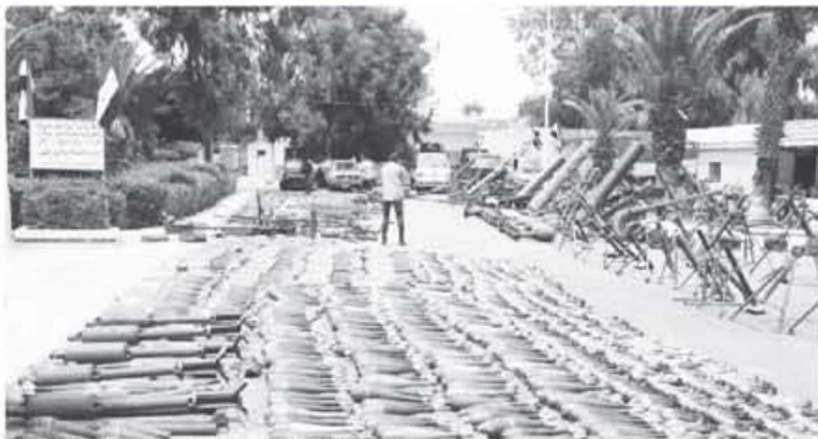
أسلحة مسلحة لجنود الجيش السوري في مناطق الجنوب (الترت)