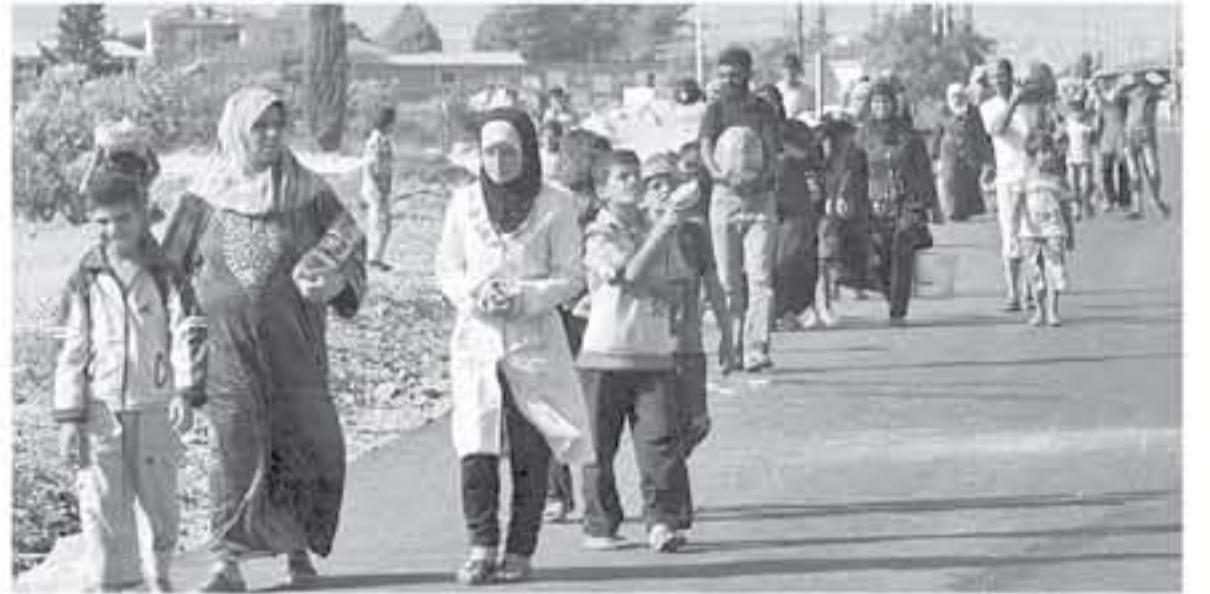
وكالات ومواسم - الأناضول - ما بين العفرى

أعلنت الأمم المتحدة الاثنين أن عدد النازحين في جنوب سوريا نتيجة العمليات العسكرية الأخيرة للجيش السوري تجاوز ٢٧٠ ألفاً. وإمام هذه الأرقام ما زال العام على الجانب الاثني والديبلوماسي يمارس واقع المتشرد على وقع عمليات النظام السوري والقوات الروسية والايرانية وحزب الله العسكرية ضد العصابات الارهابية والمسلحين الذين يتزحون الى الخلاء بعد فرار اردني يمنع دخول لاجئين جدد الى اراضيه. مبرر بالوضع الاقتصادية الصعبة وانهيارات أمنية محتملة من عناصر