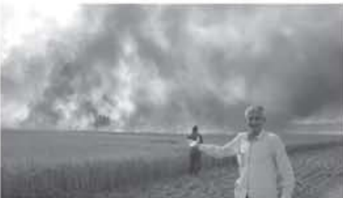
الحرائق في مستوطنات غلاف غزة