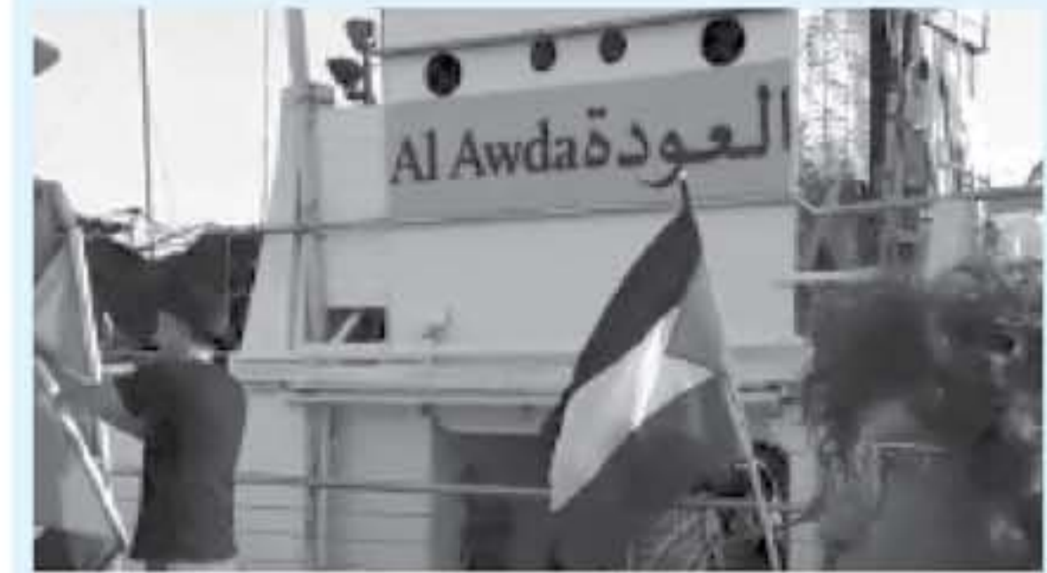
سفينة العودة في ميناء كاليبري