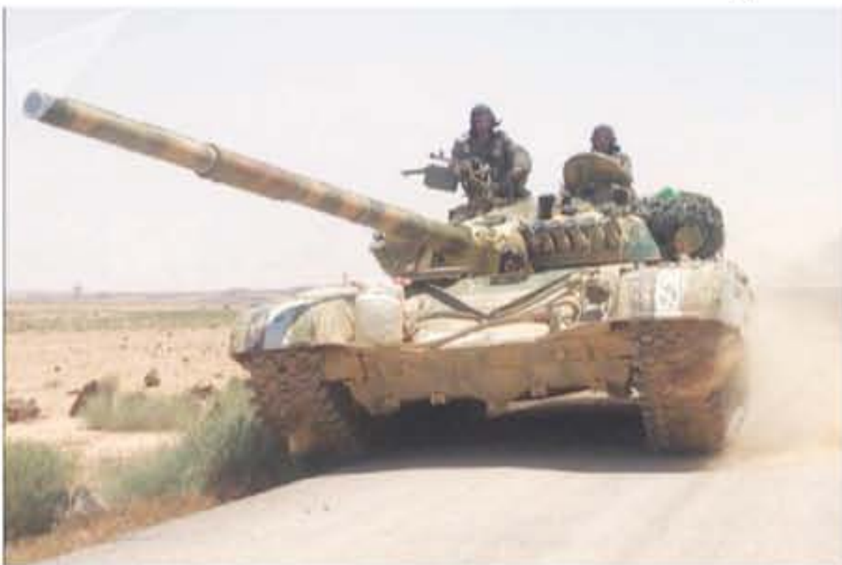
غداية سورية قرب فرعا التحصنة تصهيبا لتحرير المدينة بشكل كامل من مجموع الإرهابيين..

الأنباط - عمان بتوجيهات من الملك عبدالله الثاني ابن الحسين وبإيعاز من رئيس هيئة الأركان المشتركة قامت سيارة إسعاف تابعة