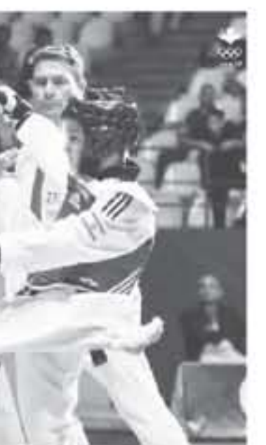
تدريب اليمانيات في فتي الذكور والإناث برصيد 5 ذهبيات وفضية واحدة وبرونزية واحدة وحل مركز نجوم العالم الأردني في المركز الثاني ب 2 ذهبيات وبرونزيتين وجاءت

المنتخب مساء امس في صالة الامير حمزة بمدينة الحسين للشباب بطولة الحسن المفتوحة للتايكواندو المنصة من عيار النجمة الواحد G1 والتي ينظمها اتحاد اللعبة في صالة الامير حمزة بمدينة الحسين للشباب بمشاركة أكثر من 1200 لاعباً ولاعبة يمثلون 33 دولة وتستمر حتى مساء غد حيث اقيم الحفل الرسمي الى جانب منافسات فتي الرجال والسيدات وكانت منافسات اليوم الاول قد انطلقت امس الاول ولقائهما سمو الاميرة زينة الراسد، مديرة دائرة الإعداد الأولمبي، ورئيس الاتحاد الامموي للتايكواندو البروفيسور لي كيو سوك، وامين سر الاتحاد الامموي كيم مونج هيون، ومندوب الاتحاد الدولي كيم سانج شيون والذي يتولى الانترفاك على منافسات البطولة إلى جانب حضور جماهيري كبير. حيث أقيمت منافسات فئة الأطفال من 6 إلى 8 سنوات ومن 9 إلى 11 سنة ولأحزمة الكونغو حيث تصدر المنتخب الفلسطيني جدول