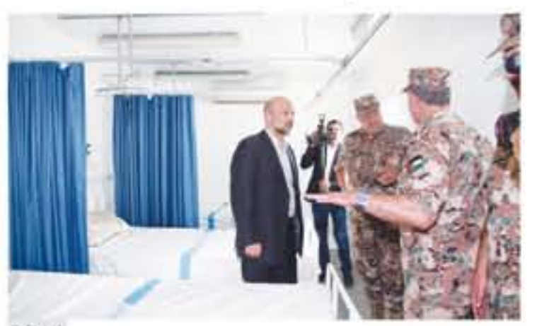
المفرق - بتر

قال قائد طب الميدان العميد سالم الزواهره انه تم إدخال 11 لاجئا سوريا إلى مستشفيات وزارة الصحة لتلقي العلاج والعناية الصحية المتقدمة ليرتفع عدد الحالات التي تم إدخالها منذ بداية الأحداث في الجنوب السوري إلى 114 حالة، وأضاف لوكالة الأنباء الأردنية أن الفريق الطبي الميداني على الحدود الشمالية كشف طبيا وهم العناية الصحية لـ 233 حالة أمس. تم إعدادهم إلى داخل الأراضي السورية باستثناء 11 حالة تم إدخالها لمستشفيات وزارة الصحة لافتا إلى أنه تم تقديم الرعاية الصحية لـ 160 نازحا سوريا منذ اندلاع الأحداث في الجنوب السوري. وبين الزواهره انه يتم معالجة الحالات المرضية والأصابات الخفيفة على الحدود الأردنية السورية ومن تم إرجاعها إلى