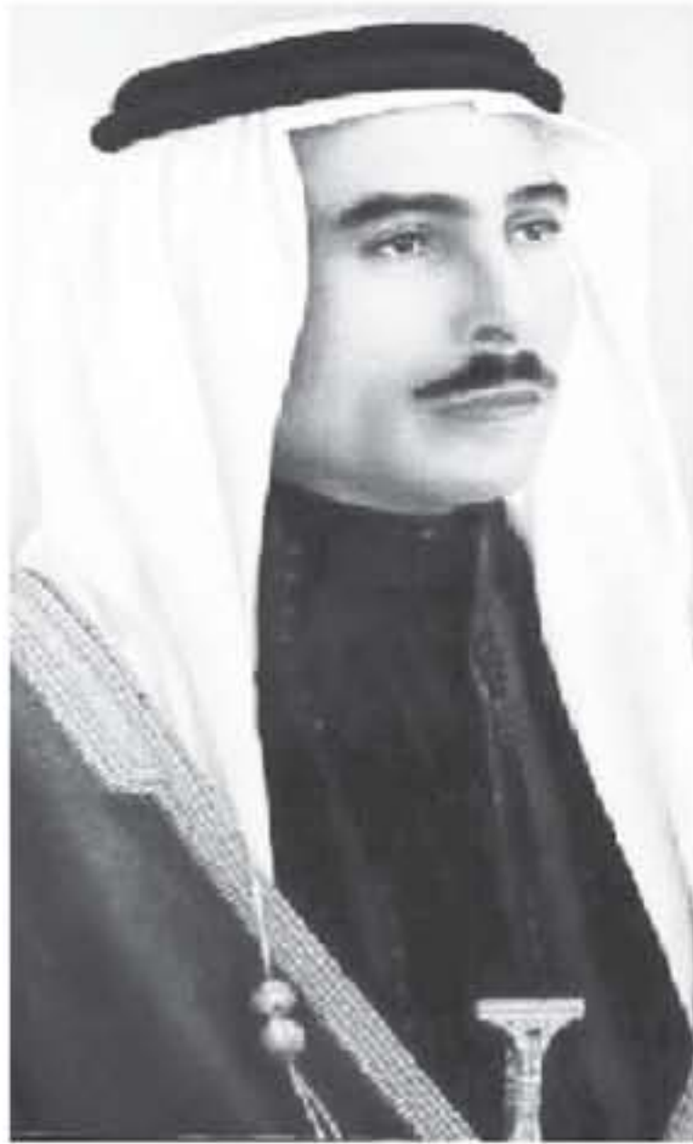
نبيلاً يحمل قلباً كبيراً يخلزن الكثير من العواطف ويتحسس أمال شعبه وتطلعاته

حقوق المواطن وشرائه الأساسية وبنوداً أخرى لحماية العمال وشروط عملهم وفق مسانير العالم المتطورة. ولقد جاء هذا الدستور الذي يعد أول دستور وحيد عربي حيث نص على إعلان ارتباط الأردن عضواً بالأمة العربية وتجنيد الفكر القومي للثورة العربية الكبرى.. ملهاً آمالاً وتطلعات الشعب الأردني كونه جاء متصفاً مع التطورات الهامة التي كان يشهدها الأردن خاصة بعد وحدة الضفتين عام ١٩٥٠ وتنامي الشعور الوطني والوعي القومي في كل أرجاء الوطن العربي. وجلالته المغفور له الذي وقف مجاهداً في صفوف المقاتلين من الجيش العربي دفاعاً عن فلسطين بذل جهوداً متميزة لتوثيق عرى التعاون والتنسيق لما فيه مصلحة الأمة والوطن العربي الكبير الذي كان خرج توره من نكبة فلسطين عام ١٩٤٨. وفي عهد جلالتة اتخذ الأردن قراراً يقضي بجعل التعليم إلزامياً ومجانياً حيث يعتبر هذا القرار الأول من نوعه في الأردن والوطن العربي وكان له الأثر الكبير في النهضة التعليمية التي شهدتها البلاد فيما بعد، كما صدر في عهد جلالتة قانون خط السكة الحديدية وذلك في شهر آذار عام ١٩٥٢ الذي ينص على اعتبار هذا الخط وفقاً لاسلامياً. وقد نشأ جلالته المغفور له الملك طلال في كنف والده المغفور له الملك عبد الله بن الحسين وكنف جده شريف مكة الحسين بن علي حيدر الثورة العربية الكبرى التي أعلنت الثورة على الظلم والظلمين والجهاد في سبيل العروبة واستقلال الأوطان. وكان جلالته يتصف باللطيف والتهذيب ومماثلة الخلق لا يهاجم في الرأى ولا يأخذ في الحق لومة لائم كما كان له في سمو الخلاق والده وعلو عنقه وعظيم مبادئه أكبر نصيب في الحياة حيث نشأ شاباً