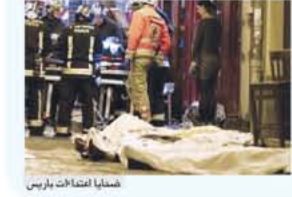
ضحايا اغتالات باريس

بروكسل - وكالات كشفت تقارير إخبارية بلجيكية، أمس أن أسامة كريم، المعتقل في بلجيكا، على خلفية اغتالات باريس، خلال تشرين ثاني (نوفمبر) 2015 و بروكسل في آذار (مارس) 2016 شارك في اغتيال الطيار الأردني الشهيد معاذ الكساسبة في شباط (فبراير) 2015. وهل صحفية، لا ديرفيلير هيبير، التحية لفلأ عن مصادر من وحدة مكافحة الإرهاب في الشرطة البلجيكية، أن كريم متورط. وكان المعتقل قد قاتل في صفوف تنظيم داعش.