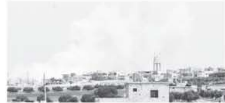
دمشق - وكالات

وأعلن التحالف الذي تقوده الولايات المتحدة ضد داعش أن قواته أو "قوات شريكة له" ربما قتلت ضحايا، في منطقة سورية أشار المرصد السوري لحقوق الإنسان إلى أن الضحايا كانوا فيها.