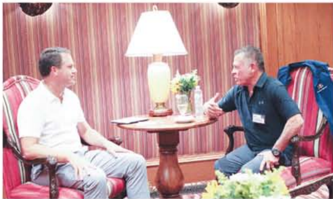
أبناجو - بتر شاركت جلالة الملك عبدالله الثاني، ترافقه جلالة الملكة رانيا العبدالله، في ملتقى الاقتصادي الذي تستضيفه مدينة

الأردن - بوابة للانطلاق نحو الأسواق الإقليمية والعالمية - بحث البرامج الهادفة لتحفيز النمو الاقتصادي - رؤساء شركات يؤكدون على ما تتمتع به الأردن من كفاءات شابة - التأكيد على إعادة احياء عملية السلام بين الفلسطينيين والإسرائيليين - ضرورة التوصل إلى حل سياسي يحفز تماسك السوريين