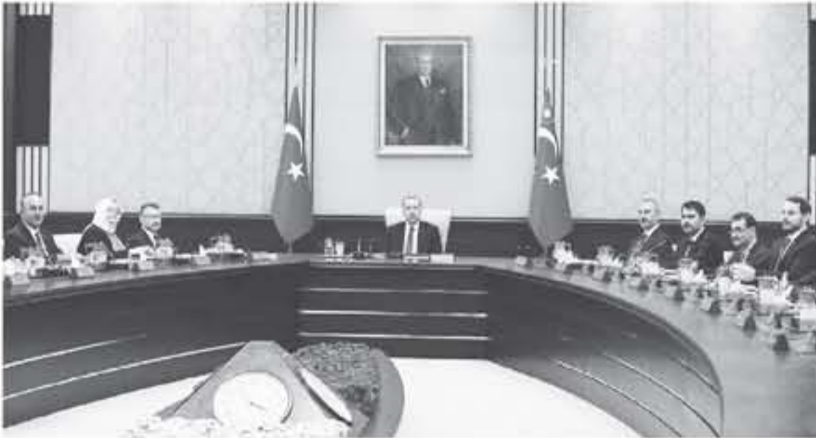
أنقرة - وكالات

ترأس الرئيس التركي رجب طيب أردوغان أمس الجمعة، أول اجتماع للحكومة الجديدة التي تعهد الأولى في تركيا بعد الانتخابات التي أجريت في يونيو / حزيران الماضي.