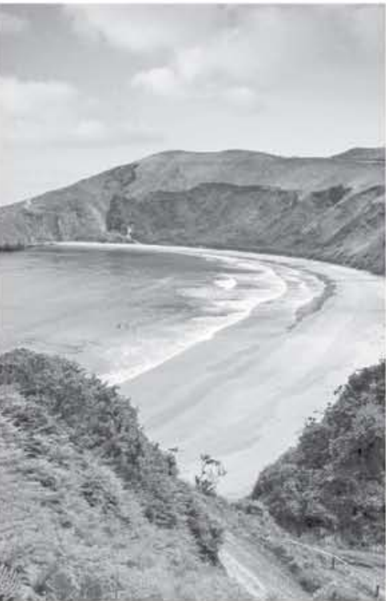
شاطئ إسبانيا، إذا كنت تحب تخطيط لقضاء اجازة هادئة والانخراط في المرح، سيكون أفضل مكان بالتأكيد لك هو شاطئ مدينة جميلة تسمى سانو، وتقع بالقرب من تاراغونا. وتقع بلدة في منطقة كوستا نوردا ويتوافق السياح على مدار السنة الذين يأتيون هنا لقضاء وقتهم الاسترخاء. إذا كان لديك ما يكفي من الوقت لا تفوتها ويمكنك أيضاً زيارة تاراغونا، المدينة المعروفة جيداً بمبانيها الجميلة.