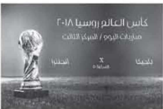
كأس العالم روسيا 2018 مباريات اليوم / السبت الثالث