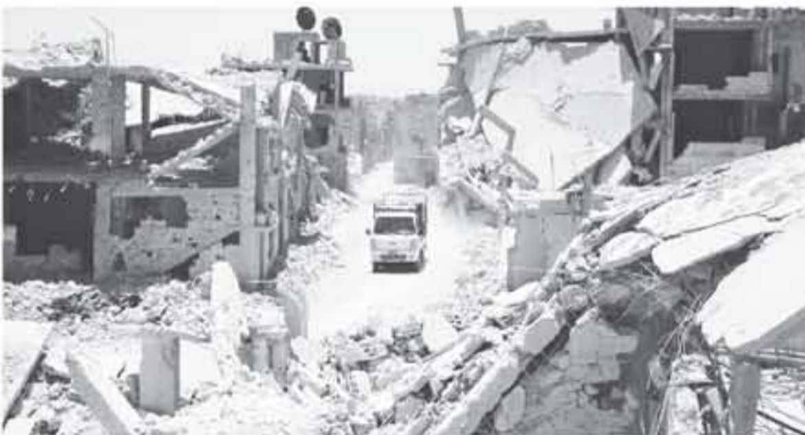
دمشق - وكالات

تتهم فصائل المعارضة الجانب الروسي بعدم الضغط على النظام السوري لتنفيذ البنود التي يتوجب عليه تطبيقها فيما يخص انسحابه إلى الأماكن التي كان يها قبل بدء العملية العسكرية على درعا، إضافة لضمان أمن وسلامة سكان البلدات والمدن التي دخلت في التفاهات مع الجانب الروسي.