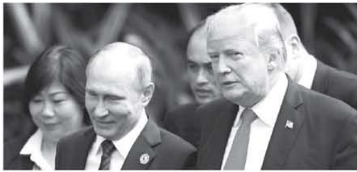
وأوضح الرئيس الأمريكي أنه تناول أيضا في محادثاته قضية التدخل الروسي المزعوم في الانتخابات الأمريكية. والإرهاب العالمي والحد من الأسلحة النووية.

قال الرئيس الأمريكي دونالد ترامب، أمس الإثنين، إنه أجرى محادثات مستمرة مع نظيره الروسي فلاديمير بوتين، أسفرت عن تجاوز مرحلة حرجة في العلاقات بين البلدين. وقال ترامب "اتخذنا الخطوات الأولى صوب مستقبل أكثر إشراقا، يقوم على التعاون والسلام. رفض الحوار لن يحقق أي شيء". وأضاف في مؤتمر صحفي مشترك في العاصمة الفنلندية هلسنكي، "إذا أردنا أن نحل الكثير من المشكلات التي تواجه عالمنا، فسوف يتعين علينا إيجاد سبل للتعاون". وأشار ترامب إلى أنه بحث مجموعة كبيرة من القضايا الحساسة للبلدين، ومنها الحرب في سوريا وقضية إيران