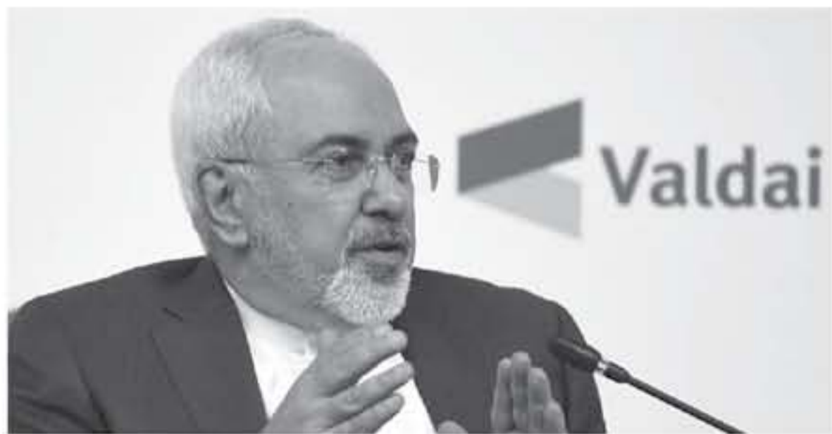
وزير الخارجية الإيراني محمد جواد ظريف

أعلن وزير الخارجية الإيراني محمد جواد ظريف أن بلاده قدمت، أمس الاثنين ١٦ يوليو/تموز، شكوى محكمة العدل الدولية ضد إعادة فرض العقوبات الأمريكية، مشددا على التزام طهران بدور القانون الدولي. وكتب ظريف، في تغريدة على حسابه عبر "تويتر"، "أمس قدمت إيران شكوى محكمة العدل الدولية، لتحيل الولايات المتحدة الأمريكية المسؤولة عن إعادة الفرض الأحادي وغير القانوني للعقوبات... وأضاف، "إيران ملتزمة بدور القانون الدولي في مواجهة الزعماء السياسيين المتشبهين بالأميركية للدبلوماسية والالتزامات الدولية"، مشابها "من الضروري مواجهة عادتها في خرق القانون الدولي". الجديس بالذكر أن الرئيس الأمريكي دونالد ترامب أعلن، يوم ٨