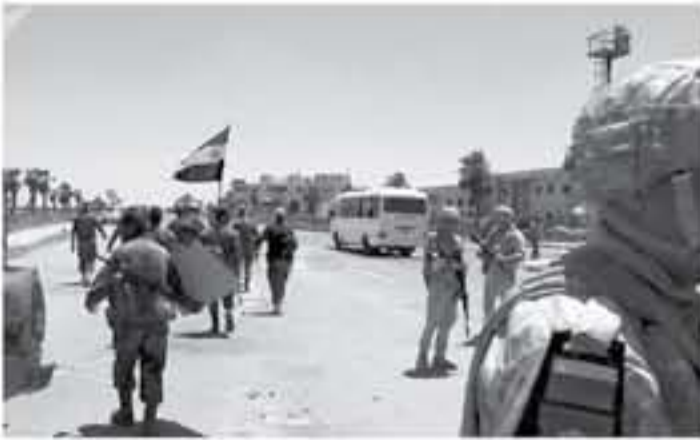
الجيش العربي السوري