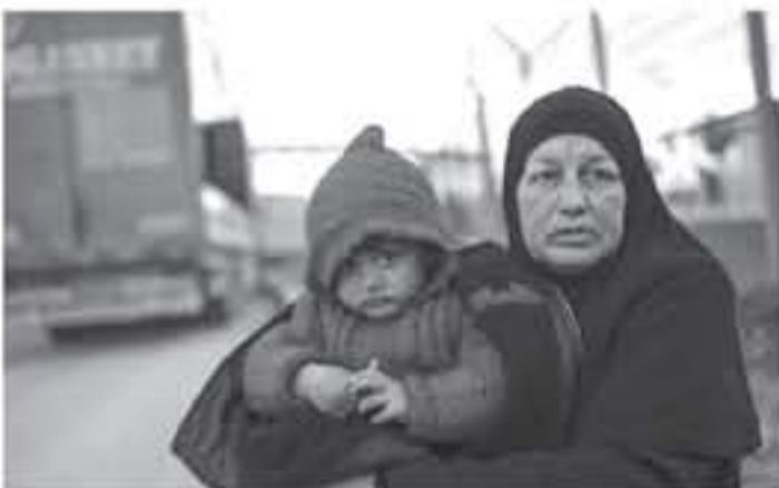
لاجئة سورية في التفتاح بملتان على الحدود التركية