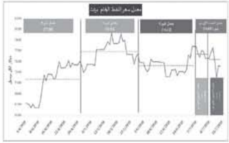
النفط الاسبوعي أسعار النفط الخام ومنتجاته حسب السوق المرجعية

أعلنت وزارة الطاقة والثروة المعدنية امس الاثنين، عن مؤشر الأسعار لتتبع خام برنت والمشتقات النفطية وفق الأسواق المرجعية العالمية للمتمدة من قبل الوزارة لتعبر المشتقات النفطية. ووفق الإقر، شهدت أسعار خام برنت خلال الأسبوع الثاني من شهر تموز انخفاضاً بنسبة ٢ بالمئة مقارنة بالأسبوع الأول من نفس الشهر حيث انخفض من ٧٦ر٦ دولار للبرميل الى ٧٥ر٥ دولار. وكان سعر خام برنت القياسي قد وصل إلى حدود ٧٨ دولاراً للبرميل يوم الثلاثاء الماضي ليتراجع الى ٧٢ر٢ دولار الخميس، مسجلاً بذلك أدنى سعر لهذا الأسبوع ليعود ويغلق تداولات الأسبوع مرتفعاً بحوالي دولارين ليصل الى ٧١ر٣ دولار للبرميل يوم الجمعة الماضي. وبحسب الأسواق المرجعية العالمية للمتمدة من قبل وزارة الطاقة والثروة