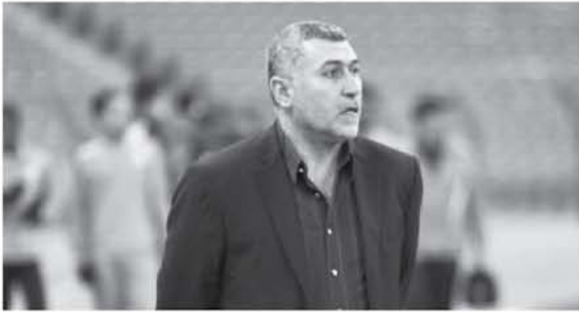
الحمر مطلع الموسم السابق، قبل أن يتقدم بإسقاطه. ويج حال التوقيع الرسمي على العقد سيفقد محروس الجزيرة في لقاء السوبر