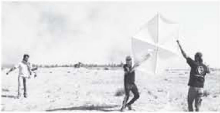
غزة - وفا

وفي ذات السياق، أطلقت قوات الاحتلال الإسرائيلي النار تجاه نضعة رصد للمقاومة شرقي مخيم الغازي وسط القطاع غزة دون أن يبلغ عن إصابات. من جانبه، أعلن المتحدث باسم جيش الاحتلال أن طائرة تابعة لسلاح الجو الإسرائيلي نفذت هجوماً على "خلية" أطلقت بالونات حارقة من قطاع غزة باتجاه المستوطنات.