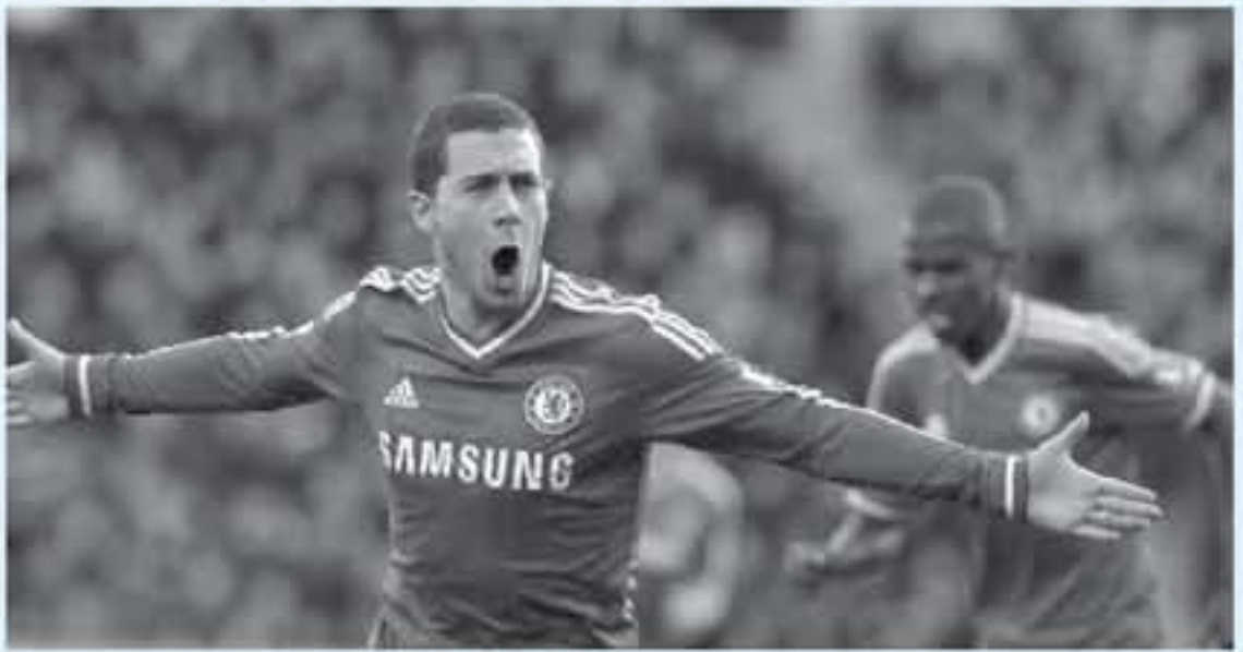
لندن - وكالات

عقد مقابل ٢٠٠ ألف جنيه إسترليني أميوغيا، وتؤكد التقارير الصحفية البريطانية أن تشيلسي ينتظر عودة هازارد من العطلة الصيفي، لتحديد معه عن عقد جديد، لعدم لية النادي اللندني في بيعه، حتى إذا عرض ريال مدريد ١٧٠ مليون جنيه إسترليني، بالرغم من رغبة البلجيكي القوية في الرجيل نحو "سانتياجو برنابيو". تشيلسي ليس مستهدفاً من ريال مدريد فحسب، بل إن بطل الدوري والكأس في إسبانيا، برشلونة، يضع عينه على البرازيلي وويليان، جناح الجوز، ويضعف برشلونة بقوة على تشيلسي لتضم وويليان، لكن البلوز يصر على استمرار البرازيلي ضمن تشكيلة