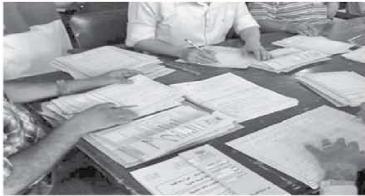
الأنباط - عمان - فرح شلباية

تمكنت لجان تصحيح امتحان شهادة المراسمة الثانوية العامة من إنهاء تصحيح عدد من مباحث "التوجيهي" في مختلف الفروع الأكاديمية والمهنية للندوة الصحفية 2018.