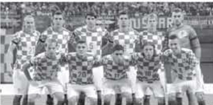
لندن - وكالات

التعاقد مع المدافع البالغ من العمر ٢٩ عاماً، ويسر فيدا مع لوفربين في دفاع منتخب كرواتيا خلال مونديال ٢٠١٨، يساهم بشكل كبير في احتلال منتخب بلادهم المركز الثاني في كأس العالم، وأضافت الشبكة "يشكلان سيق ورفض ٢٠ مليون جنيه إسترليني من وست هام، كما استقلت إدارة النادي التركي، بالعرض المقدم من إيفرتون لتضم اللاعب الكرواتي". وأتمت "يشكلان بيريد ٢٦ مليون جنيه إسترليني من أجل التنازل عن خدمات دوماجوي فيدا".