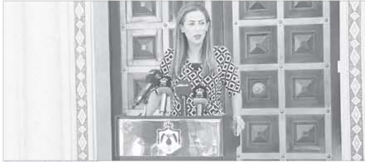
غنيهات خلال اللقاء الصحفي