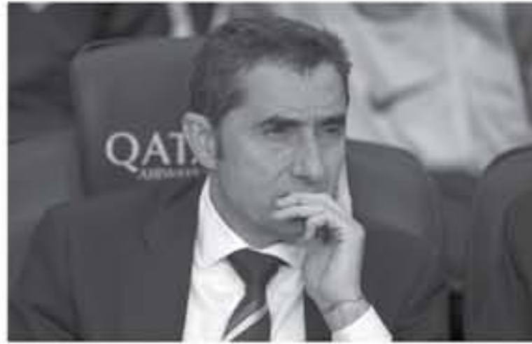
مدريد - وكالات

٢٢ لاعباً أمام فالفيدي". وأوصحت الصحيفة أن المدرب سيردس الطريقة التي سيلعب بها خلال مباريات جولة الولايات المتحدة مع انتظار انضمام الثاني أمريان رابيو وويليان، وبخصوص المفاوضات مع إدارة تشيلسي من أجل