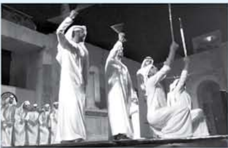
الأنباط - جرش

سيرة من التعاون بين مهرجاني «جرش» و«الصوره الدولي للفنون»، أقرب من أمته بأن يكون هناك خطوات مستقبلية لإحياء نوع من التعاون بين المهرجانين في البلدين الشقيقين.