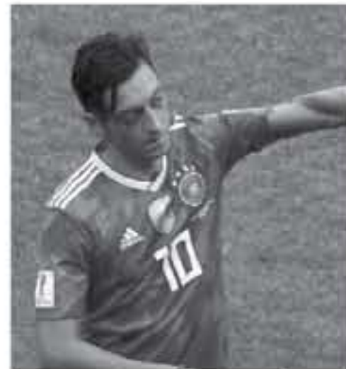
برلين - وكالات

الانتقالات التي وجهها اللاعب إلى رئيس الاتحاد، رينهارد جريندل، وأعلن لاعب التومف، أمس الأحد، اعتزاله اللعب الدولي مع منتخب ألمانيا، وذلك بعد شهر ونصف من حالة الجدل التي أشيرت بسبب صورته مع الرئيس التركي رجب طيب أردوغان، وبعد انتقاده لوسائل الإعلام والاتحاد الألماني على رد هتلمها إزاء هذا الأمر. ويتم