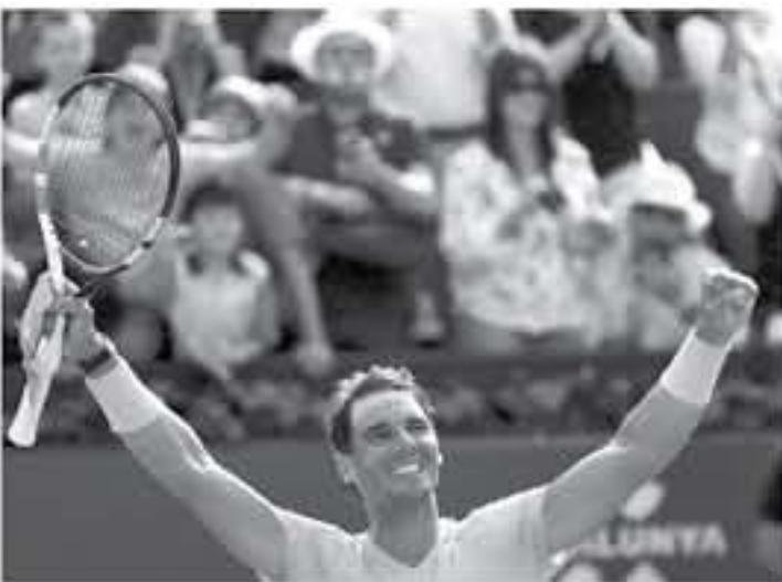
عواصم - وكالات

حساب الأمريكي جون إيبسترو، وجاء لترتيب اللاعبين أصحاب المراكز العشرة الأولى بالتصنيف العالمي للاعبين التنس على النحو التالي: - نادال برصيد ٩٣١٠ نقاط، روجر فيدرر برصيد ٧٠٨٠ نقطة، ألكسندر زفيريف برصيد ٦٦٦٥ نقطة، خوان مارتن ديل بوترو برصيد ٥٦٩٥ نقطة، كيبين أندرسون برصيد ٤٦٥٥ نقطة، جريجور ديميتروف برصيد ٤٦١٠ نقطة، مارين شيليتش برصيد ٣٩٠٥ نقطة، دومينيك تيم برصيد ٣٦٦٥ نقطة، جون إيبسترو برصيد ٣٤٩٠ نقطة، نوفاك ديوكوفيتش برصيد ٣٣٥٥ نقطة.