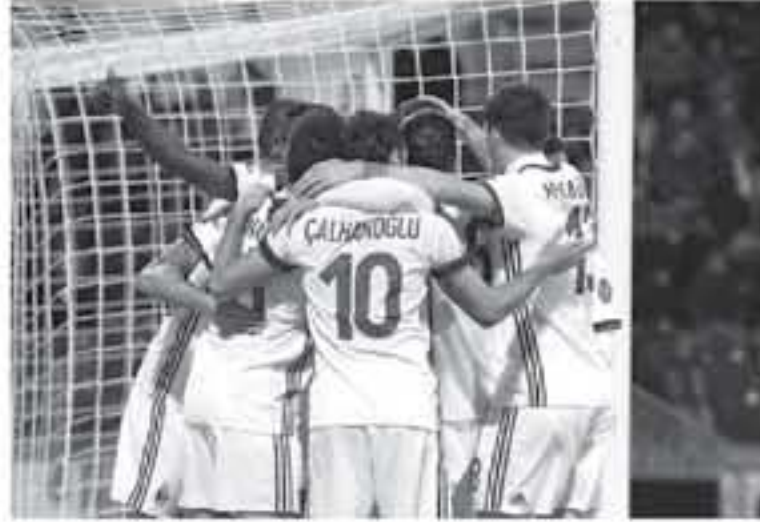
ميلان - وكالات

لاقترب روما من ضم الحارس السويدي أولسكين، خلفاً لأليسون، وخرجت صحيفة "كورييري ديللو سبورت" دراسة أجريت بمونديال روسيا، يا لها من ثيافة كبيرة. رونالدو ٣٣ عاماً أفضل من العشرينين. وتوتت الصحيفة