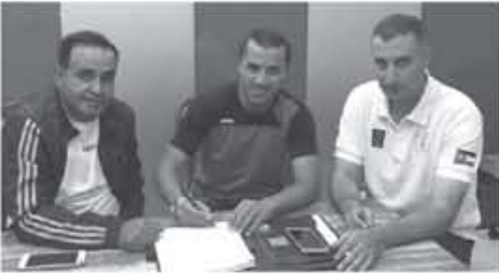
الأنباط - الكرك