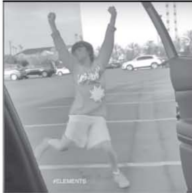
الأنباط - عمان - رصد جمانة خنفر

مصوراً لشباب يرقص على أنغام المقطع الذي يقول فيه دريدك "كيكي، هل تحبيني؟"، وتندور فكرة "تحدي كيك"، حول النزول من السيارة أثناء سيرها، ثم الرقص على أنغام أغنية In My Feelings.