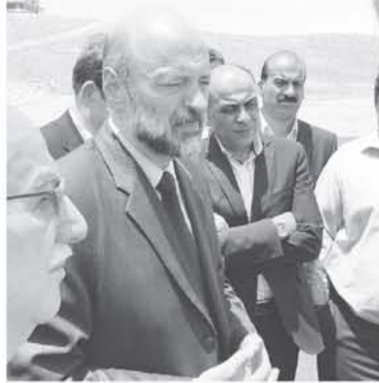
الأنباط - معان

تفقد رئيس الوزراء الدكتور عمر الرزاز أمس مشروع إعادة تأهيل الطريق الصحراوي واطلع على سير العمل والإنجاز، وتفقد التحويلات المخصصة للطريق. واكد رئيس الوزراء خلال الجولة الميدانية على الطريق الصحراوي التي رافقه فيها وزير الأشغال العامة والإسكان المهندس يحيى الكسبي، أهمية متابعة كافة الإجراءات الكفيلة برفع مستوى السلامة المرورية على التحويلات في مواقع العمل كما أكد ضرورة التنسيق بين كافة الأجهزة المعنية بما يكفل المحافظة على حياة المواطنين الذين هم على ما نملك. وتبادل رئيس الوزراء الحديث مع مجموعة من العاملين والشاغلين، مبينا أهمية الجاز هذا المشروع الحيوي والاستراتيجي في الوقت المحدد، وضمن أفضل المواصفات الحديثة أساماً لا يتجاوز ولاسيما أن الطريق شهد خلال الفترات الماضية حوادث عديدة أدت إلى خسائر بشرية. ومن المتوقع الانتهاء من تنفيذ أعمال الطريق الصحراوي خلال النصف الأول من عام ٢٠٢٠. واستمع الرزاز إلى إيجاز من وزير الأشغال العامة والإسكان حول مراحل إعادة تأهيل الطريق الصحراوي المول بمتمحة كريمة من المملكة العربية السعودية / الصندوق السعودي. حيث تم تقسيم المشروع إلى ثلاثة أجزاء يقوم بتنفيذها مجموعة من المقاولين الأردنيين