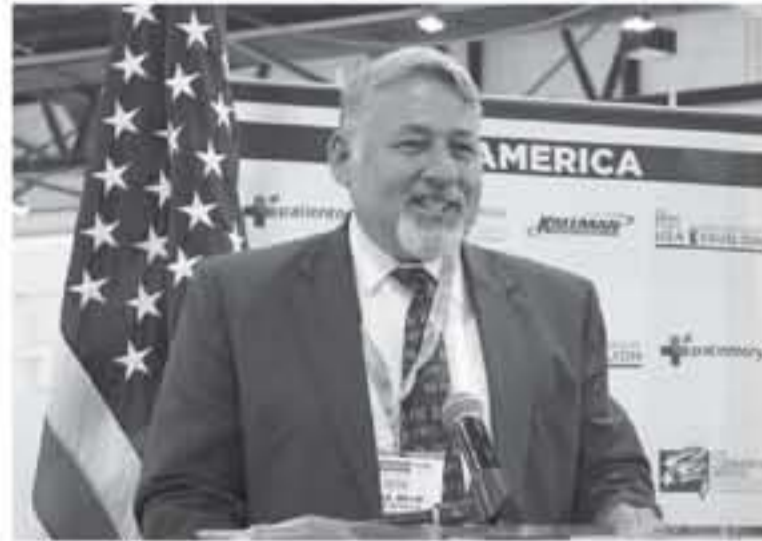
نائب السفير في مناسبة خلال عمله في الامارات اريشبية