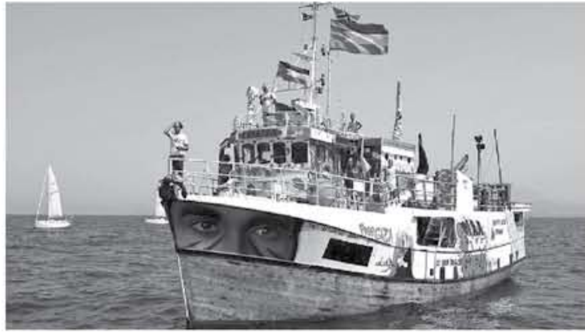
للعالم، ويهدف أسطول الحرية إلى زيادة الوعي وخلق رأي عام تجاه قضية غزة. وتعرض إسرائيل حصارا على قطاع غزة منذ صيف عام 2007، عقب فوز حركة حماس في الانتخابات البرلمانية، ثم شدته عام 2017.

يواصل «أسطول الحرية» الذي انطلق من النرويج والسويد شق طريقه نحو قطاع غزة لفت الانتباه إلى الحصار الذي يتعرض له الأخير. وقال بيان صادر عن هيئة الإنعاش الإنسانية التركية (IHH) إن أسطول الحرية الذي رعى في 18 ميناء مختلفا، انطلق من محطته الأخيرة إيطاليا نحو غزة عبر البحر المتوسط لفت الرأي العام إلى الحصار المفروض على غزة. ويضم الأسطول الذي تعد هيئة الإنعاش الإنسانية التركية إحدى الجهات المنظمة له، 3 قوارب، «المودة» و«السلام» و«الحرية»، وتحوي مواد طبية. تجدر الإشارة إلى أن الأسطول الذي انطلق في 15 مايو/ أيار الماضي من النرويج والسويد لتمر الحصار الذي تفرضه إسرائيل على غزة منذ 2007، قاموا في الموانئ التي مروا عليها خلال رحلتهم بشرح ما يتعرض له القطاع