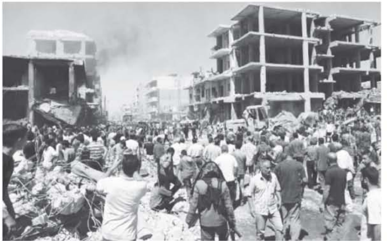
دمشق - أ ف ب

أشهر بعدما فقد غالبية مناطق سيطرتها فيها. وأوضح عبد الرحمن أن المنطقة المستهدفة مأهولة بالسكان وقرية من مدينة السويداء، مشيراً إلى أن التنظيم المتطرف تمكن من السيطرة على ثلاث قرى من أصل سبعة شن هجومه ضدهم. وأكدت وكالة الأنباء السورية الرسمية (سانا) سقوط قتلى وجرحى في مدينة السويداء، كما أفاد التلفزيون السوري الرسمي عن قتلى وجرحى في الهجمات على القرى في شمال شرق السويداء. ونقل التلفزيون الرسمي السوري أن وحدات من الجيش العربي السوري تستهدف نقاط تنظيم داعش الإرهابي في