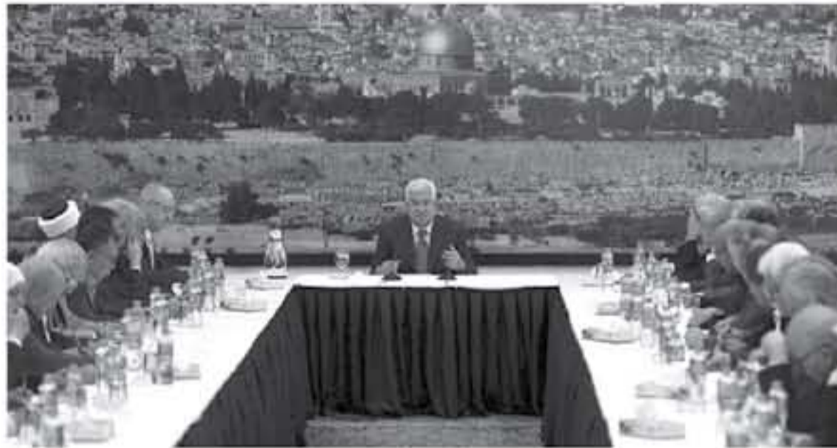
رام الله - معا

قال الرئيس محمود عباس، إن الأشقاء المصريين أرسلوا لنا موضوعاً أو فكرة عن موضوع المصالحة، واليوم سيدهب وقد يحمل موقفاً فلسطينياً واضحاً بخصوص المصالحة الوطنية. وأضاف الرئيس، في مستهل اجتماع اللجنة التنفيذية، الذي عقد في مقر الرئاسة بمدينة رام الله، أمس السبت، "أن الوفد الفلسطيني لا يحمل رداً على أحد، لأنه عندما نتحدث في هذا الموضوع، فإننا نتحدث عن الموقف الفلسطيني الذي اتخذناه في 2017/10/21، وهو الموقف الذي نحن ثابتون عليه". وتابع الرئيس "أن الإجراءات الإسرائيلية ضد المسجد الأقصى المبارك لم تعد تحتمل، ولا يد من وقفة جادة لوقفها".