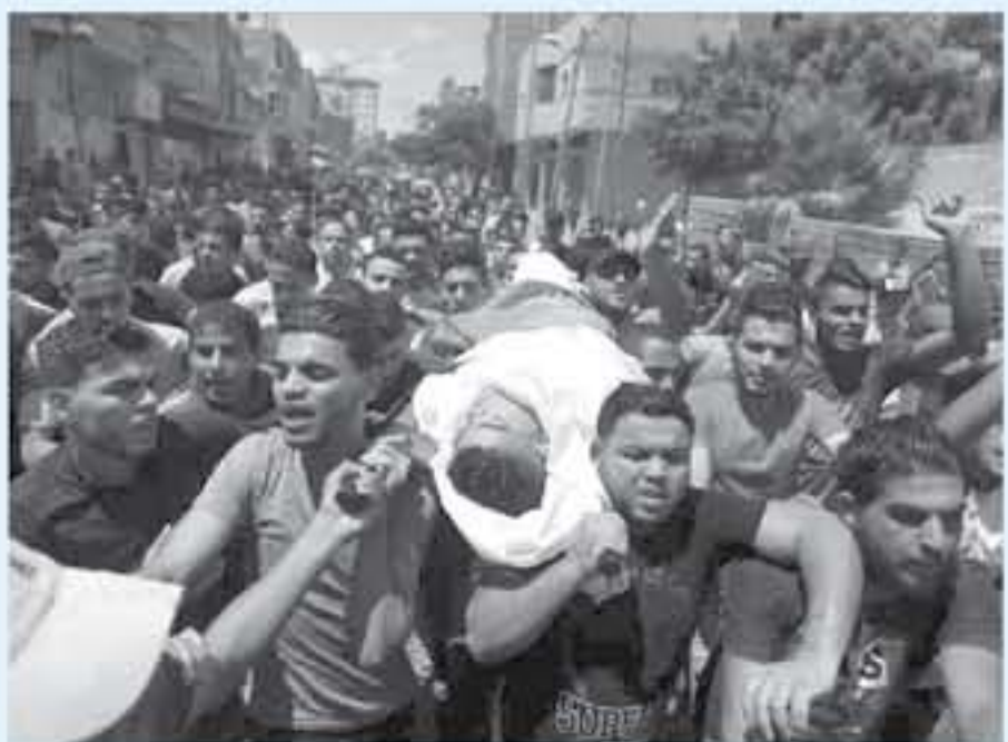
غزة - صفا

قوات الاحتلال شرقي القطاع منذ انطلاق مسيرات العودة في 30 مارس الماضي فيما أصيب نحو 16 ألفاً بينهم 344 في حالة خطيرة، وفق وزارة الصحة.