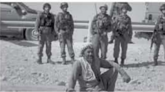
نابلس - معا

لأغراض عسكرية مستعجلة، كما جاء في نص القرار. وأضافت بشارات أن 38 عائلة فلسطينية تمتلك هذه الأراضي وأن ما يقارب 300 مواطن يقطنون على هذه الأراضي أصبحوا في المراء. وحدت بشارات من حلوقرة مطالبية الاحتلال للمواطنين بالتوجه لا تسير بالإدارة المدنية الإسرائيلية والحصول على ترميمات جراء مصادرة تلك الأراضي.