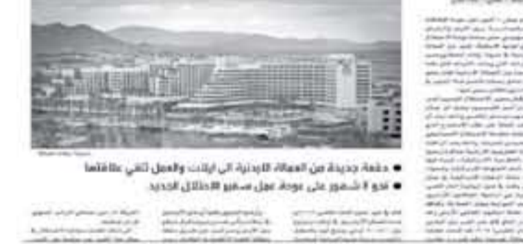
خبر العمالة الاردنية في عدد الأنباط 2018-07-27