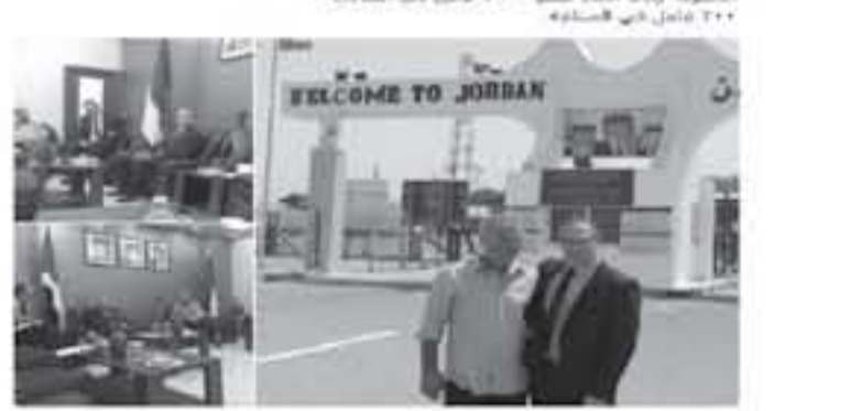
التفريدة التي نشرها المحلل الاسرائيلي عبر تويتر

تمتوز 2018 في الساعة 10:00 صباحاً بعد لقاء مع مسؤولين ساحة الحدودية بالجنوب بوزارة الخارجية والقرار من الرئيس لبحث مسئلة العقبة، غير الدخان من ايلات