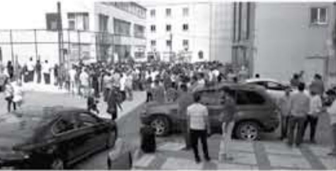
الأنباط - العقبة - طلال الكباريتي

وسائل الراحة في المدرسة المخصصة لتأدية امتحاناتهم والمتمثلة بعدم توفير أجهزة تكييف أو حتى مراوح أو مقاعد كافية في قاعاتها في هذا الجو الكئيب، بالإضافة إلى الاكتظاظ الطلابي في كل فاعة، مما أدى إلى الفوضى. وأشار إلى أن كثيرا من الطلاب المتقدمين طلبوا تفتيحين على رصيف تلك المدرسة، على أمل السماح لهم بتأدية امتحاناتهم ، لافتاً أن أحد الطلاب المتقدمين أصيب بغيوبة لوفوه تحت أشعة الشمس الحارقة لساعات ونقل على إثرها إلى المستشفى. وتابع المتضرر زيتون أن اللجنة التربوية المشرفة على تلك الامتحانات استعانت خلالها بالشرطة التركية لتنظيم دخول الطلاب الأردنيين، مؤكداً أن العدد الهائل من الطلاب لا يسمح بتأدية امتحاناتهم في هذه المدرسة.