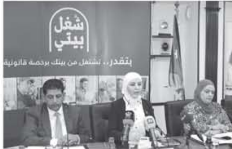
تتقدّر... بنسفل من بيتك برخصة قانونية

العمل من المنزل بهدف السماح لكثير عدد من الأفراد بالبداة بأعمالهم ومشاريعهم بأقل الكلف وأبسط الإجراءات الممكنة، حيث تم تطوير وتعديل المنظومة التشريعية والمؤسسية التي تنظم قطاع موضوع "ترخيص العمل من المنزل" لتشمل مهن أكثر وبكافة محافظات المملكة. ووفقاً للبيانات الصادرة عن وزارة الصناعة والتجارة والترويج فإن التعليمات الجديدة الخاصة بترخيص مزاوله الأعمال من المنزل كان لها أثر مباشر على عدد الاعمال المسجلة في المنزل منذ صدور التعليمات للمرة في آب ٢٠١٧، حيث تم تسجيل أكثر من ٣٠٠ عمل منزلي في جميع محافظات المملكة، وحققت عاصمة عمان ومحافظتي إربد والفرق أعلى نسب التسجيل مقارنة بالمحافظات الأخرى. ونظراً إلى أن التعليمات تهدف إلى زيادة المشاركة الاقتصادية للمرأة (حيث يعتبر معدل المشاركة الاقتصادية للمرأة في الأردن من أدنى المعدلات في المنطقة)، فمن الجدير بالذكر أن أكثر من ٤٨٠ من الاعمال المزاوله من المنزل التي قامت بالتسجيل خلال العام الماضي محفولة من قبل سيدات. لذلك تمثل التعليمات الجديدة فرصة ميمدة لزيادة معدل المشاركة الاقتصادية للمرأة في الأردن.