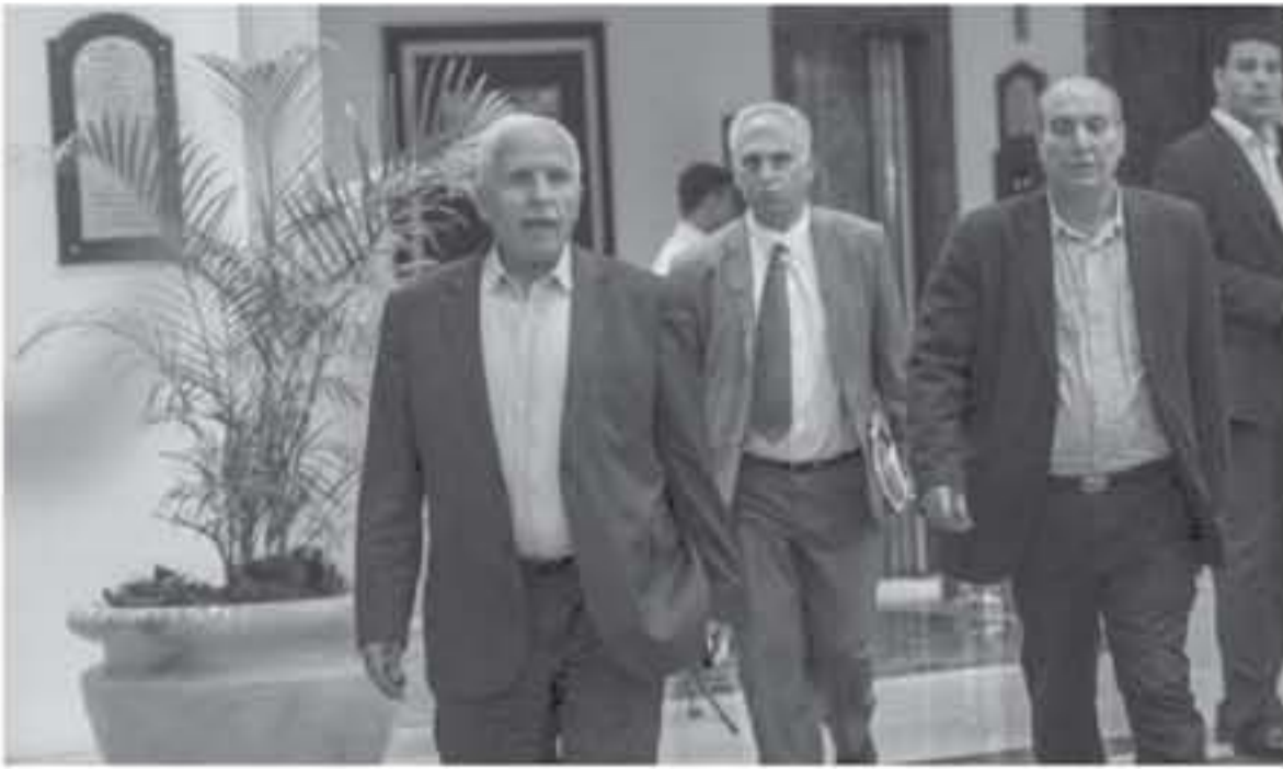
أسرانا الأبطال رئيس أي تمن اساني مهما كان نوعه وحجمه، مشددة على أن "الواجب في العمل على تحريرهم"