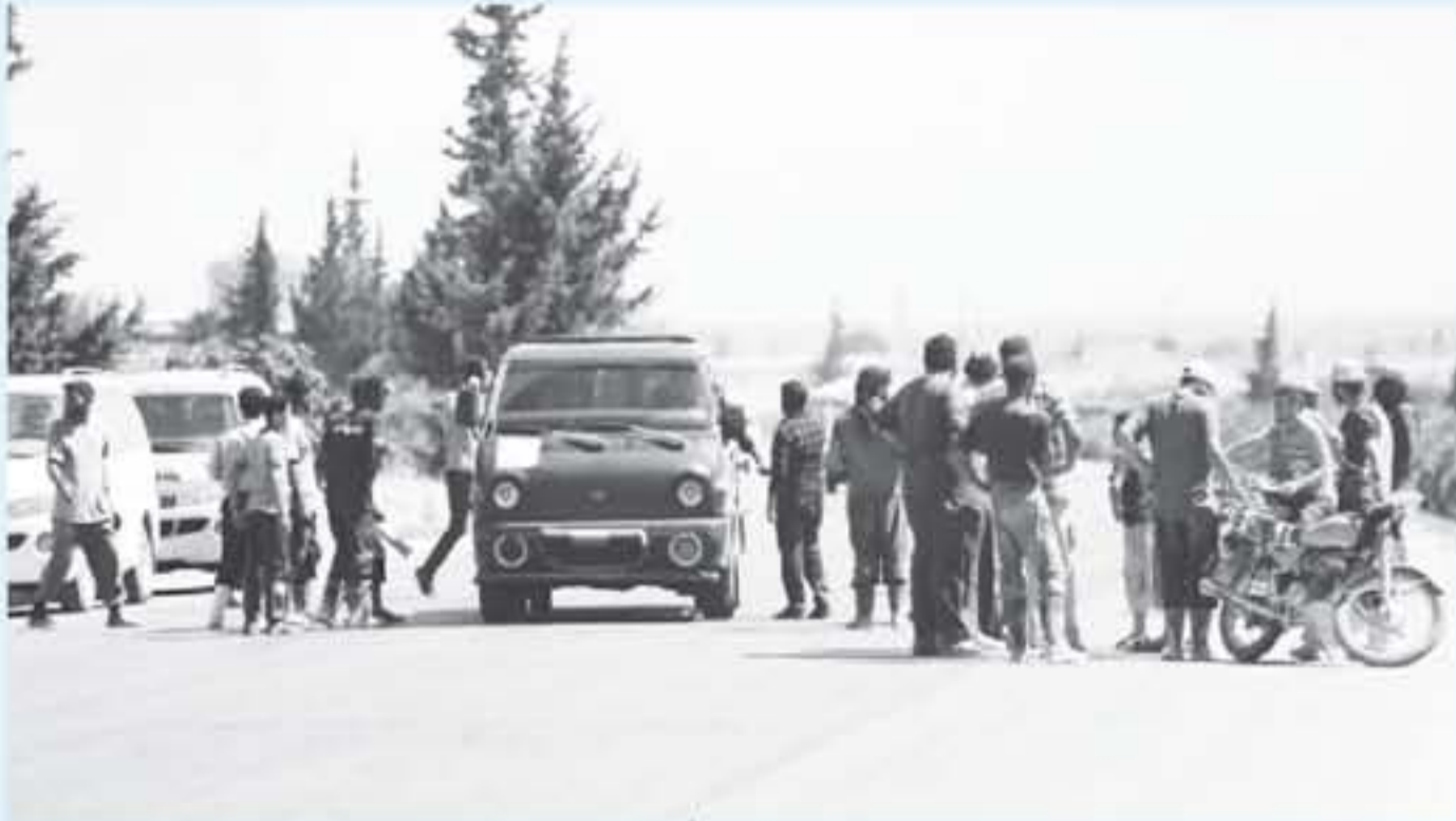
تجمع الثامن من تموز/يوليو 2011 لأصحاب قطع الحجرة قرب معبر مورق بين ادب وحمات في سوريا احتجاجاً على زيادة الرسوم التي تفرضها هيئة تحرير الشام على لجان الحجاز من الدار إلى مناطق النظام السوري