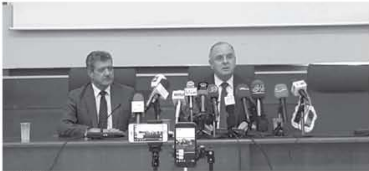
جانب من المؤتمر

أطلق وزير العمل سميح سعيد مراد يوم أمس الأربعاء المنصة الإلكترونية الأردنية القطرية للتوظيف في مبنى المؤسسة العامة للتأمينات الاجتماعية وبحضور الأمين العام لوزارة الهندسة هاني خليفة (رئيس اللجنة الفنية التنفيذية من الجانب الأردني) للتمتع كل ما يتعلق بشؤون المنحة وتذليل الصعوبات امام تنفيذها وجمع من وسائل الاعلام.