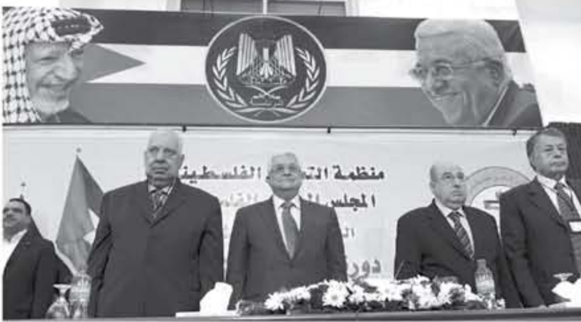
أوضح أن هناك ضبابية في الرؤية لدى مؤسسات منظمة التحرير في التعامل مع قرارات المجلس المركزي والوطنية، خاصة في ظل المواقف المتناقضة لدى قيادات المنظمة تجاه حركة المقاطعة.