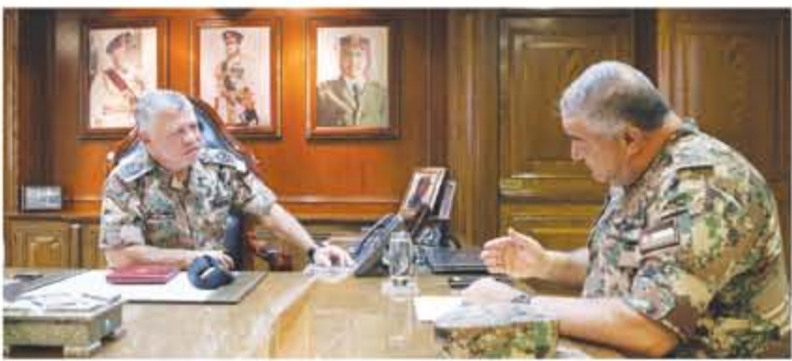
القائد الأعلى يتابع آخر التطورات على الحدود الشمالية

الأنباط - عمان زار الملك عبدالله الثاني، القائد الأعلى للقوات المسلحة، أمس، القيادة العامة للقوات المسلحة، حيث كان في استقباله جلالته رئيس هيئة الأركان المشتركة الفريق الركن محمود عبدالمعظم فريحات، واجتمع جلالته بالفريق الركن فريحات