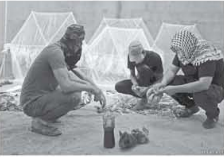
فلسطينيون يصنعون طائرات ورقية حارقة لإطلاقها نحو مستوطنات غلاف غزة.

عنوان صفقة القرن وتصفيّة القضية الفلسطينية... وتحديث وسائل إعلام إسرائيلية وأجنبية مؤخراً عن مساعٍ أممية وعصرية لبلورة حلول من شأنها تخفيف الأزمات الإنسانية الخانقة في القطاع، وتنفيذ مشاريع إنشائية، تشمل تثبيت وقف إطلاق النار بين فصائل المقاومة وإسرائيل.. أو عقد هدنة بين الطرفين.