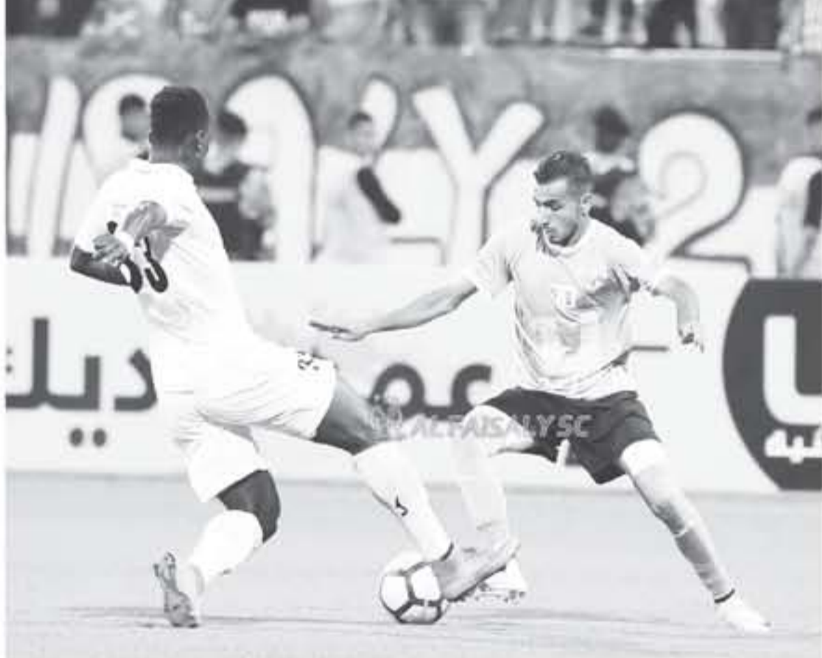
لم يكتب لفريق الفيصلي مواصلة مشواره حتى المباراة النهائية لبطولته الودية التي تقام حالياً بمشاركة اربعة فرق بعد خسارته مساء امس الاول امام فريق المطالبي السعودي بفارق ركلات الترجيح بعد نهاية الوقت الأصلي من زمن اللقاء الذي اقيم على ملعب الأمير محمد في الزرقاء بالتعامل بهدف لكل فريق... غير ان الفريق السعودي نجح بحسم النتيجة لصالحه بالتوقيع الذي اصاب لاعبيه بتسجيل ركلات الترجيح... في الوقت الذي تخلى فيه الحظ عن نجوم الفيصلي الذين هددوا وركلاتهم الحاسمة... ليمنحوا الى فرصة المنافسة على اللقب والوصول الى اللقاء النهائي... ويكفوا باللعب على المركز الثالث بمواجهة فريق الوحدات في اللقاء الذي سيقام مساء غد...