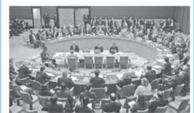
بيت لحم - معا

تم المس به بشكل صارخ في قانون القومية، وتطرق التوجه إلى البند التمييزية والعنصرية في قانون القومية، وذلك عبر شرح المس بمكثلة اللغة العربية والغاء رسميتها، إضافة إلى تسريع الأليات بإيد السكن عبر إلبند الذي يُسجح الاستيطان اليهودي في البلاد، والنظر إليه كقضية وطنية إسرائيلية، الأمر الذي من شأنه المس بجمعا المساواة ومنح القومية لليهود على حساب أهل البلاد الأصليين، وخلق حالة من التهمية والتصنيف في المواطنة.