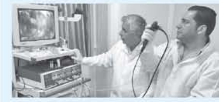
غزة - دنيا الوطن

المرعة. وعن مستقبه، قال، إنه سيكمل في هوانته لاخر يوم، لأنه يعلم، خلال غنسه الحقيقية للفرقاء والوجه الآخر للجمال الفلسطيني والمطلوبة، مؤكداً أن هوانته لا تتعارض إطلاقاً مع عمله كطبيب، ويستمتع بكل فوائد التنشيط ما بين هوانته وعمله كطبيب، في مستشفى حكومي صباغاً، وبمبادرة الخاضعة عبادة، والتي يجمع بينهما جميعاً هي الإنسانية على حد قوله.