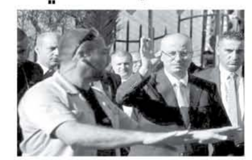
الأنباط - دنيا الوطن

على القطاع وأن الإجراءات التي تستهدف ٣٥ ألف موظف في غزة إجراءات مؤقتة، وأن جميع حقوقهم محفوظة. إن ذلكه أكدت حركة «حماس» أن تصريحات زامي الحمد لله حول إجراءات حكومته التي تستهدف ٣٥ ألف موظف في غزة هي إجراءات مؤقتة، وأكد رسمي على تورطه في حصار غزة وأهلها.